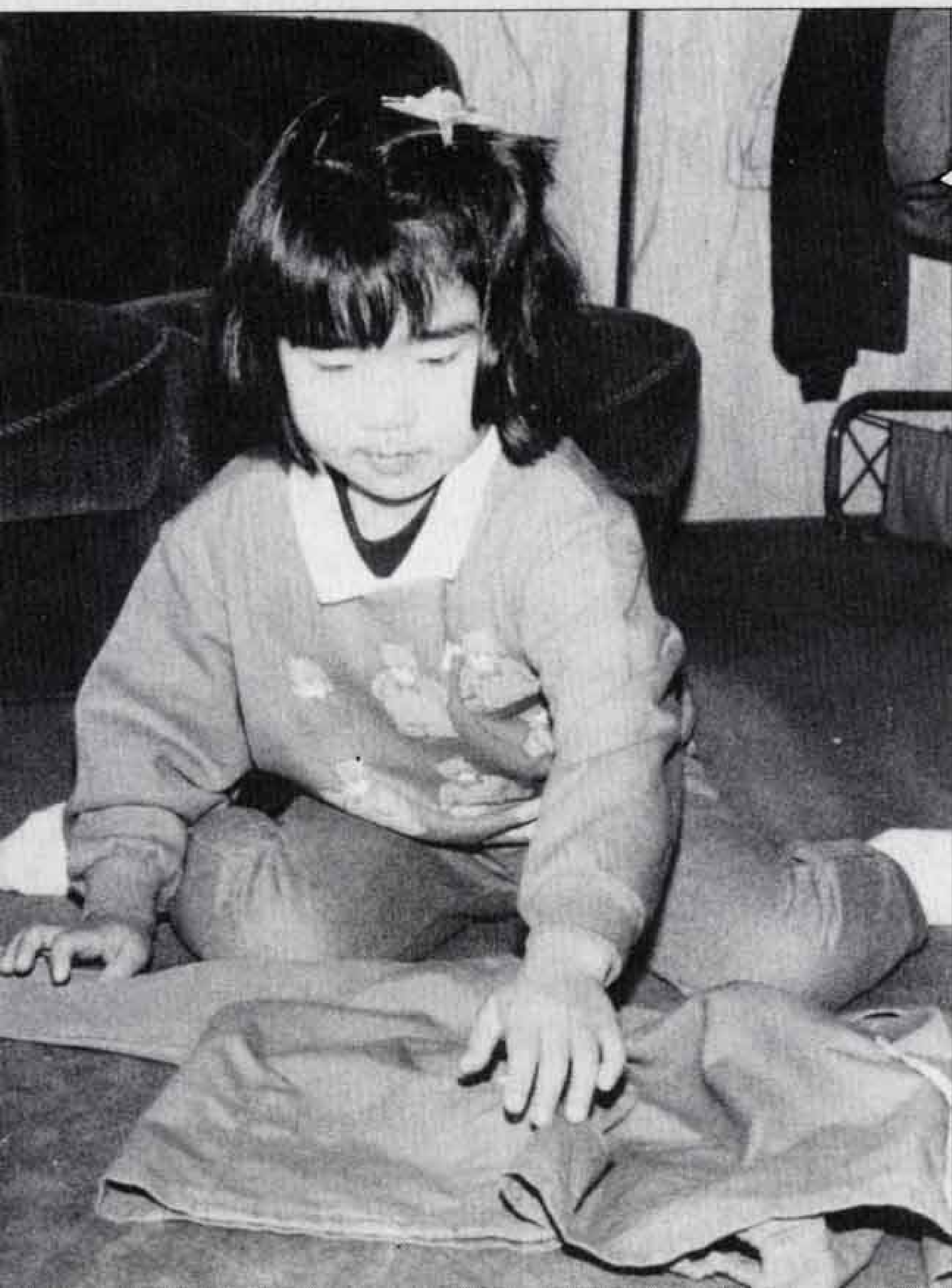
自分のことは自分でします