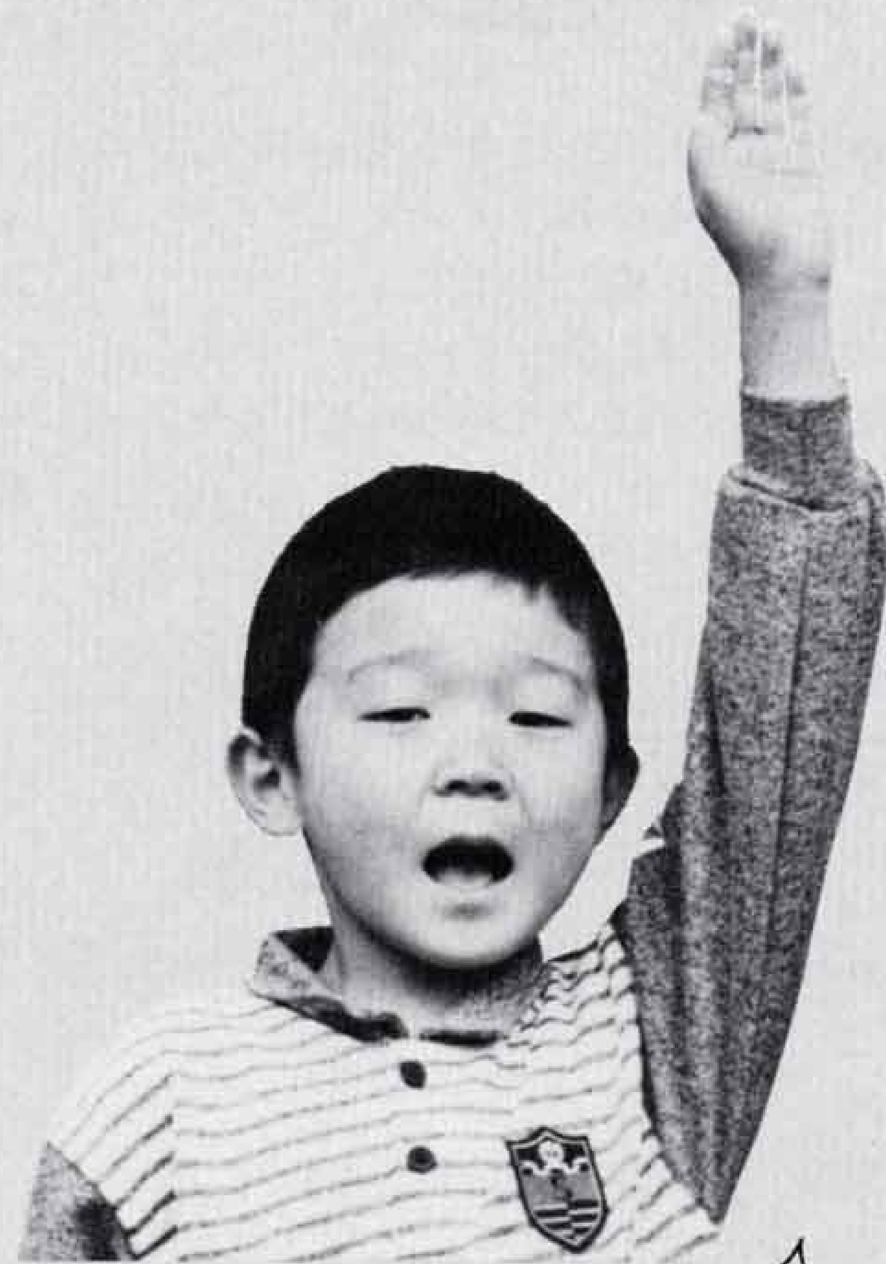
大きな声で返事ができます