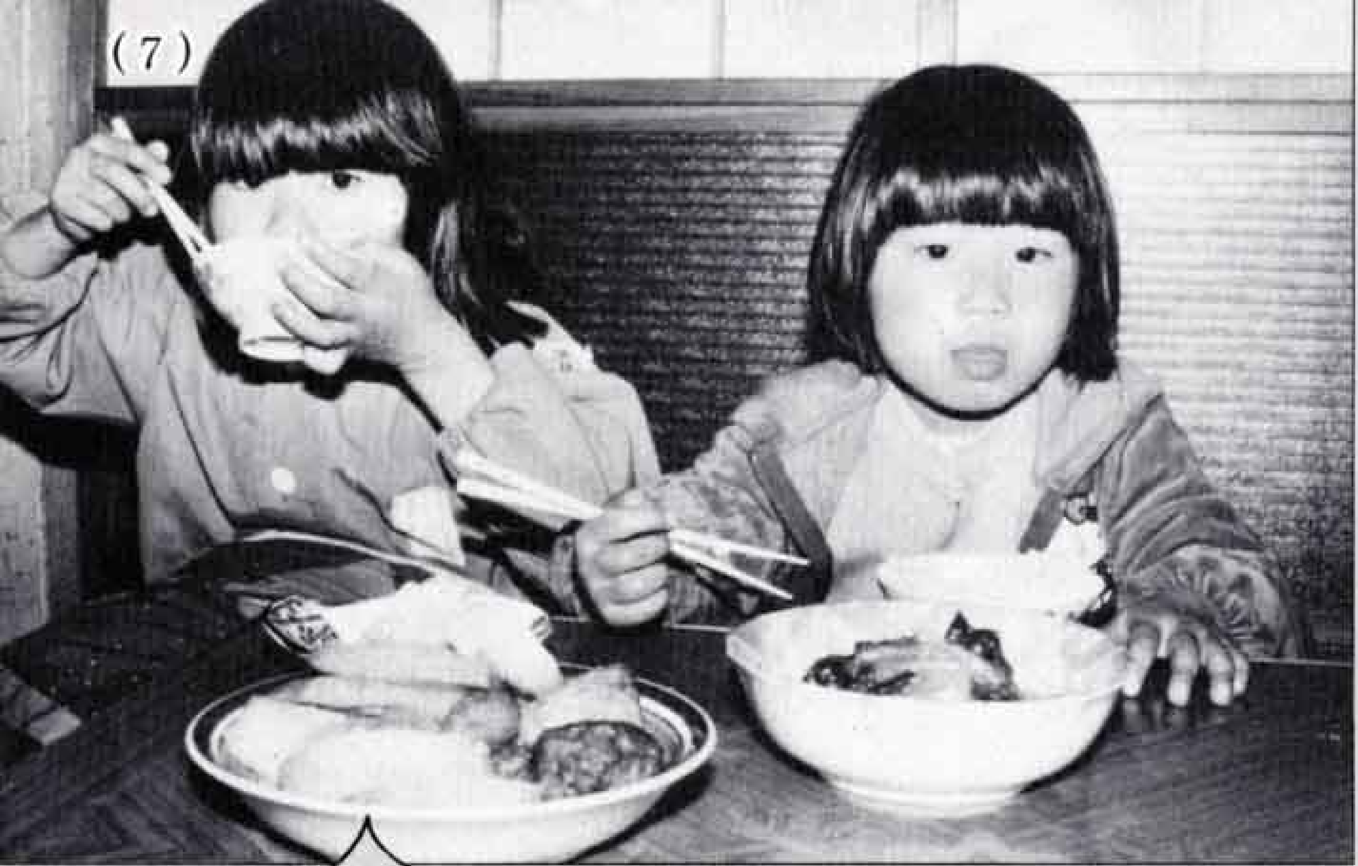
好き嫌いなく何でも食べるよ