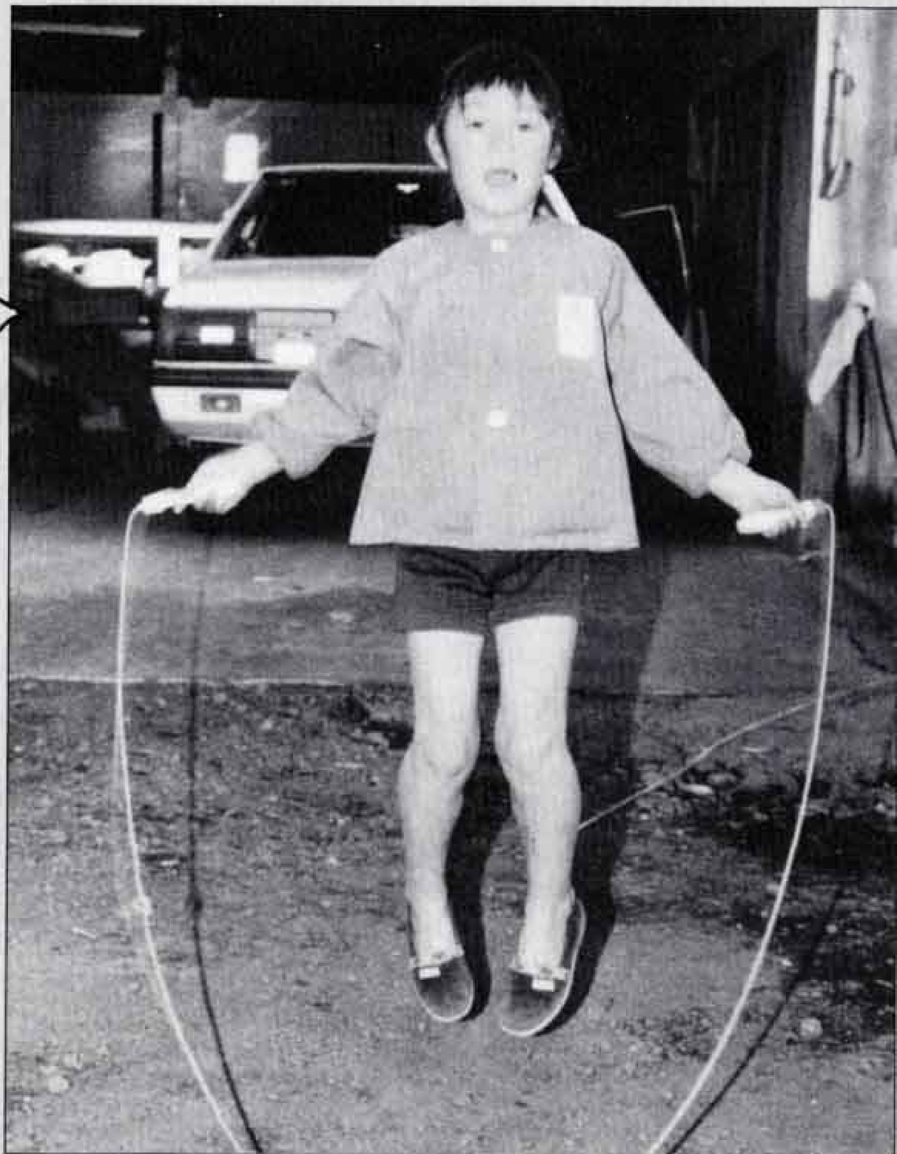
私、なわとび大好きなの…