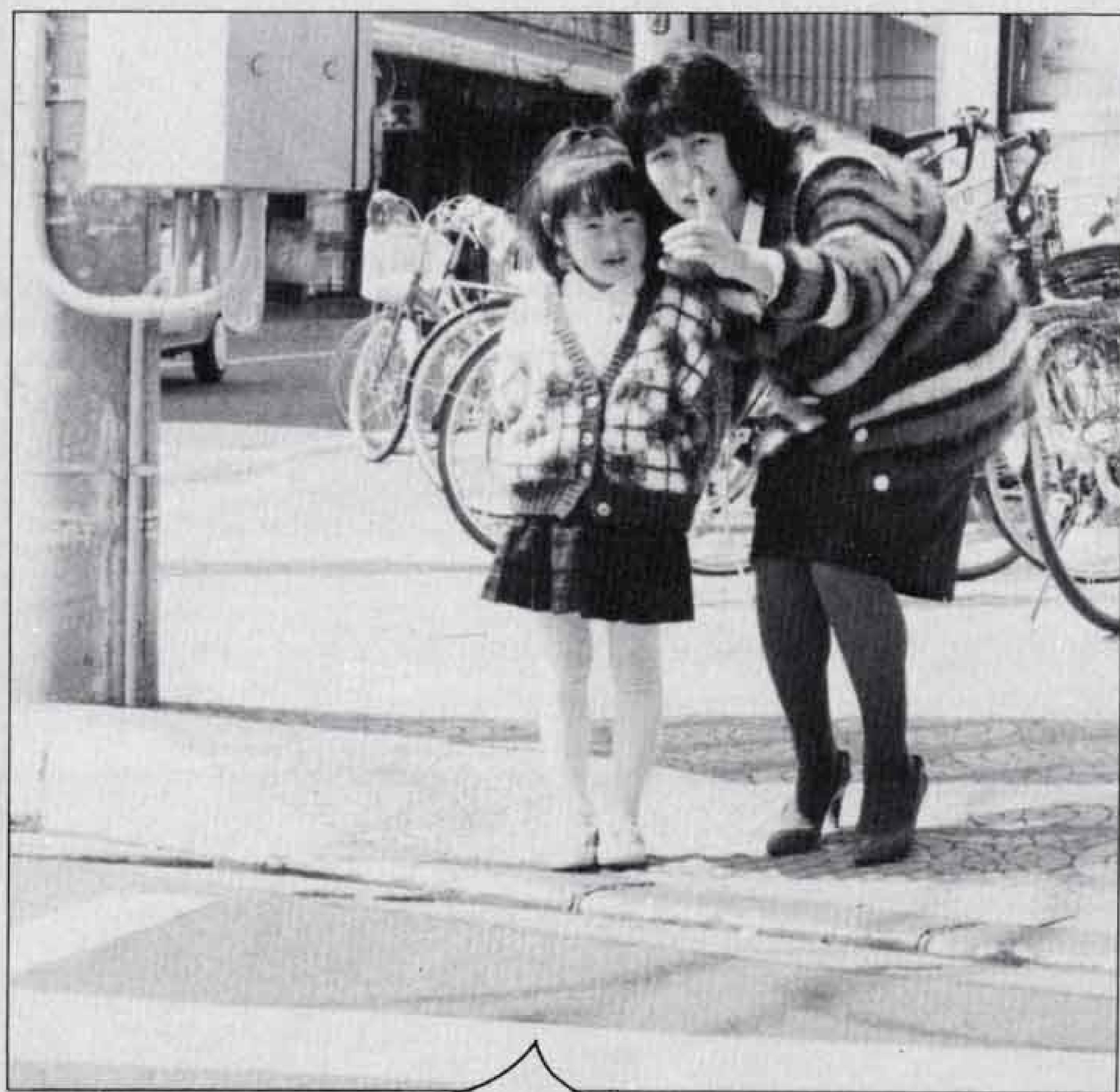
信号をよく見て交通事故には気をつけてね