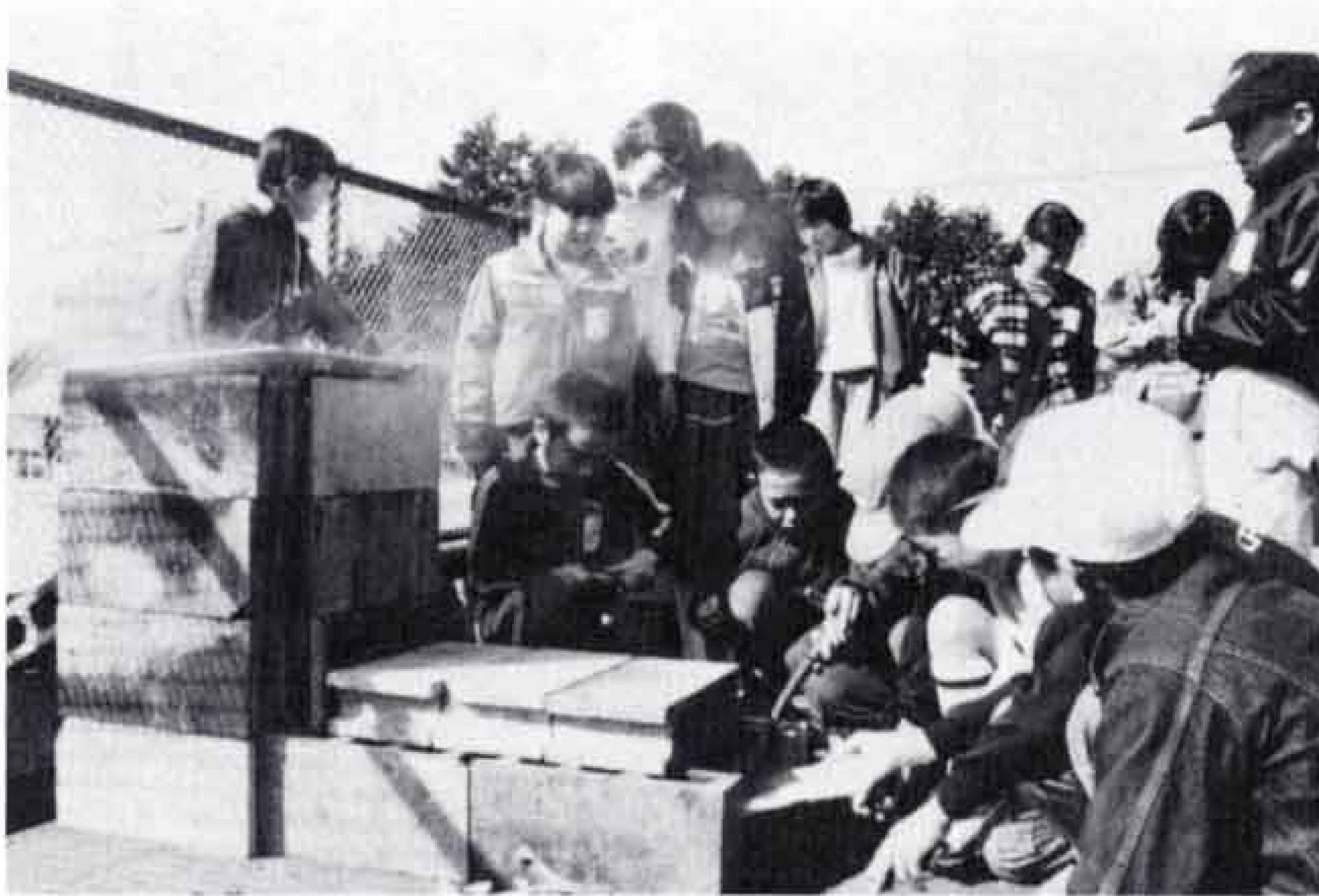
△桜の木などを燃やしていぶす。決して燃やしすぎてはいけません。