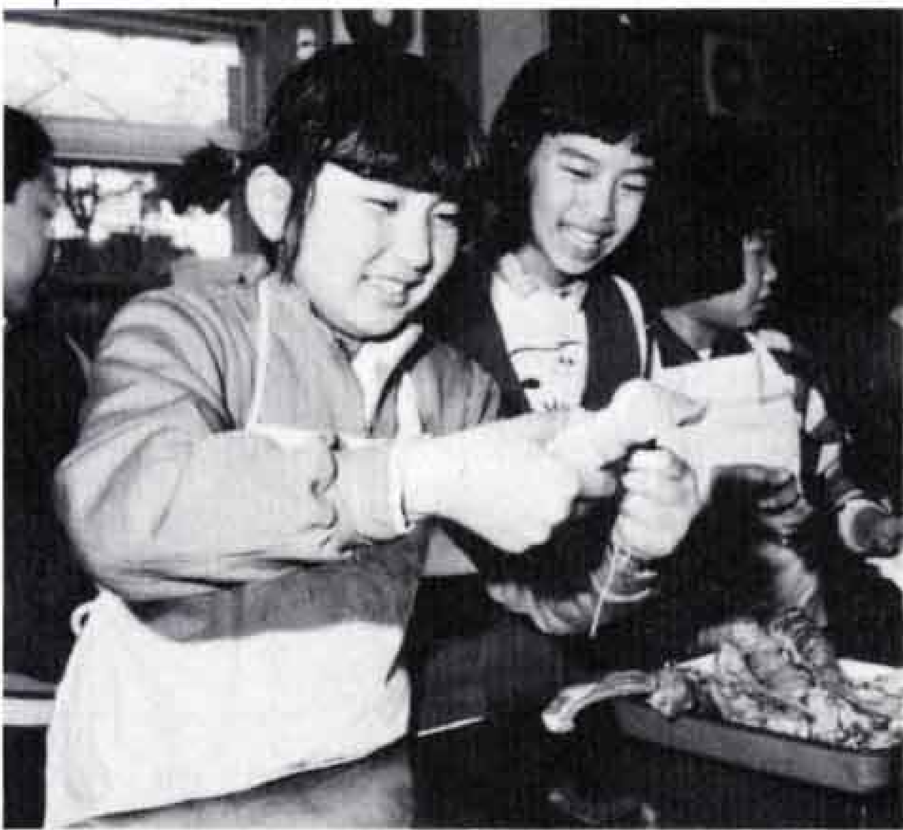
△肉をひもでしばり、塩・こしょうで味つけ。