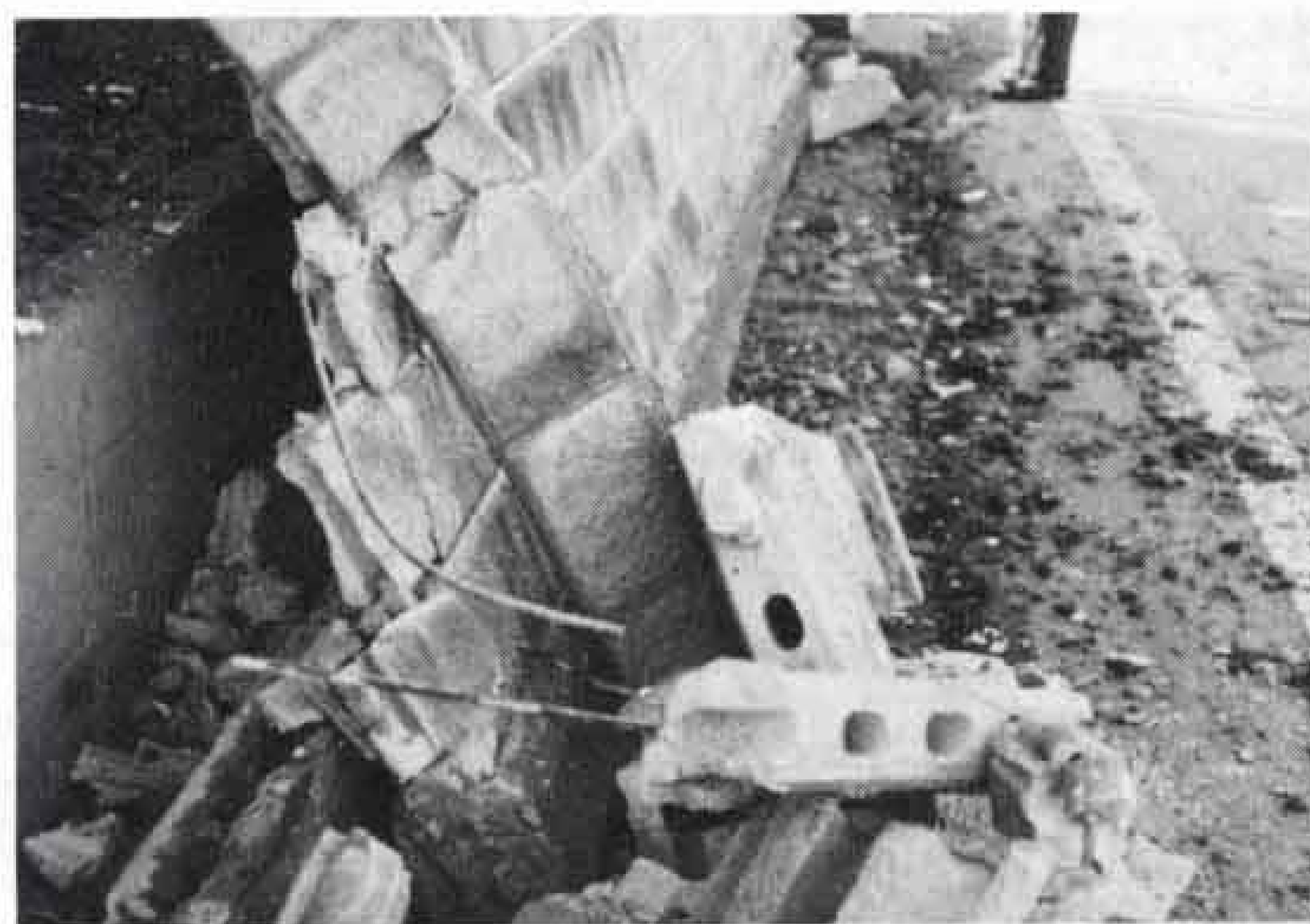
千葉県東方沖地震で倒壊したブロック塀

昨年12月17日、千葉県東方沖地震(震度5相当)で、またもブロック塀等の倒壊により死傷者を出すという痛ましい事故が発生しました。東海地震はこれよりはるかに大規模だといわれ、今日、明日にも我々の身近でブロック塀等による大事故が起こる可能性が十分あるのです。