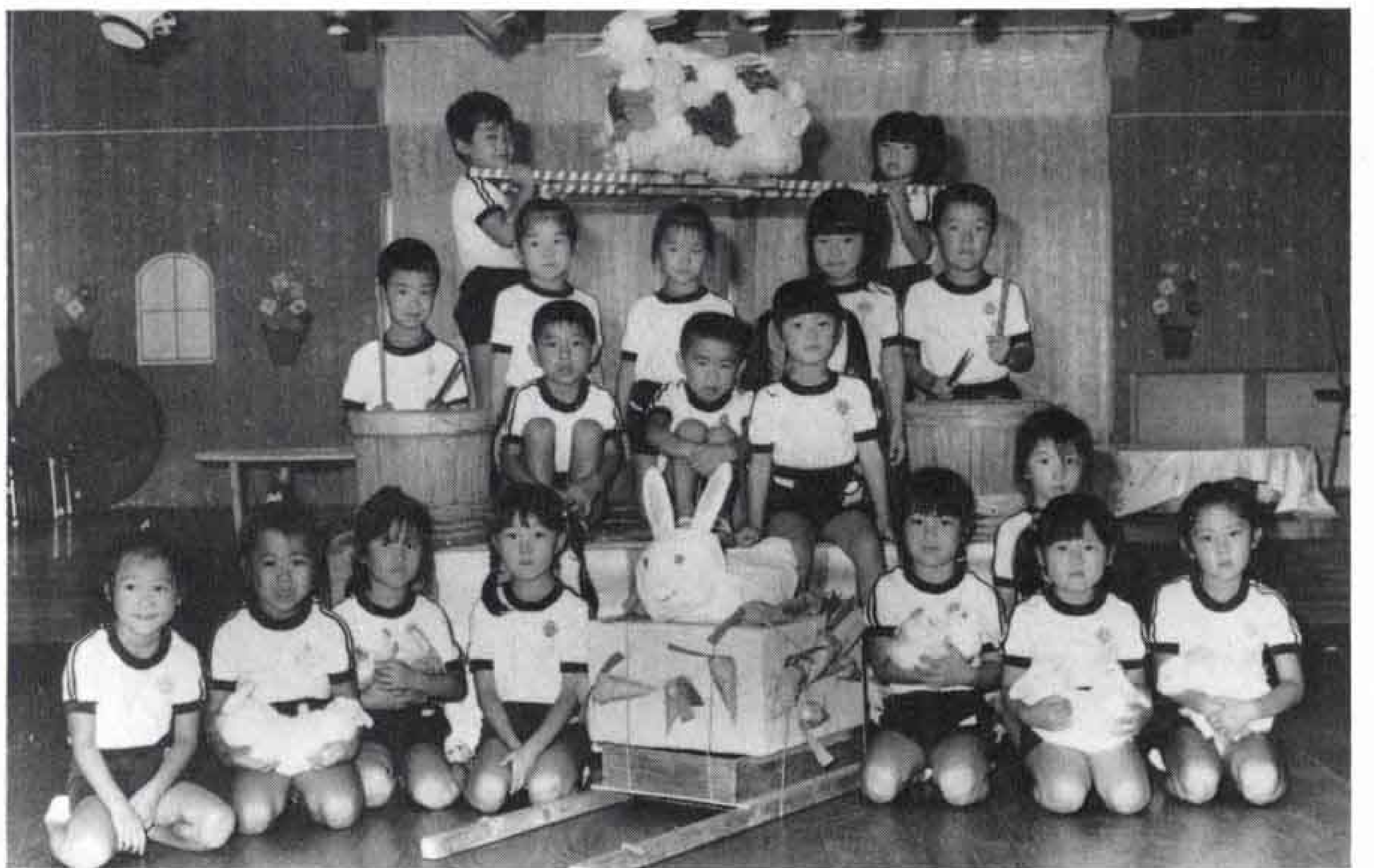
「いつもワッショイ、ワッショイっておみこしで遊ぶんだうさぎさんもいっしょにピョンピョンはねるよ」

西保育園年長組のお友達です。保育園ではうさぎやひよここと遊んでいます。大好きなうさぎとひよこのおみこしを作りました。たるのたいこも楽しいよ。