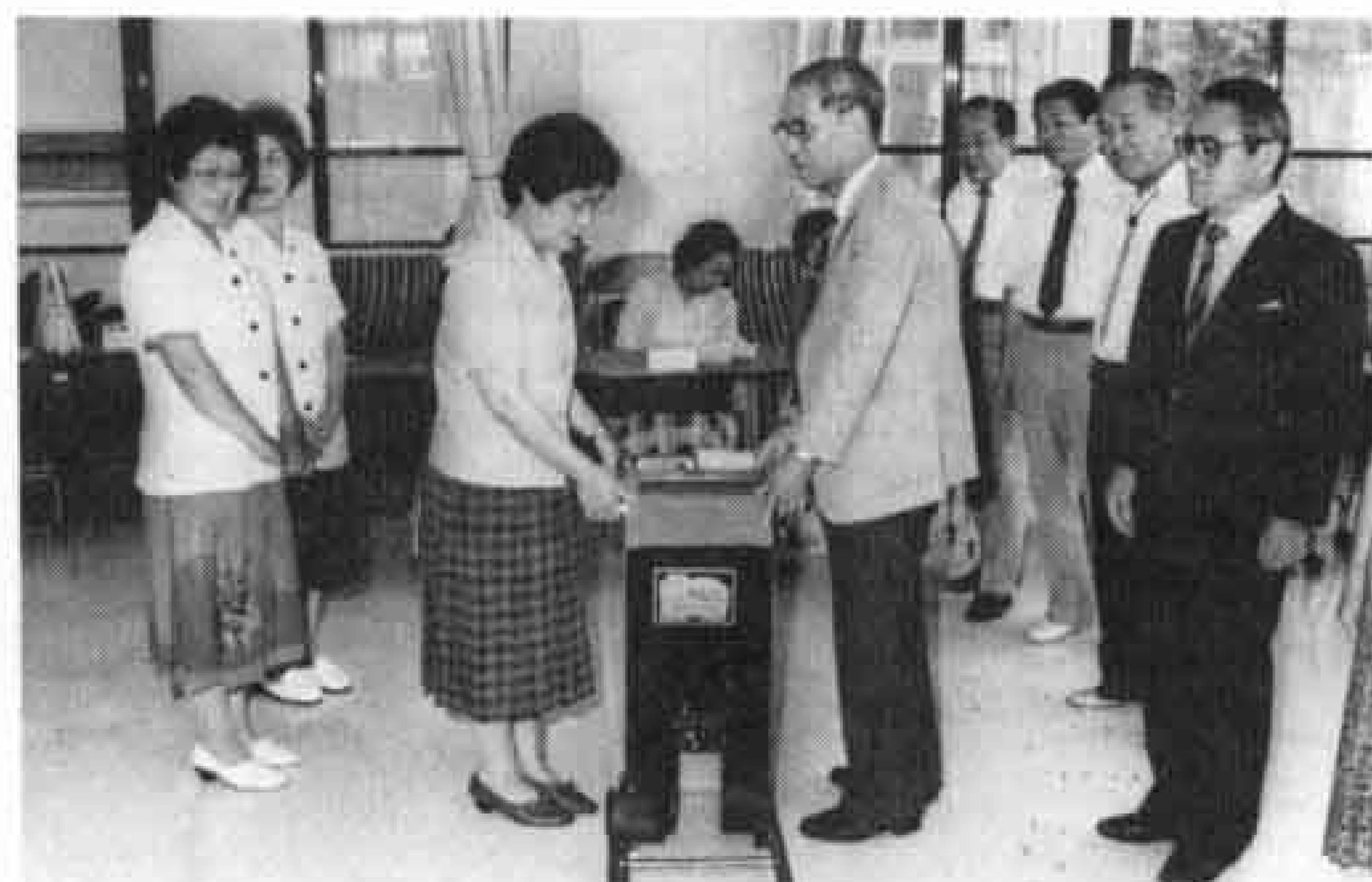
△「きれいな環境を」と富士駅北婦人会に貸与された空き缶プレス機

山とのかかわりを深めるために、市役所の電話番号を3776（富士山の高さ）番にするとか、市民憲章のシンボルマークをつくったかどうかと思いますが。 参加者 「例えば声かけ運動のようにならば一つの小さな活動がやがて大きな輪になって広がっていく、こんな地道な活動が必要だと思えます。」「公園などの公衆トイレが大変汚い。どこかの団体に委託して清掃してもらってきれいにしておけば自然と汚さなくなると思います。」「市民憲章の五カ条を一緒に前面にだすため漠然としてしまい理解しにくいと思います。一つ一つの条文に目を向けることが必要だと思えます。例えば、大棚の滝には、条文二の「富士山のよう美しく自然を愛しきれいな環境をつくり出します」の条文を掲げるとか市役所前の歩道橋に条文の五を掲げ、交通ルールを守るよう呼びかけるなどのことが必要ではないでしょうか」「学校でも子供たちに唱和をさせていますが、唱和だけでは理解できません。小学校四年生は自転車の乗り方を学ぶ機会があるわけですが、そのときに条文の五を取りだし、交通安全の教育をしようと思えます。」「ごみの収集場所に条文の二を掲示したらどうでしょうか」「町内会単位に赤い羽根の募金がまわってきませんが、このときなども、条文の一の思いやり、助け合いの意識を持たせるなどよいと思えますね。」「市民憲章の心は子供の方がよく守っていますね。本当は、大人が