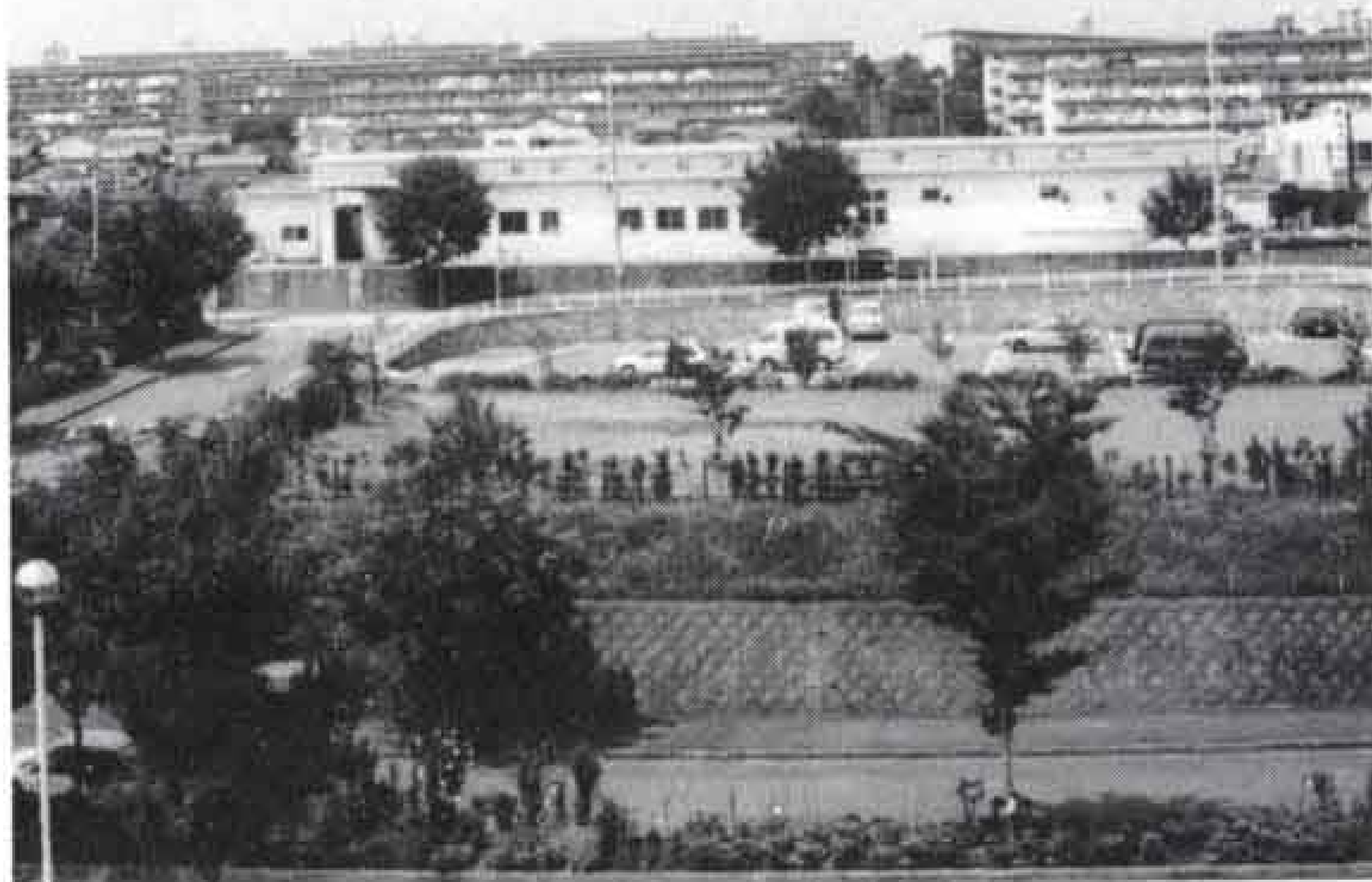
△住環境のよさは富士市一の富士見台