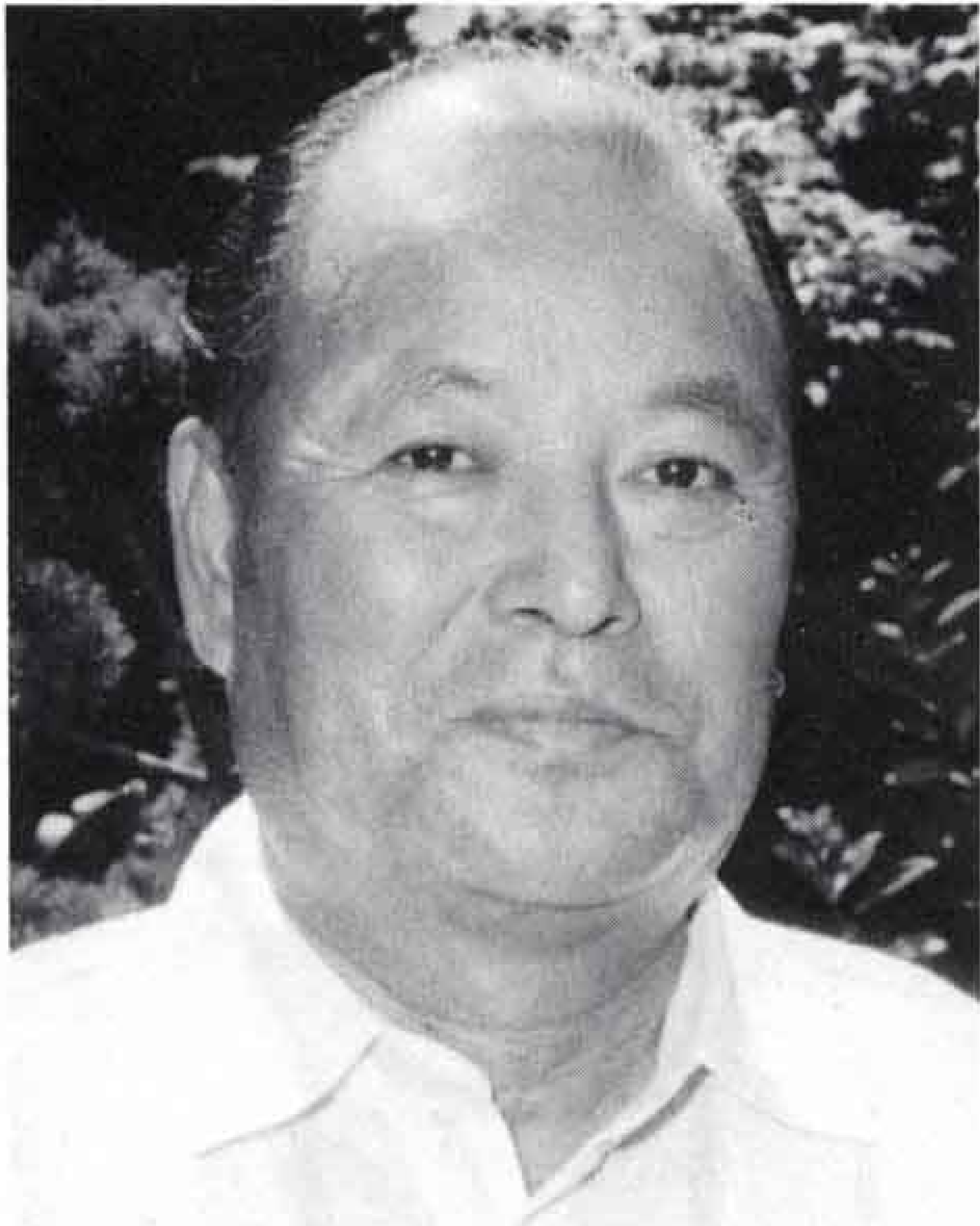
田宿川で行われるたらい乗り競争の実行委員長