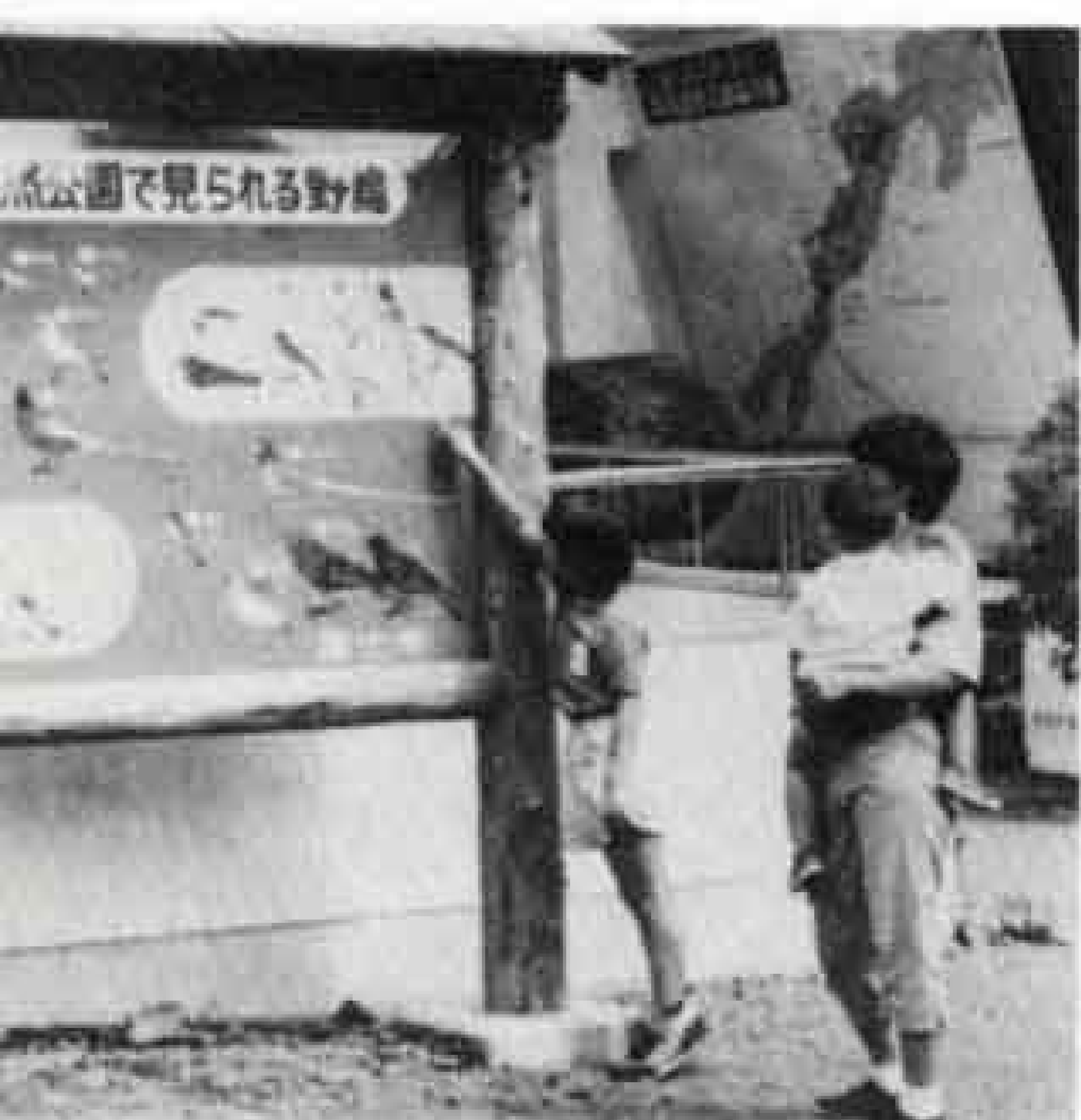
△丸火自然館の入口

・シジュウカラ……ツツビ、ツツビ、ツツビ ・クロツグミ……キキコ、キキコ、キヨイ、キヨイ、キヨイ、キヨコ、キヨコ、ビヨビア