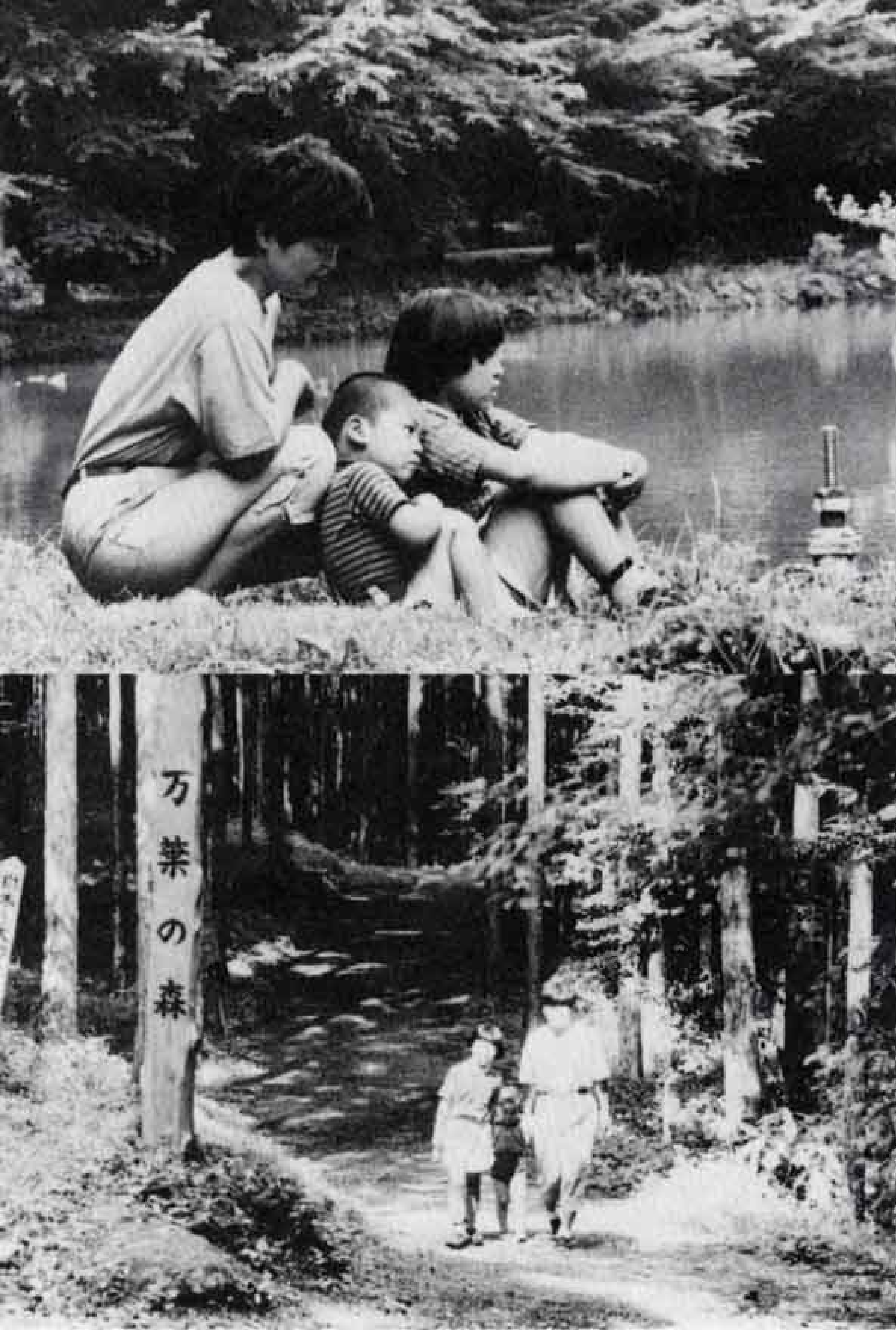
△富士見が池(上)と万葉の森