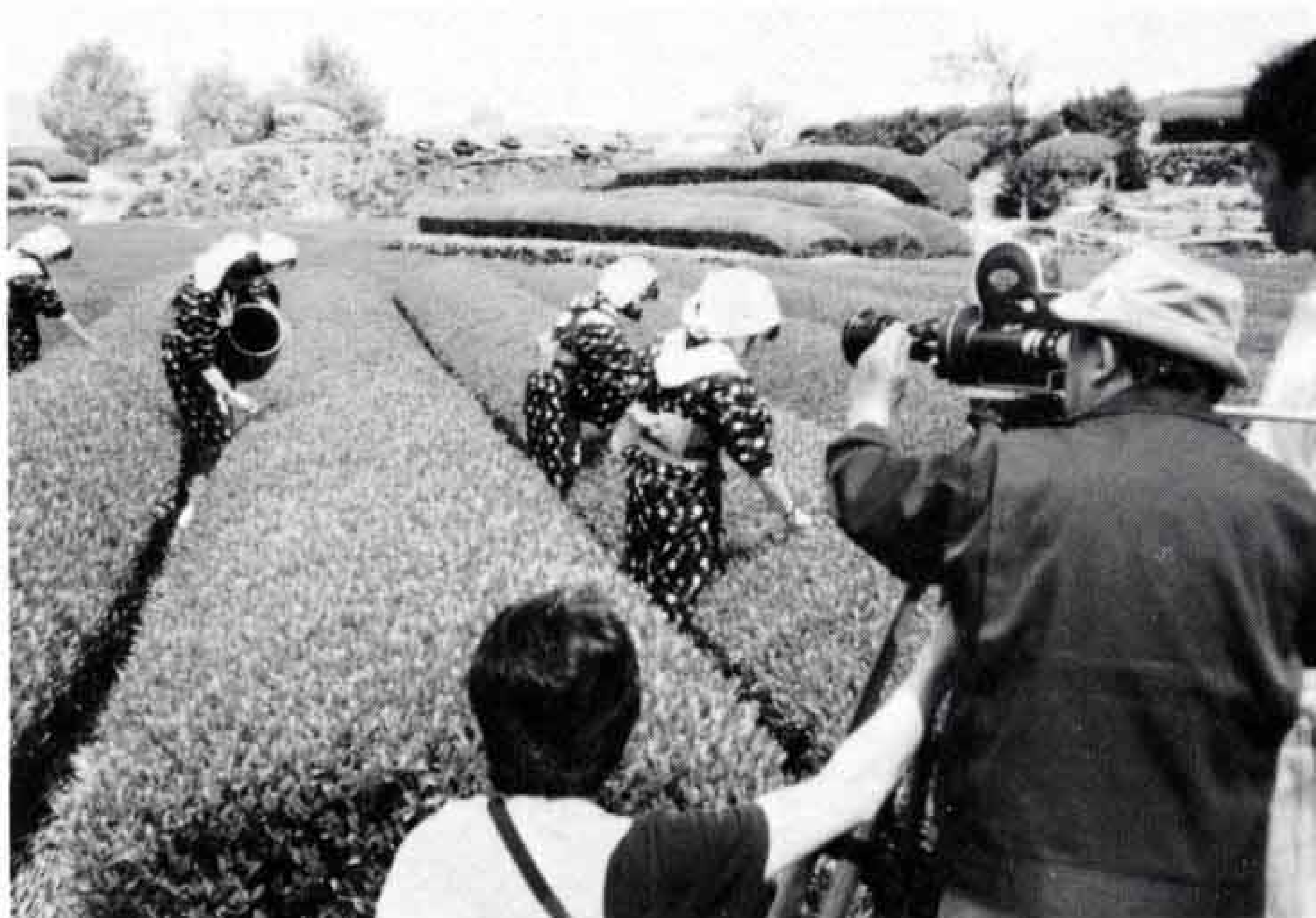
▲茶摘み風景の撮影 (市内大淵)