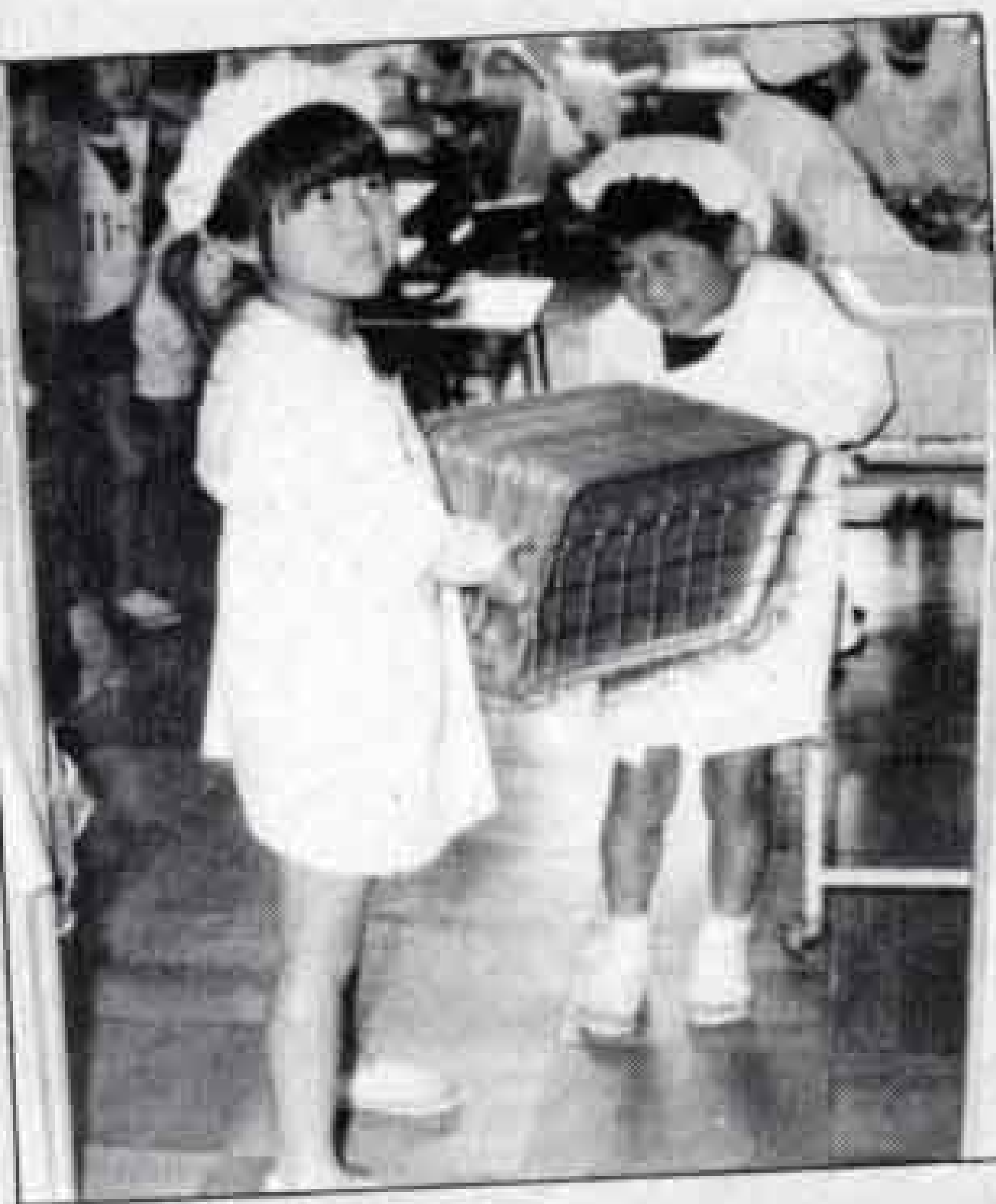
お当番さん重いけどがんばって