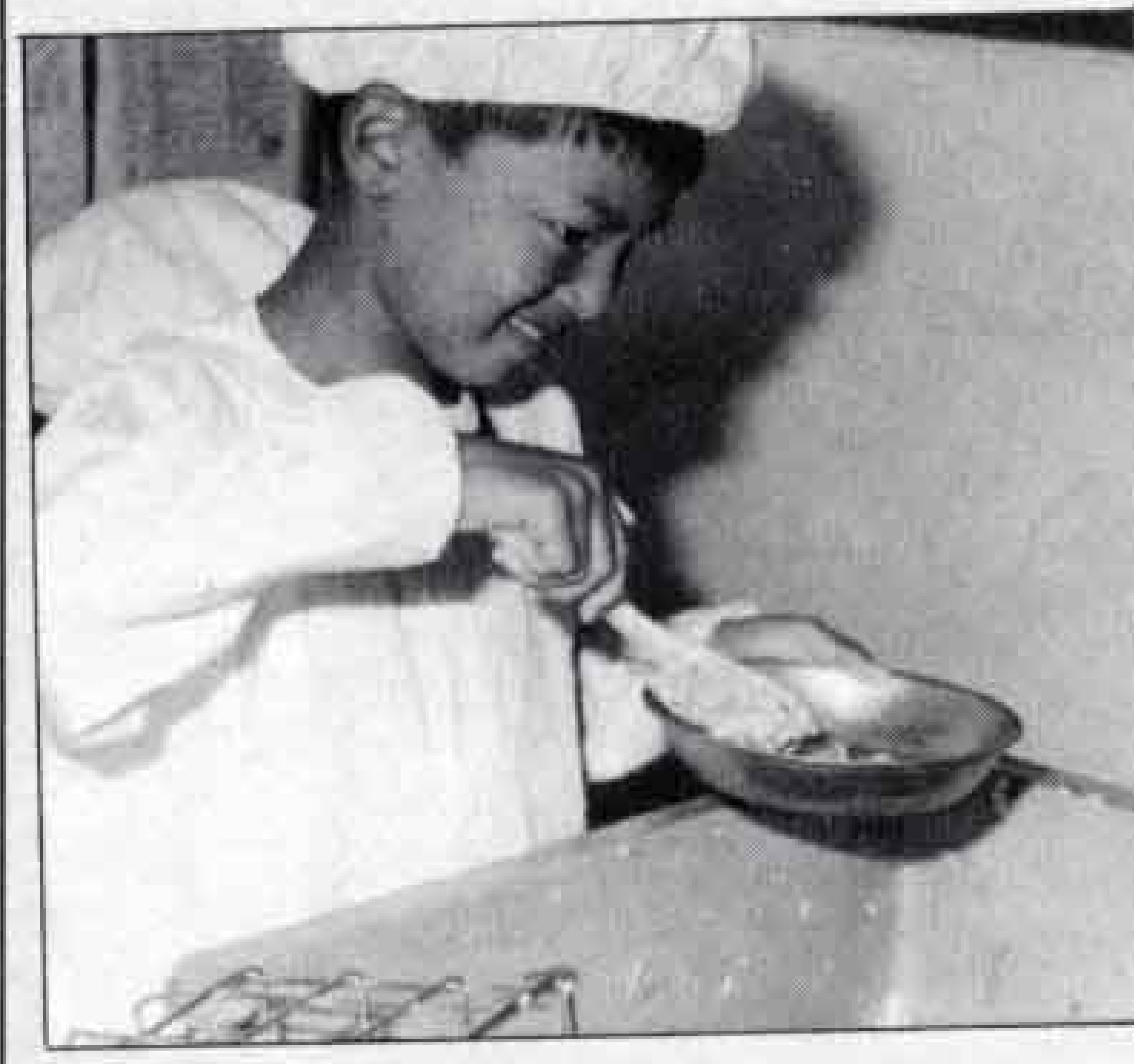
おかわりは自分でします