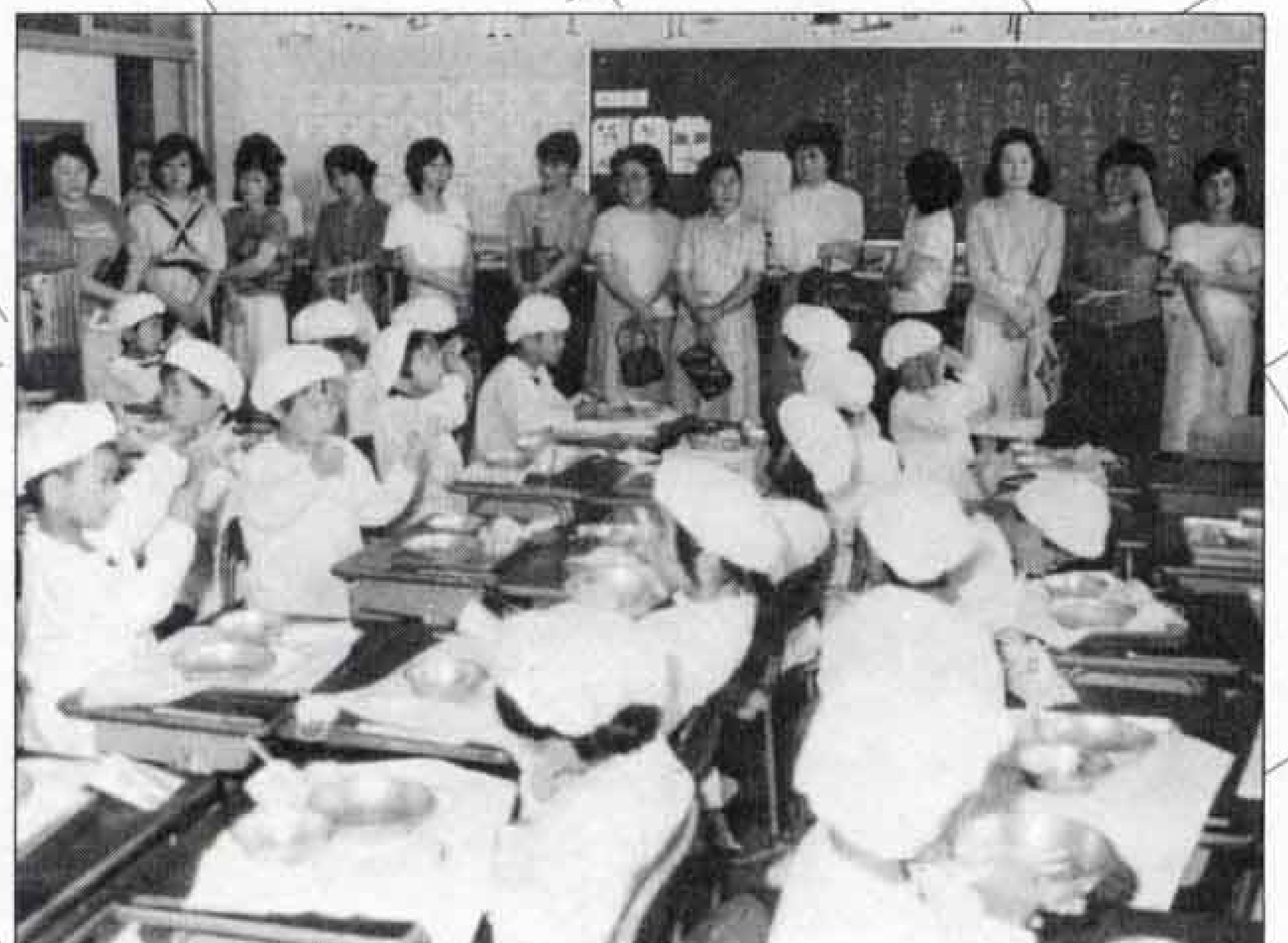
△うちの子はしっかり食べているかしら？

みんな、しっかりと座って、お行儀がよいのには感心しました。家では、食べるのに時間がかかりますが、学校では時間が決まっているので時間内にきちつと食べていますね。 また、家では食べない嫌いなものでも、みんなと一緒に食べるせいか、残さずに食べているようです。