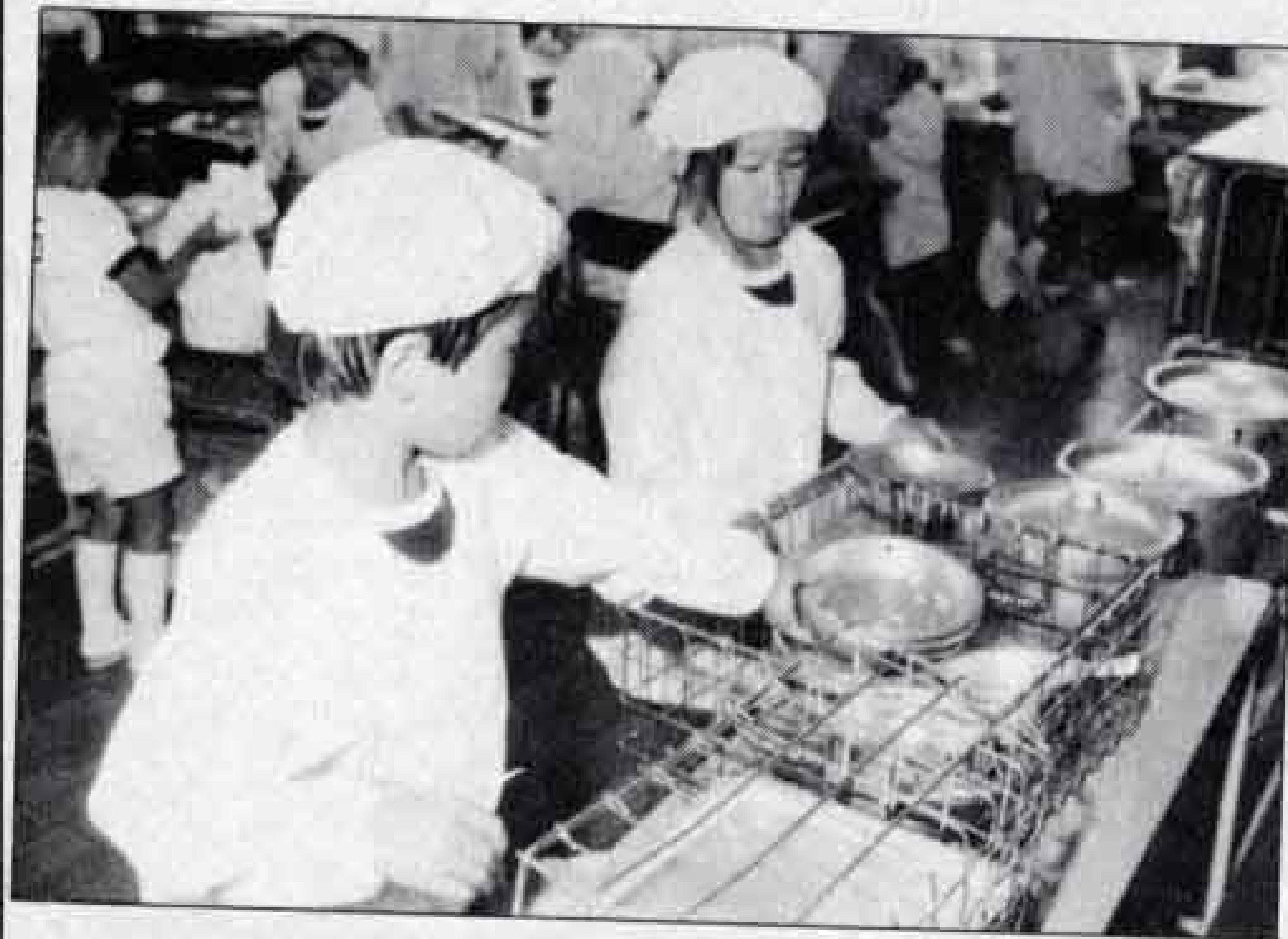
食べたあとはきちんと片づけます