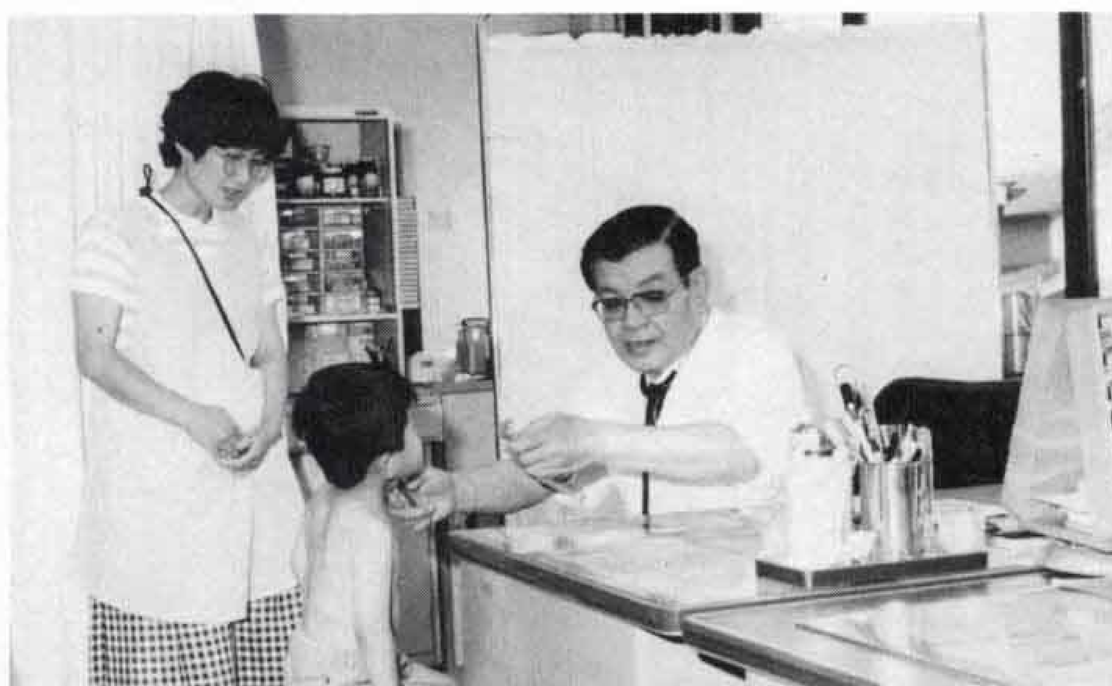
△救急患者の診療(現在の医療センター)