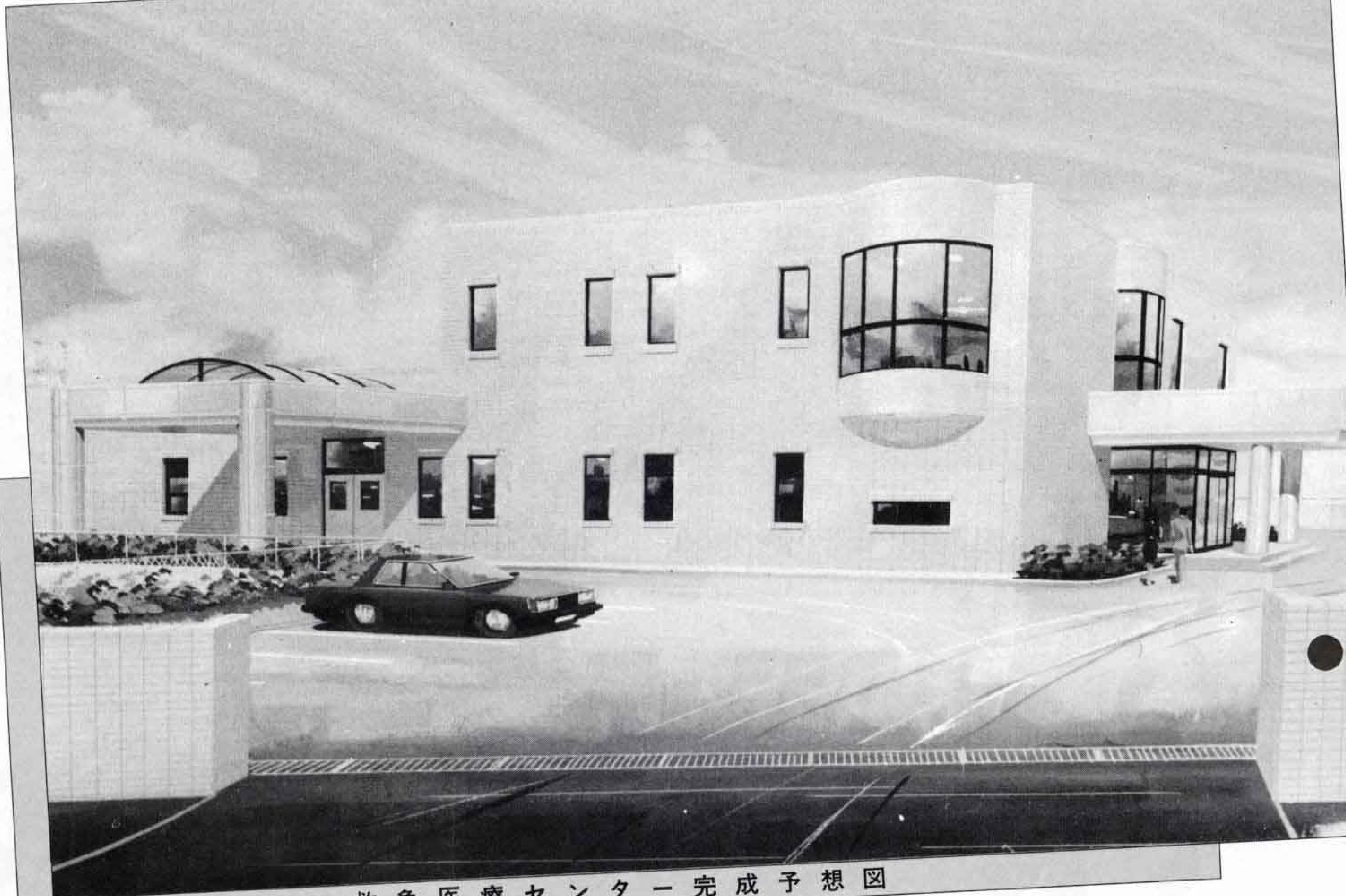
救急医療センター完成予想図