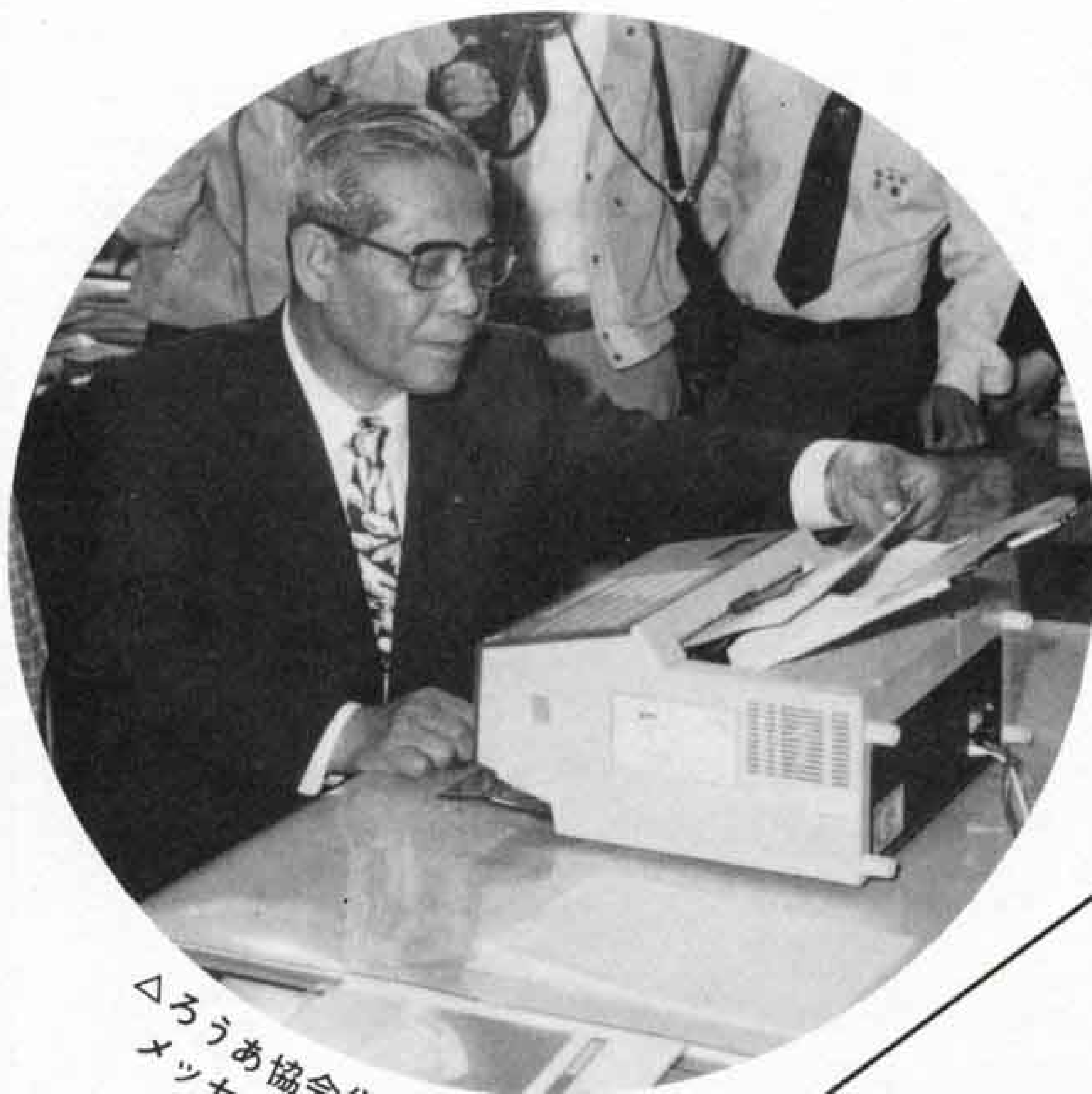
△ろうあ協会代表とファクスのメッセージを交換する市長

市は、福祉事業の一つとして、五月十五日、ろうあ者世帯にミニファクスを設置しました。これは、市ろうあ協会が要望していたもので、ミニファクスのリース機を希望する各家庭に置き、親局(市役所)との間で災害時などの連絡に利用します。