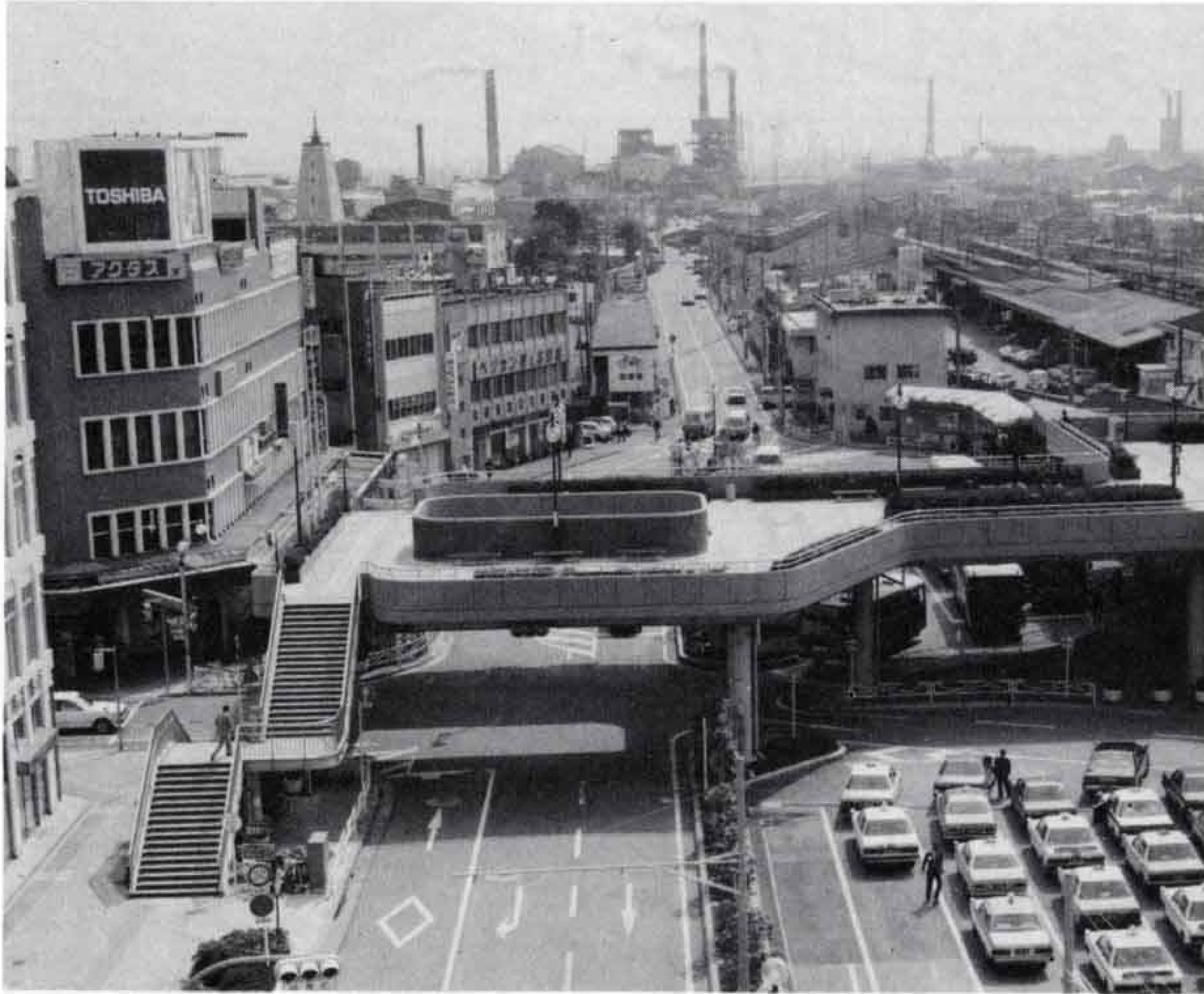
△事業所が立ち並ぶ富士駅前

昭和六十一年事業所統計調査の結果速報がまとまりました。本市の昭和六十一年七月一日現在の事業所総数は、一万千六百二十八事業所で、従業者数は、十一万四千九百九十四人です。