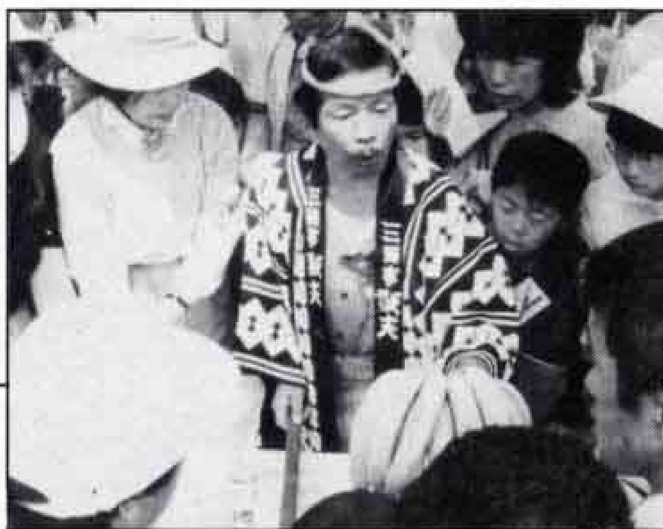
▽懐かしいバナナのたたき売り

五月十日(日)広見公園ふるさと村を会場に「第三回ふるさと村春まつり」が開かれました。会場では、太鼓演奏、親子写生会、写真撮影会などが開かれ、露店やバナナのたたき売りもでるなど、まつり気分を一層盛り上げました。春まつりに訪れた市民は、春の日差しを浴びながら楽しい一日を過ごしました。