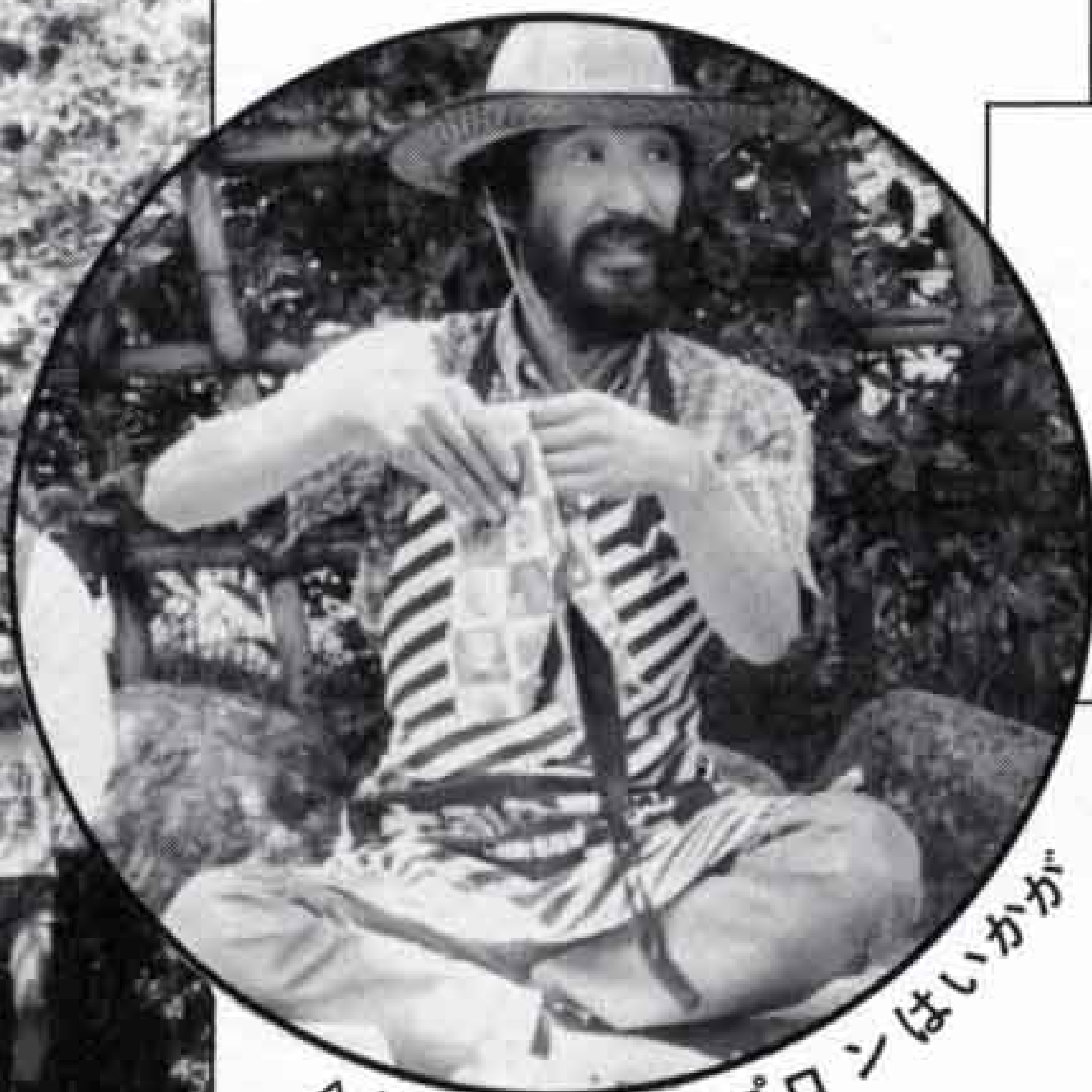
△手づくりエプロンはいかが