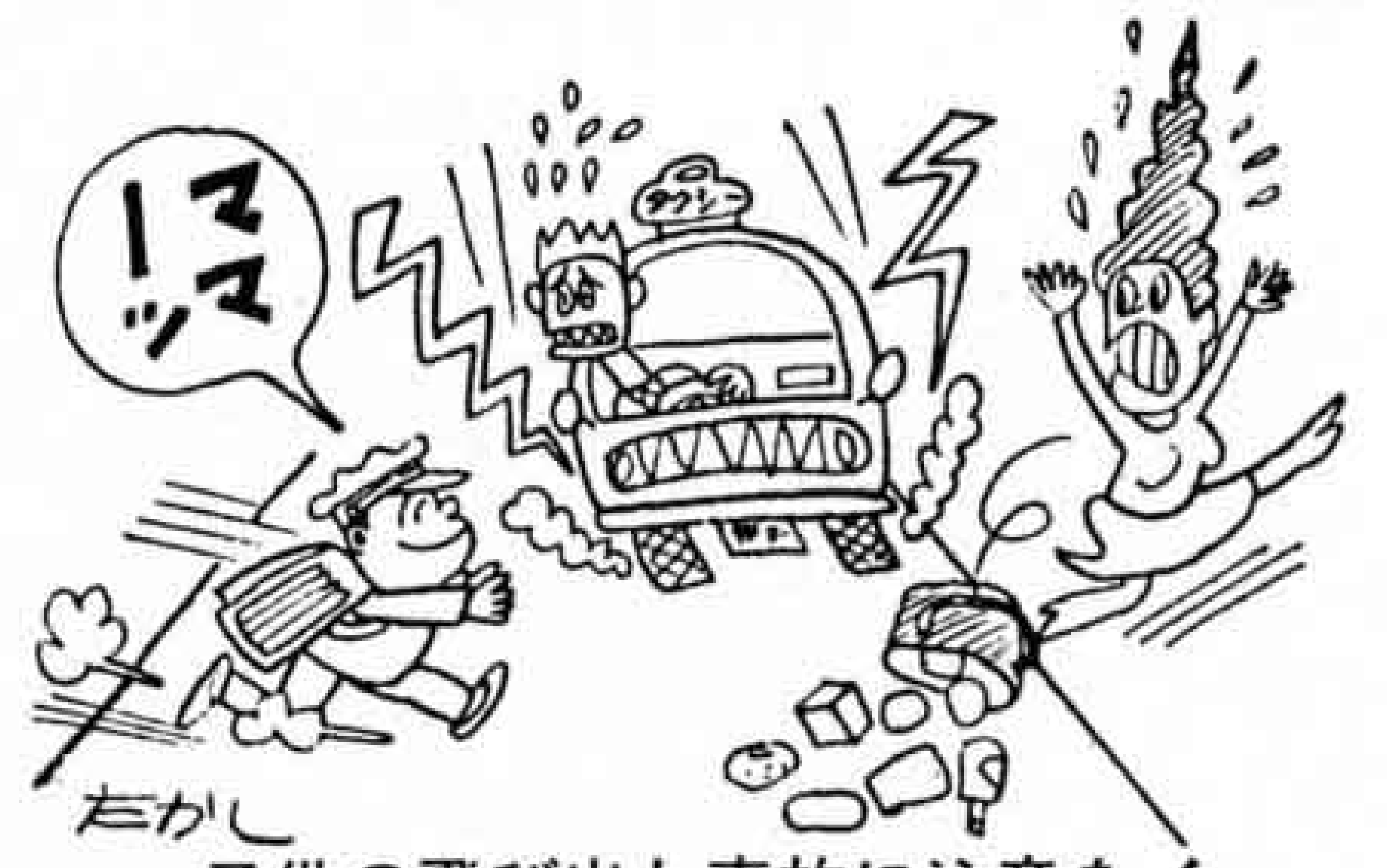
子供の飛び出し事故に注意を!