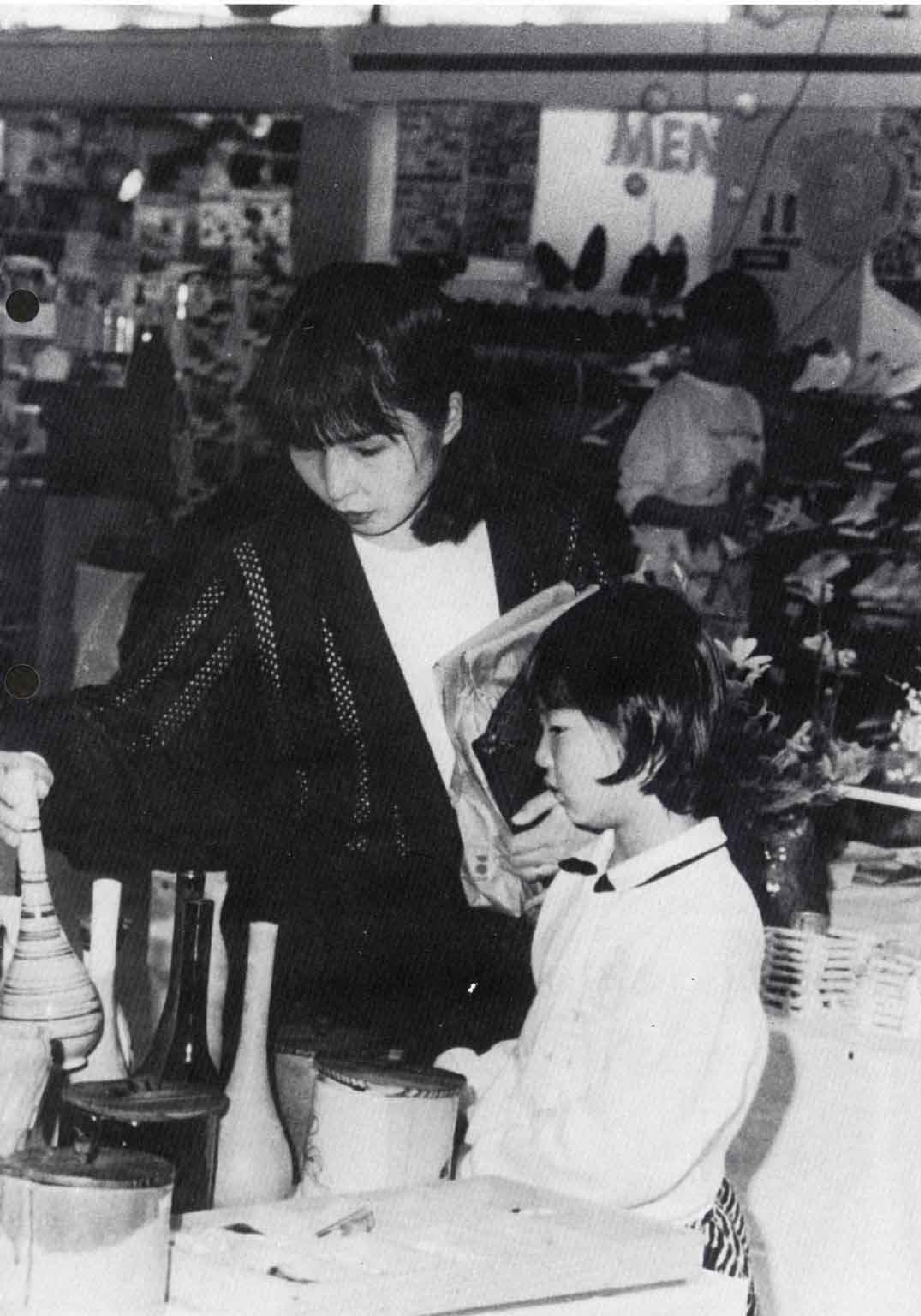
△「この花びん、すてきねー」