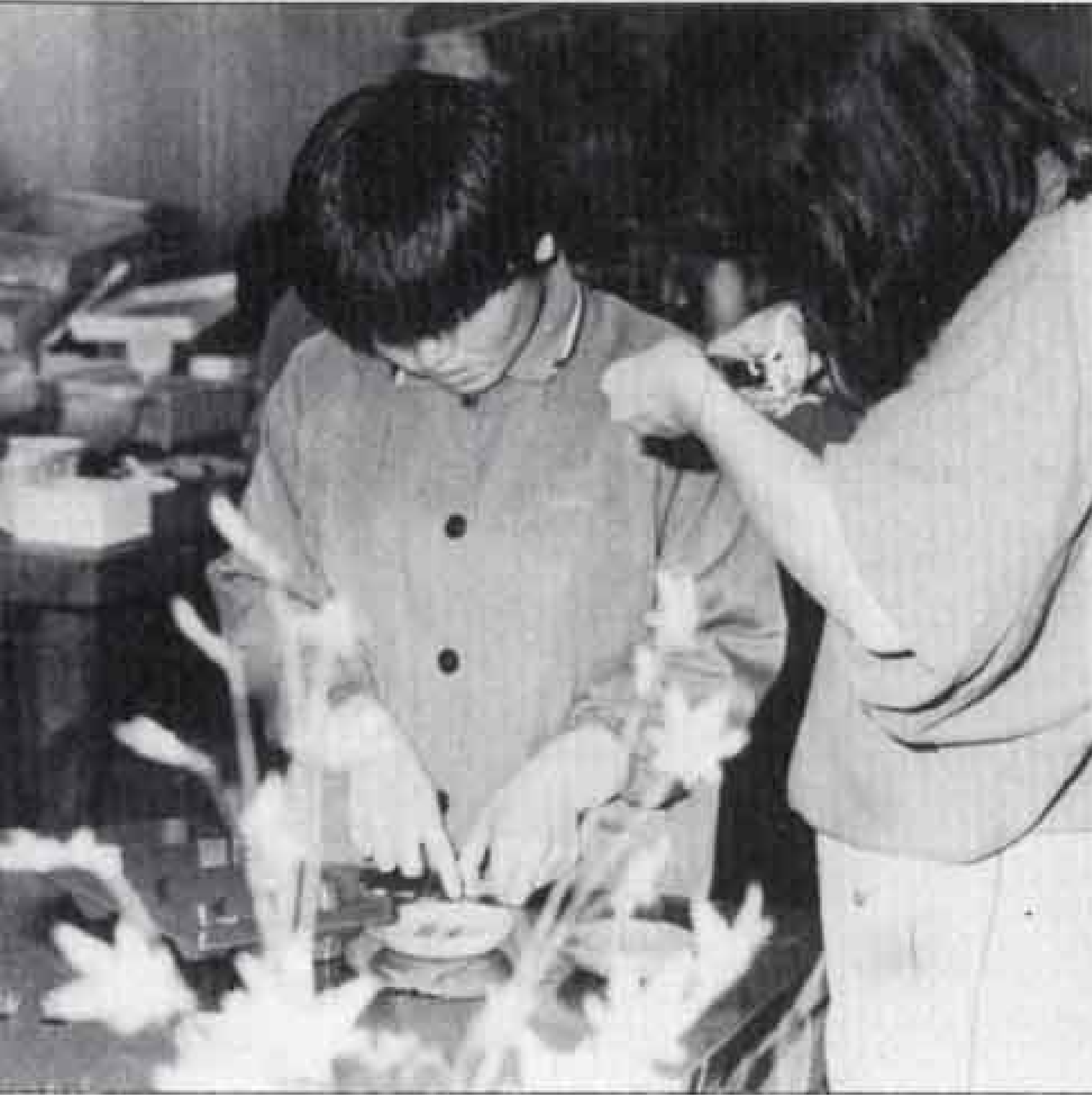
△アートフラワーは細かな手作業です