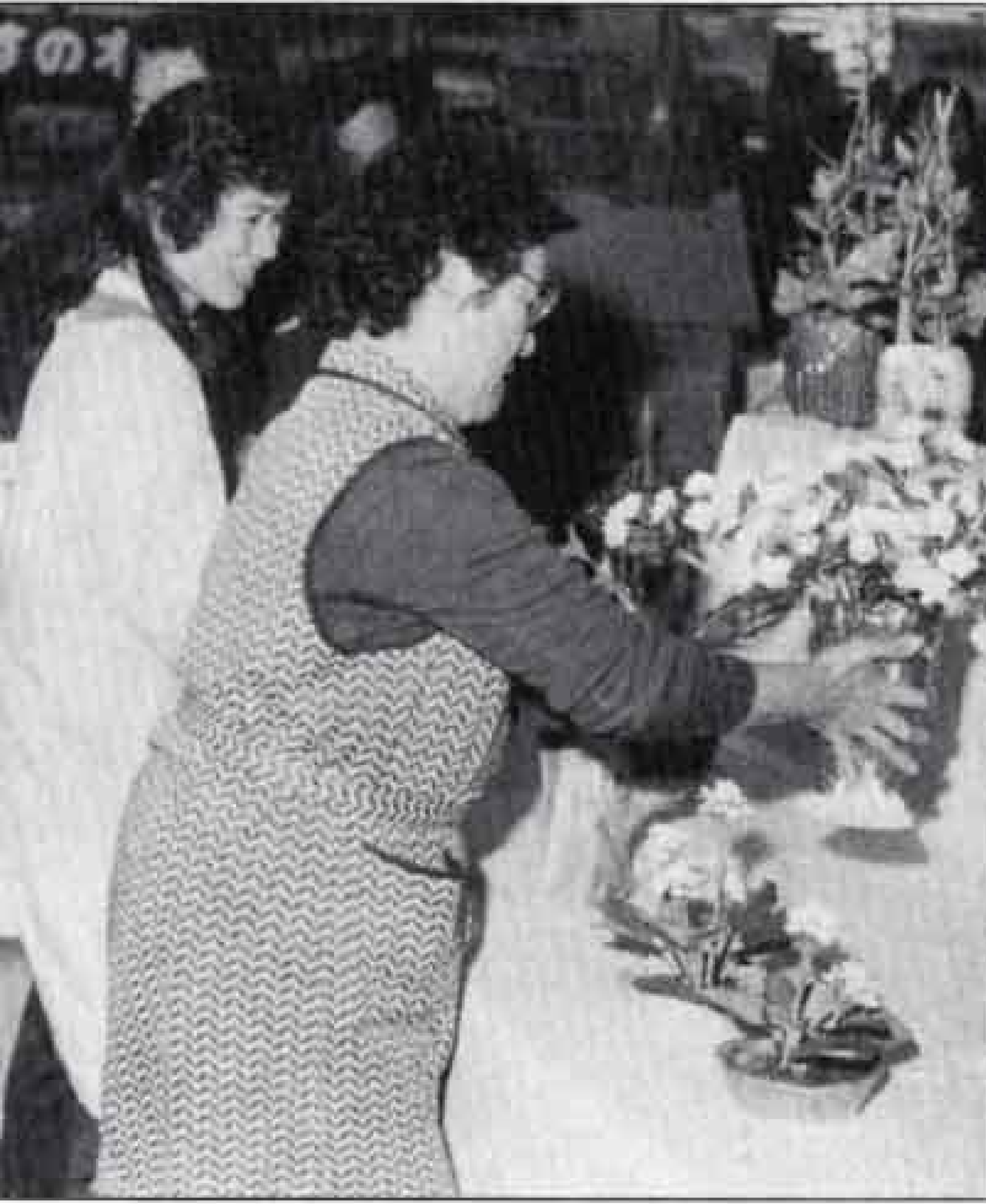
△飾りつけに父兄もお手伝い