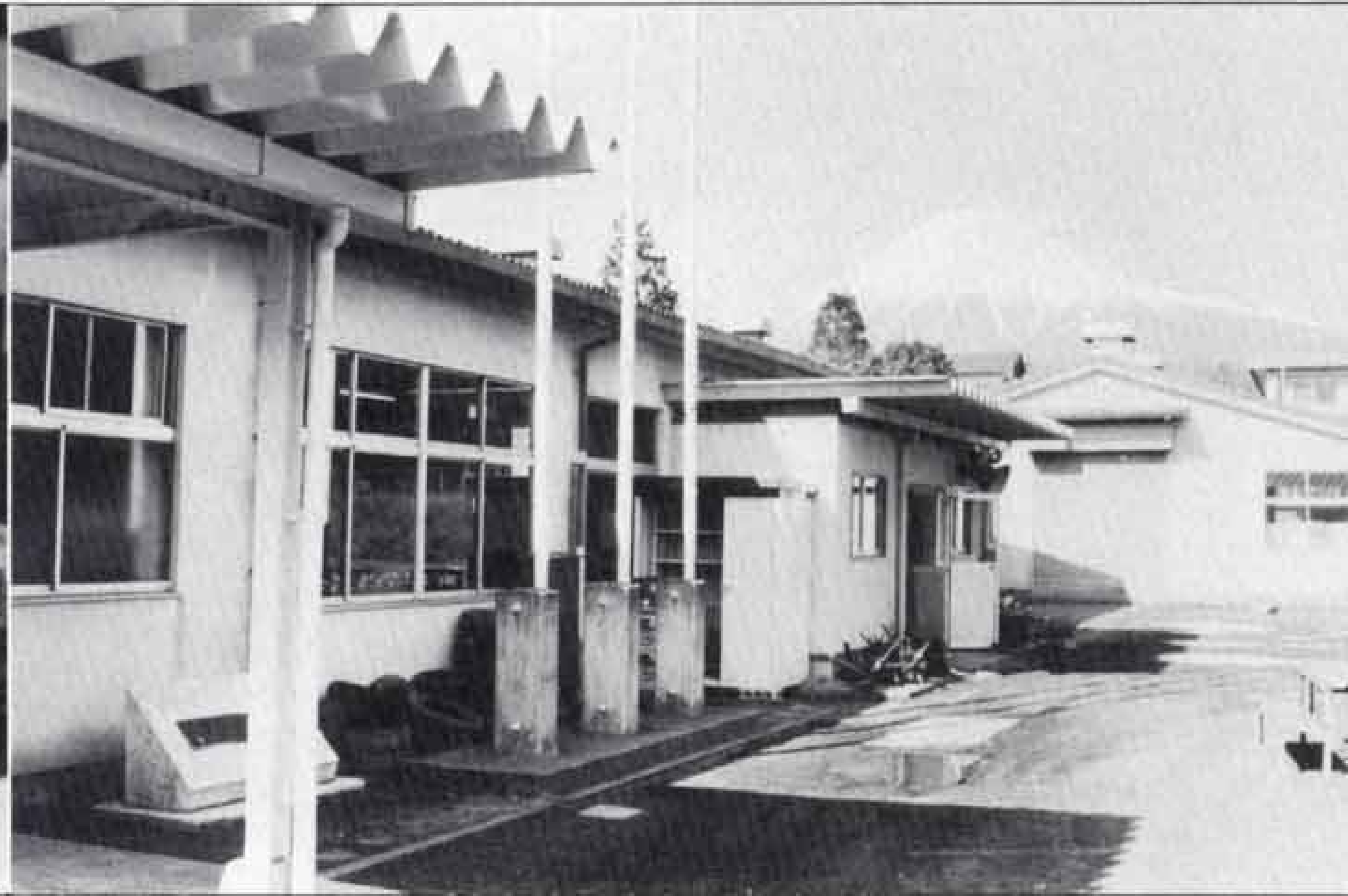
△総合育精施設「くすの木学園」