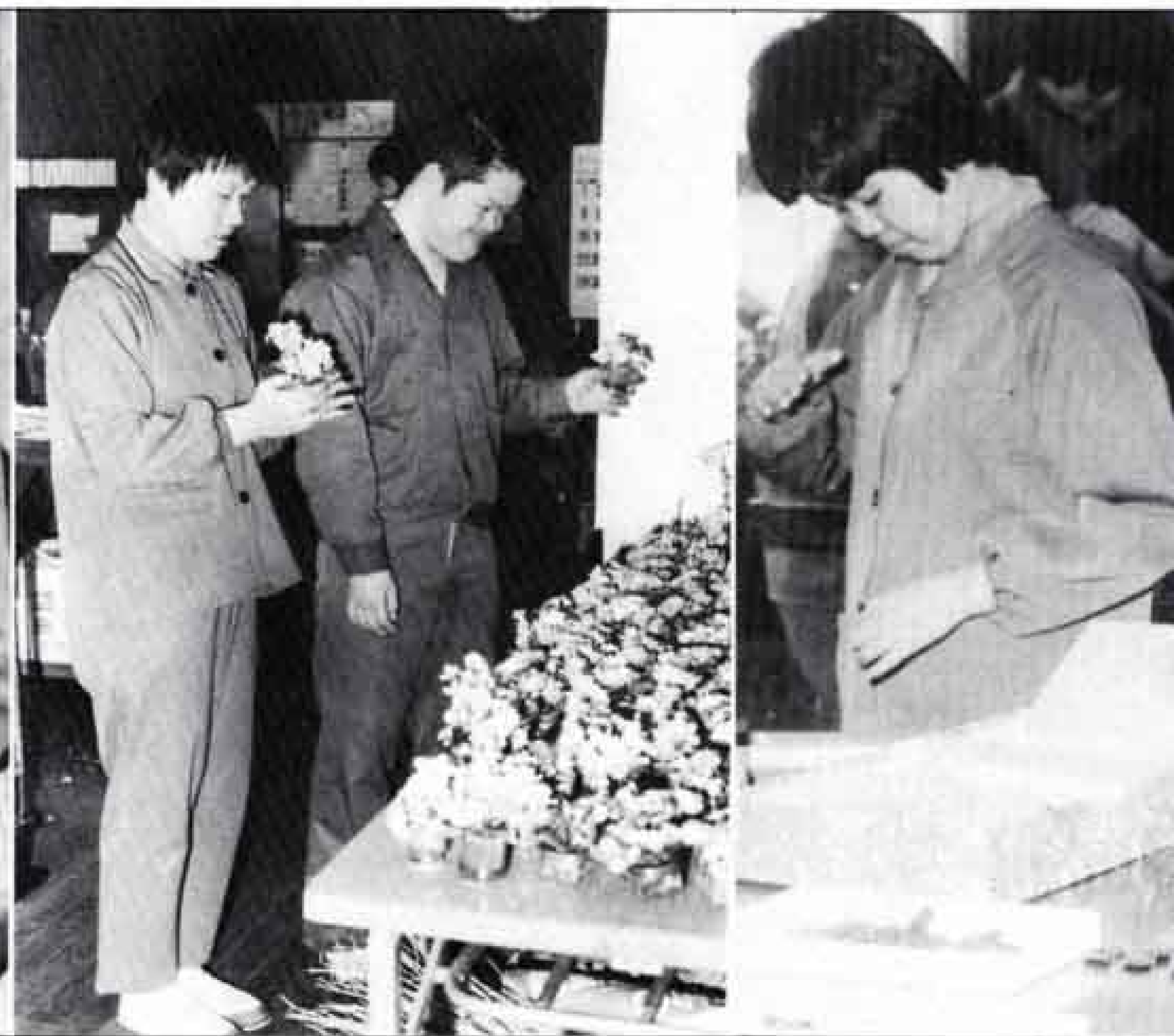
△みごとなできばえに思わずニコリ