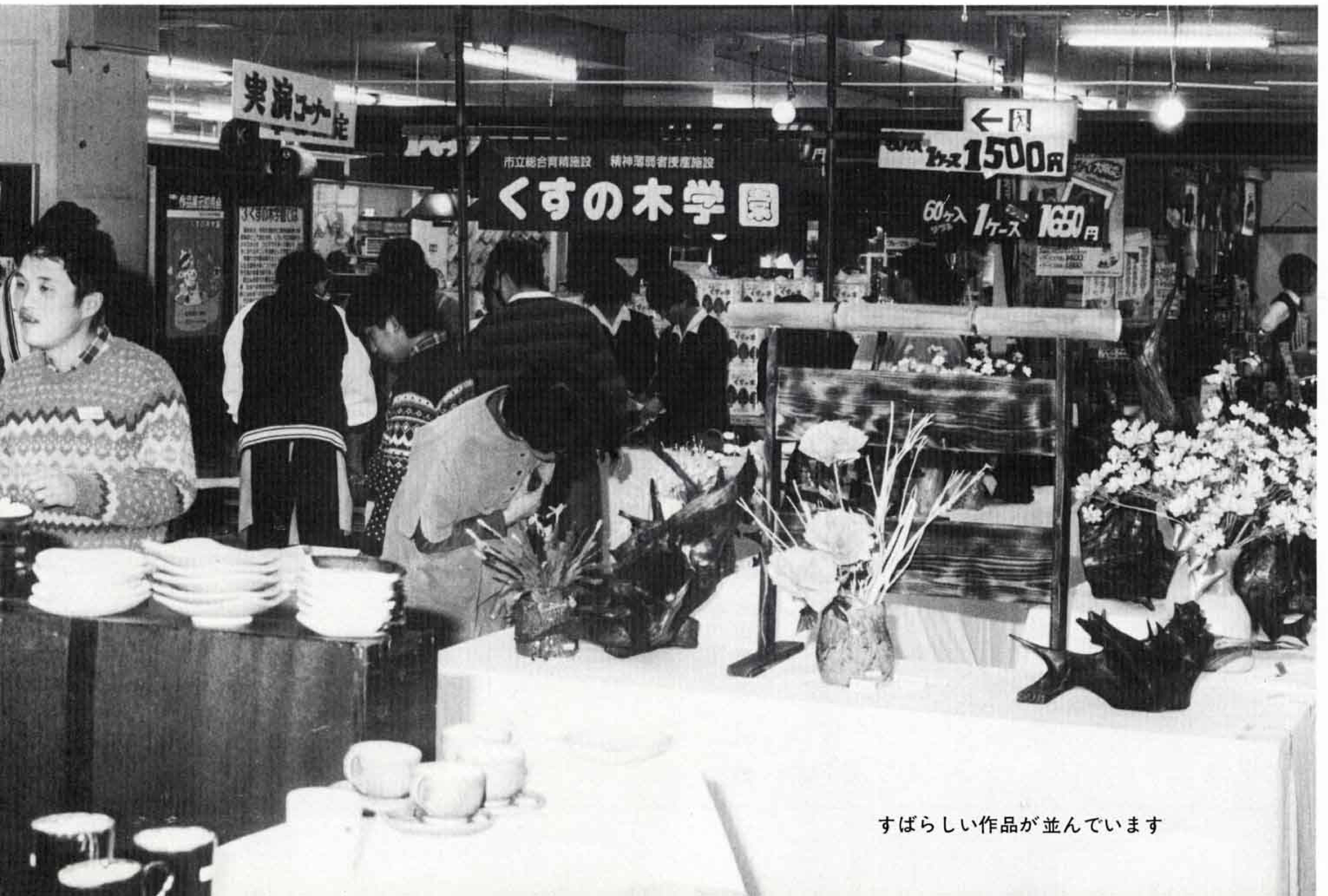
すばらしい作品が並んでいます