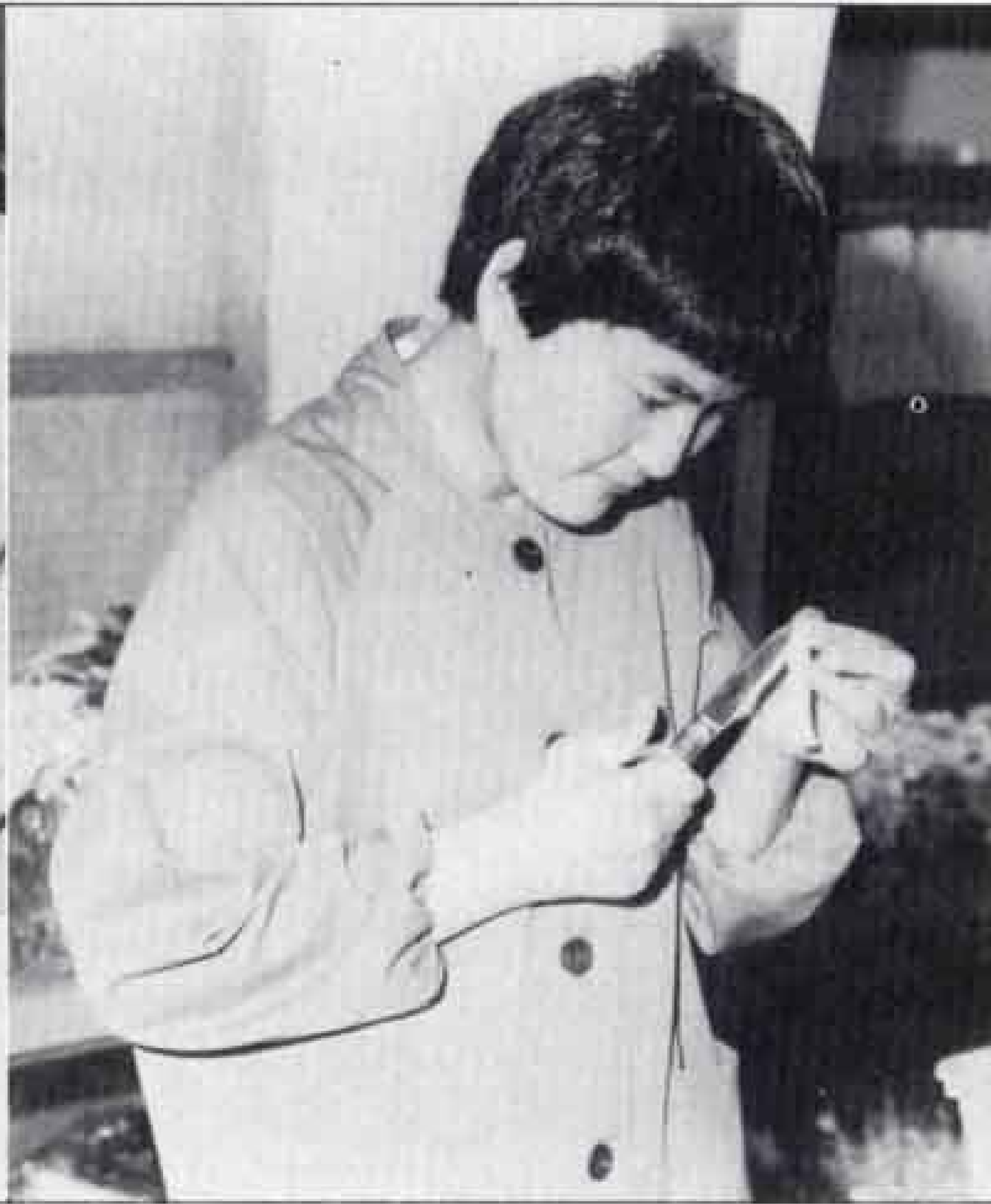
△ハサミ使いも手なれた様子