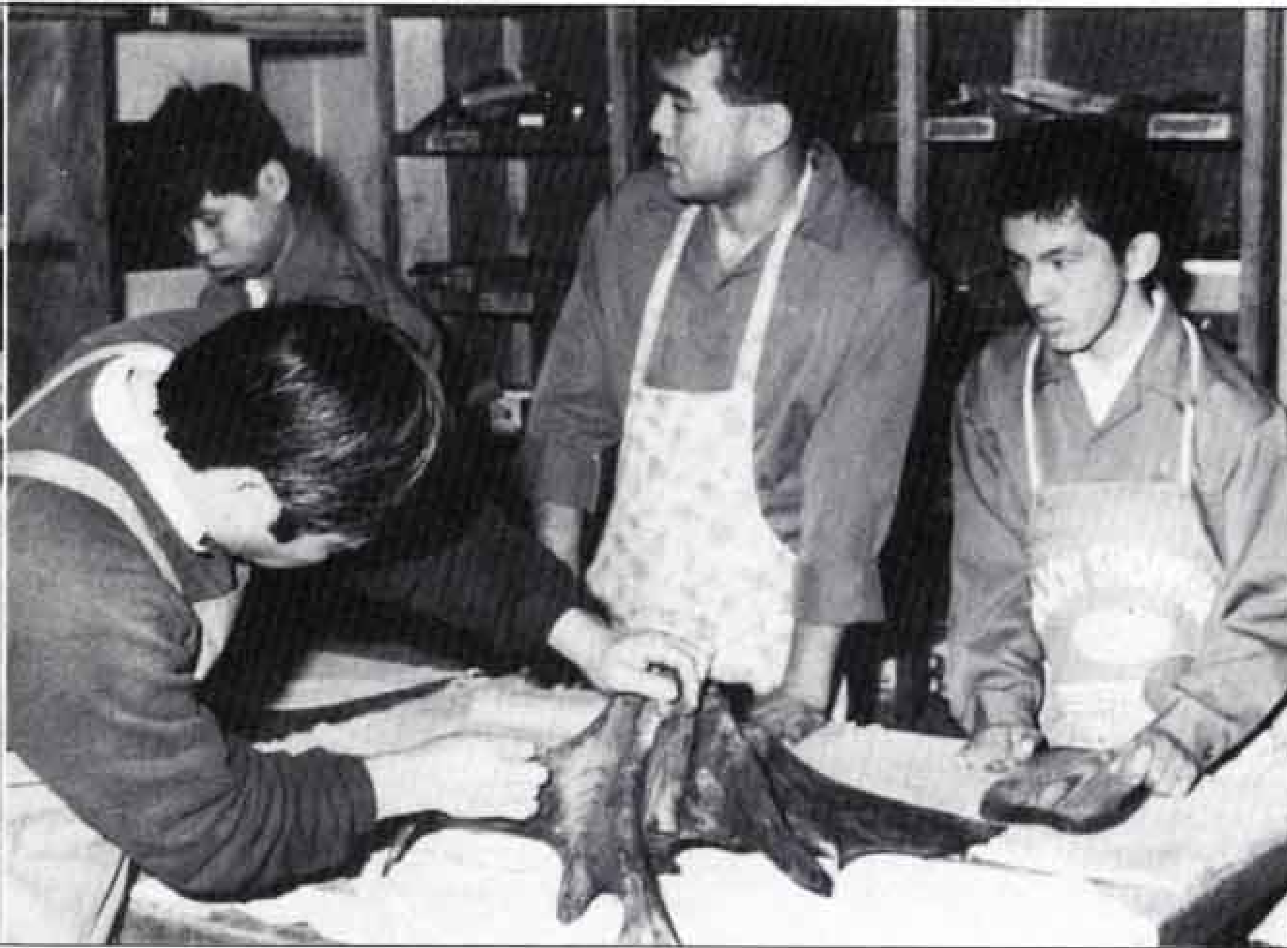
△間近にせまった作品展を前に作業に熱が入ります