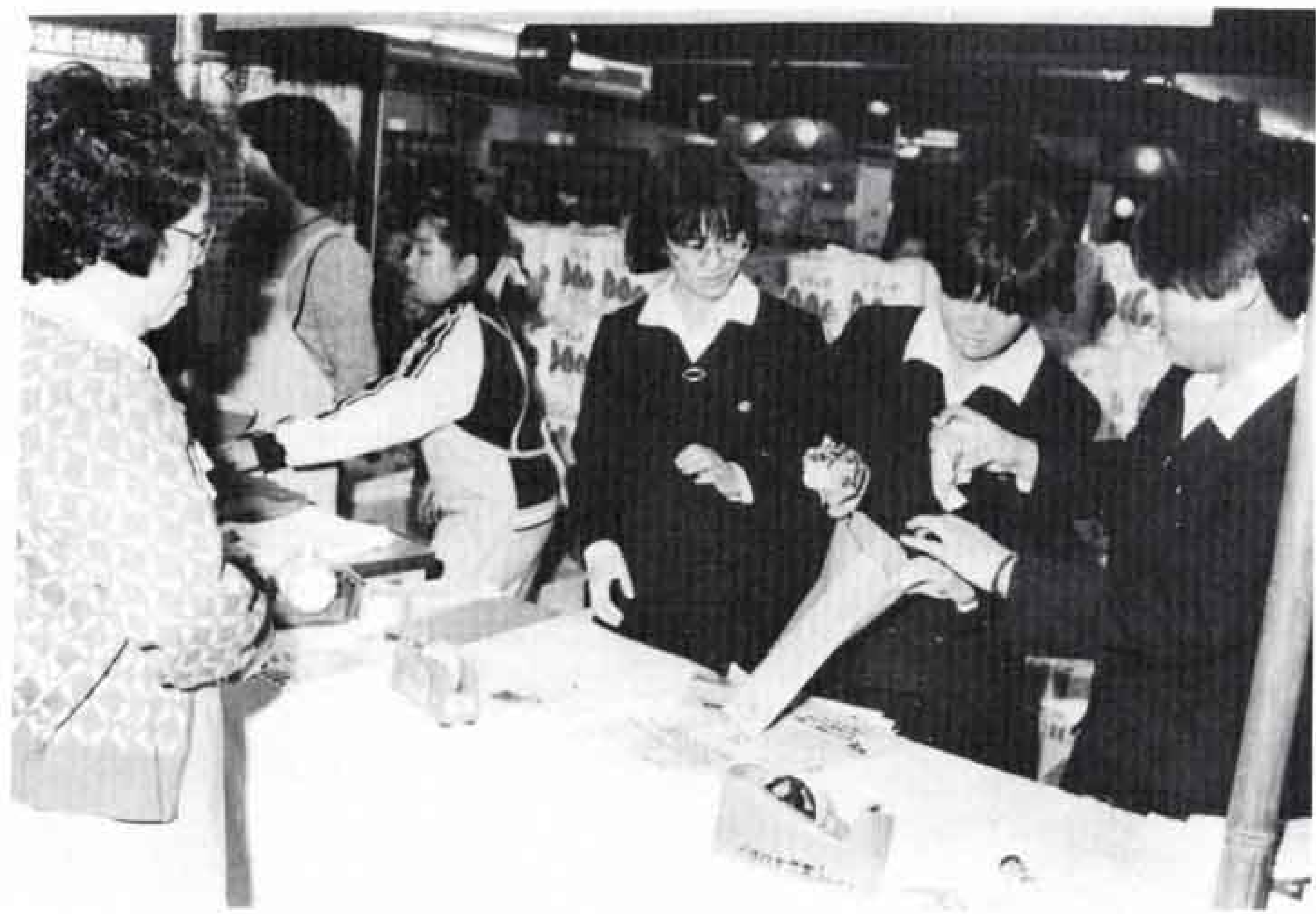
△ボランティアとして高校生も活躍

市立くすの木学園の「第八回作品展即売会」が三月二十日から二十四日まで、ユニー吉原店で開かれました。こととして八回目を迎えた「展示即売会」は、年々、盛り上がりを見せ、開催を毎年心待ちにしている市民もいます。 会場では、日ごろ、園生、職員たちが一丸となつてつくり上げた色とりどりのアートフラワー、一カ月近くかけて、磨きあげた根つ子の花台、花びんやコーヒーカップ、トイレットペーパーなどが展示即売されました。また、作品を通して、園生と市民の触れ合いもあちこちで見られました。