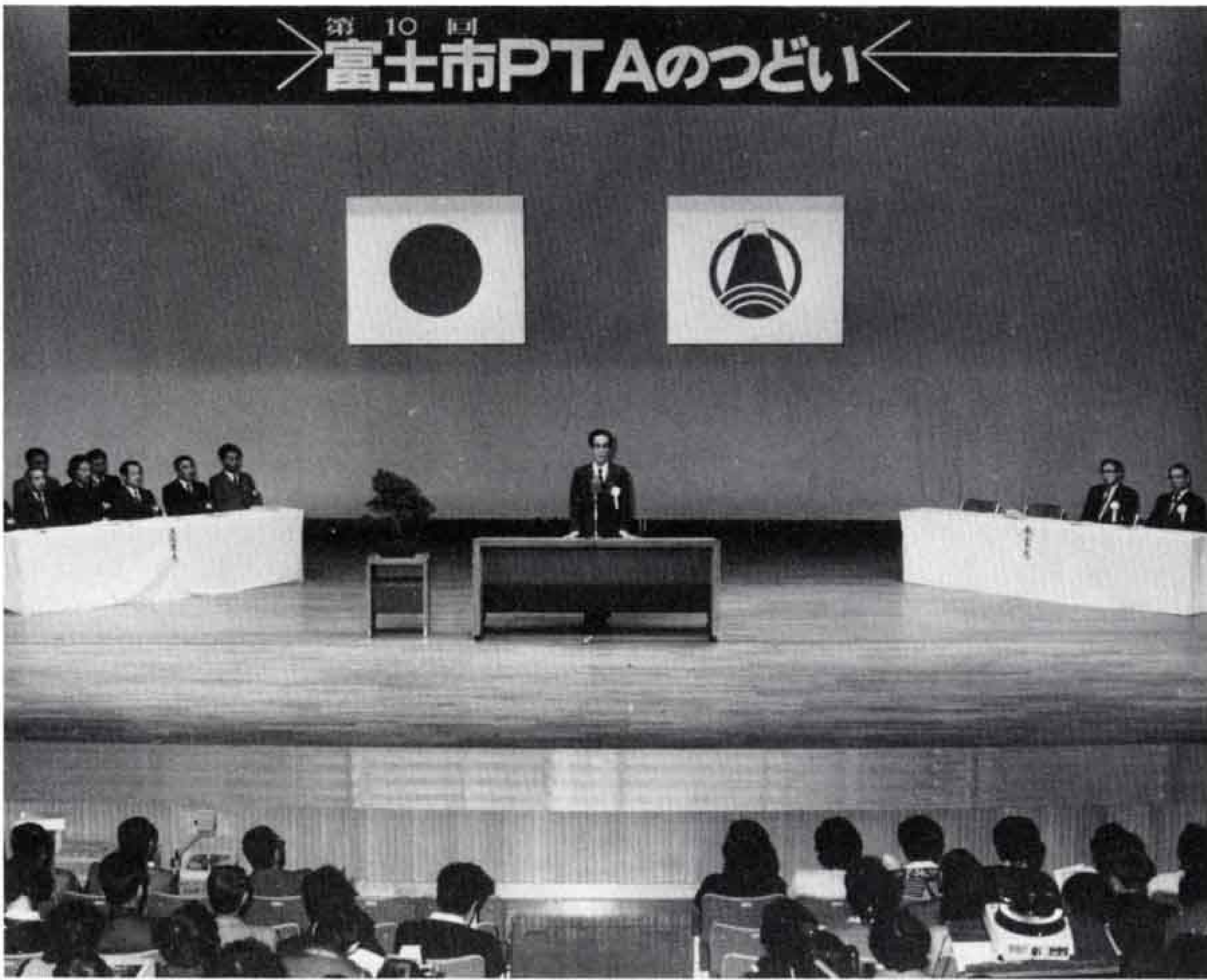
▲熱心に話をきく父兄