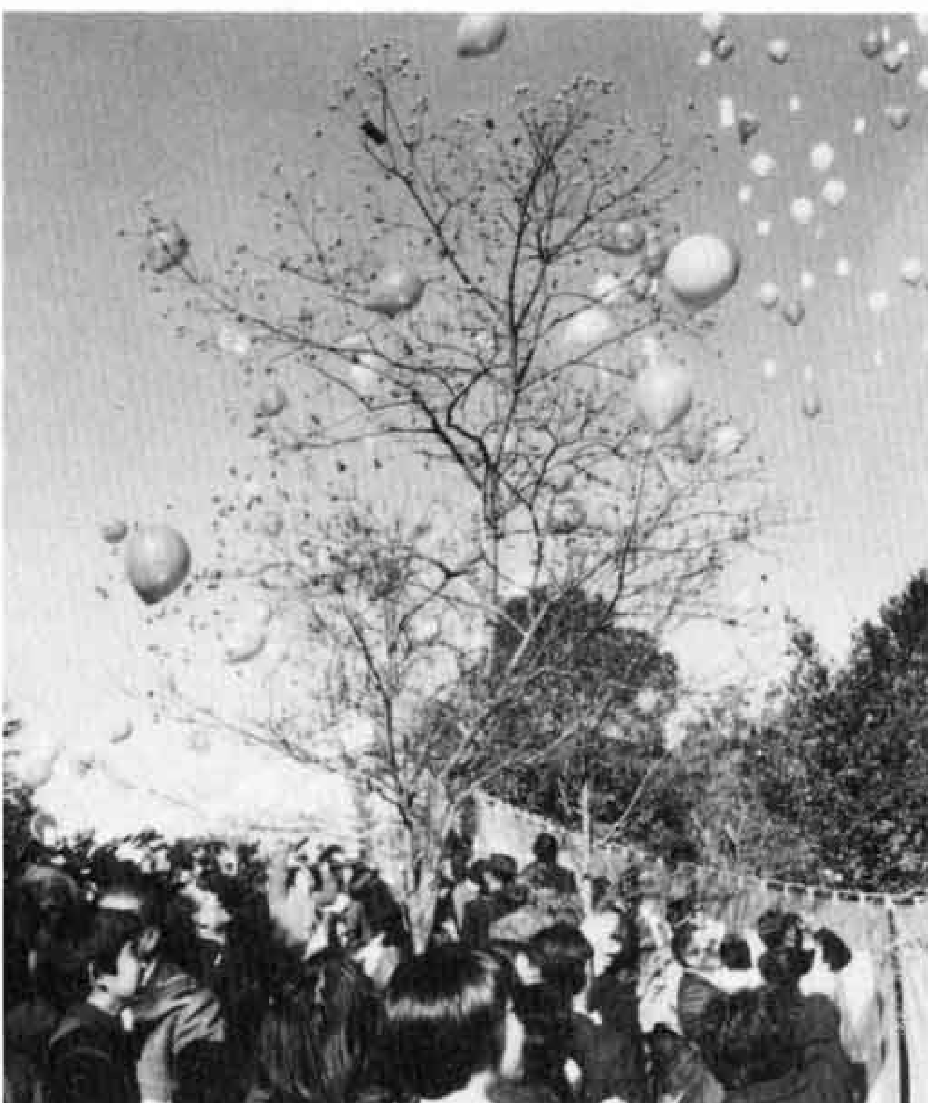
▲50年後に夢を託して大空へ風船を

新市二十周年を記念して製作したタイムカプセルを、昨年十二月二十日、広見小学校の生徒たちなどが参加して、広見公園に埋設しました。 このタイムカプセルには、現在の富士市の姿を後世に伝えるさまざまな資料が入っています。 五十年後の西暦二〇三六年にあけられるタイムカプセルですが、今回、埋設場所を示すモニュメントも完成しました。