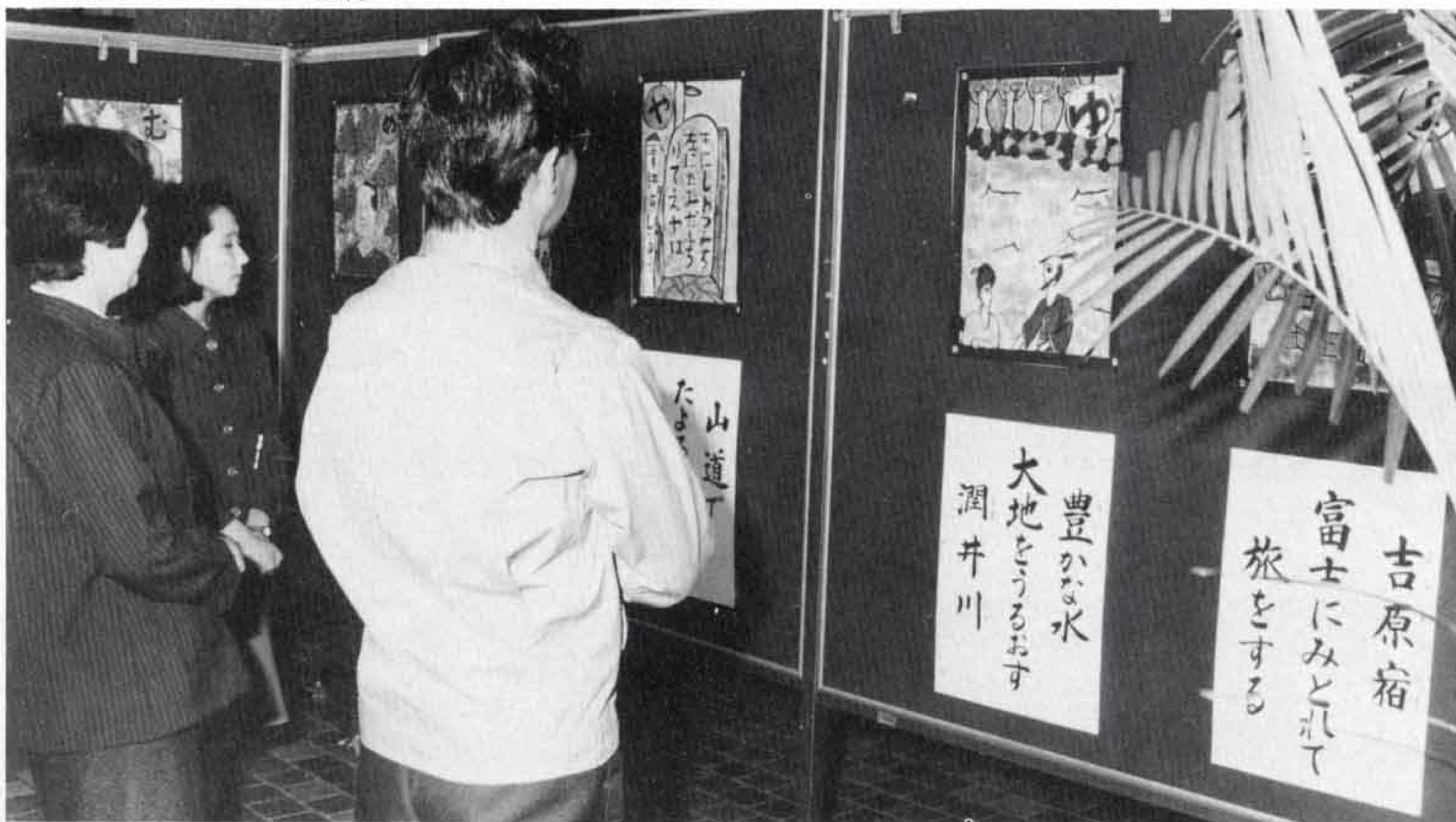
▲なるほど!字札もじょうずにできてるな