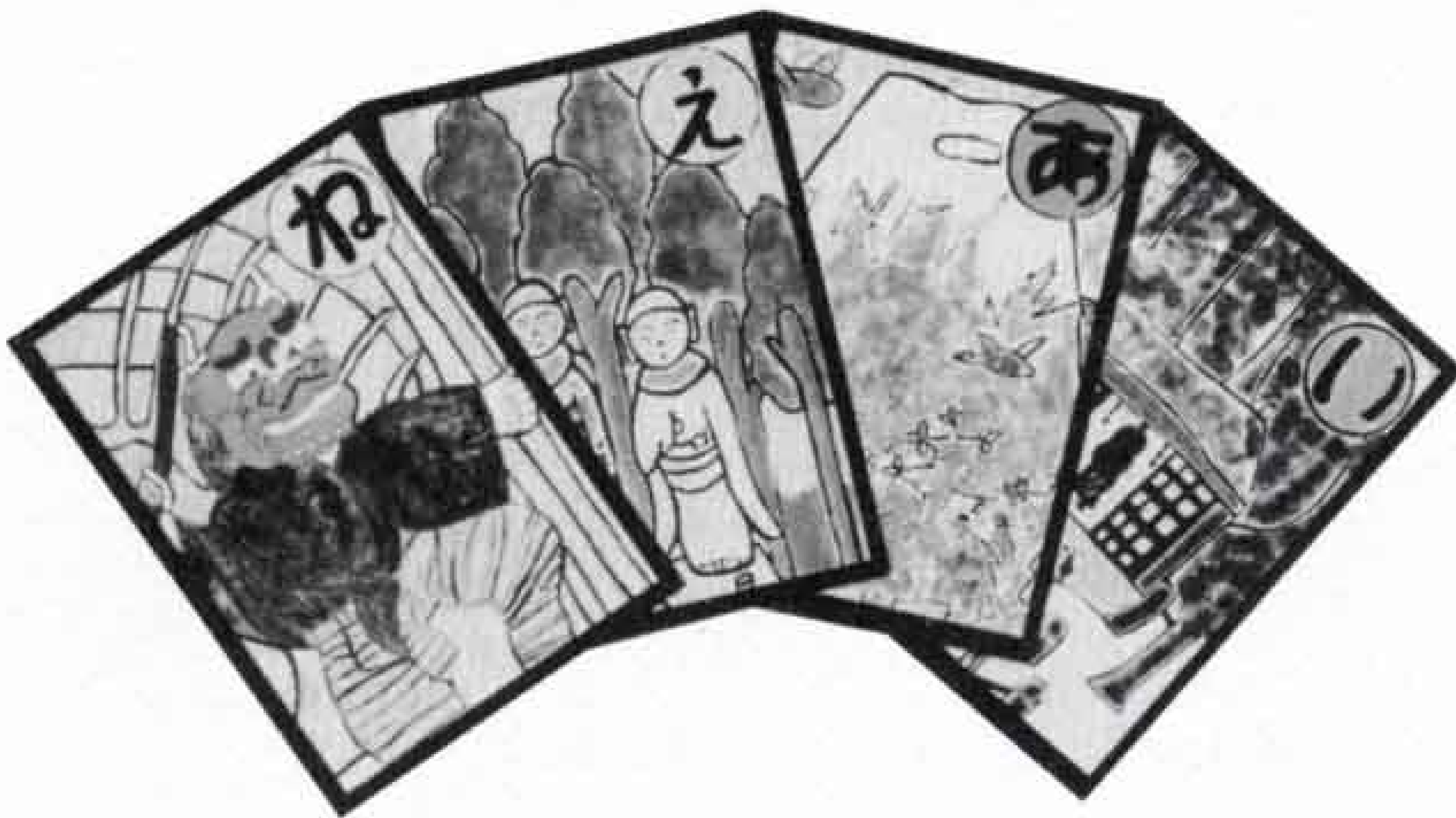
▲色彩もあざやかな絵札

内容は、子供から大人まで楽しみながら、郷土富士の歴史を覚えらるるよう工夫されています。かるたの購入希望者は青年会議所 電話五三―三三六六へ。