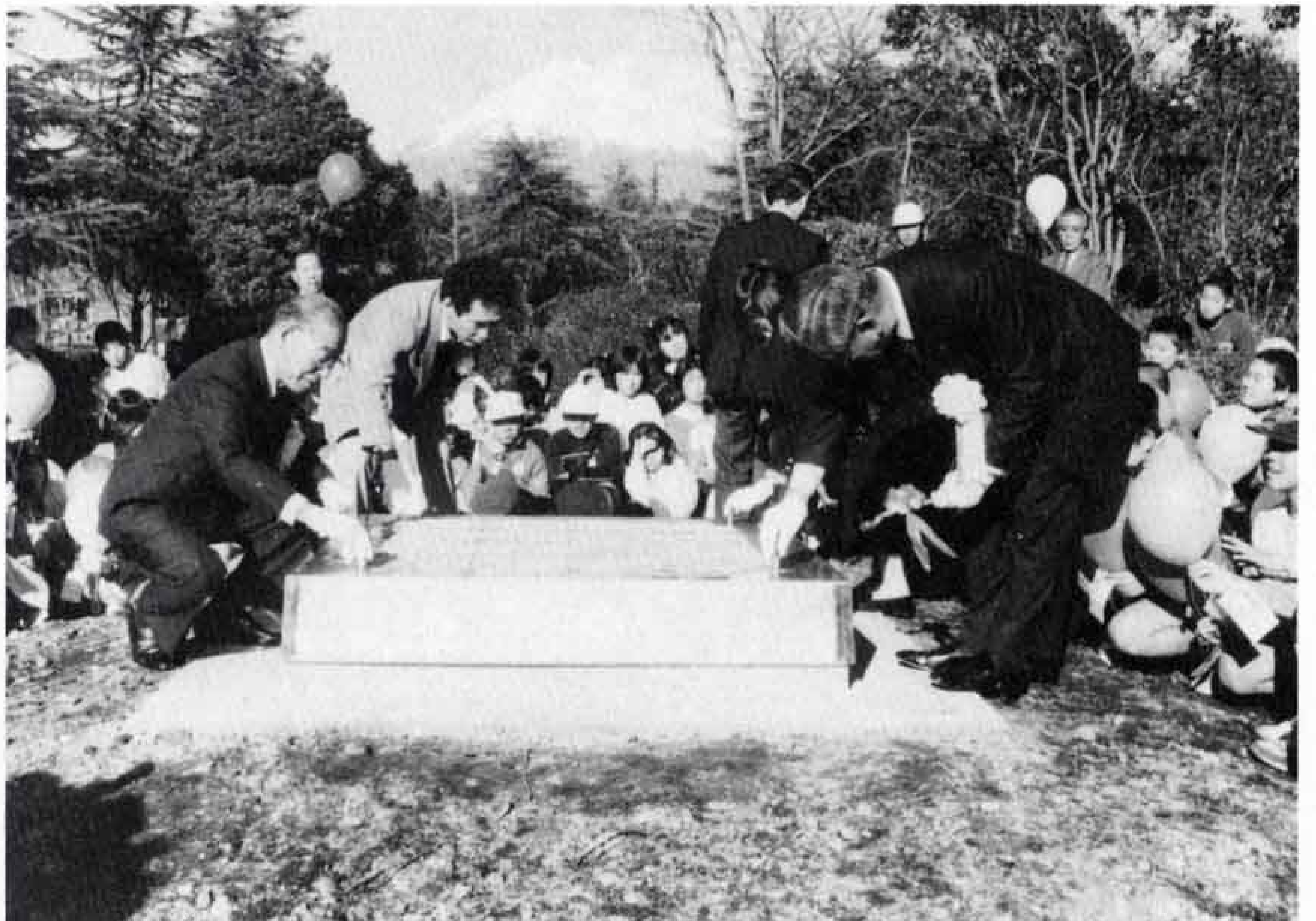
▲埋設したところをボルト締め