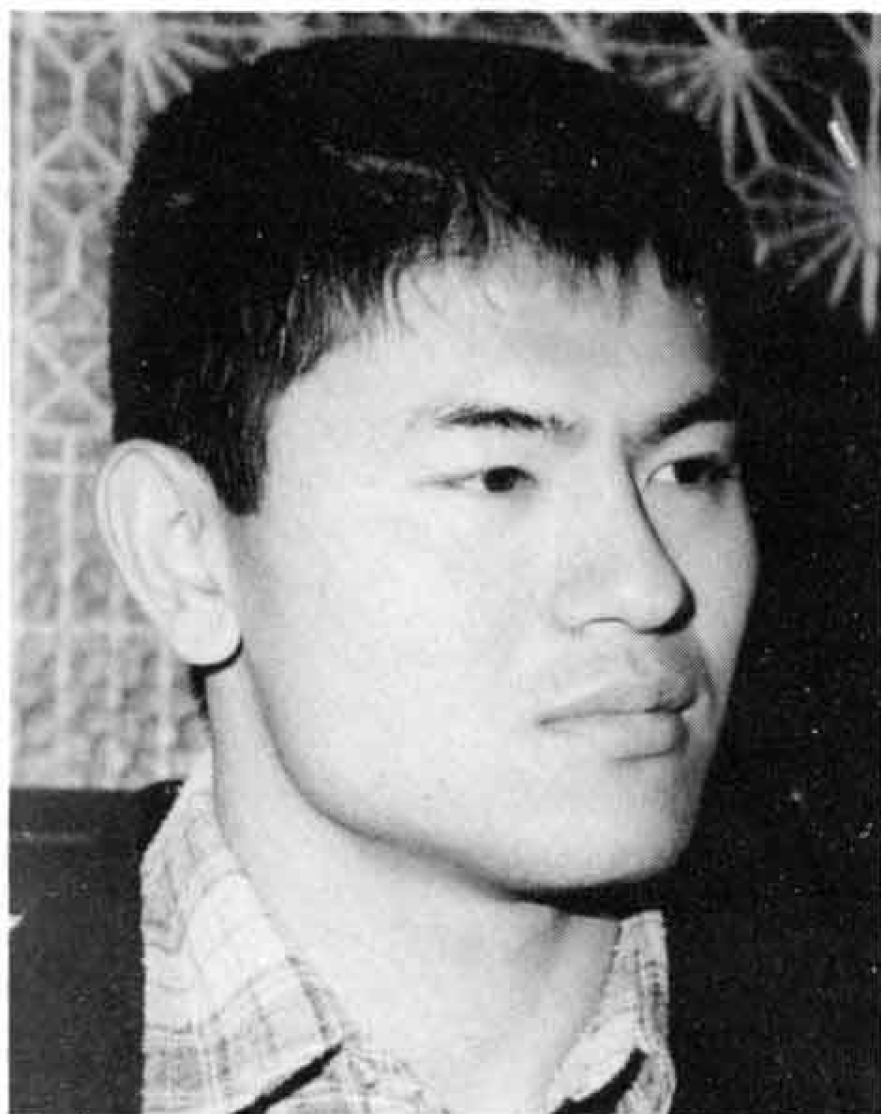
県東部4Hクラブ連絡協議会 冬の大会意見発表の部で優秀賞