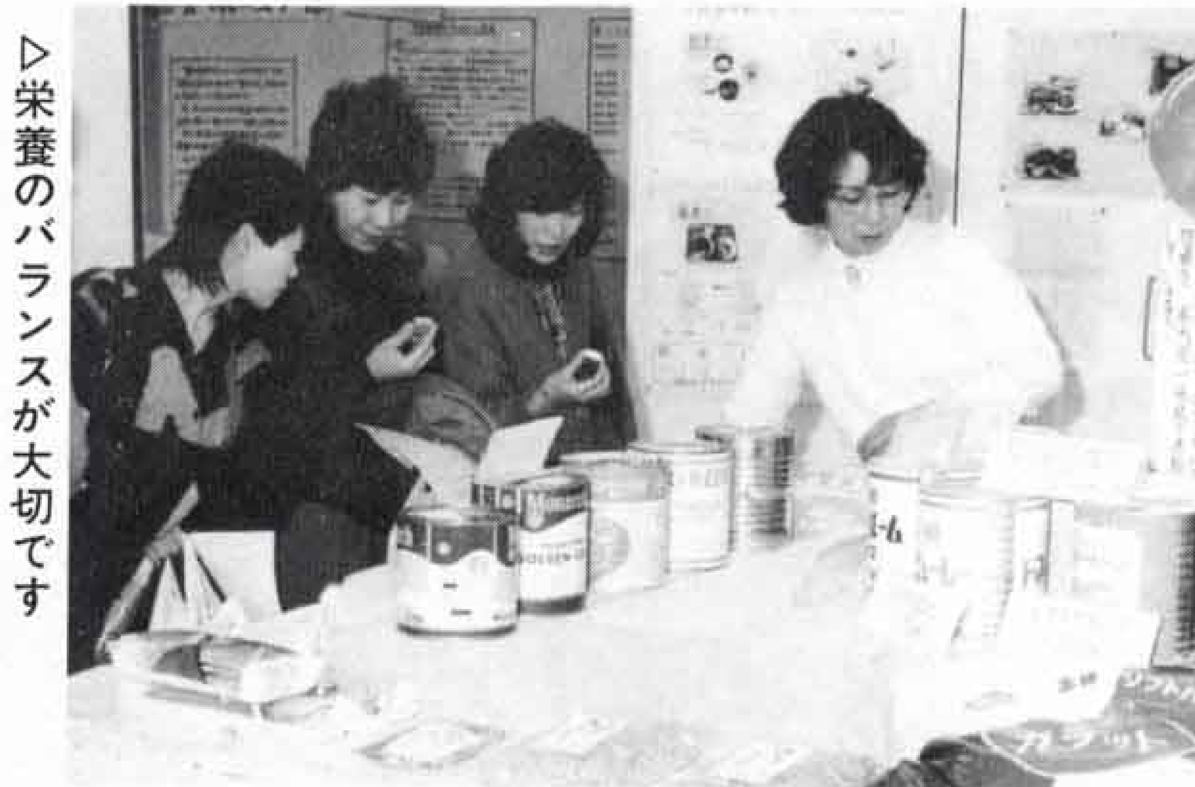
▷栄養のバランスが大切です