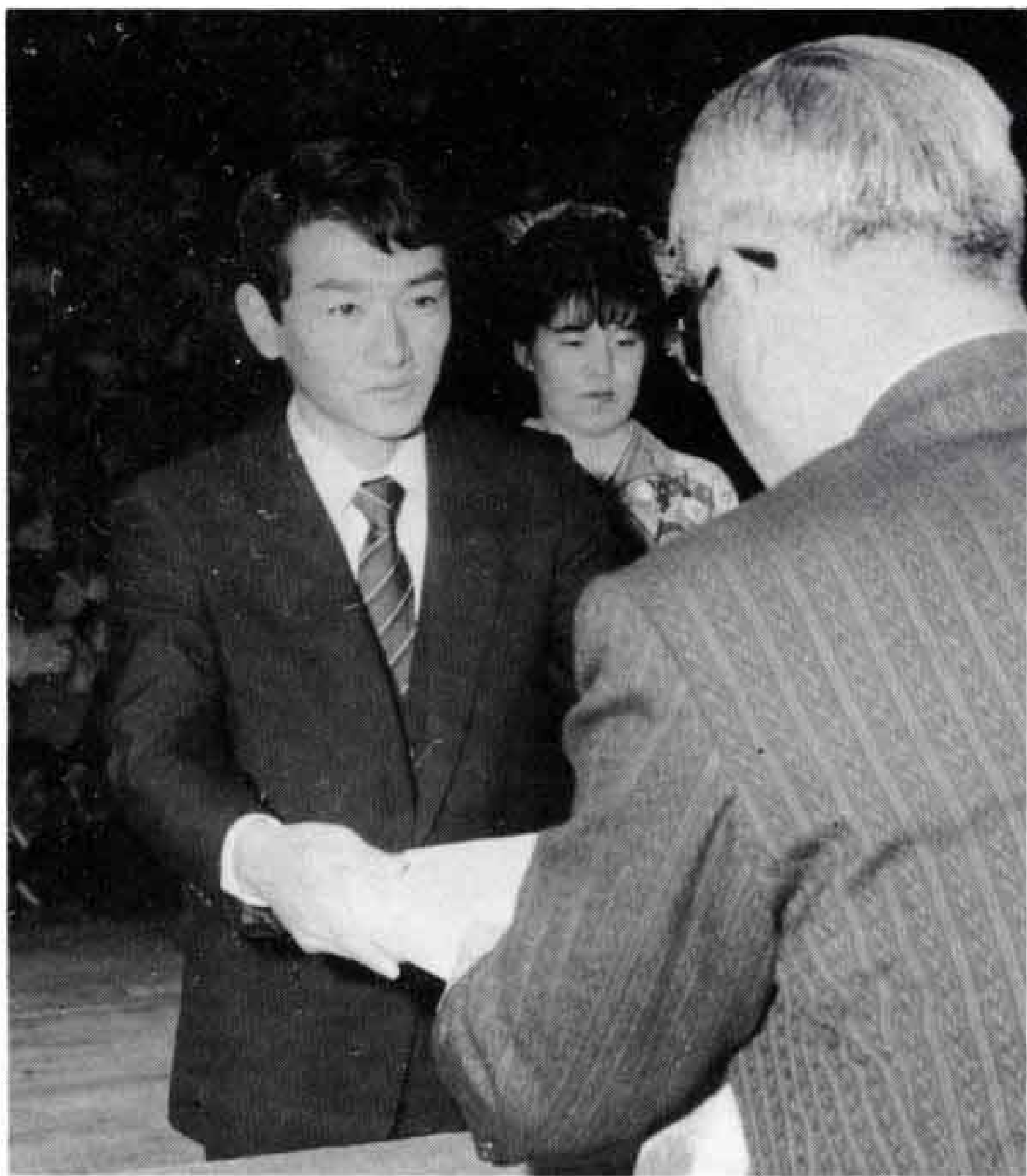
△記念品を贈られる新成人代表