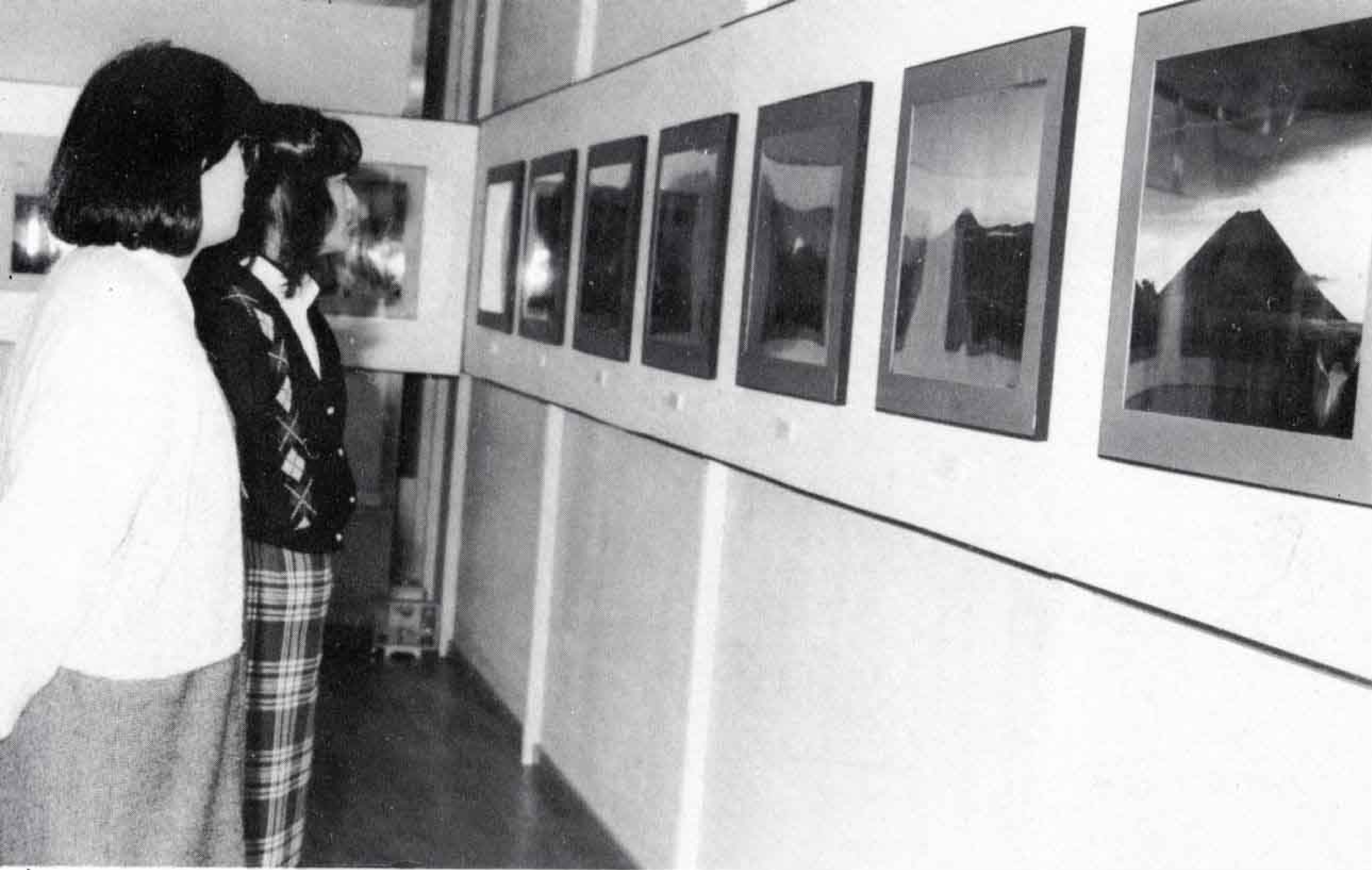
△「私はこの富士山が好きだわ」とうっとり