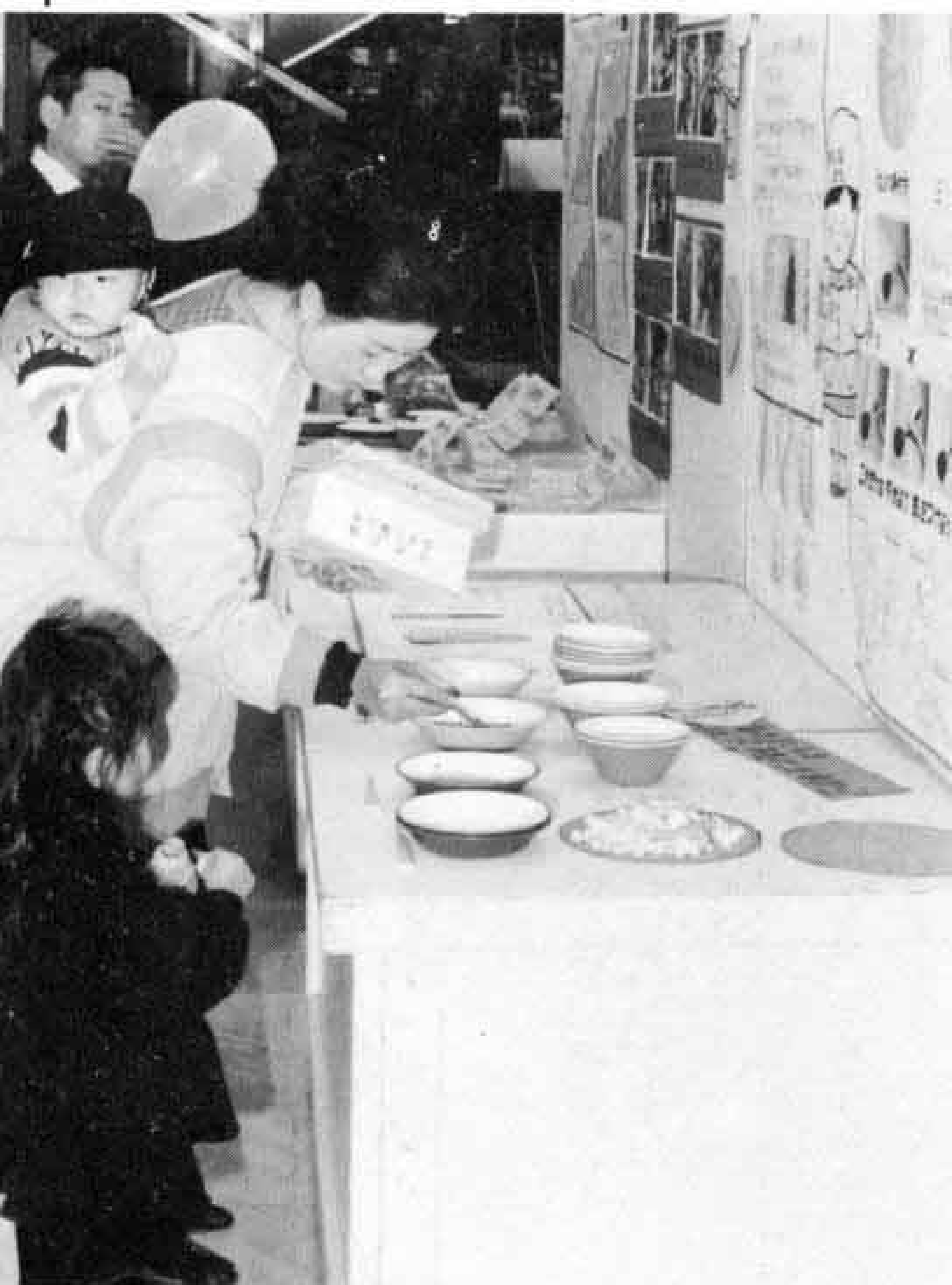
△「おはしはこうやって持つのよ」とアドバイス

1月22日から25日までパピー4階催事場で「第6回学校給食展」が開かれました。飽食時代といわれる現在、子供たちがすこやかに成長するために、家庭と学校が手を取り合って食生活を考えようと開かれたものです。