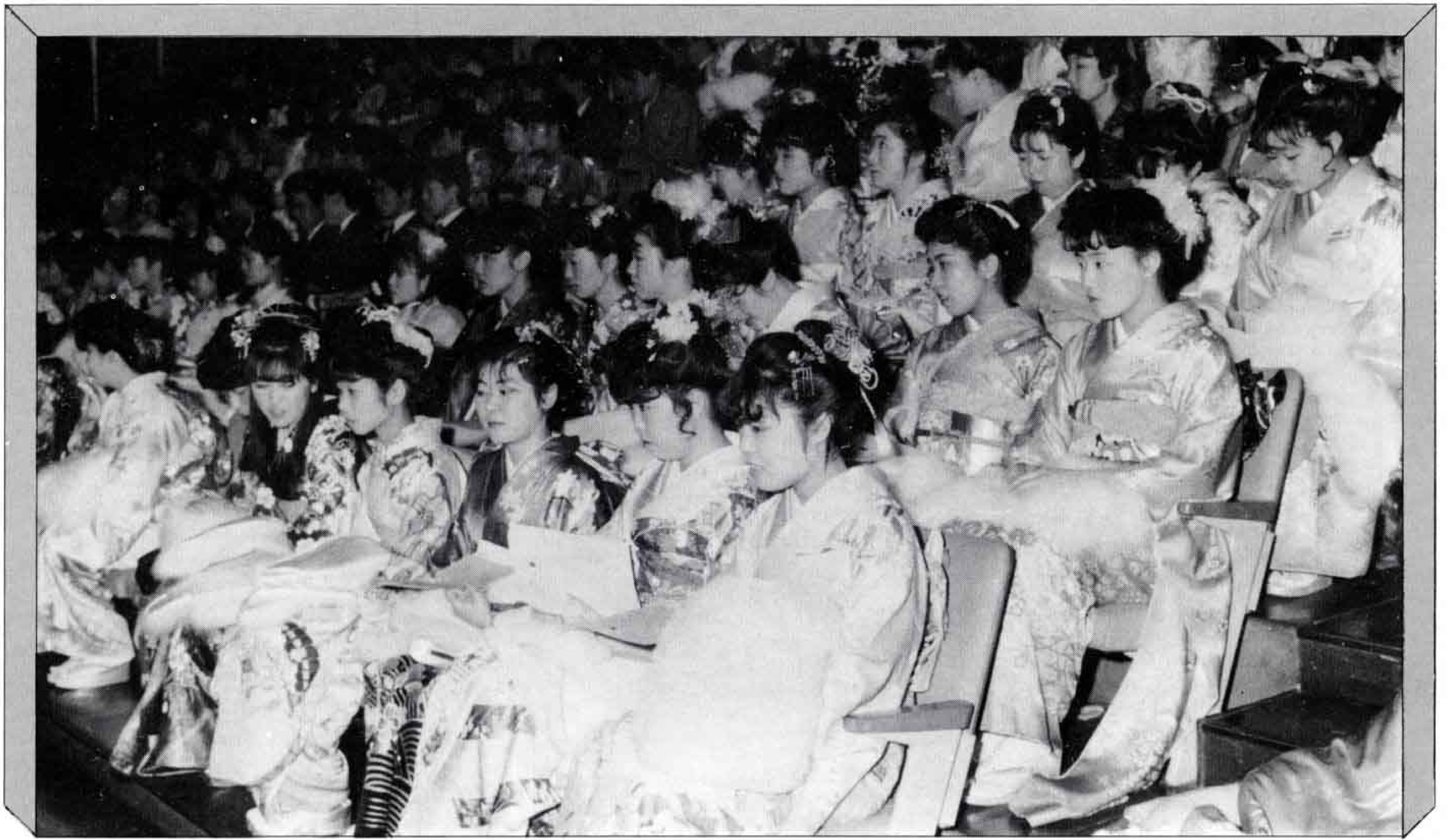
△会場は晴れ着姿の若者たちでいっぱい