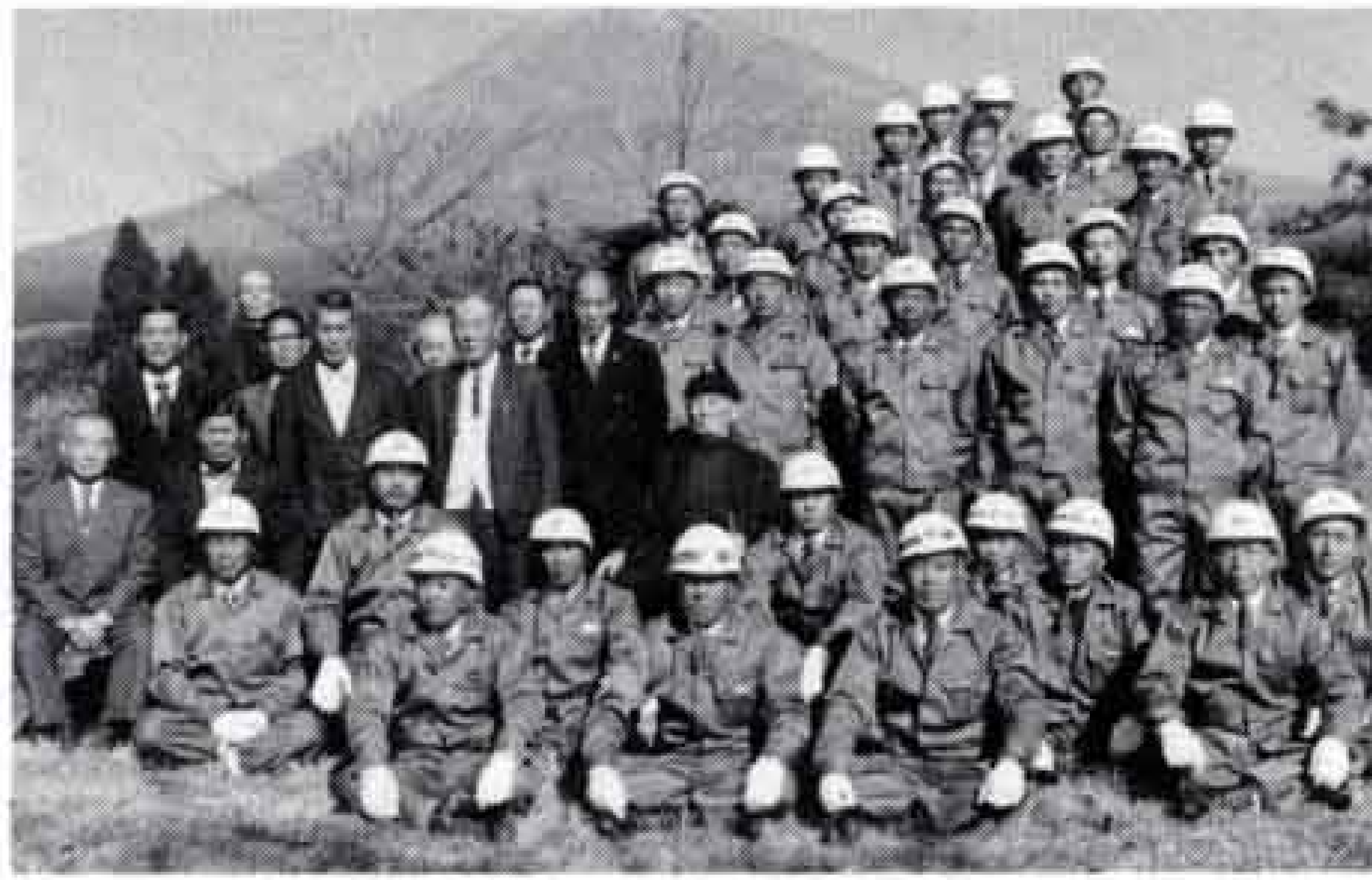
再結成された富士本林野消防隊（昭和49年撮影）

「昔は東富士本、西富士本、中富士本で林野消防隊をつくっていたんだが戦争で自然消滅したようだね。昭和四十九年に、現在の富士本林野消防隊が再結成されて、三十二人の隊員で砂防工事や林野のパトロールなんかをやっているよ」