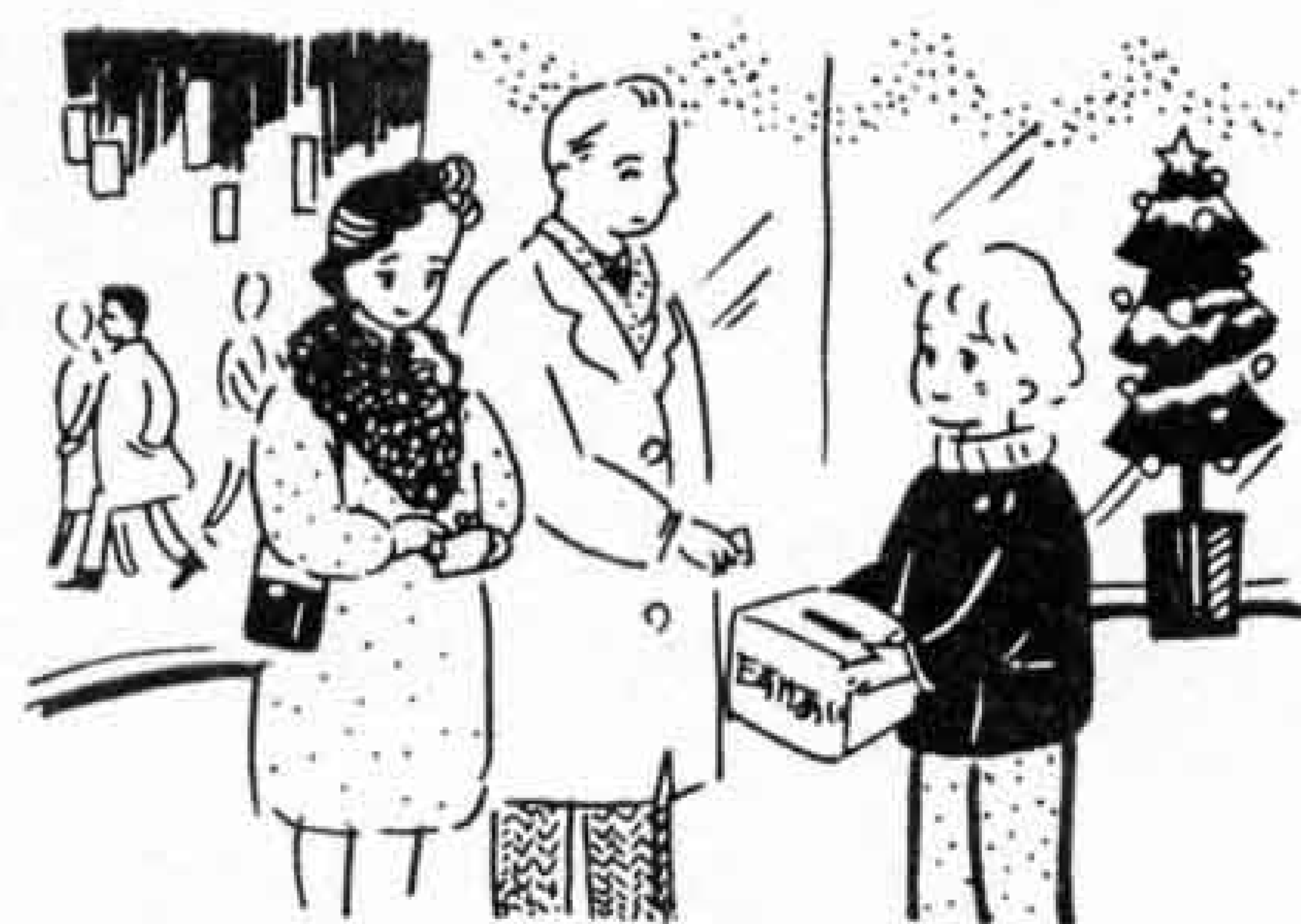
歳末たすけあい運動 (12月1日~31日)