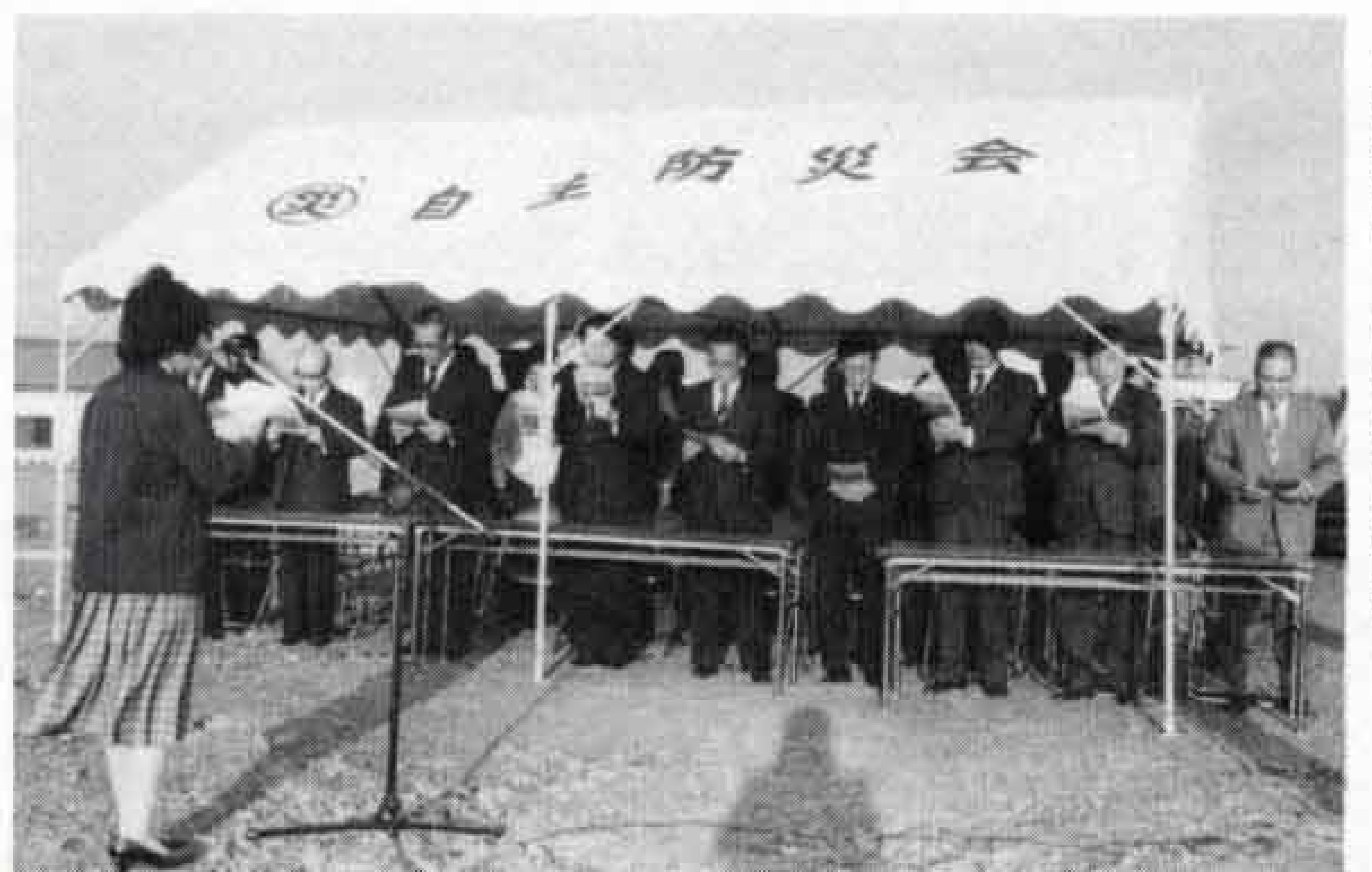
△除幕後、宣言文を唱和