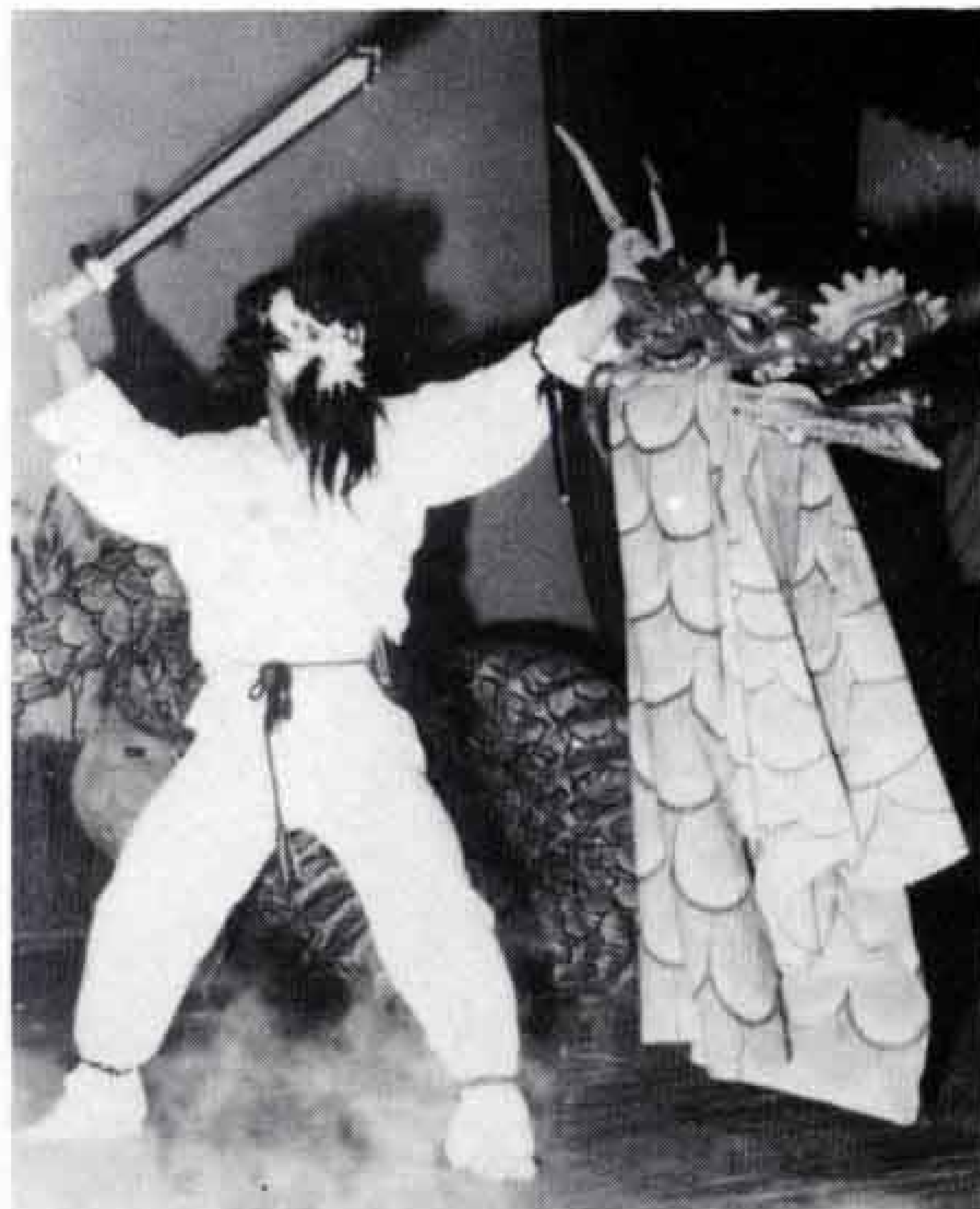
△大龍の舞の山場「大龍退治」の一場面