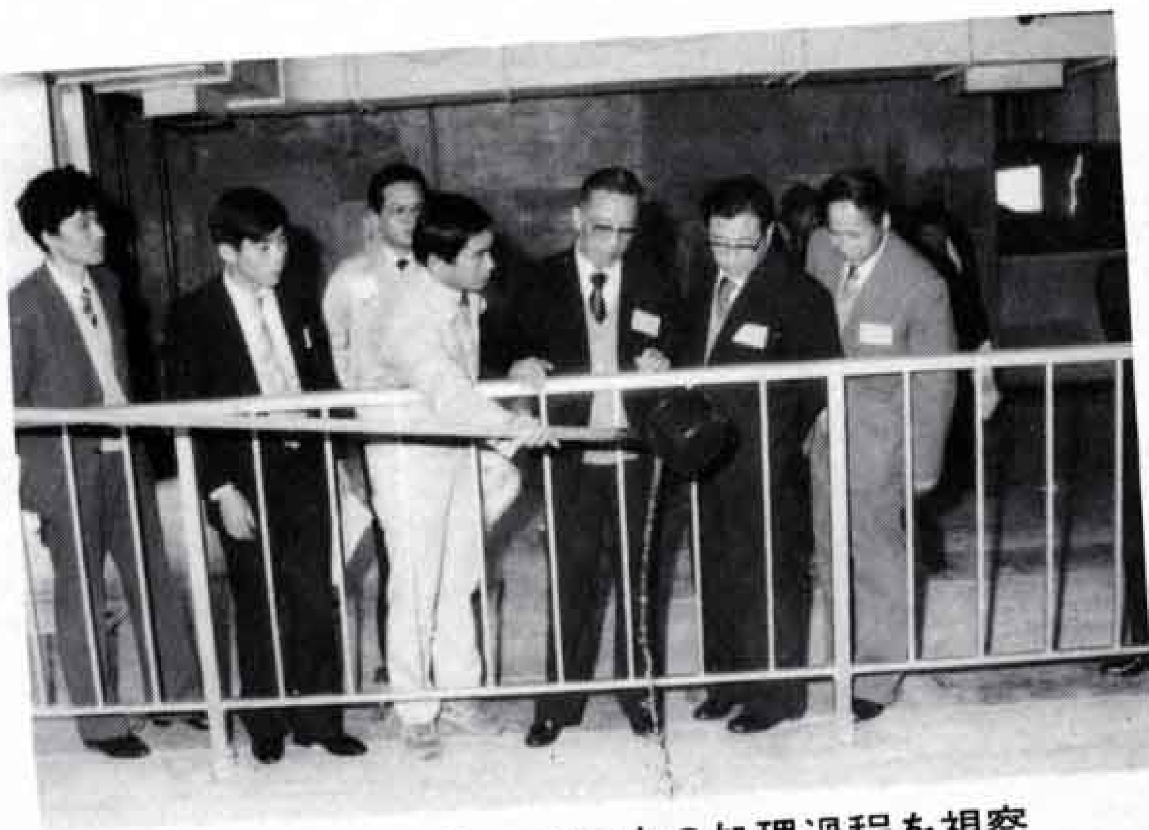
△西部浄化センターで下水の処理過程を視察