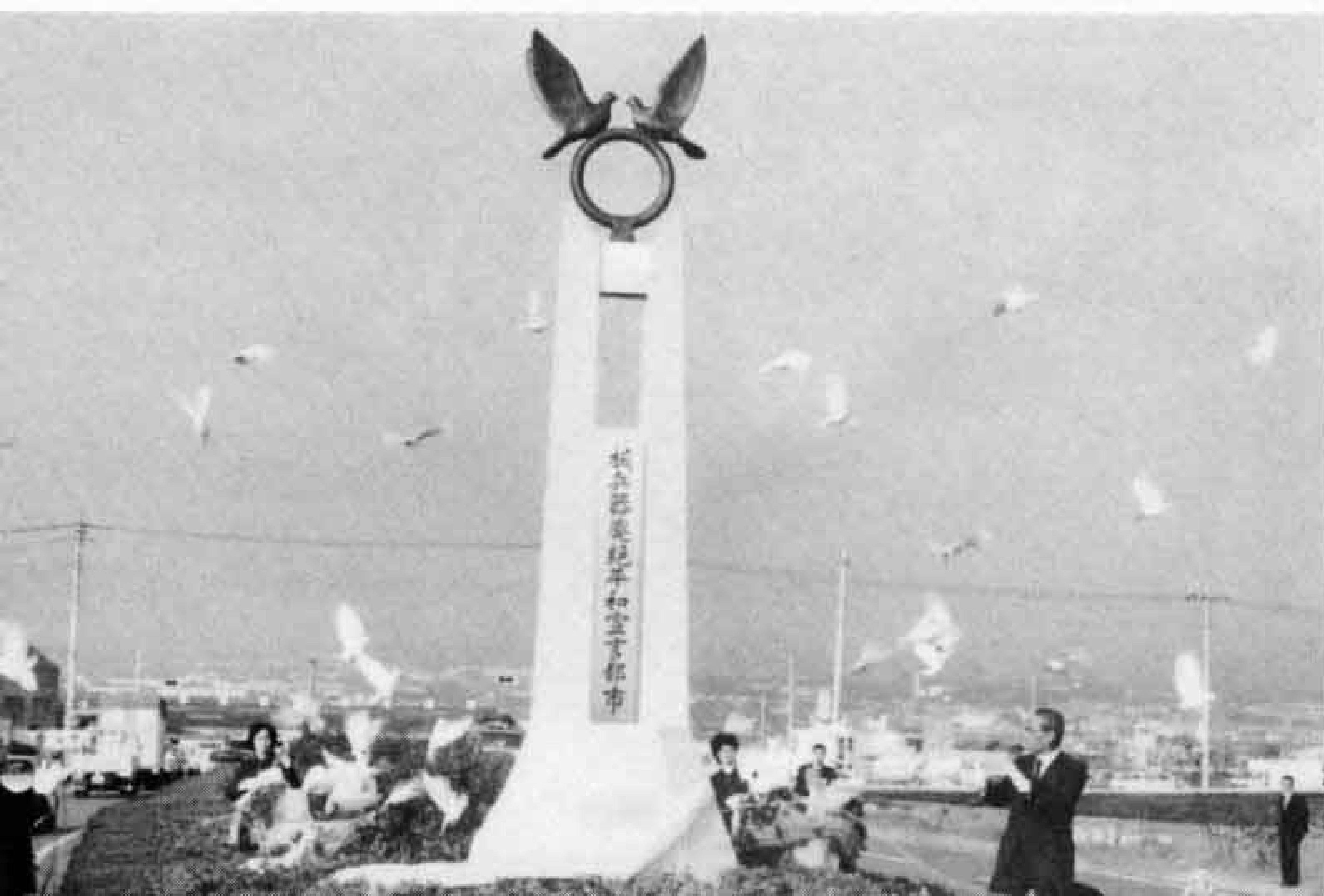
△除幕と同時にハトが大空に向かい飛び立つ

「核兵器廃絶平和都市」を宣言して1周年を迎えた11月19日、田子浦伝法線中央分離帯に「平和都市宣言塔」が建てられ、除幕式が行われました。高さ5mのコンクリート製の宣言塔は、一人の人間が大空に向かって両手を広げ、地球をささえ、その上に平和のシンボルである2羽のハトが羽ばたく姿をあらわしています。