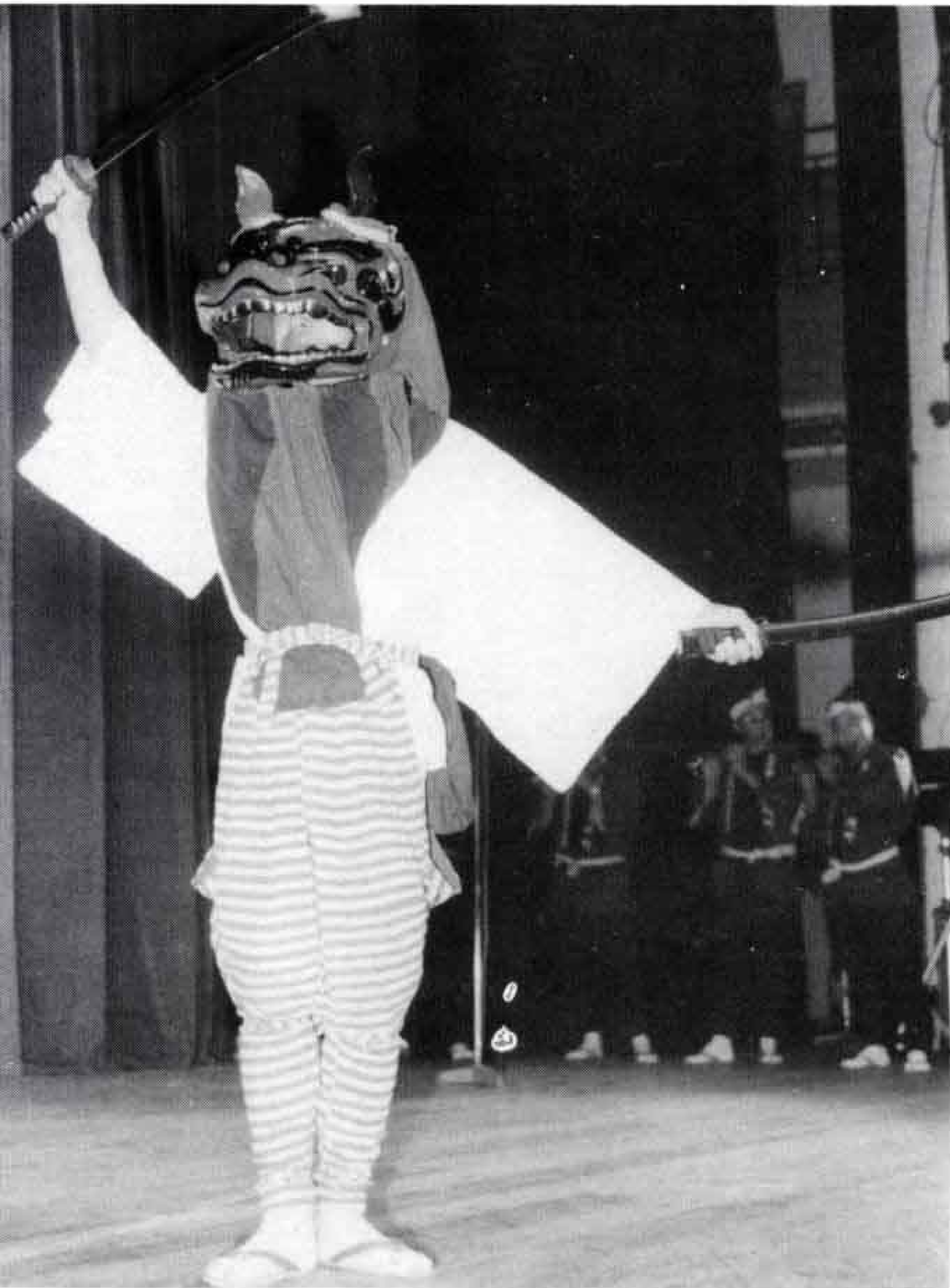
△鶴無ヶ渚神楽保存会による「剣の舞」