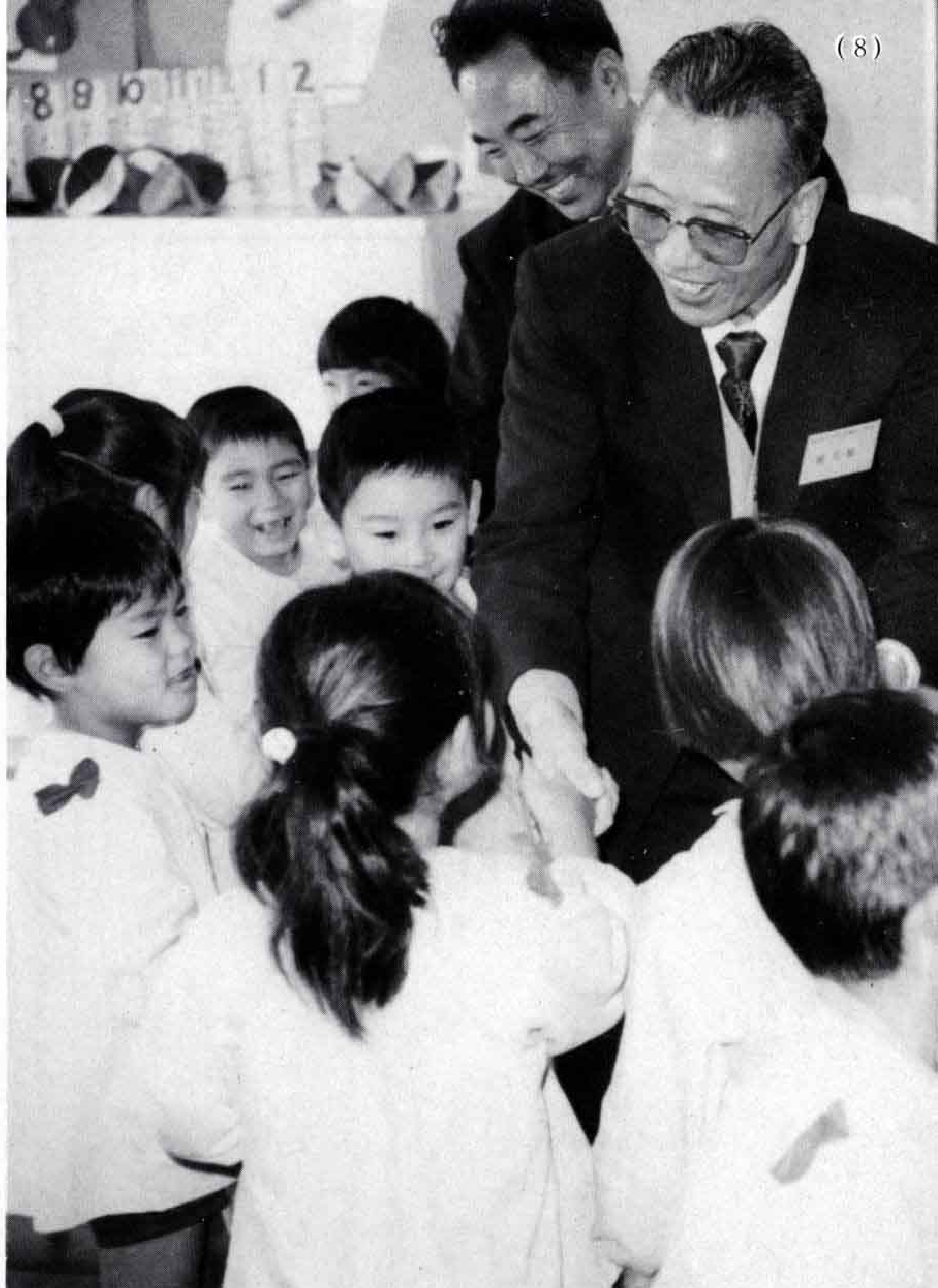
△「ニーハオ」田子浦幼稚園の園児に握手で歓迎を受ける幹団長