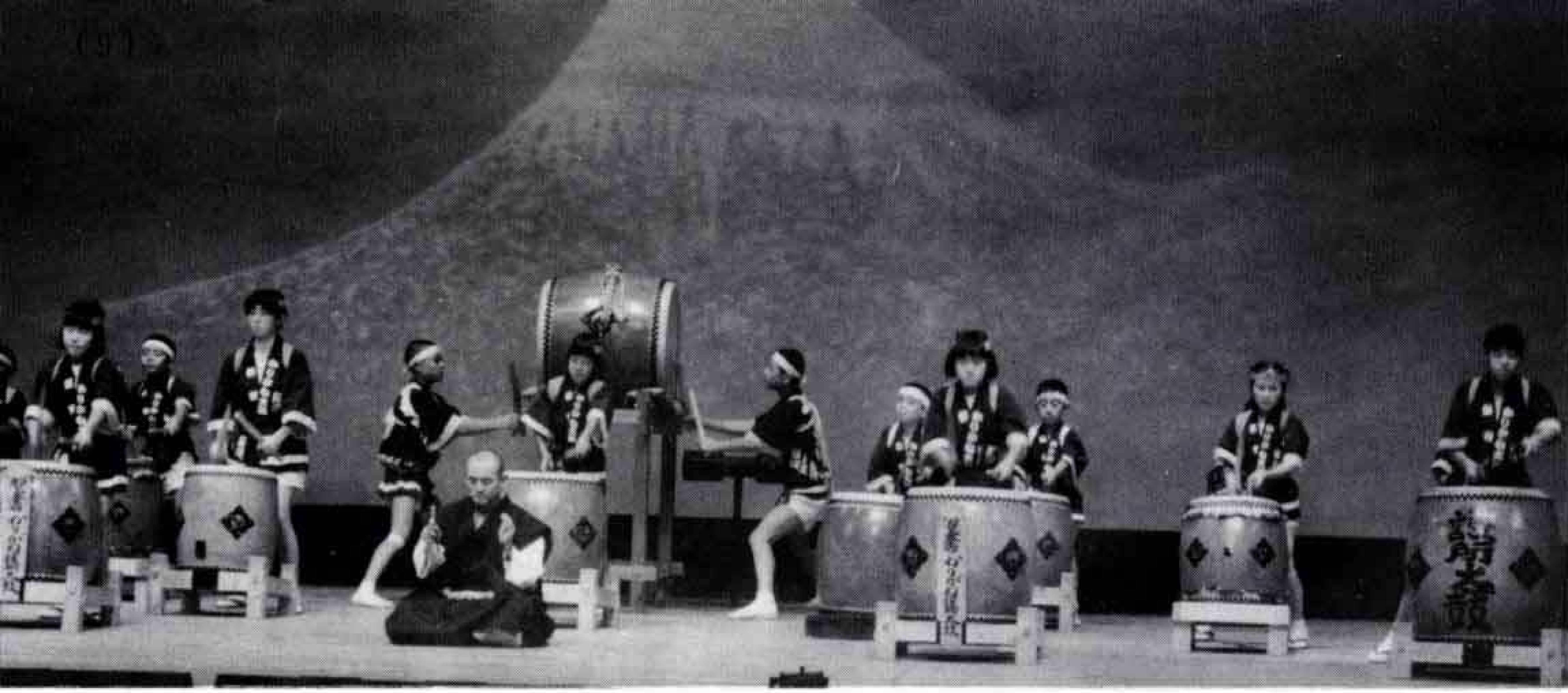
△オープニングはかりがね護所太鼓

ことしの芸能祭は、新市二十周年記念行事を兼ね、例年になく多数の団体が参加しました。太鼓を初め、獅子舞、大龍の舞、民謡、祭りばやしなど多彩な演技に、観客は盛大な拍手を送っていました。