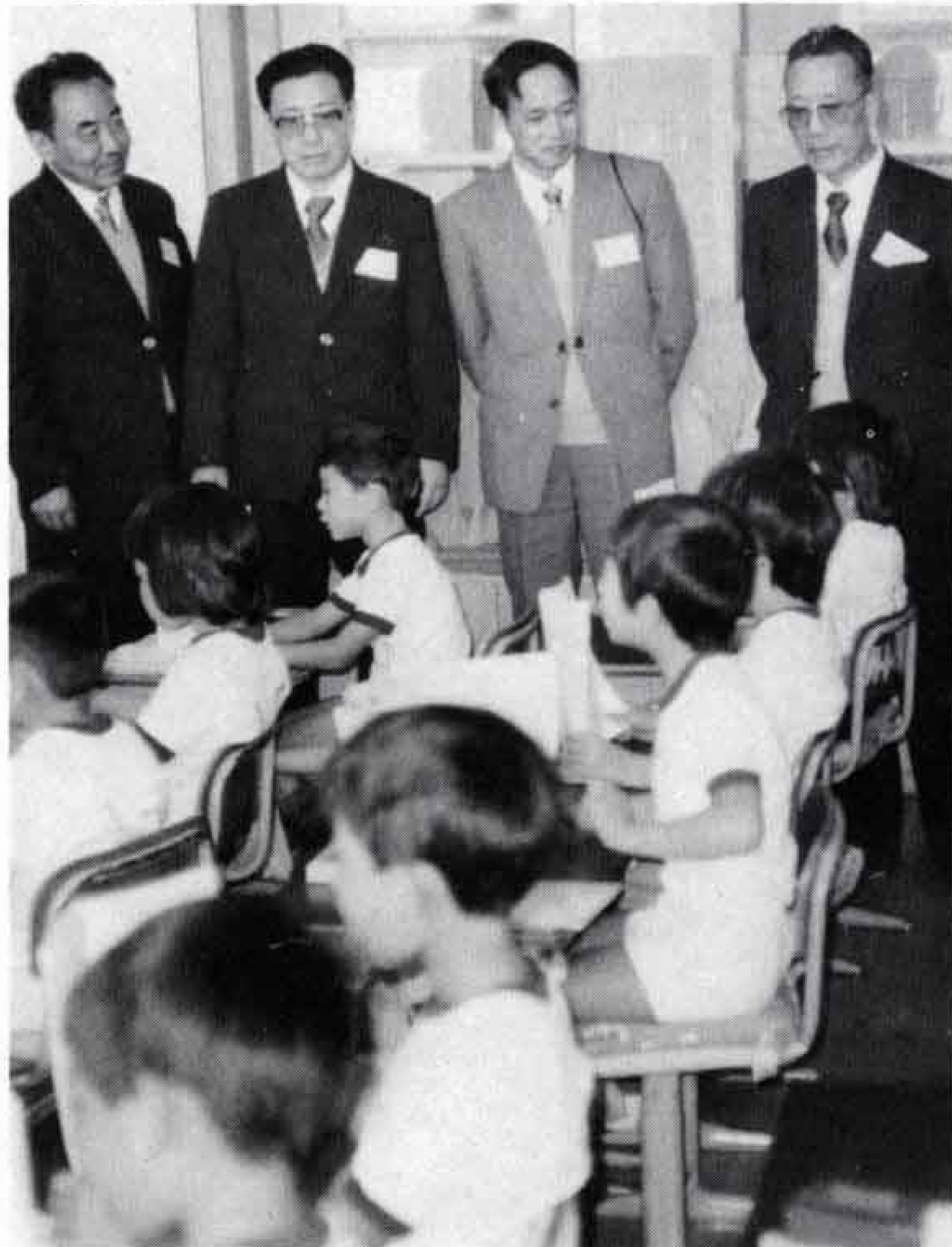
△田子浦小学校で授業の様子を見学