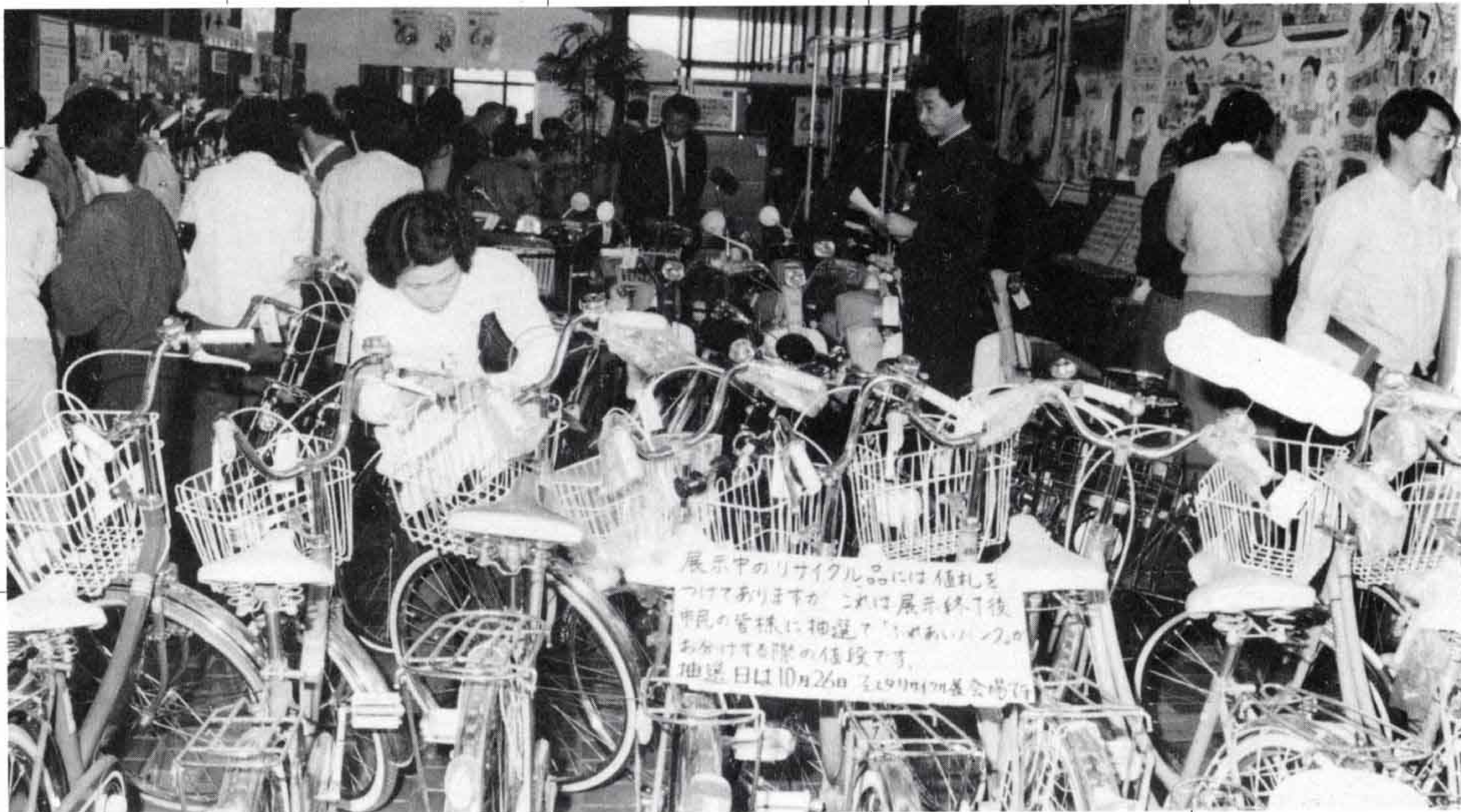
△修理再生され見事によみがえた品々