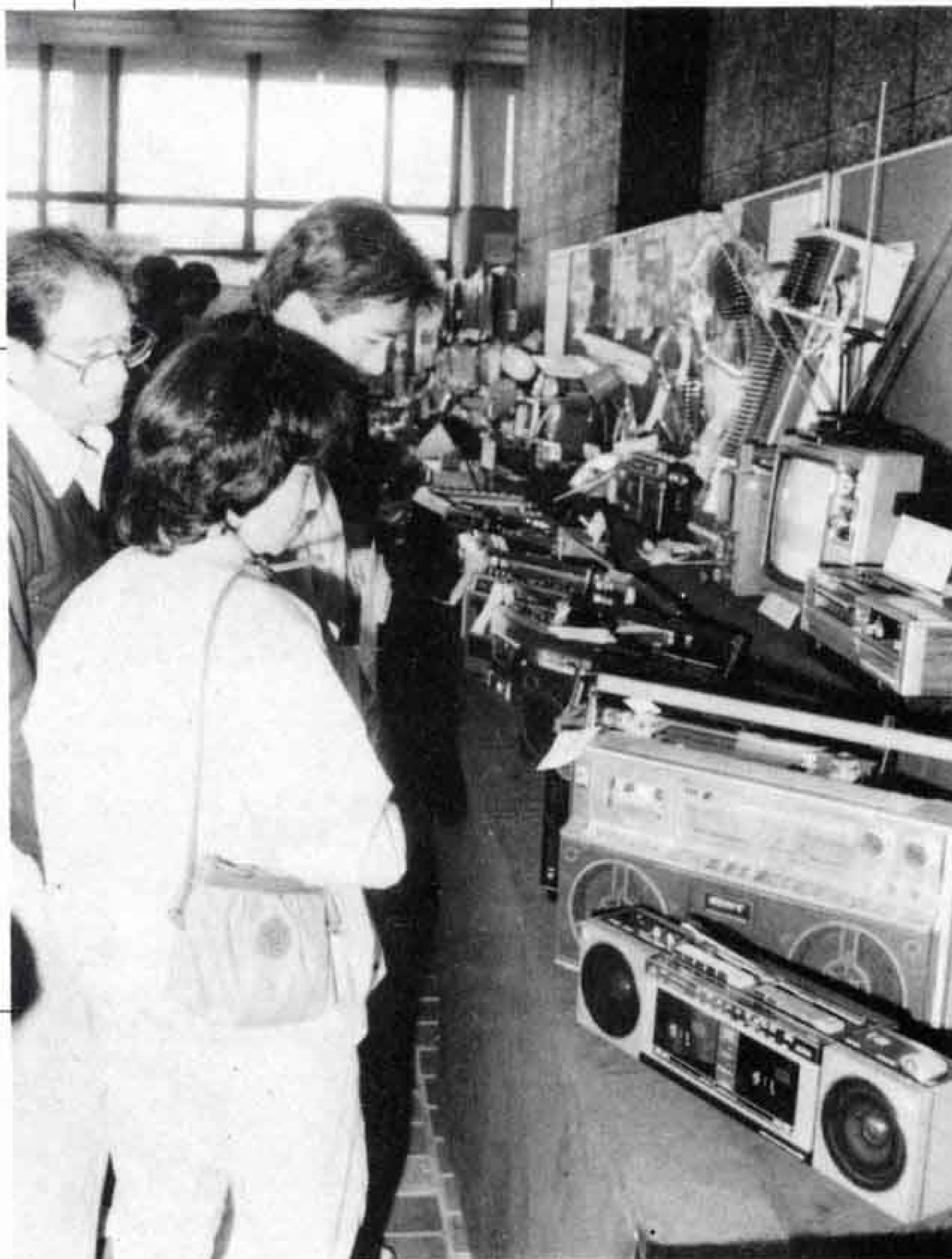
△「これが捨てられたごみなの…」と感心する市民

一度、生命を失った「物」に再び魂を吹き込ませ、輝きを取り戻そうと、第3回「ミニリサイクル展」が市役所市民ギャラリーで行われました。このリサイクル展は、第一清掃工場の職員たちが、昼休みなどを利用して、修理再生したもので、テレビ、バイク、自転車などの品々が新品同様によみがえりました。