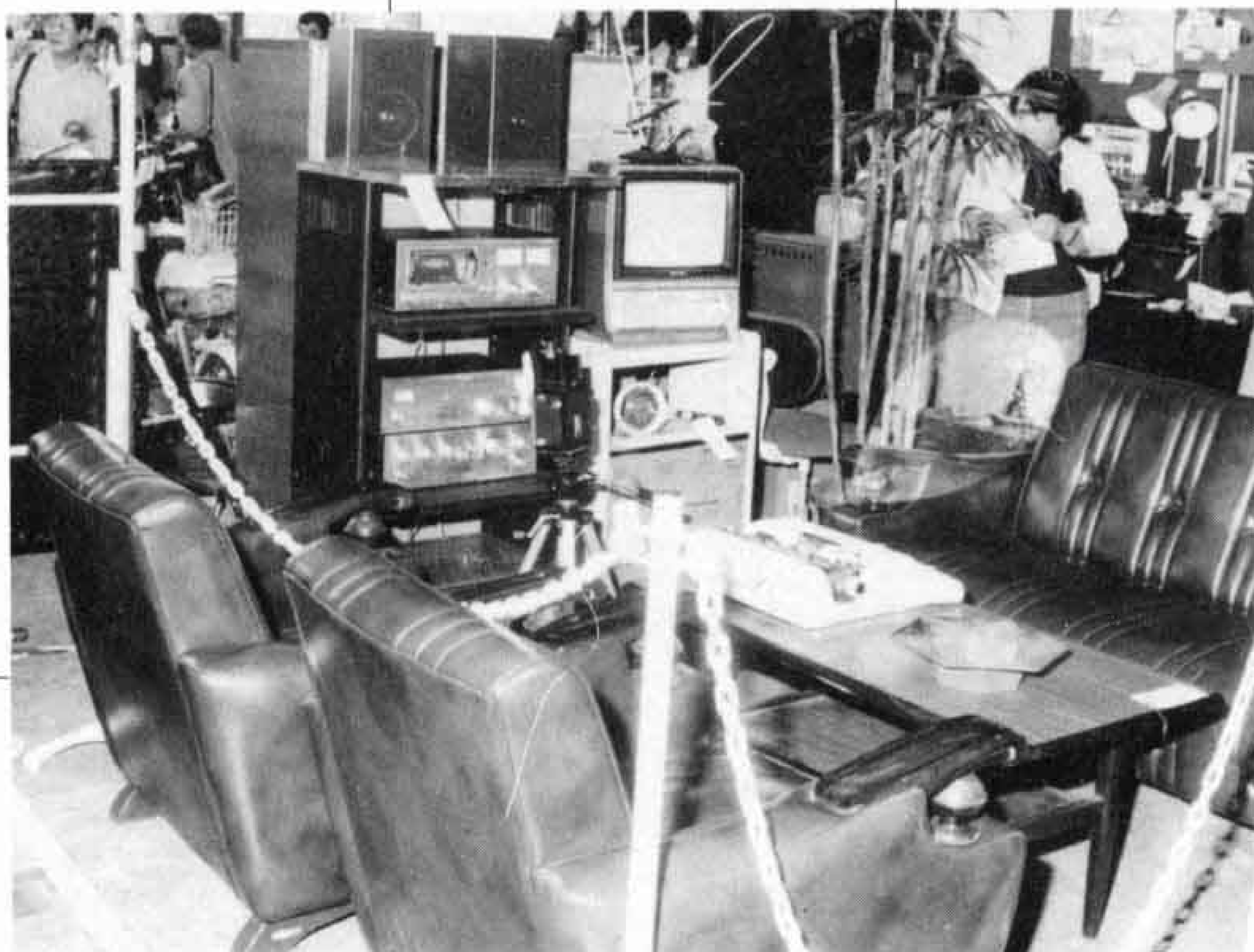
△我が家の応接間より立派？