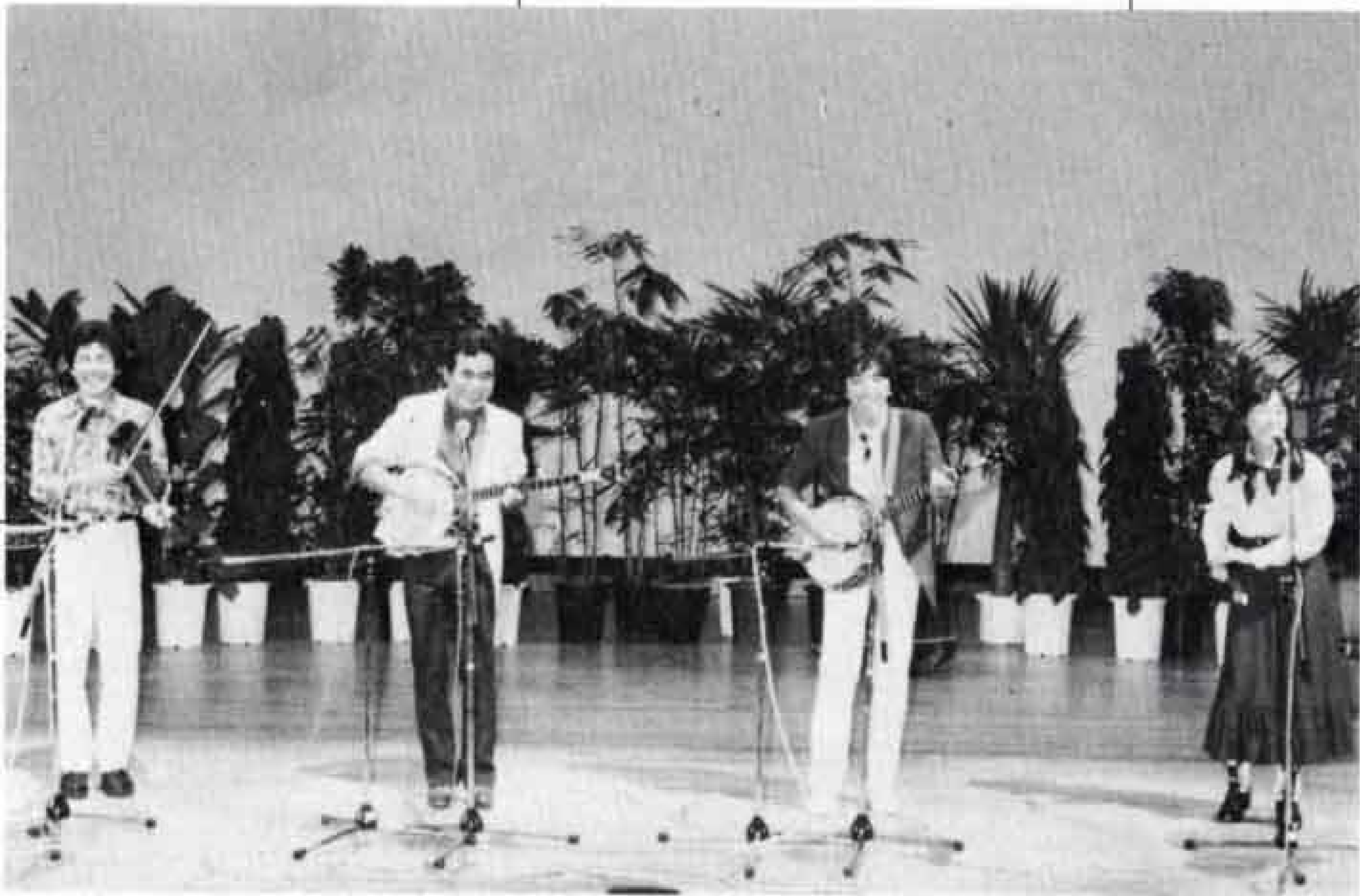
△高石ともやとザ・ニューナターシャ・セブン