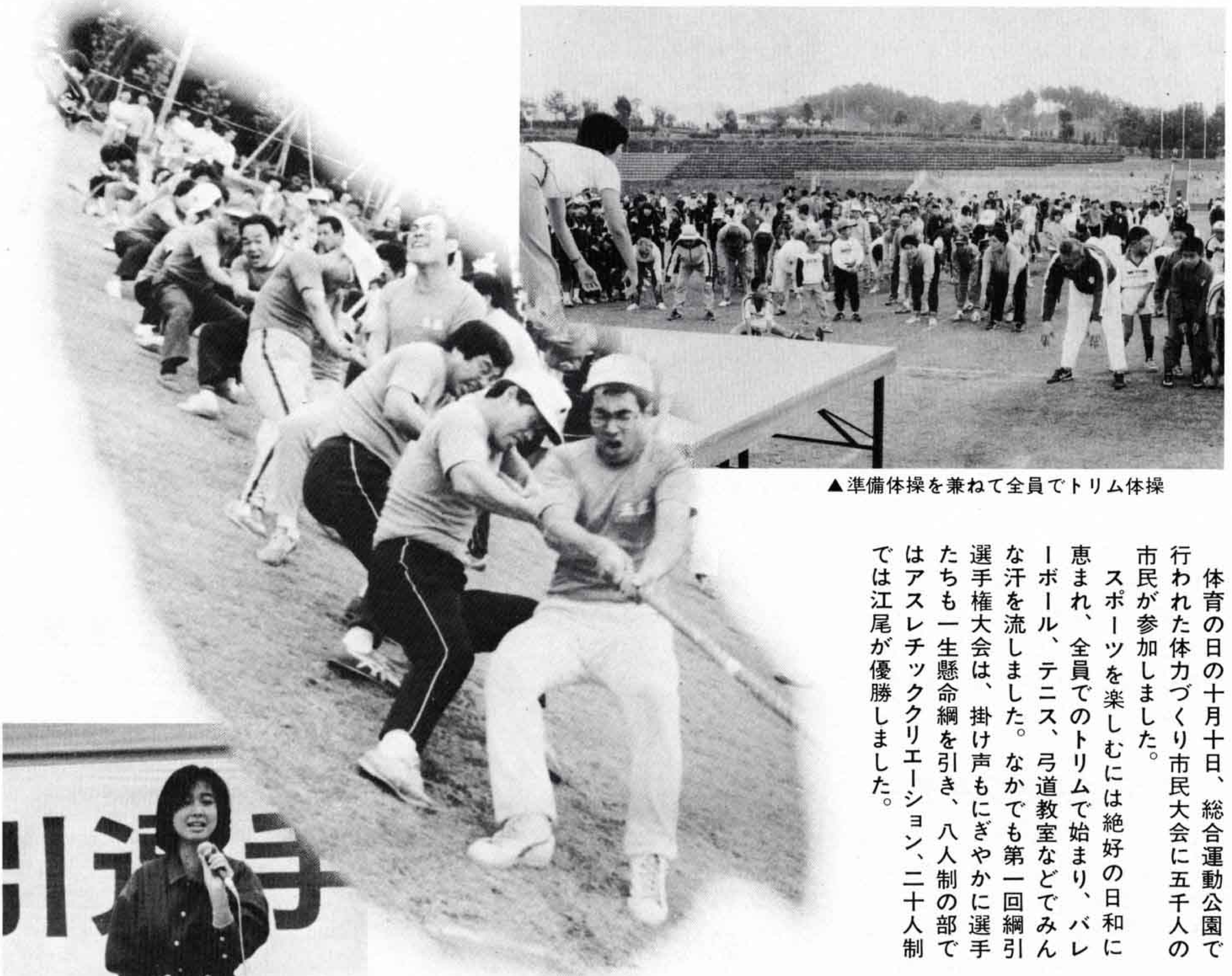
▲準備体操を兼ねて全員でトリム体操

体育の日の十月十日、総合運動公園で行われた体力づくり市民大会に五千人の市民が参加しました。 スポーツを楽しむには絶好の日和に恵まれ、全員でのトリムで始まり、バレーボール、テニス、弓道教室などでみんな汗を流しました。なかでも第一回綱引選手権大会は、掛け声にもぎやかに選手たちも一生懸命綱を引き、八人制の部ではアスレチッククリエーション、二十人制では江尾が優勝しました。