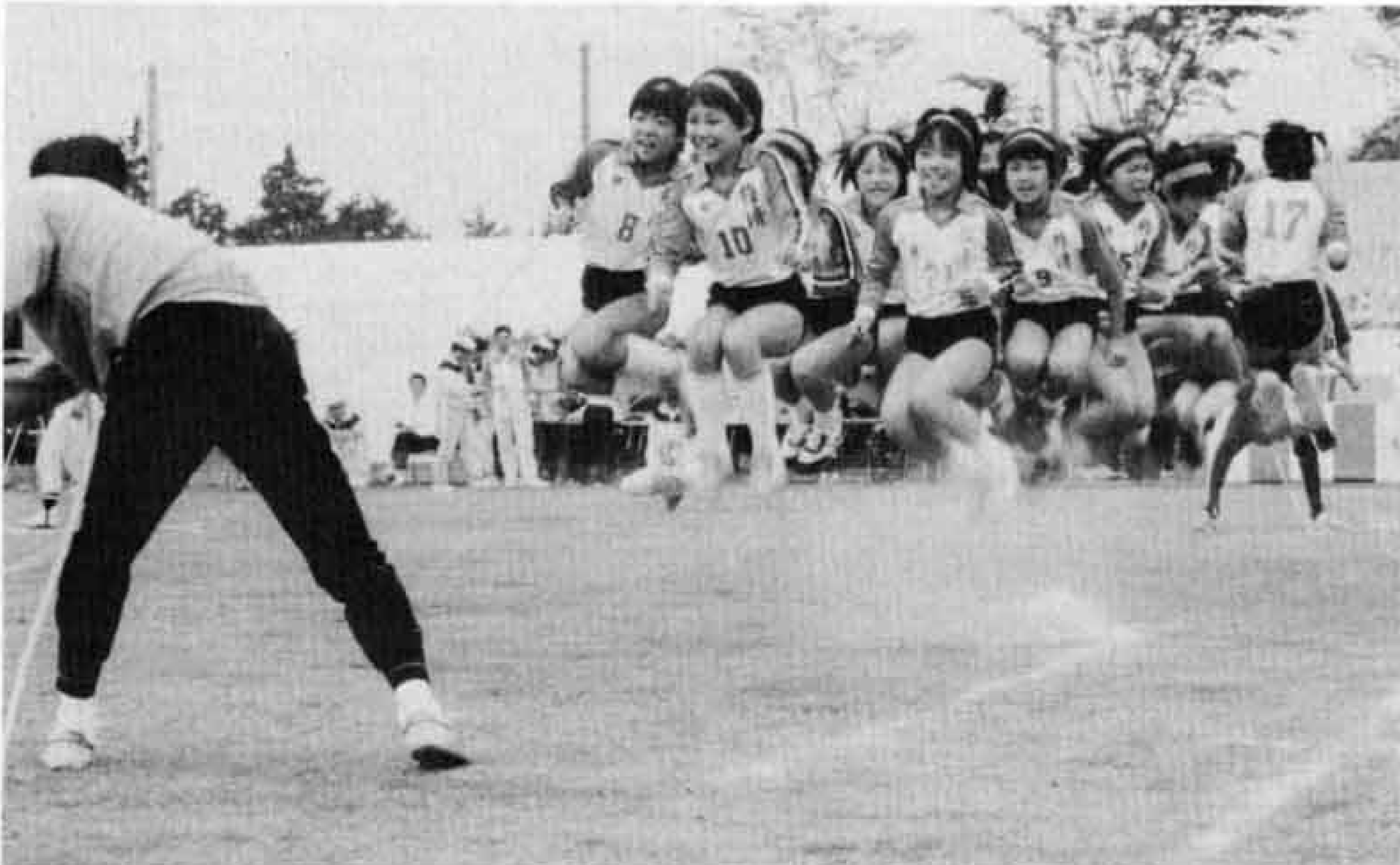
◀みんなの息があっているでしょう！