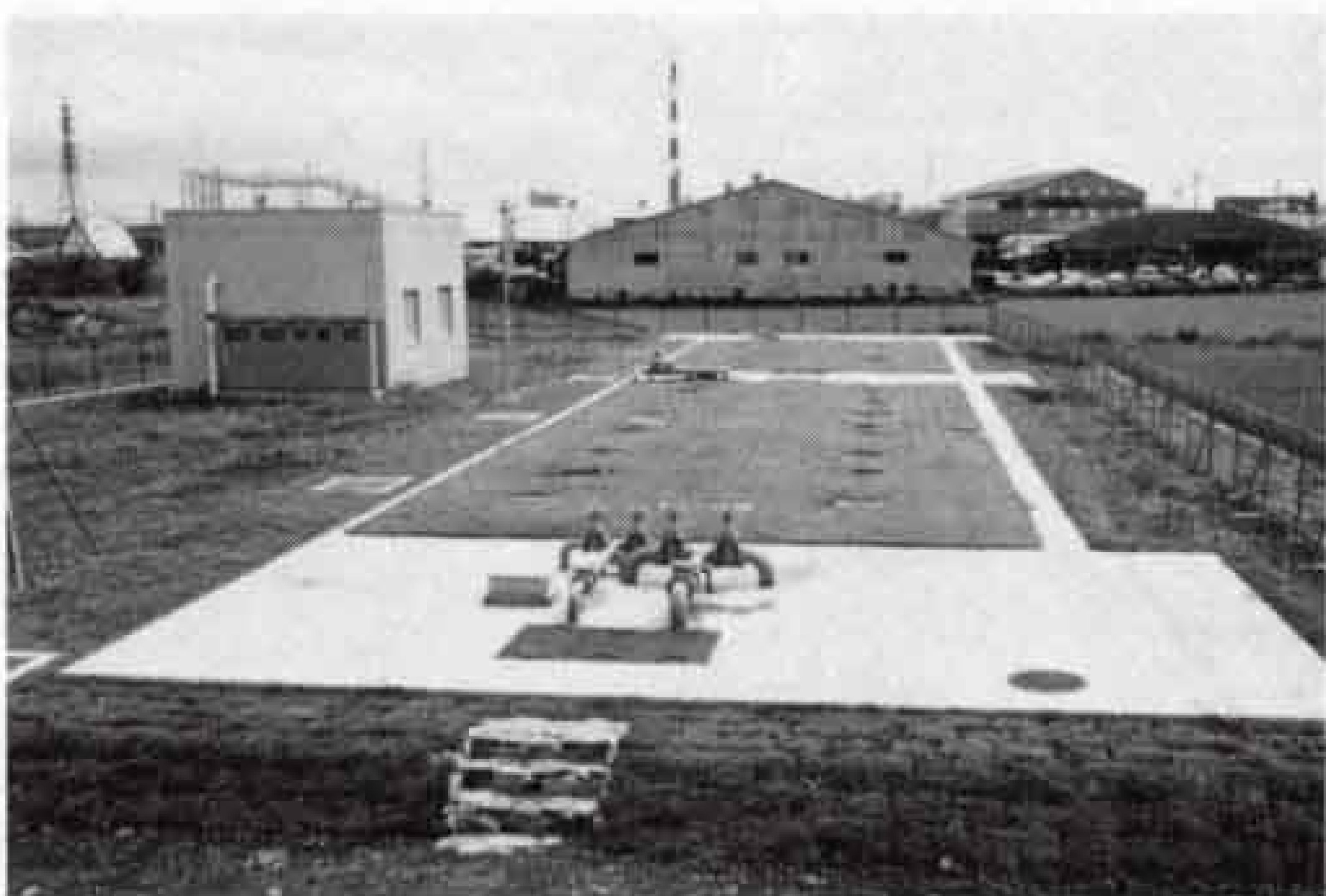
△全国で初めての処理方式「礫間接触酸化法」を採用した吉原下水道処理場

本市の下水道処理場では、いろいろな工夫を凝らし、全国的にも珍しい処理方法を採用しています。吉原下水道処理場では、割石を敷き詰め、汚水が割石の間を流れていくうちに水をきれいにする「礫間接触酸化法」をまた、富士見台処理場では土壌微生物を利用した土壌脱臭法を採用しており、現在建設中の東部浄化センターでもこの方式で脱臭します。