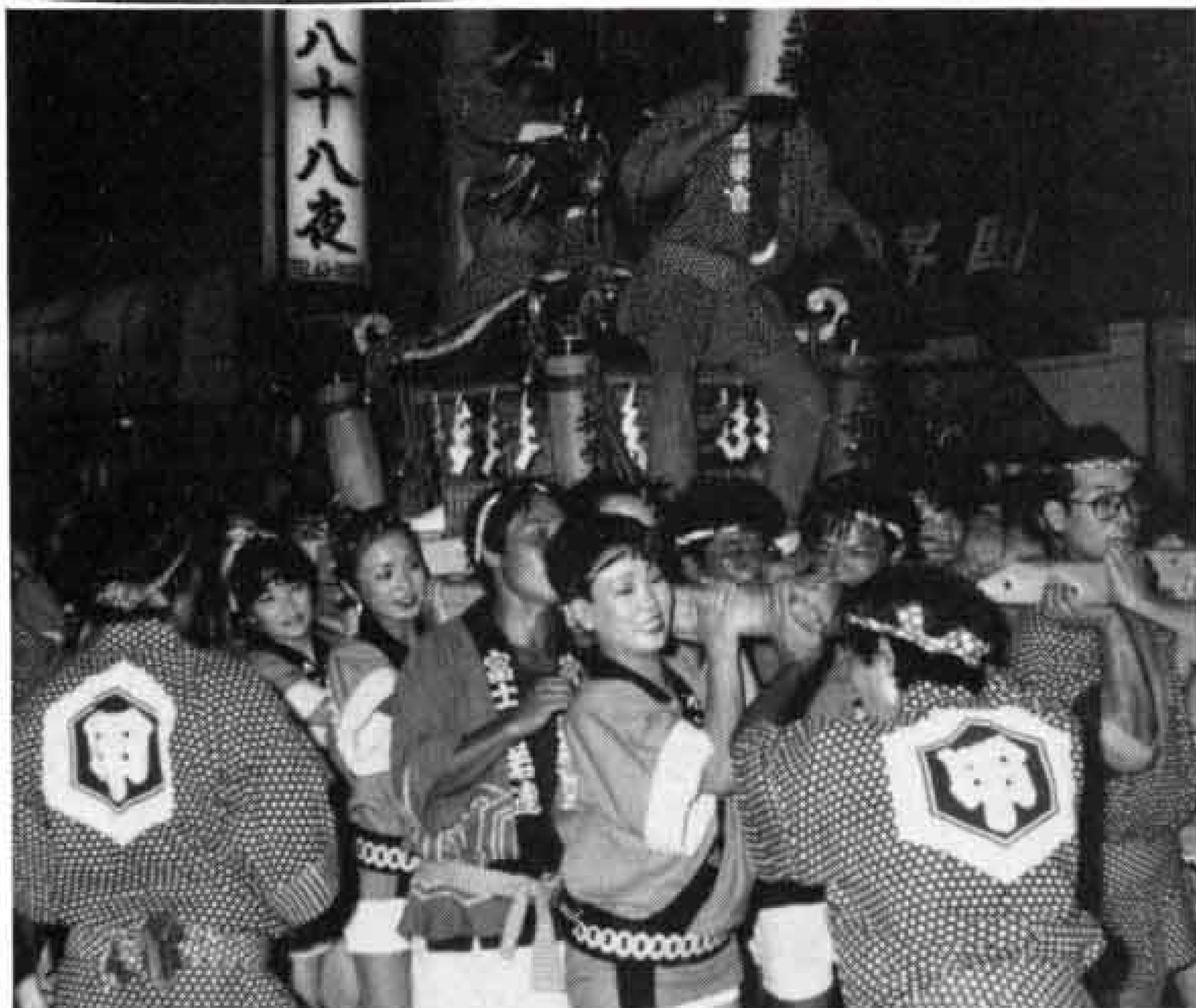
△甲子さんは駅北地区の代表的な祭り