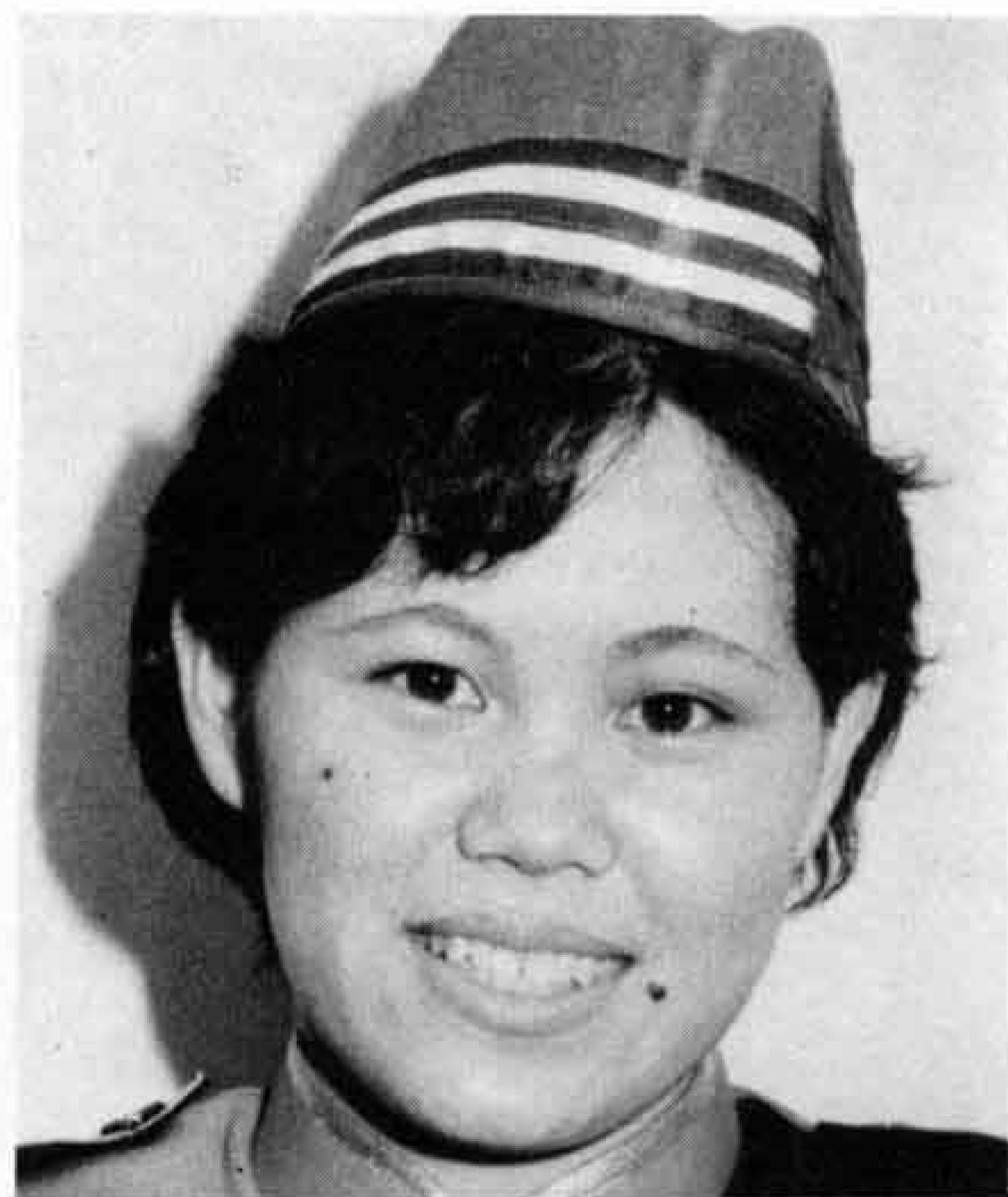
富士まつりでデビューした カラーガード隊 初代隊長