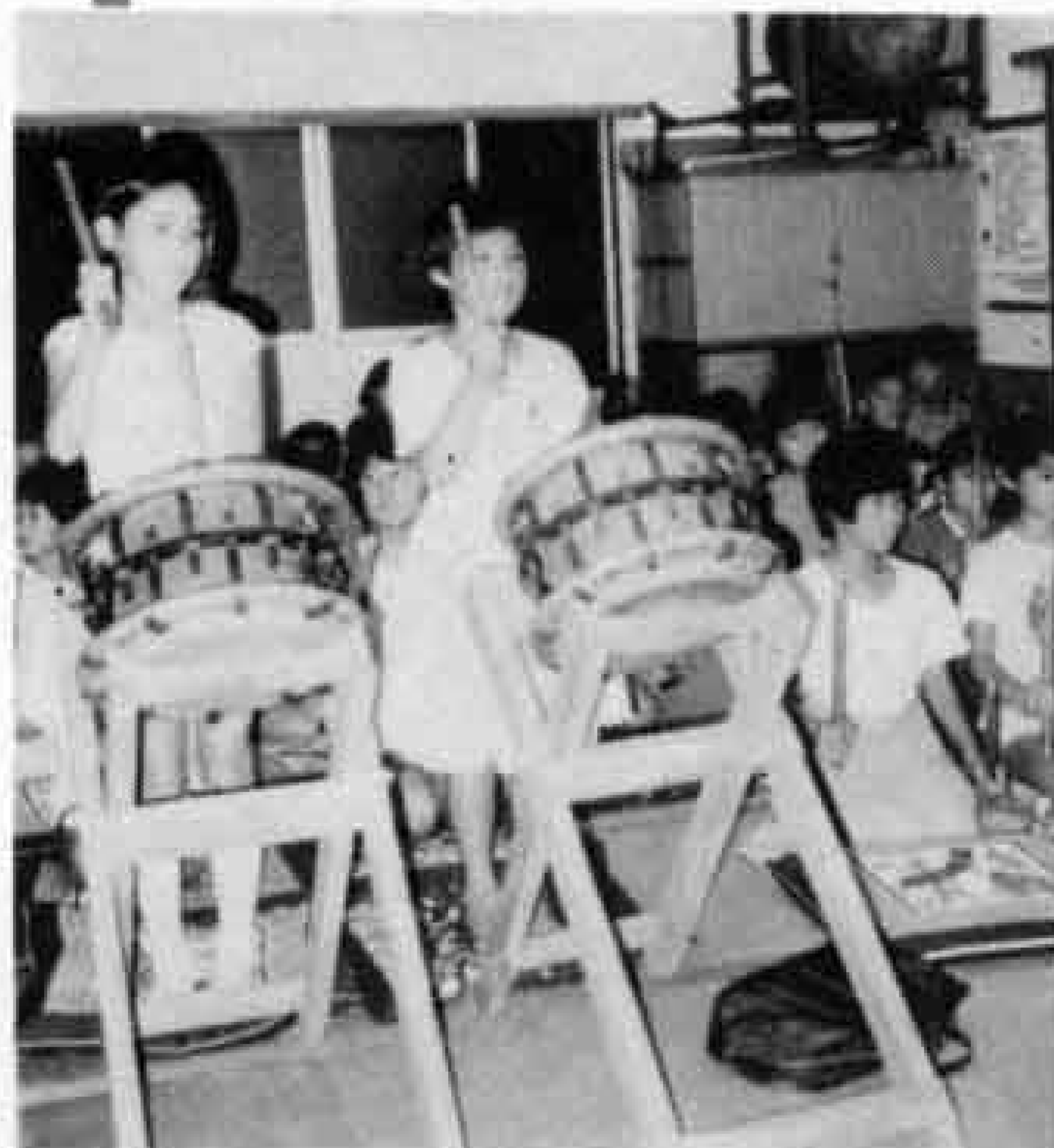
祭りは粋だよ 富士町拓栄会の皆さん

神社周辺や川の土手には、竹が群生し、子供のころは竹とんぼや竹鉄砲などをつくり、よく遊んだものです。いまの子供たちは、遊び場が減ったという点ではかわいそうですね。国道一号線は一時、富士川橋から本市場まで車がつながるほど渋滞し、住民としては困りましたが、交通の便がよいというのは、やはり発展の原因でしょう。駅北の人々は、地域の祭りや行事に熱心で、世代間や住民間のギャップが少ないのが特徴だと思います。若い人たちの活躍で、まだまだ発展すると思います。