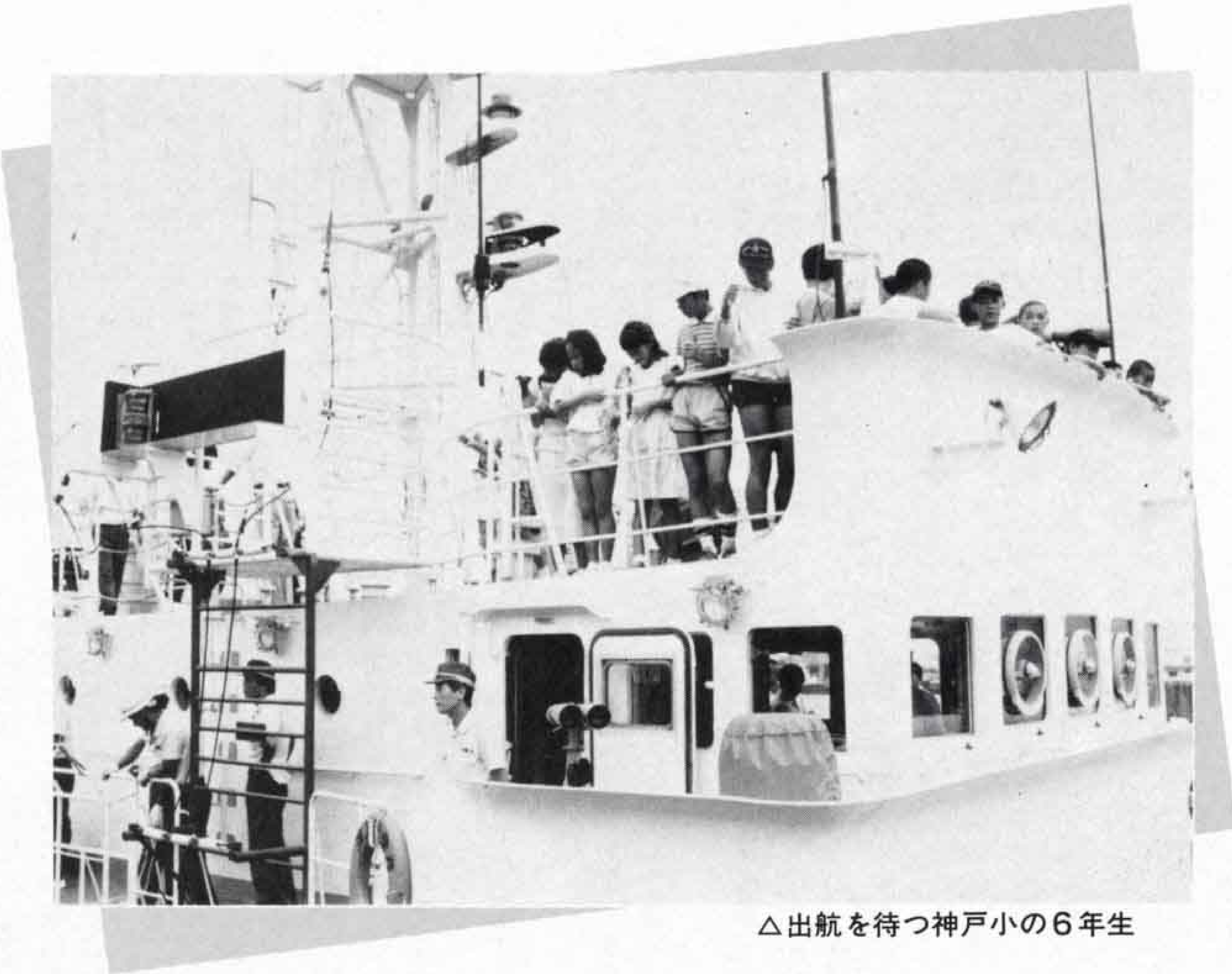
△出航を待つ神戸小の6年生

七月二十一日、「海の記念日」の行事として、駿河湾一周の体験航海が行われました。この日招待された神戸小学校の六年生約百人は、海上保安庁の巡視船「おきつ」に乗り込み、一時間の航海を楽しみました。また、市役所一階の市民ギャラリーでは、帆船の写真展も開かれました。