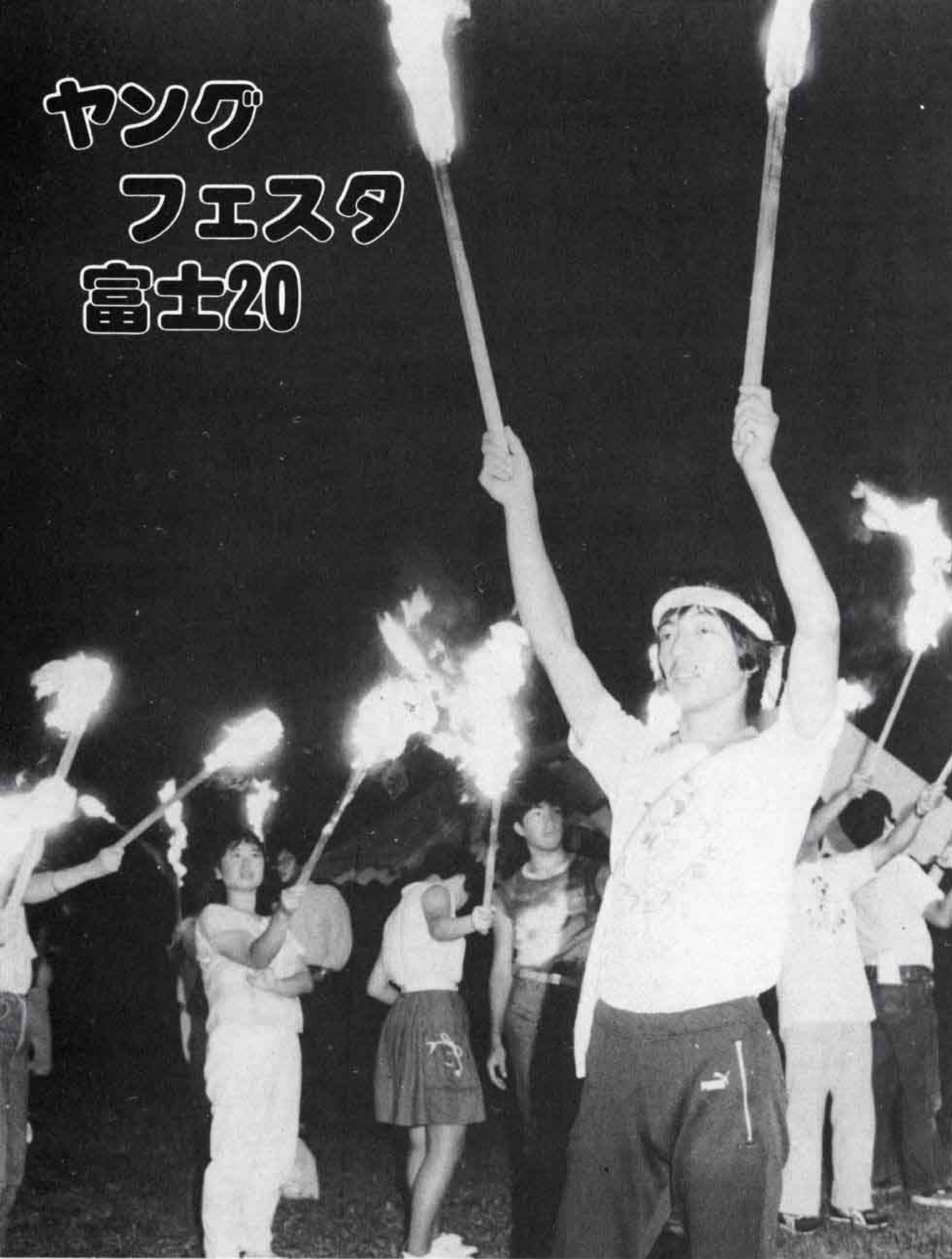
△ 心に焼きついた、たいまつ flame