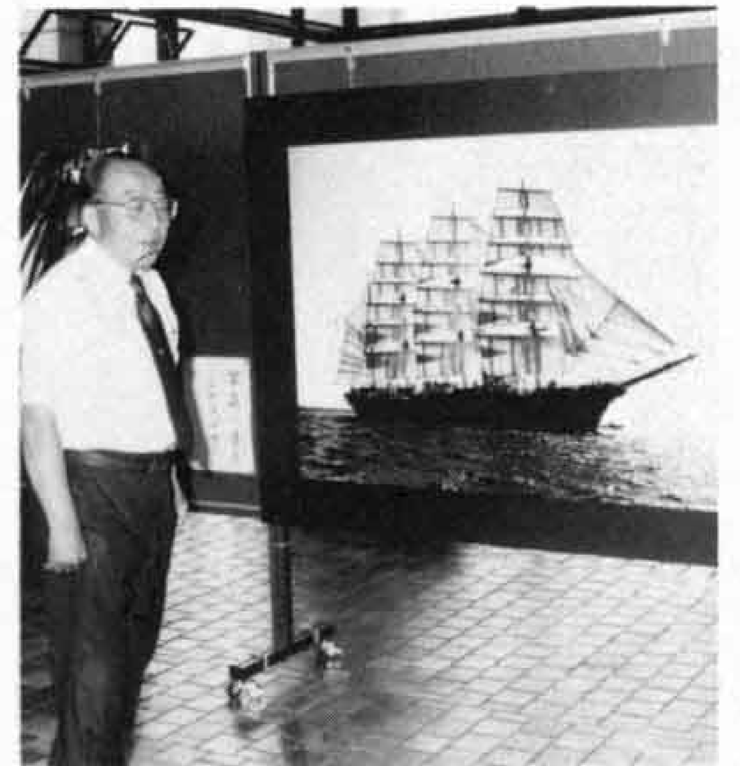
△美しい帆船の写真展