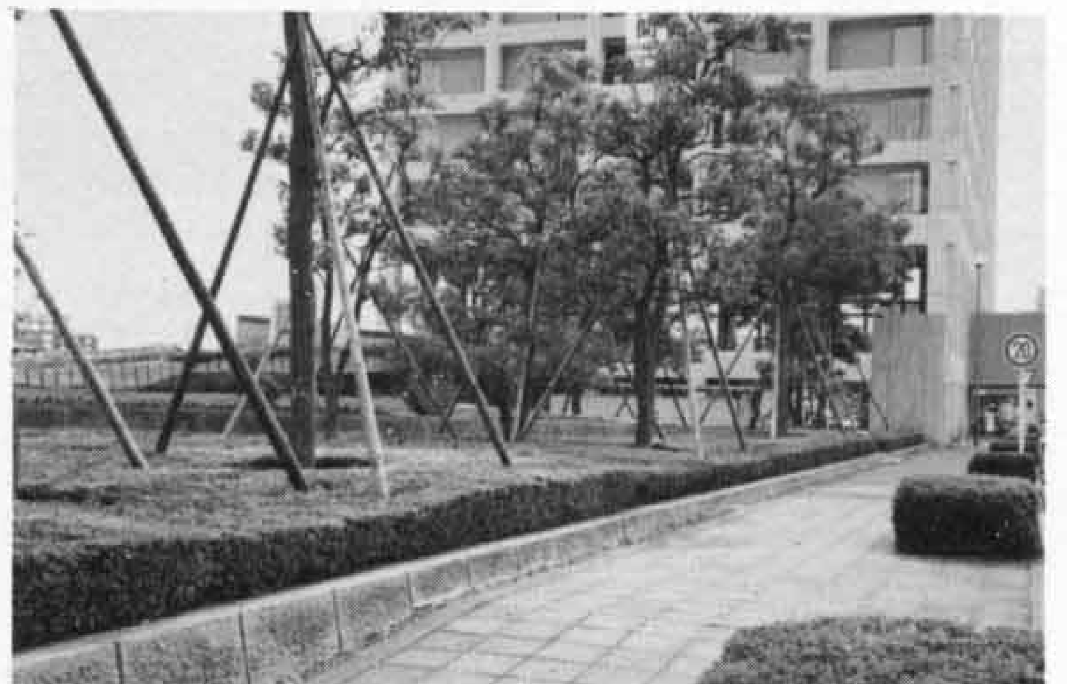
▼会員の定期的な手入れで、市庁舎周辺はこのとおり

また、富士市を初め、全国のシルバー人材センターの要望であった「高齢者等の雇用の安定等に関する法律」により、シルバー人材センターが法的にも認められ、これに基づく富士市シルバー人材センターに対する国の評価は、Aランクです。これは、会員数六百人以上、月平均の就業延べ人数が三千五百一人以上の事業団に与え