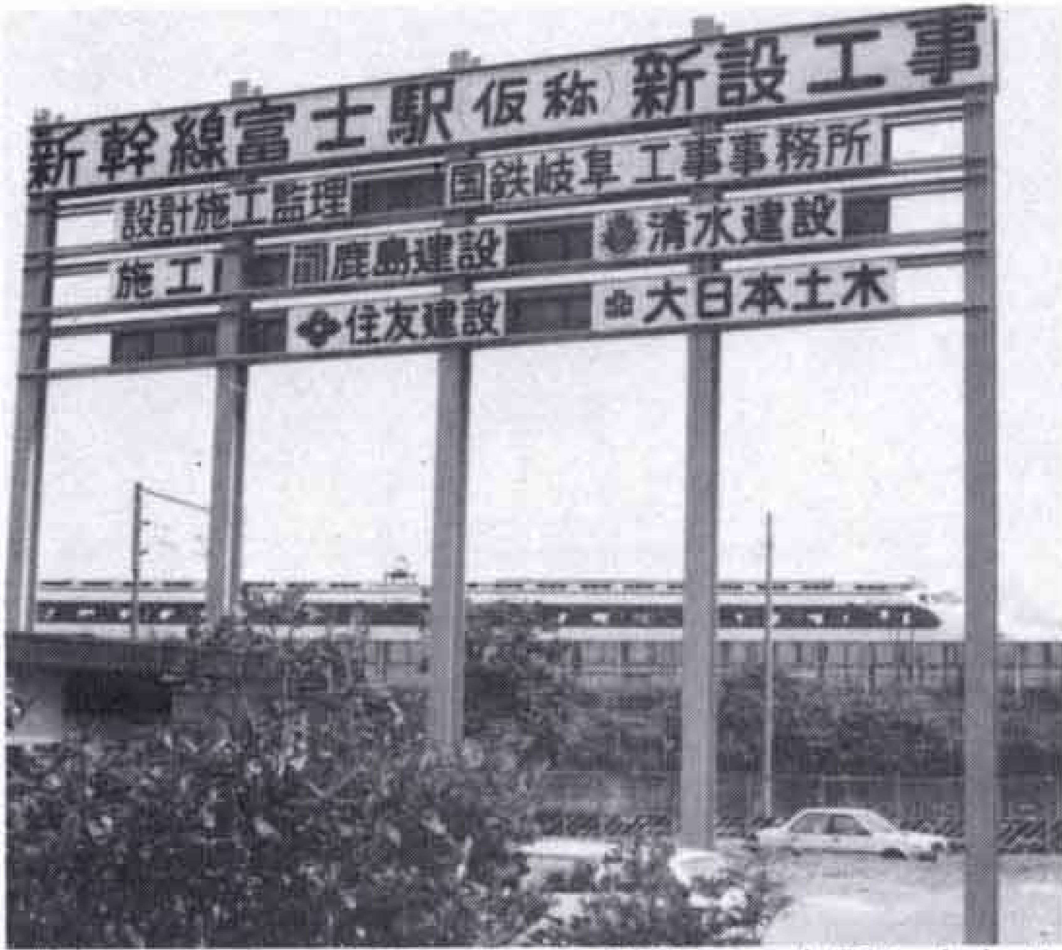
△新しい富士の玄関口は田子浦地区の玄関ともなります（急ピッチで進む新幹線駅工事）