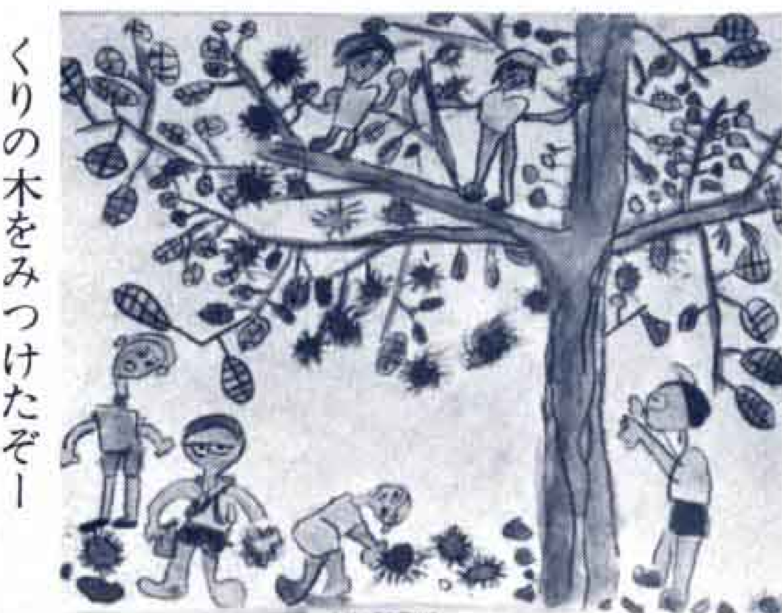
くりの木をみつけたぞー