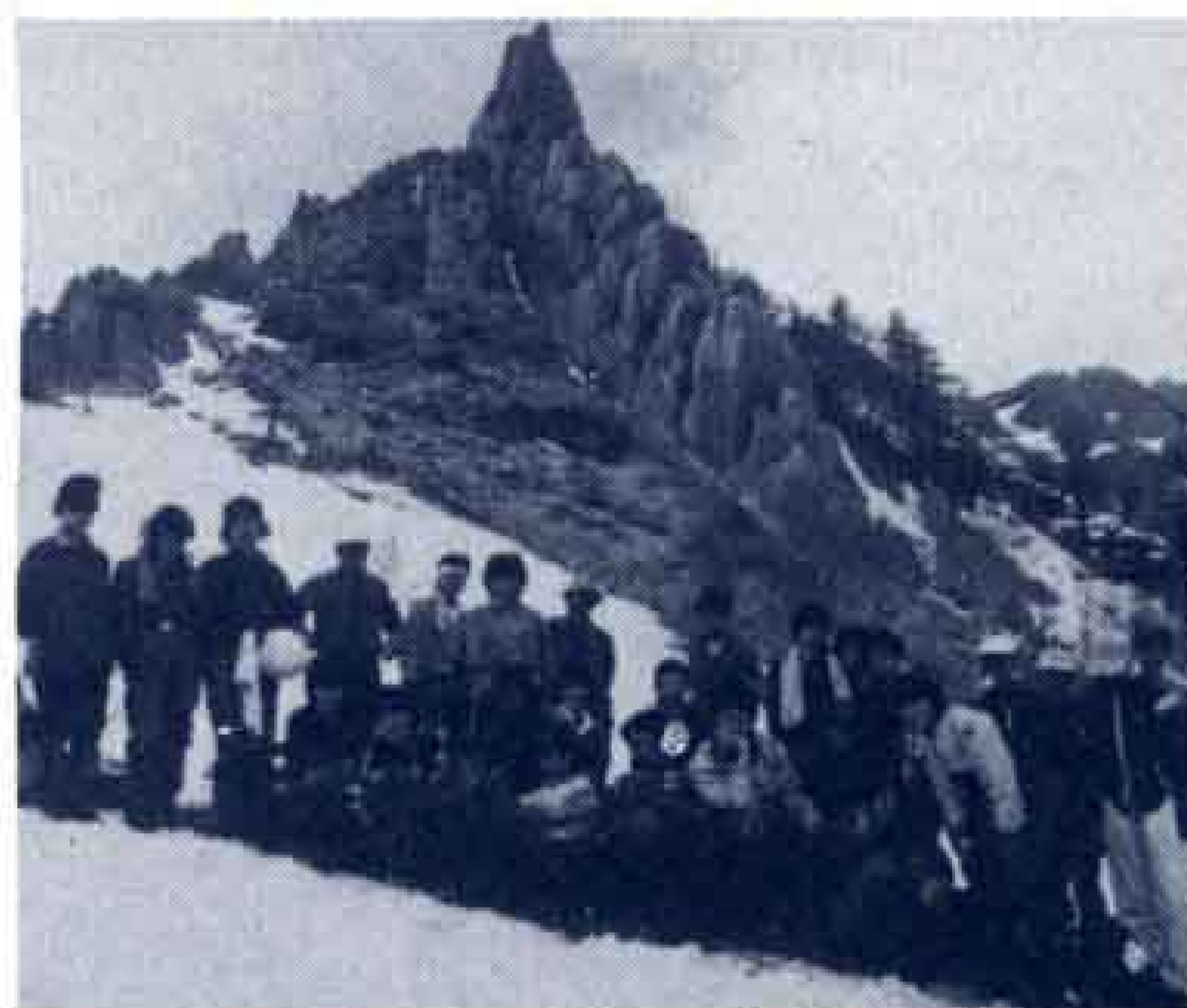
▼南アルプス地蔵岳にて

“ワンダーフォーゲル部”一すなわち“登山部”のことです。この部には、他の運動部では味わえない味があります。“山に登る”ということは、実に苦しい動作であることは、皆さんも一度は経験があるでしょう。しかし、大自然を知り、愛するこの“山登り”は、苦しみ以上の感激を我々に与えるのです。