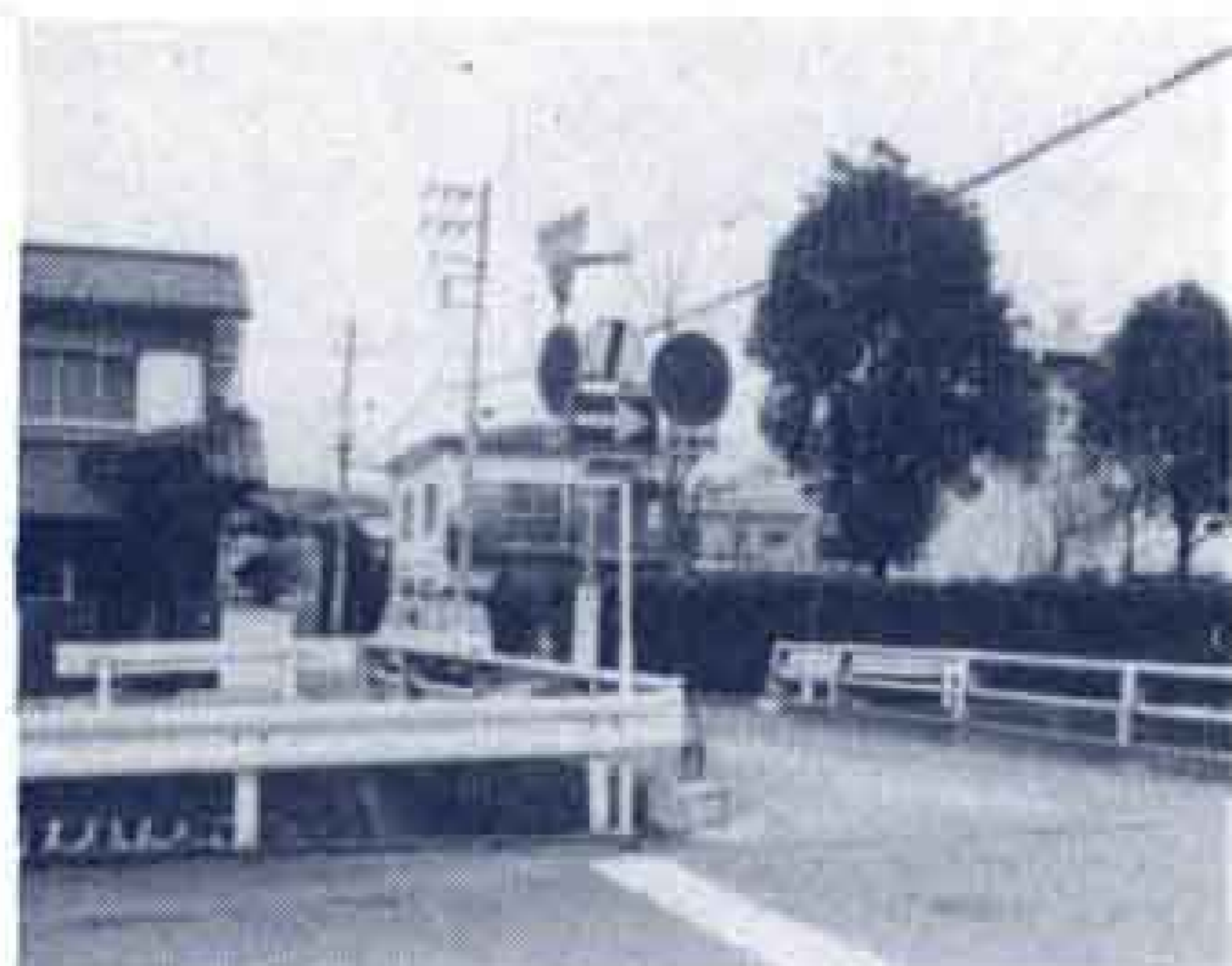
跡地は民家と公園になっています

この建物は、昭和16年吉原警察署の武徳殿（精緻館）として建築されましたが、大東亜戦争勃発のため使用禁止となり、一時期、結婚式場に利用されました。戦後、吉原市役所として使用され、昭和45年、新庁舎完成とともに取り壊されました。