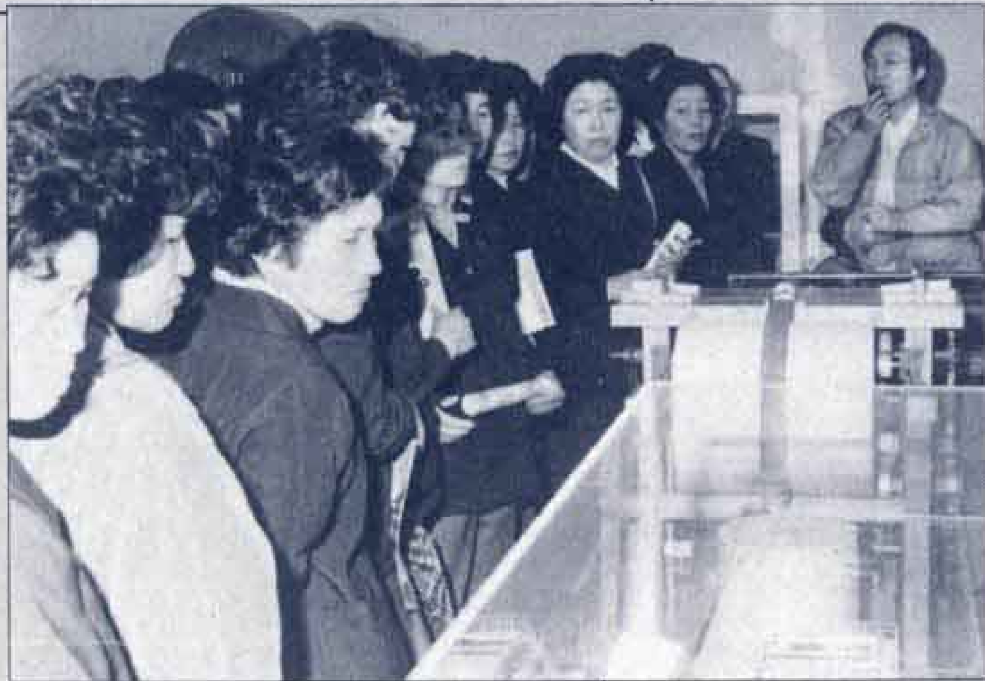
△紙について博物館職員から説明を受ける