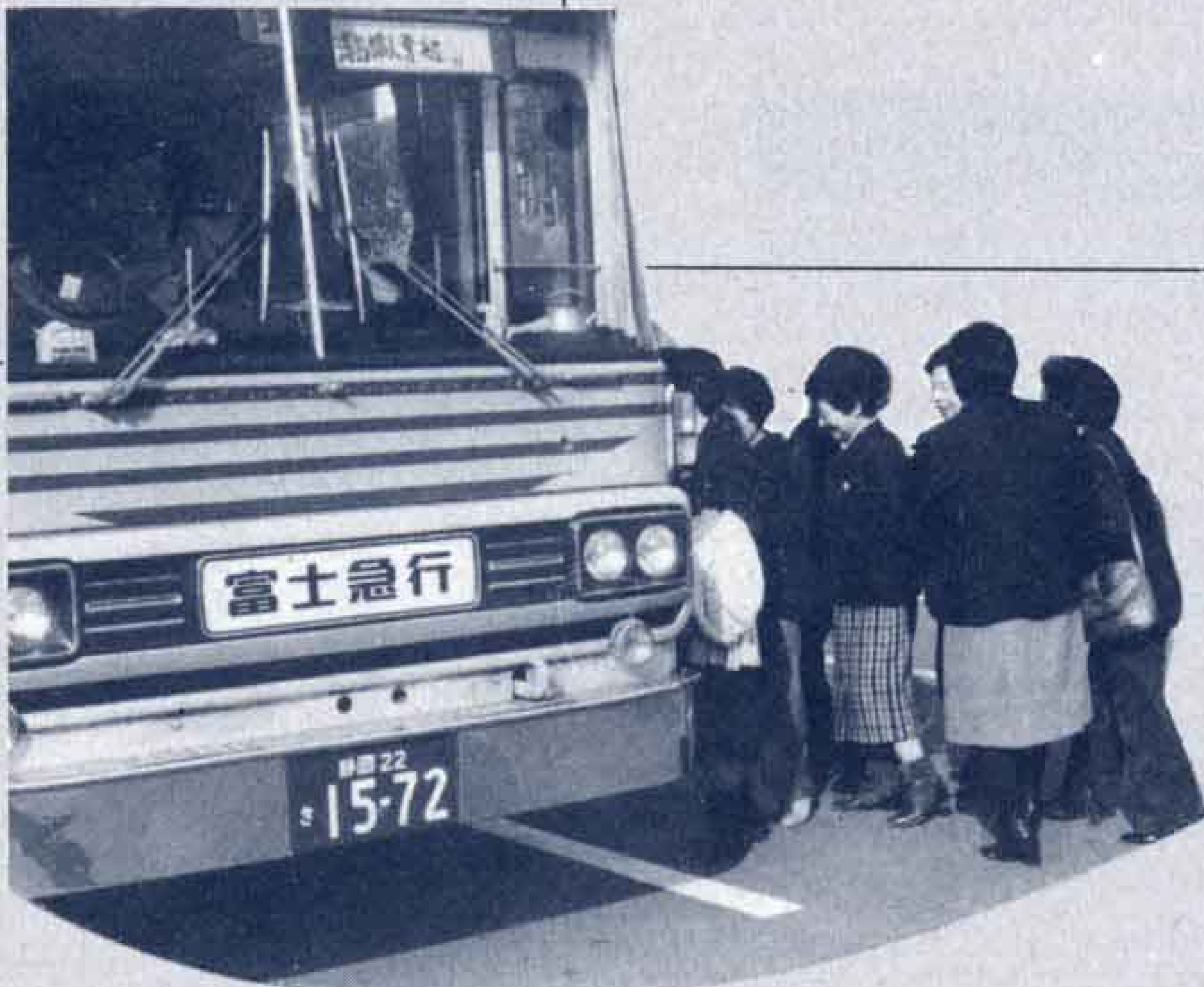
△さあ今から施設めぐりに出発進行…

市内には数多くの公共施設があります。そこで市は、市民の皆さんに市内の公共施設を知ってもらおうと公共施設見学を実施しています。