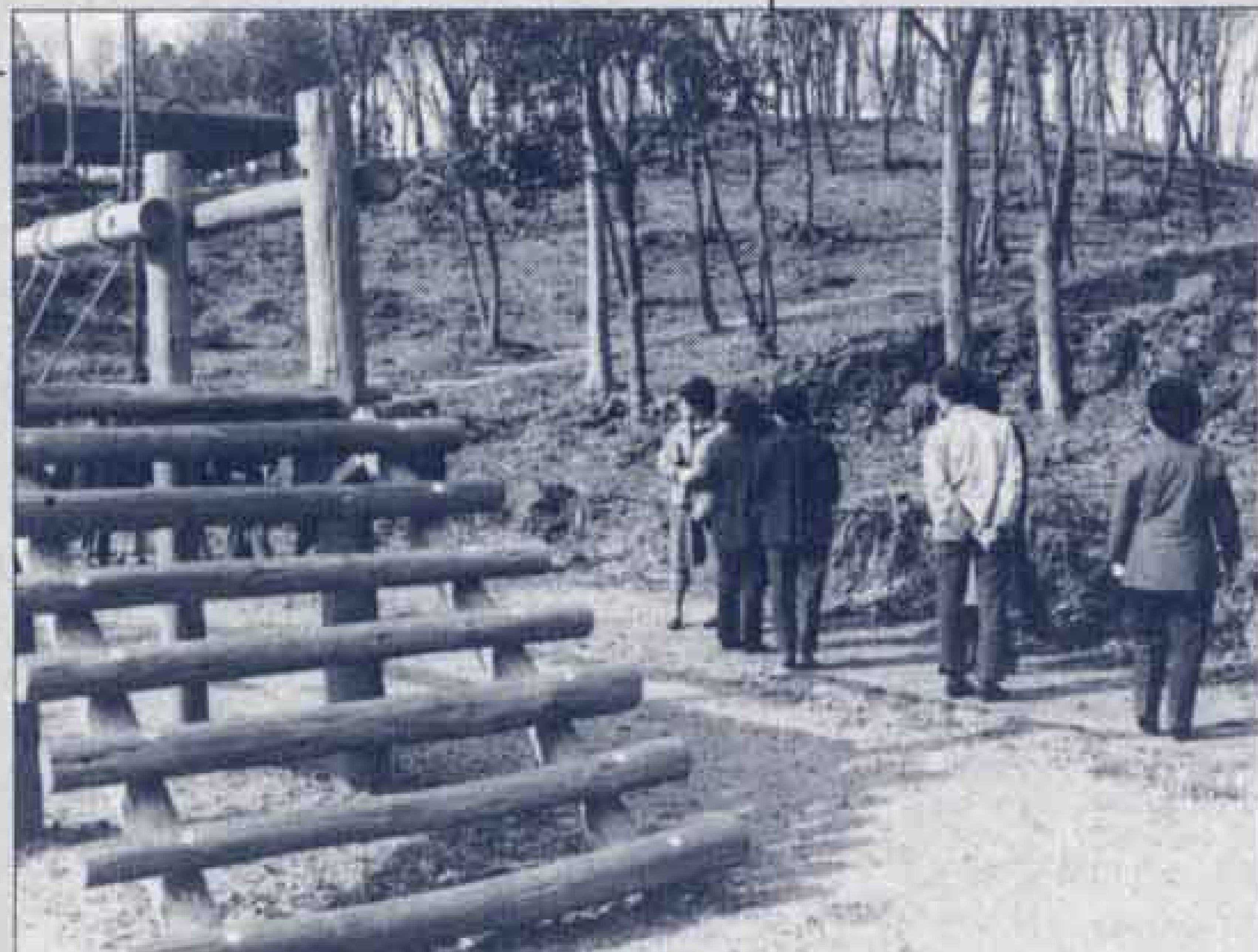
△総合運動公園で散歩のひとときを楽しむ