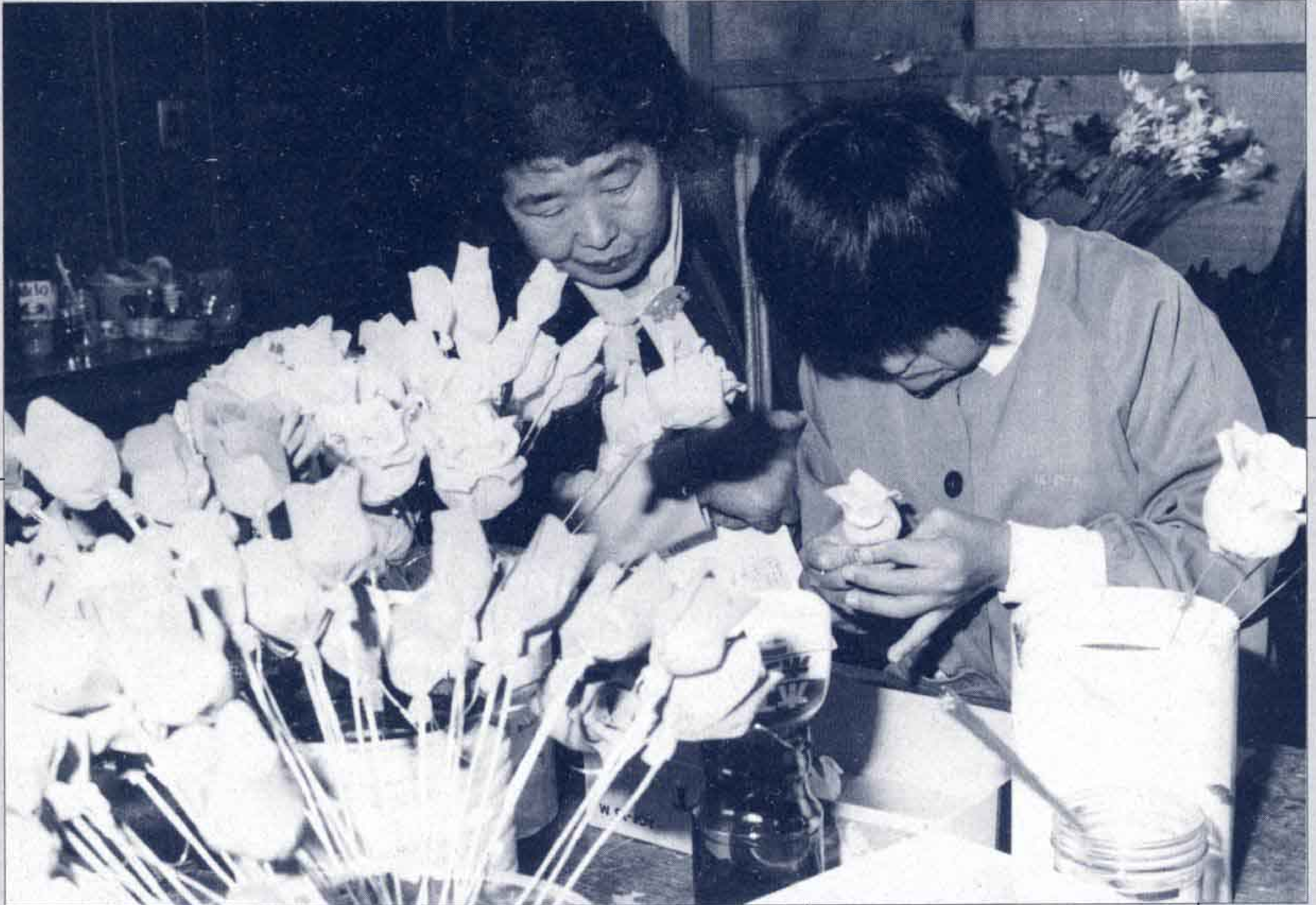
△くすの木学園の園生による造花づくりを熱心に見入る参加者