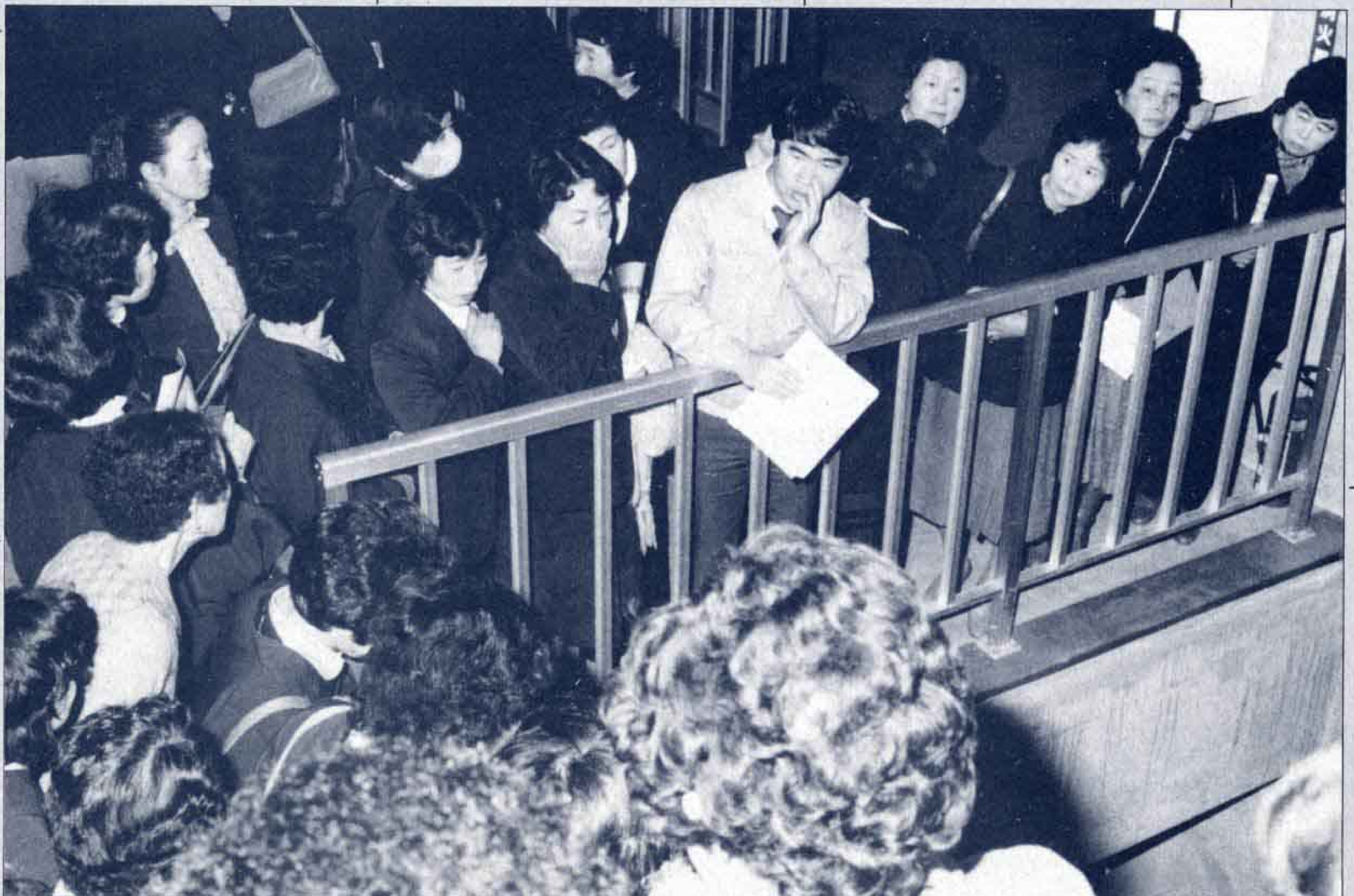
△西部浄化センターでは下水の処理過程を見学