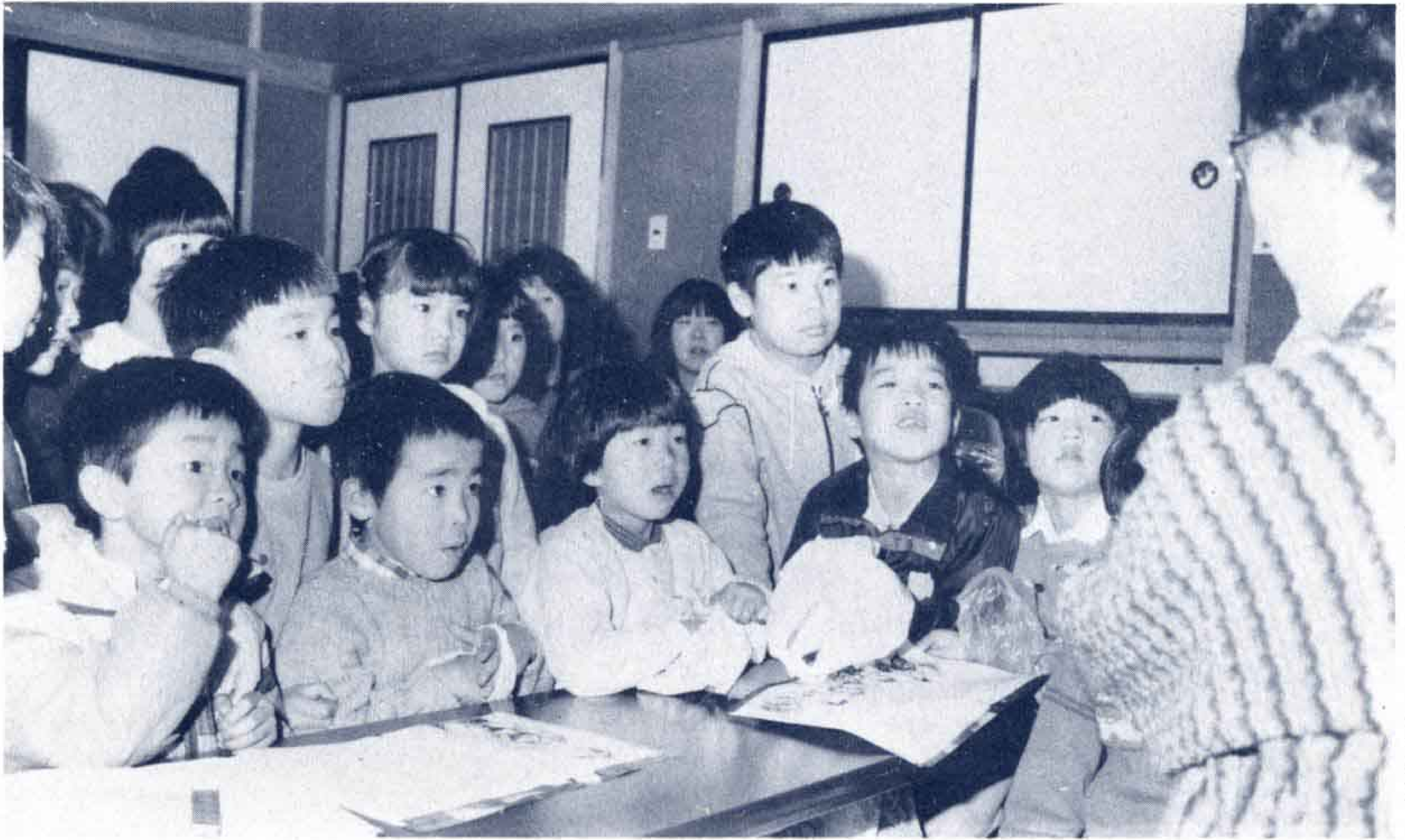
◀子供たちはおとぎの世界へ…