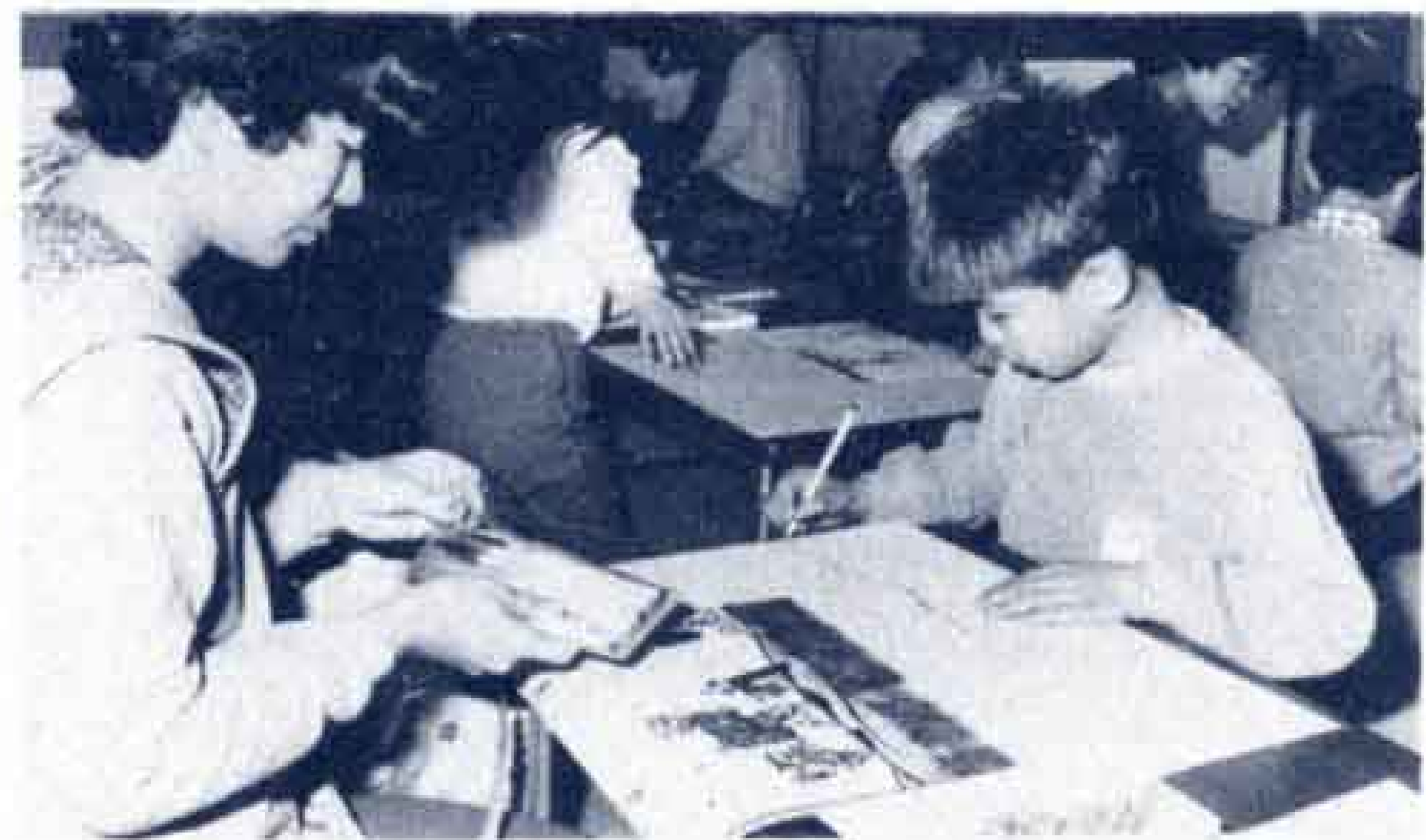
▶お母さんと一緒に 絵もかきました