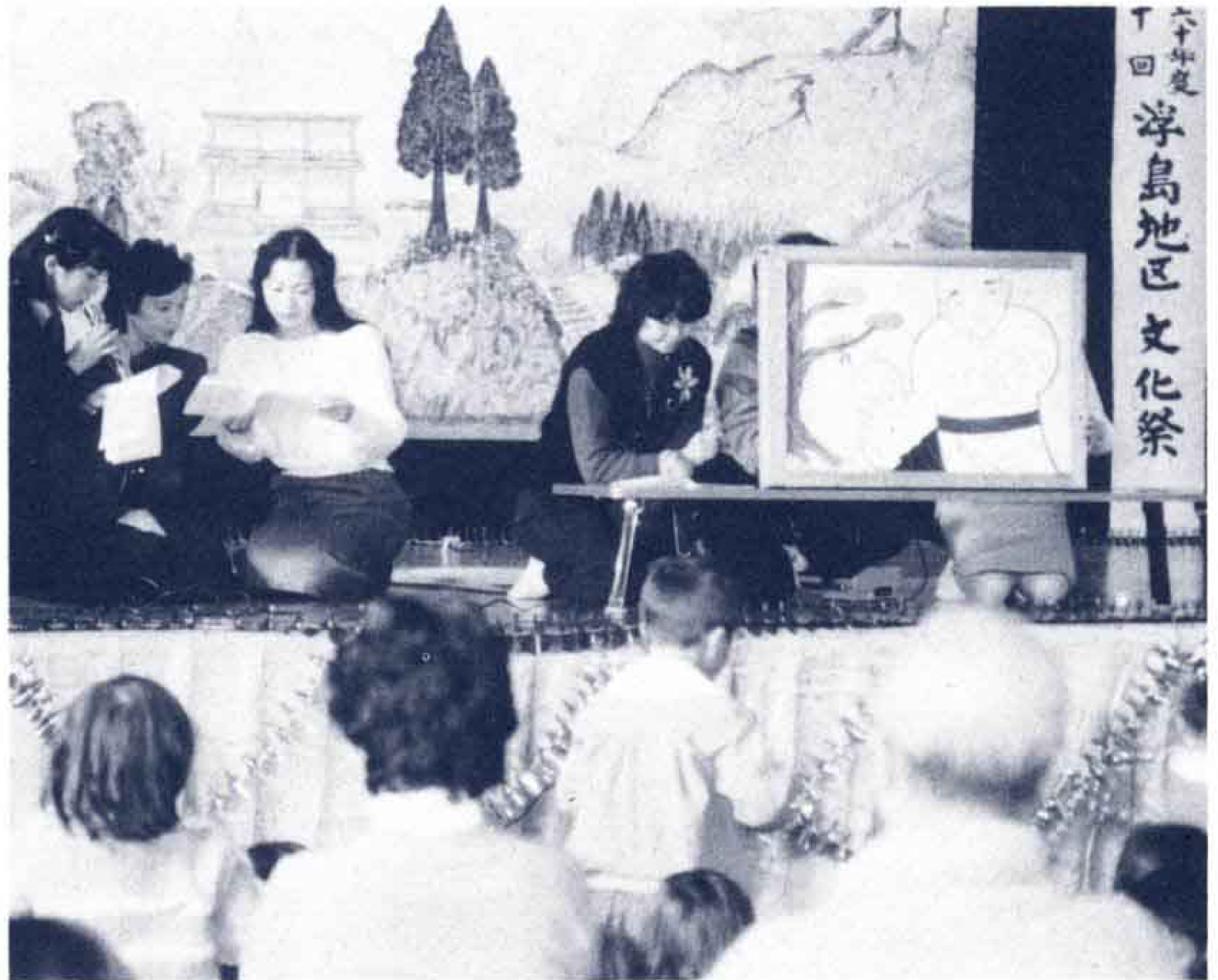
▲手づくりの紙芝居は好評でした