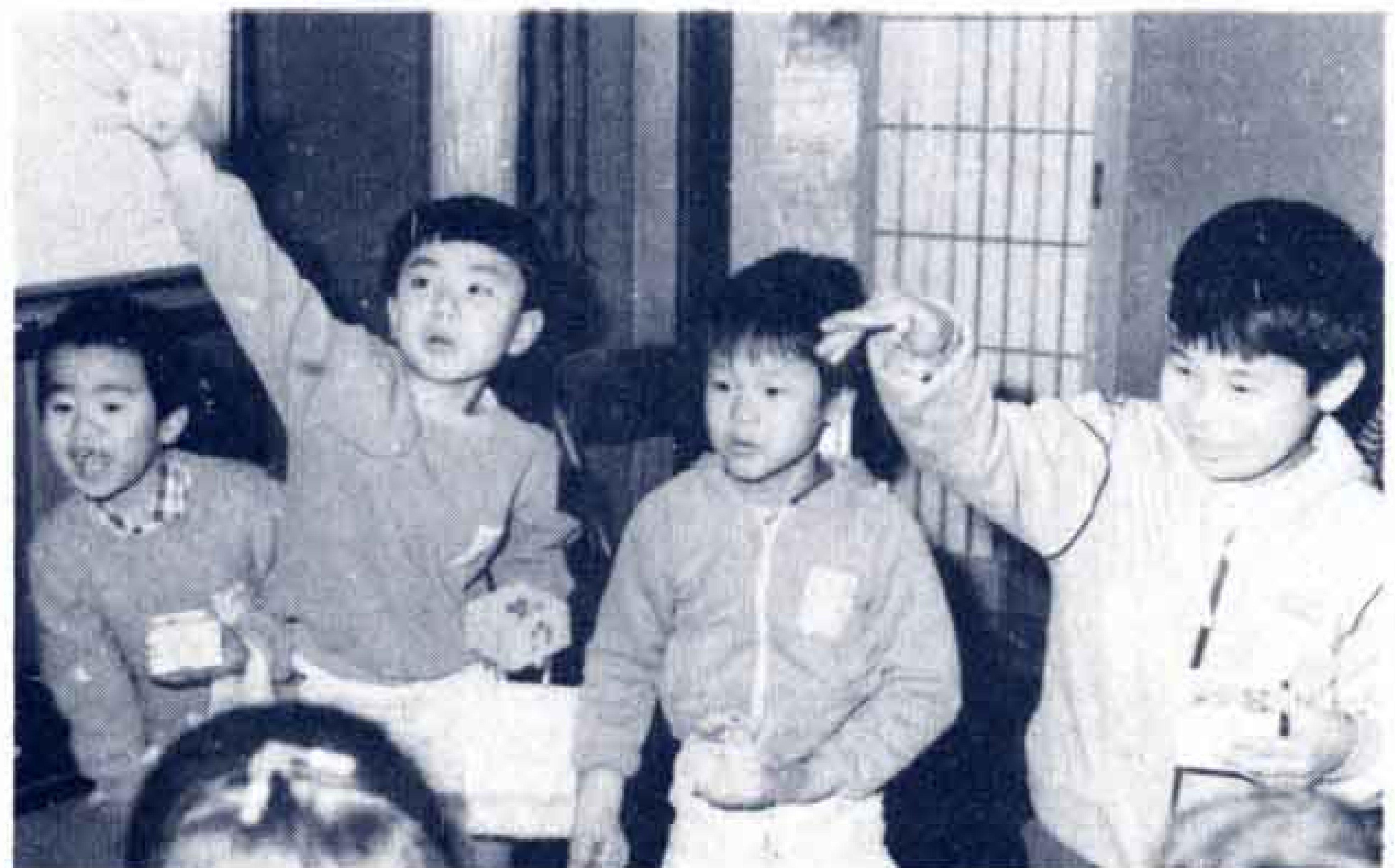
◀豆まきでは大騒ぎ