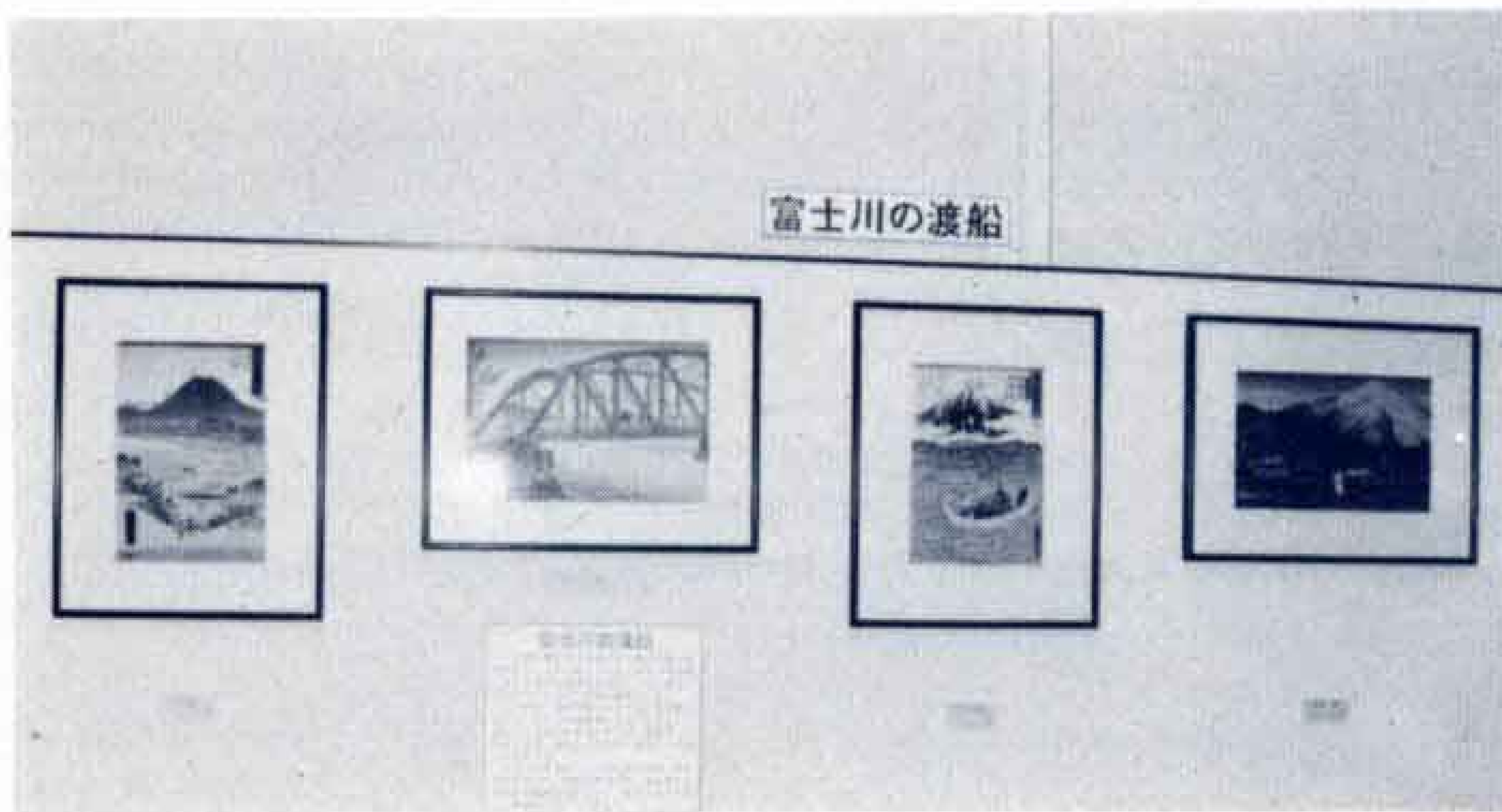
△富士川の渡船の様子

富士市を中心とした郷土の昔の姿や風俗を、浮世絵を通して見てもらおうと、12月1日まで開催された市立博物館企画展「浮世絵に描かれた郷土」。期間中、博物館を訪れた市民は、浮世絵を通して見る、昔の庶民文化や風俗に触れることができました。