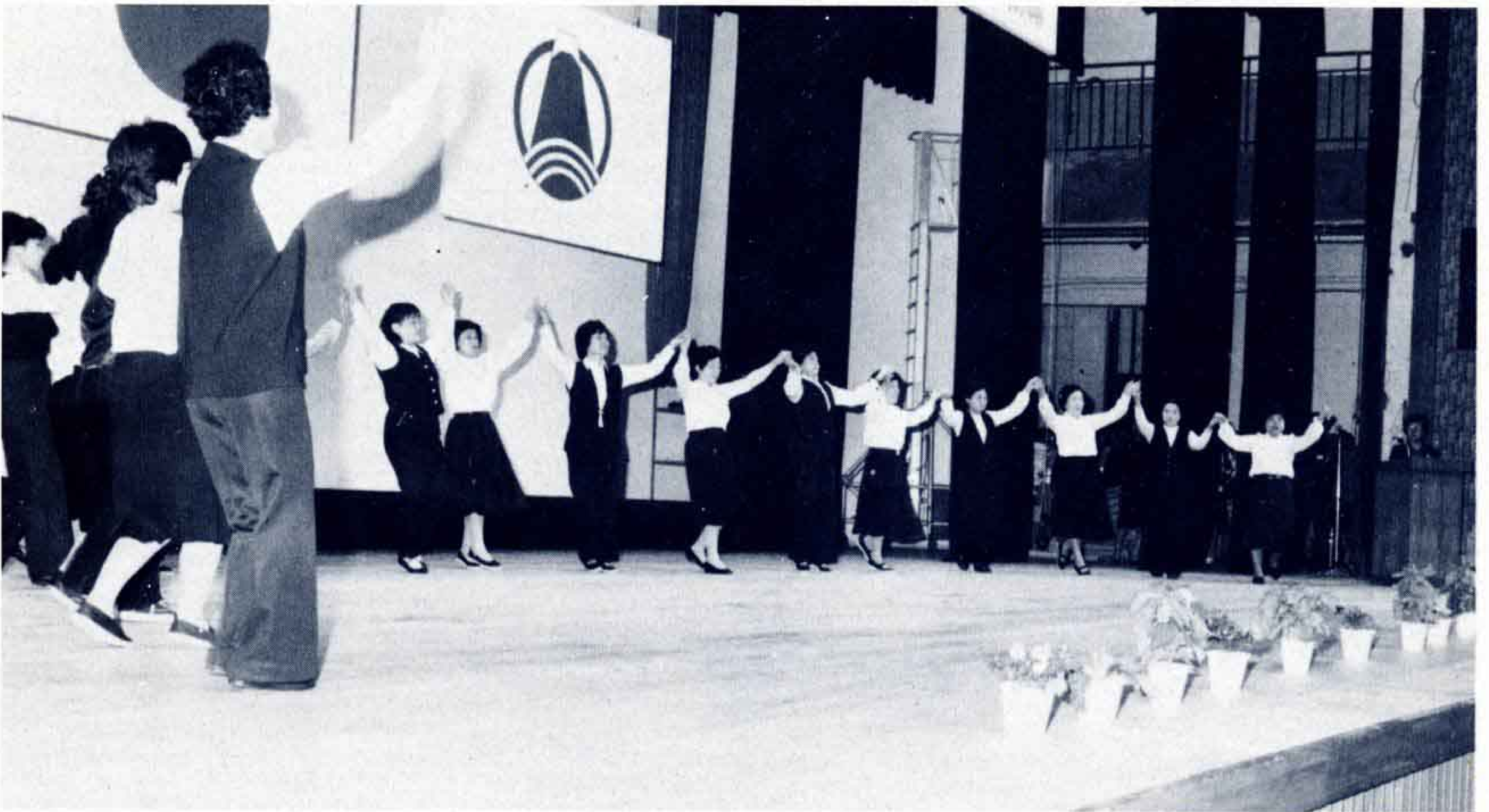
△今泉地区婦人会は、フォークダンス「オスローワルツ」を披露