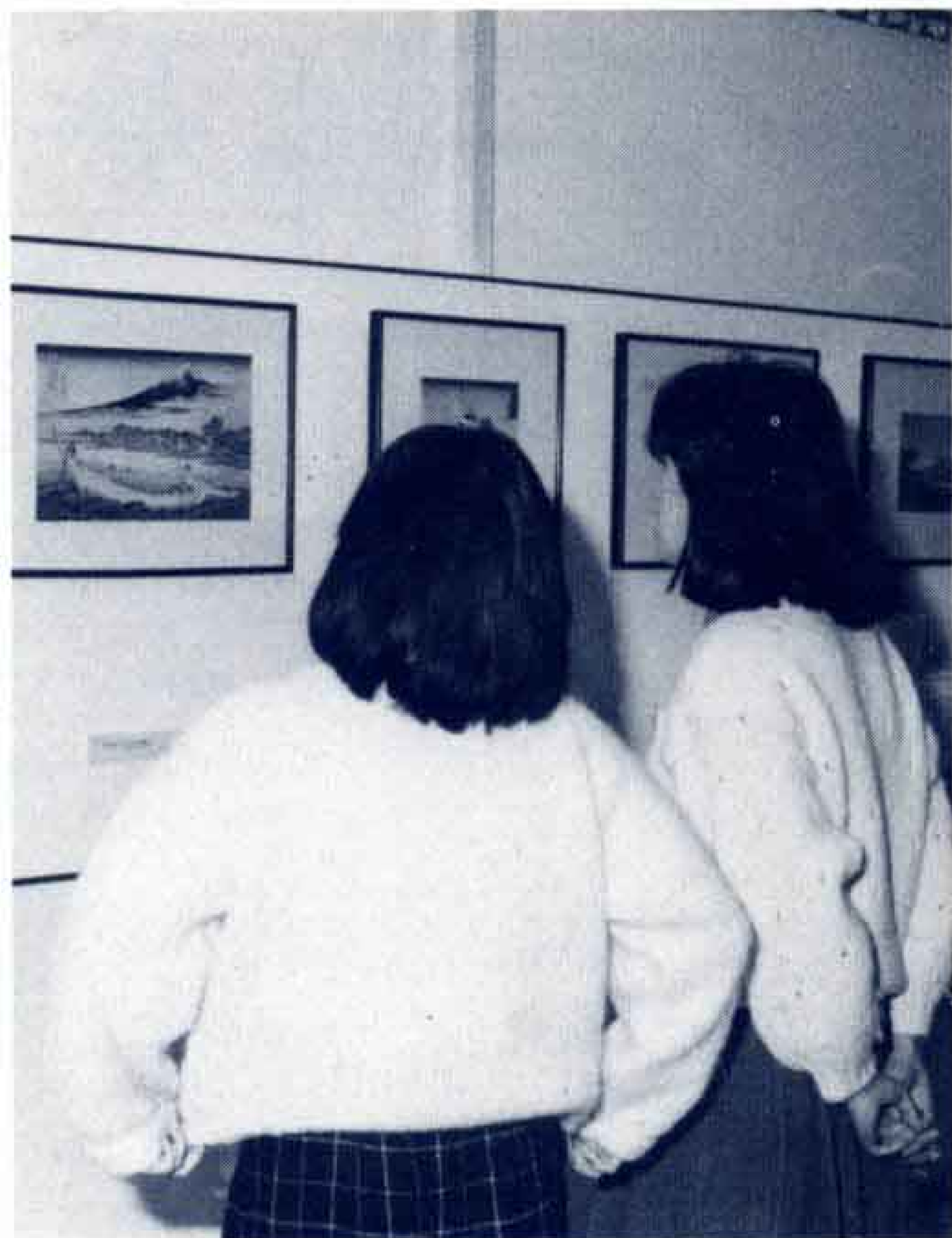
△浮世絵を通し昔の生活のひとつに触れる市民