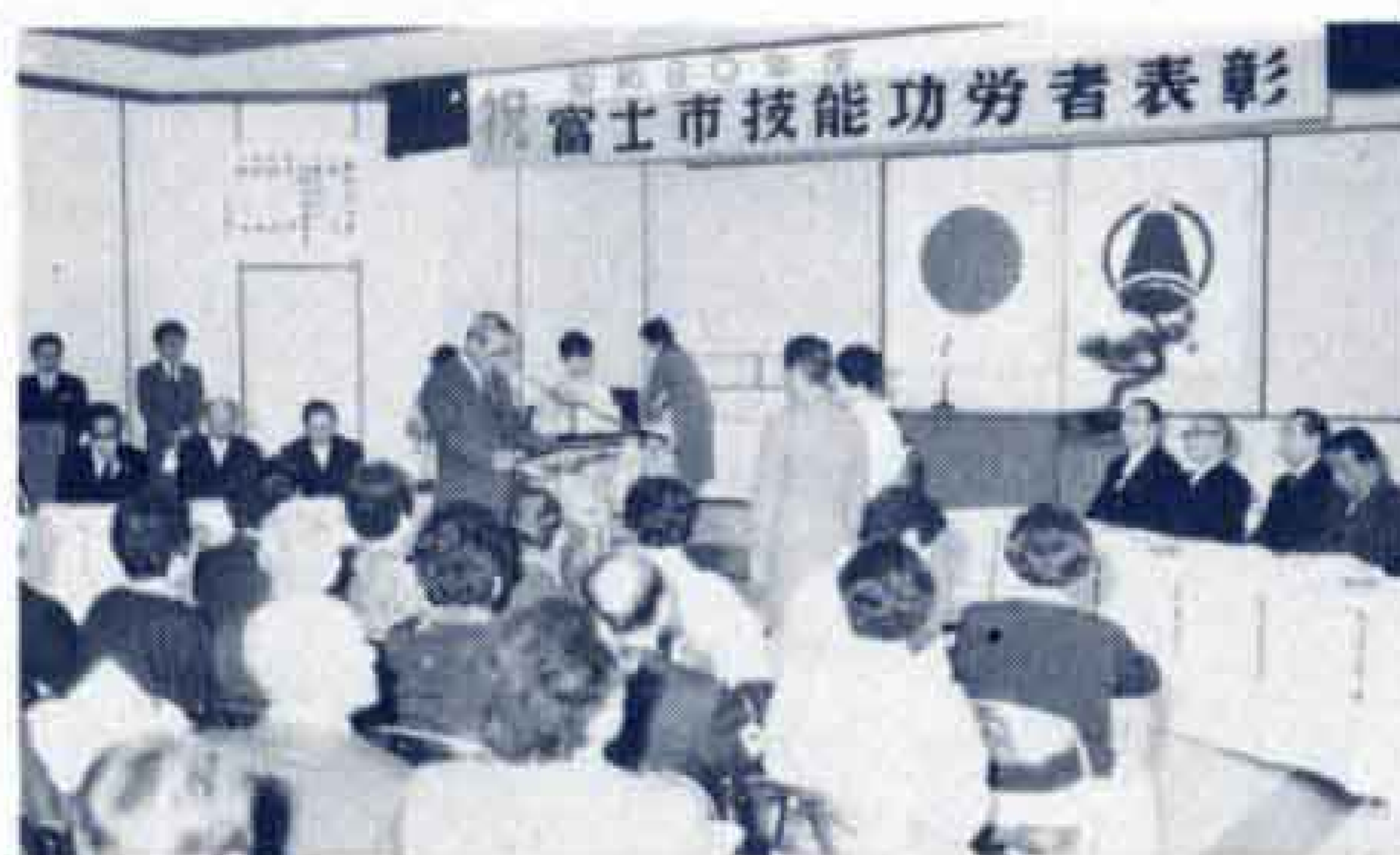
△市長から表彰をうける被表彰者

ことしの被表彰者は、24職種36人で、いずれも「現代の名工」と呼ばれるにふさわしい人たちでした。