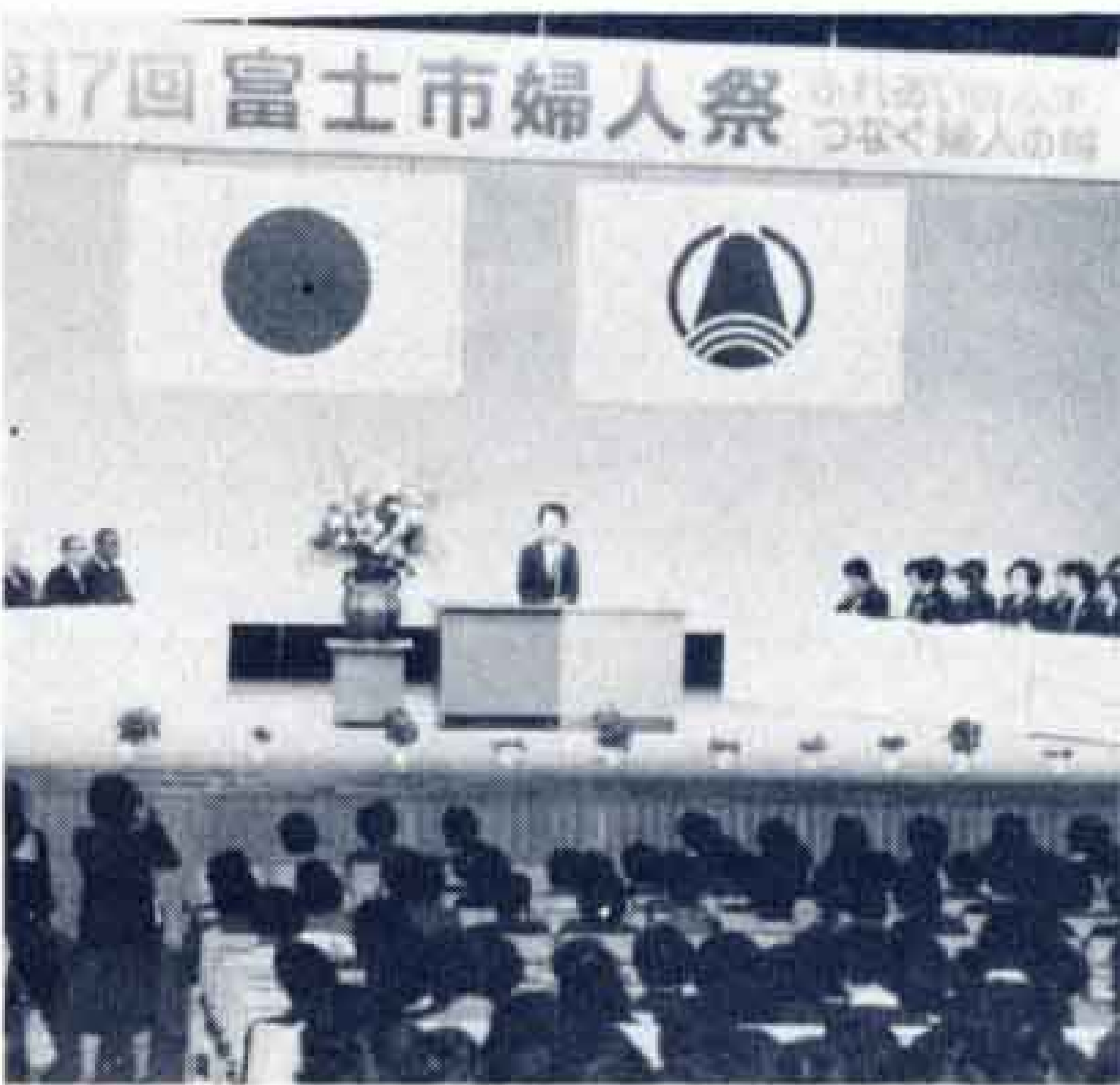
△会場は婦人の熱気でいっぱい