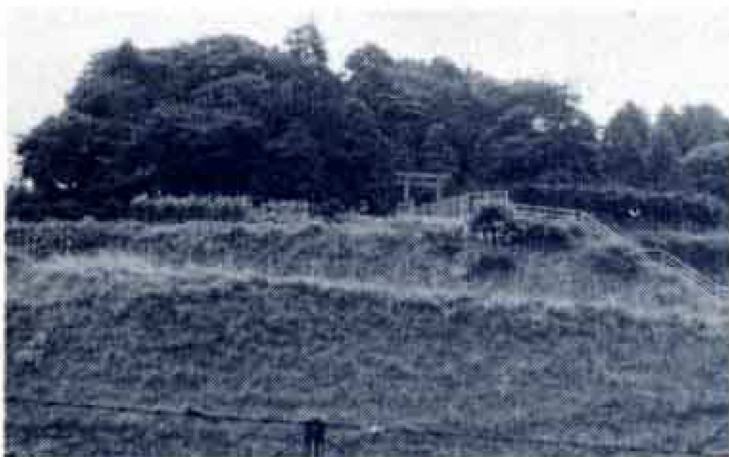
浅間古墳（増川地先）