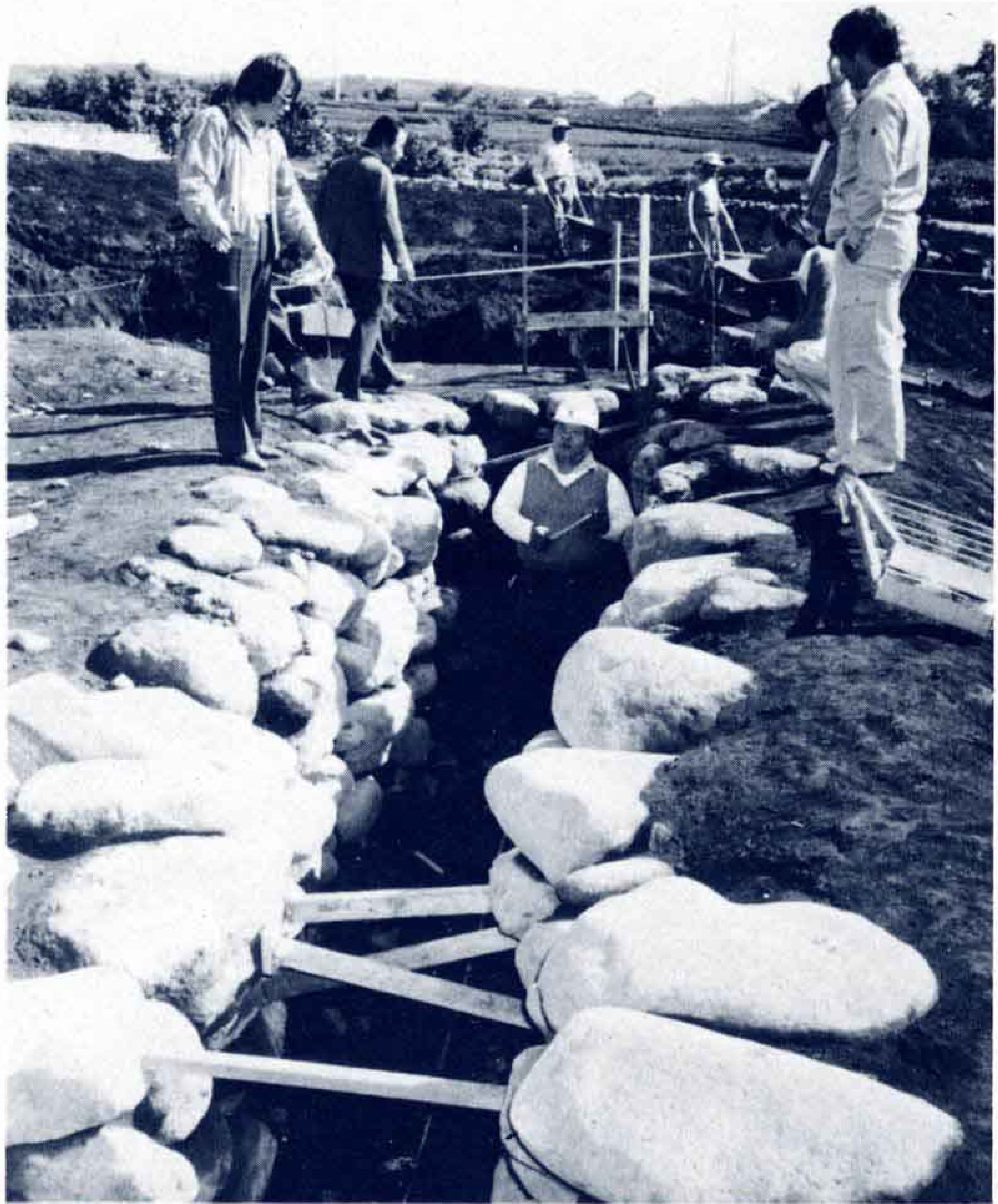
市内最長の石室を確認する調査員

市内船津の茶畑で、古墳時代後期（6世紀中頃）のものと推定される円墳の古墳が新たに発見され、市教育委員会は10月中旬から発掘調査を実施しました。