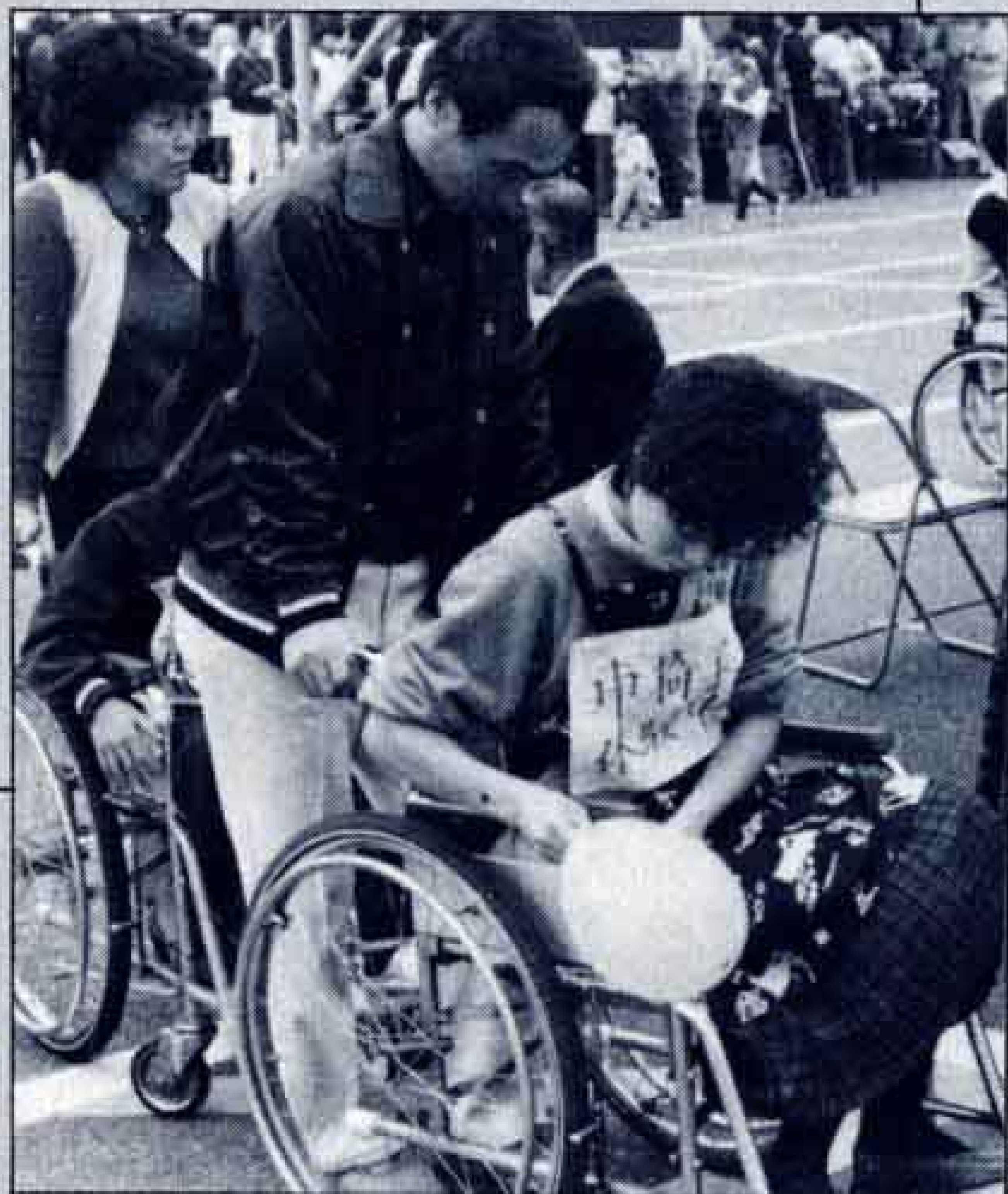
△車いすの体験乗車