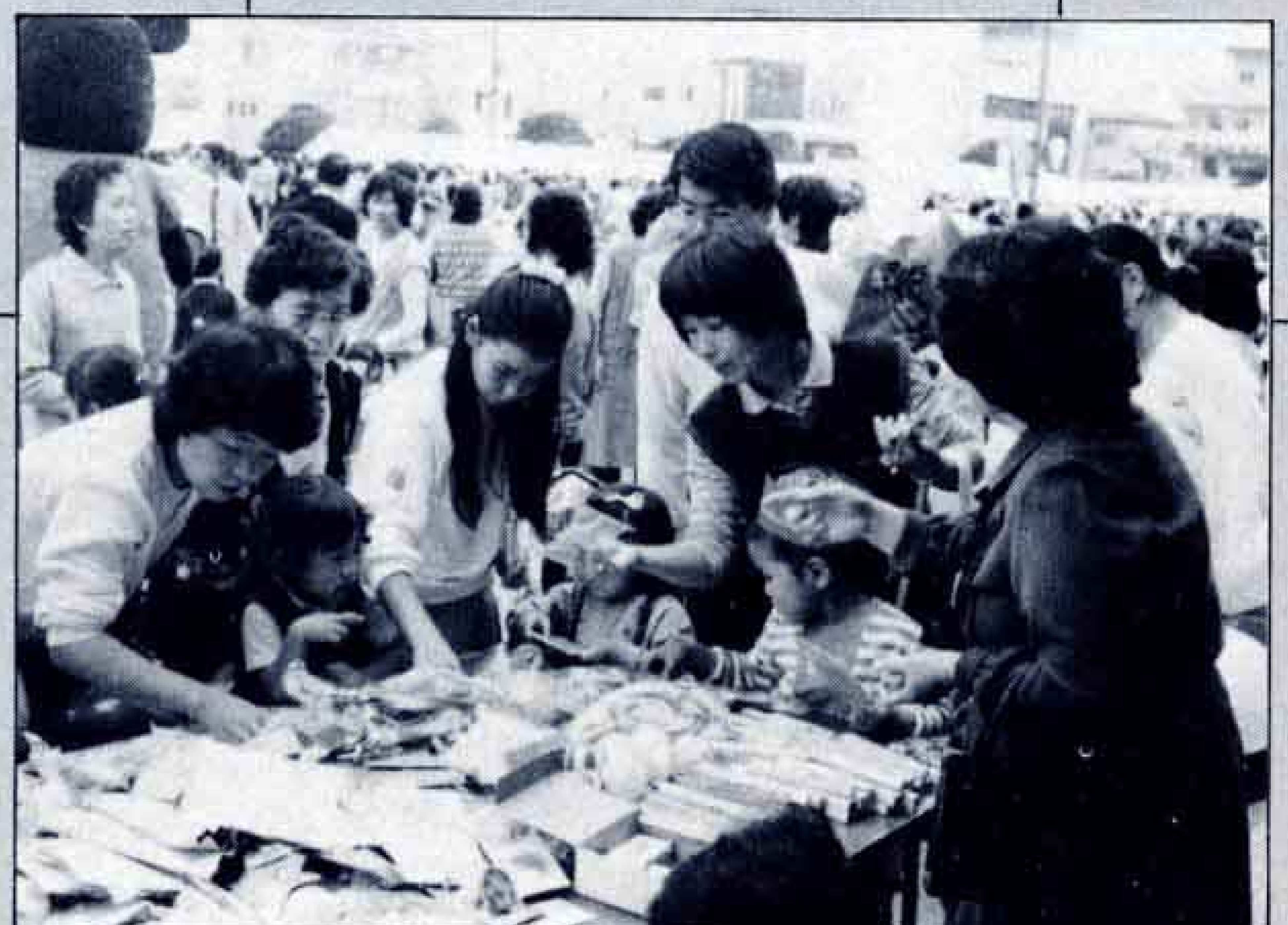
△バザーコーナーも大繁盛