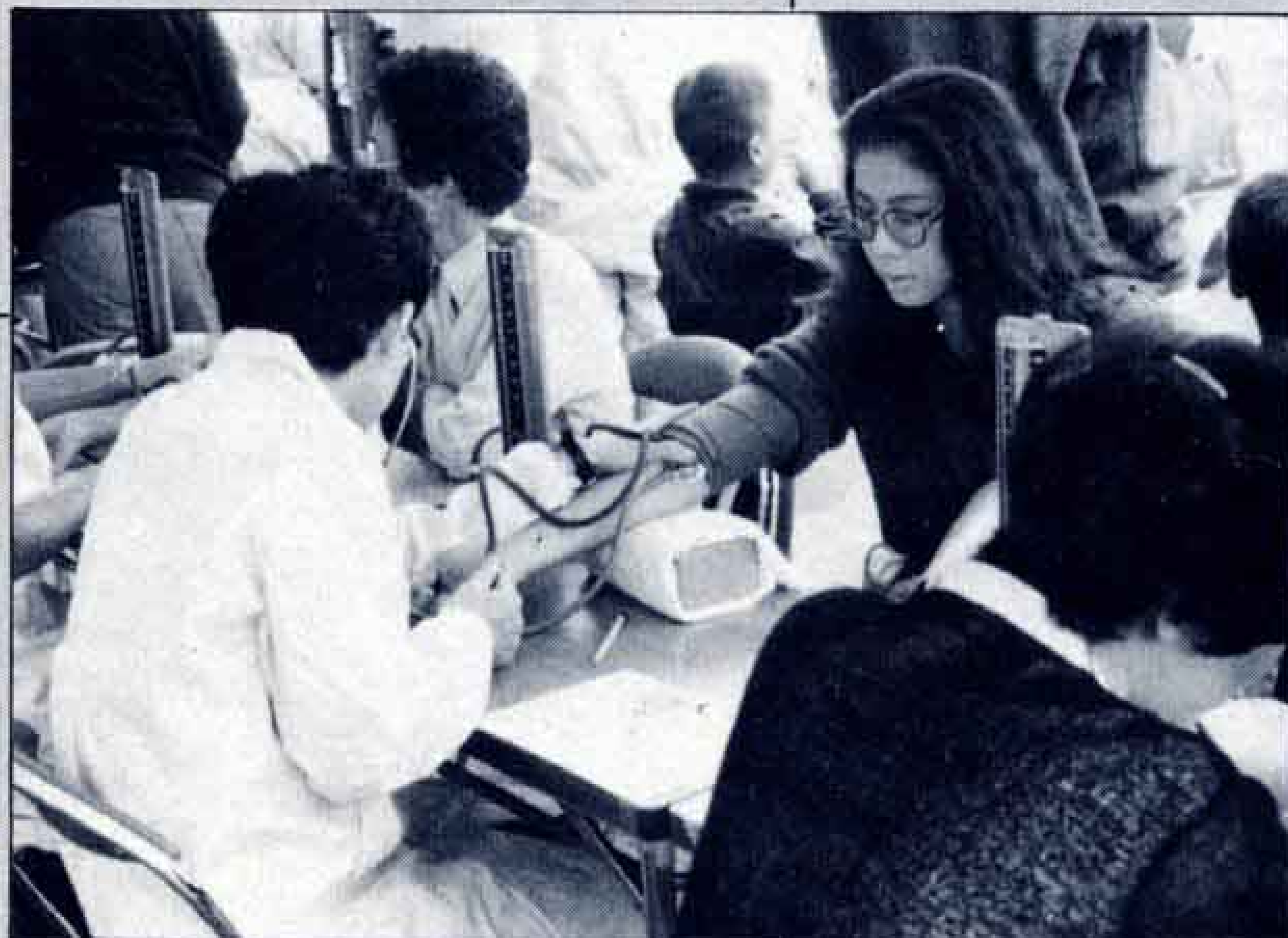
△きょうの血圧はどうか...