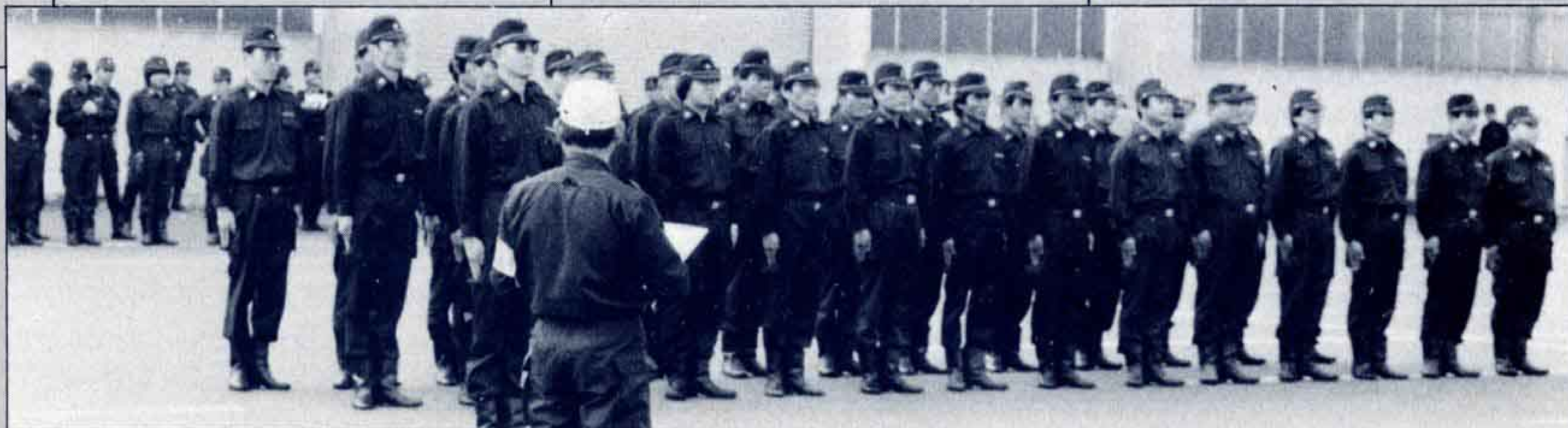
△キビキビとした整列は訓練の基本です