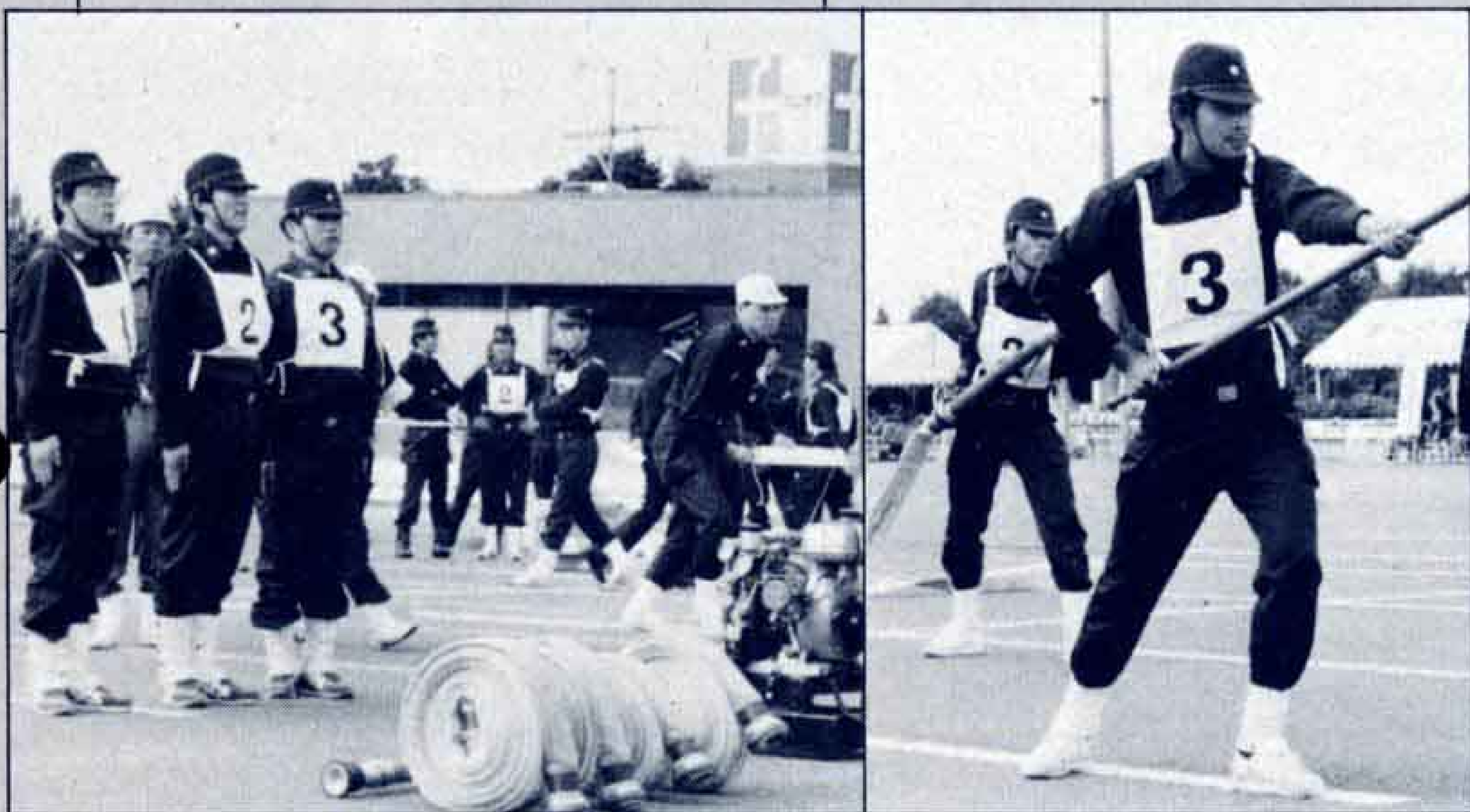
△本番さながらに日ごろの訓練の成果を披露

十月二十日、公設卸売市場駐車場で「富士市消防団訓練礼式・消防操法訓練大会」が開かれました。この大会は、消防操法の技術向上と各分団の交流を図ることを目的としたものです。各部門の優勝チームは訓練礼式が第二方面隊、小型ポンプ操法が第十四分団、ポンプ車操法が第七分団でした。