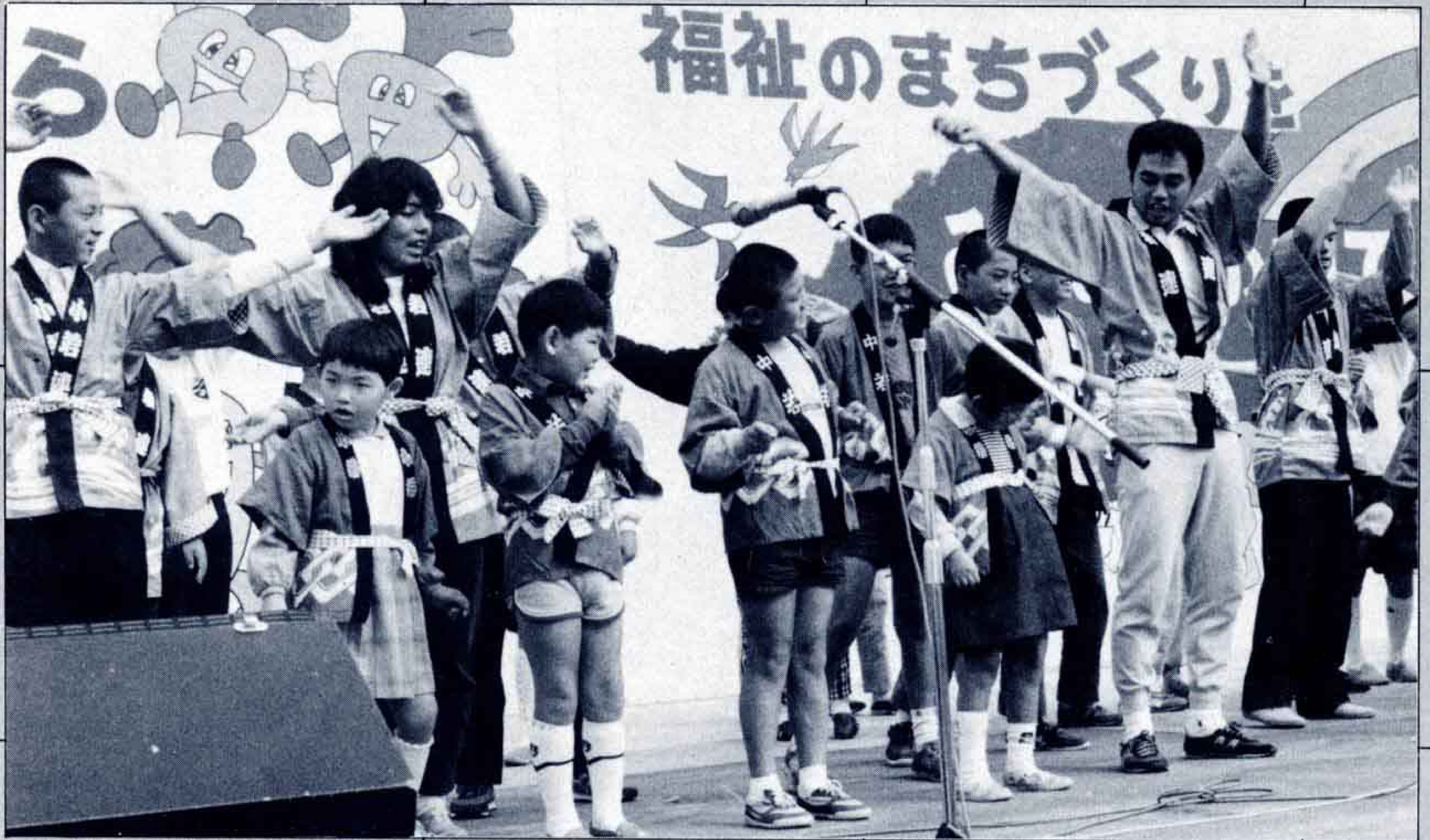
△施設の友達による歌とおどり