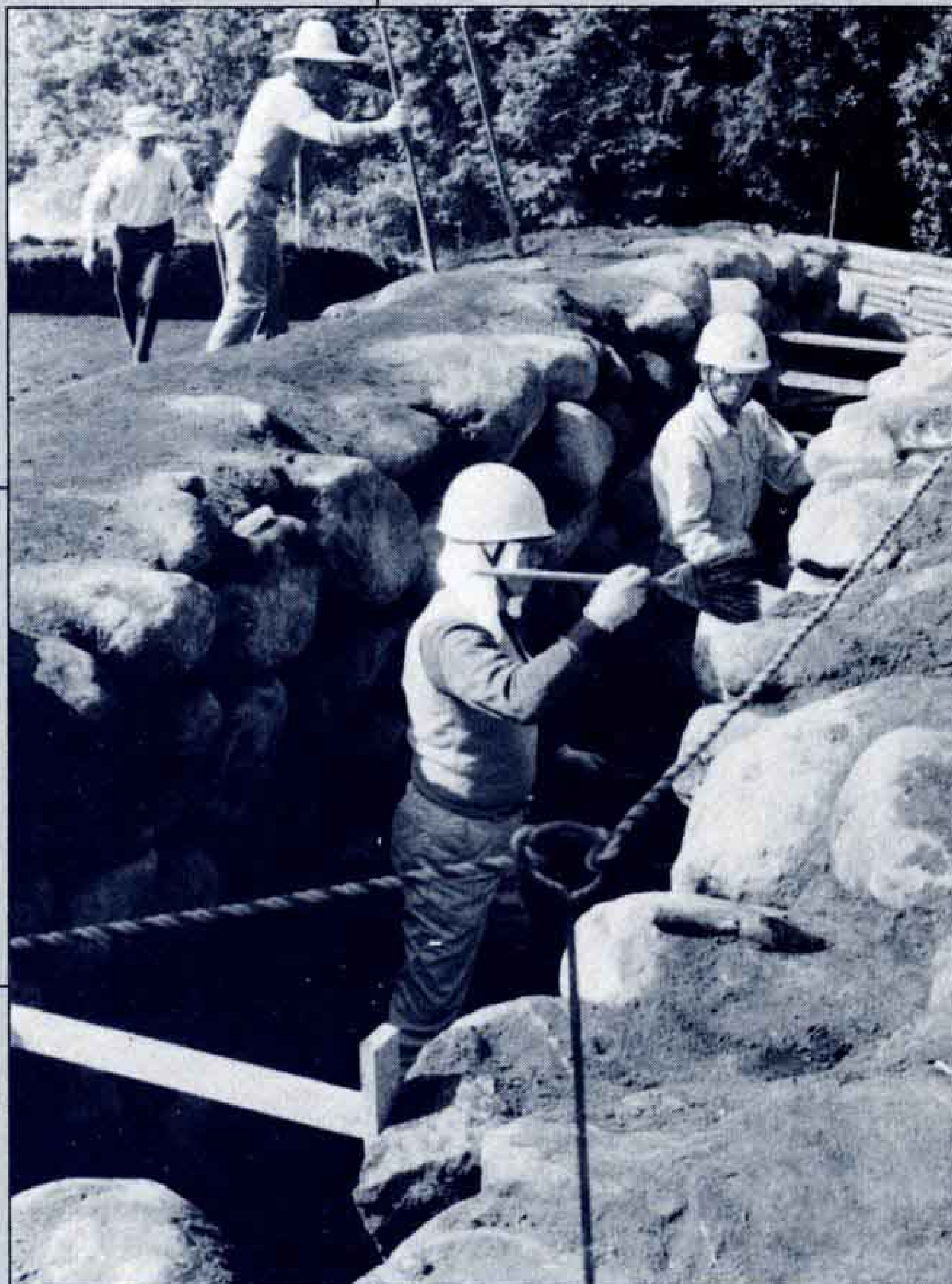
△長さ12m、市内最長の石室

この古墳は、茶畑造成改植工事中偶然に発見されたもので、古墳時代後期(6世紀後半)のものと推定されます。10月15日から発掘作業に入っていますが長さ12mという市内では最長の石室内から、首飾り、土器、刀などが出土しました。