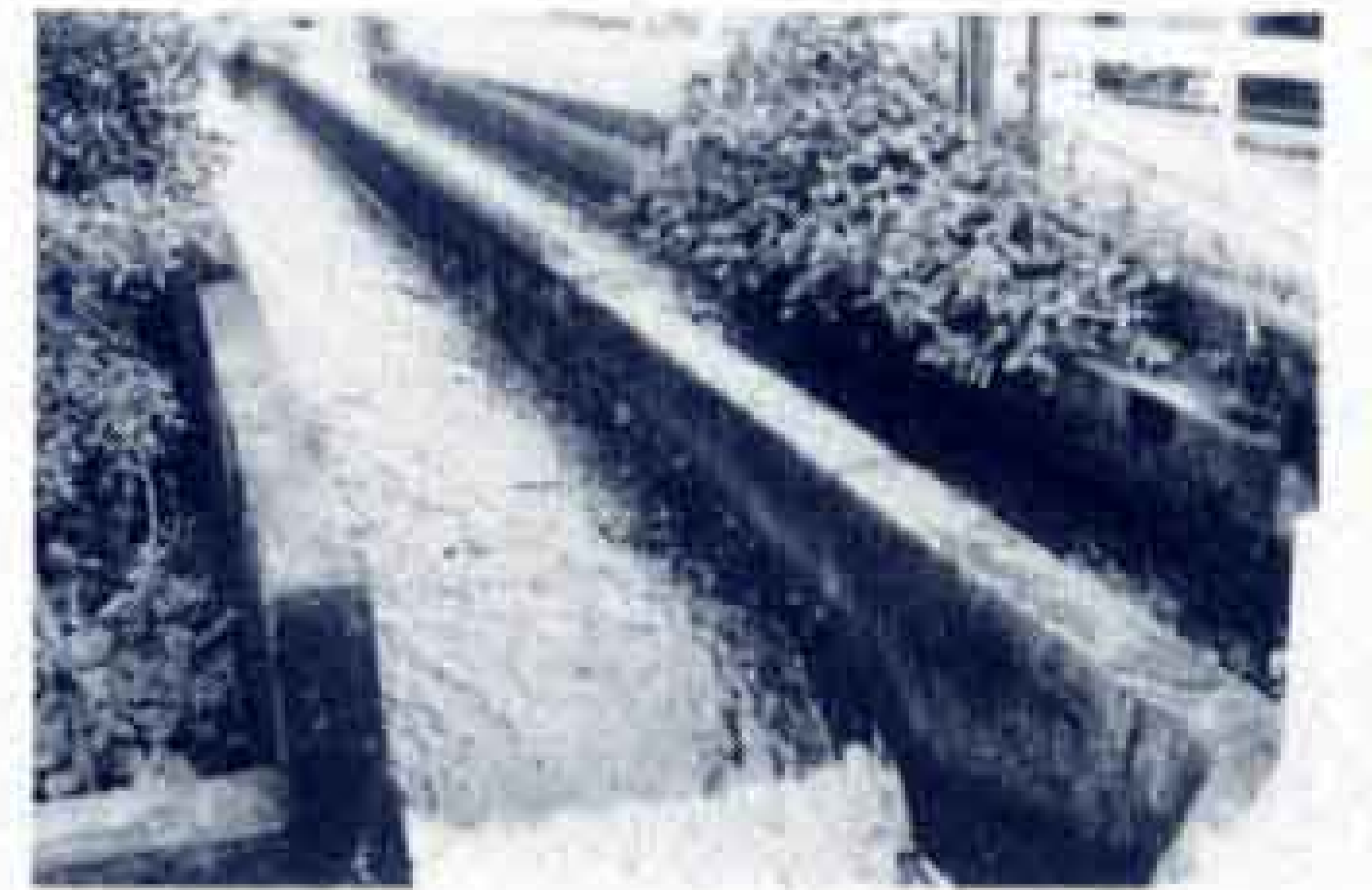
△凡夫川にかかる二本樋

現在の鷹岡地区から伝法地区にかけて広がる水田地帯は、鷹岡伝法用水(通称二本樋)によって開けたものです。