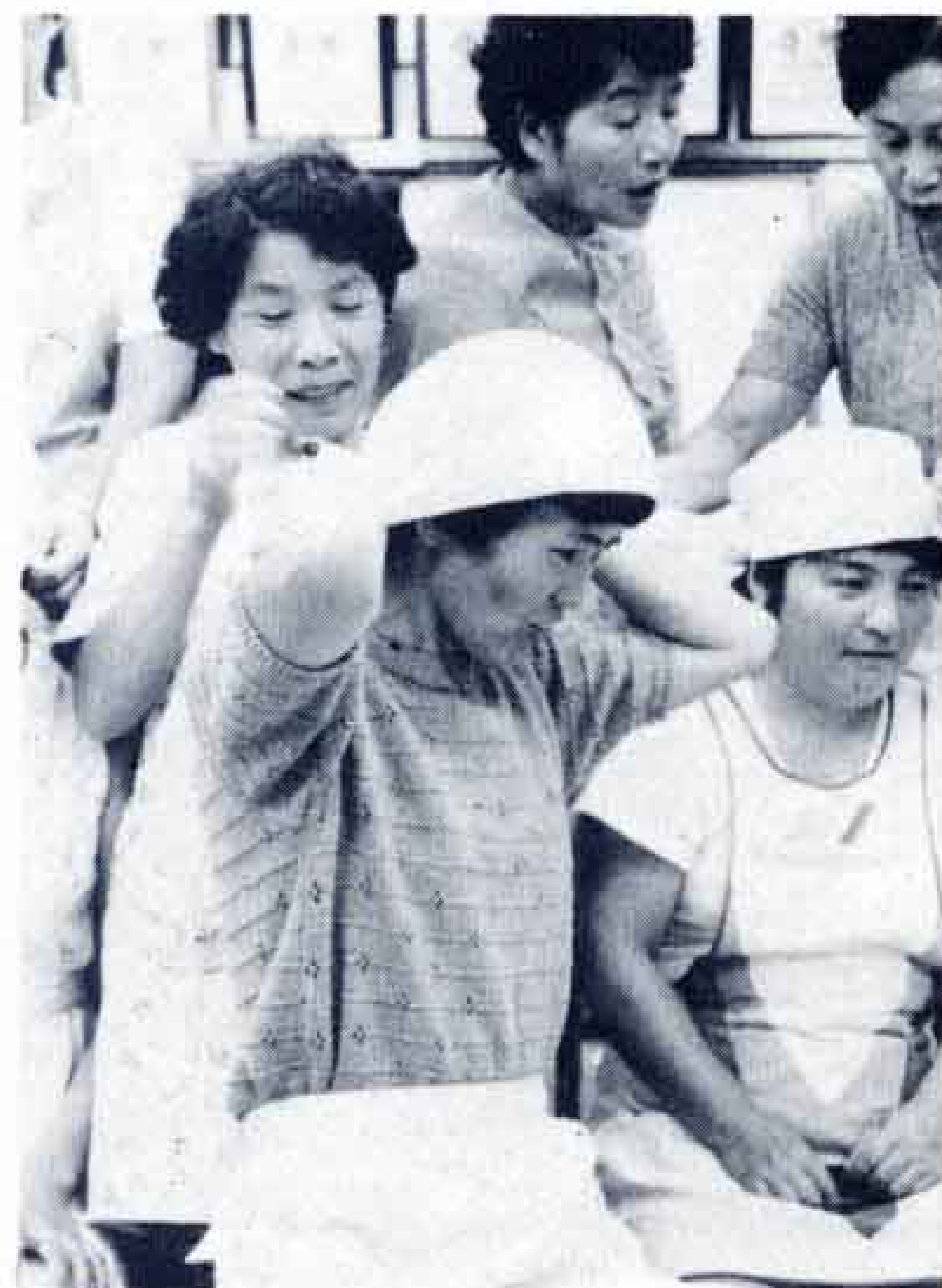
◁応救処置はもう大丈夫