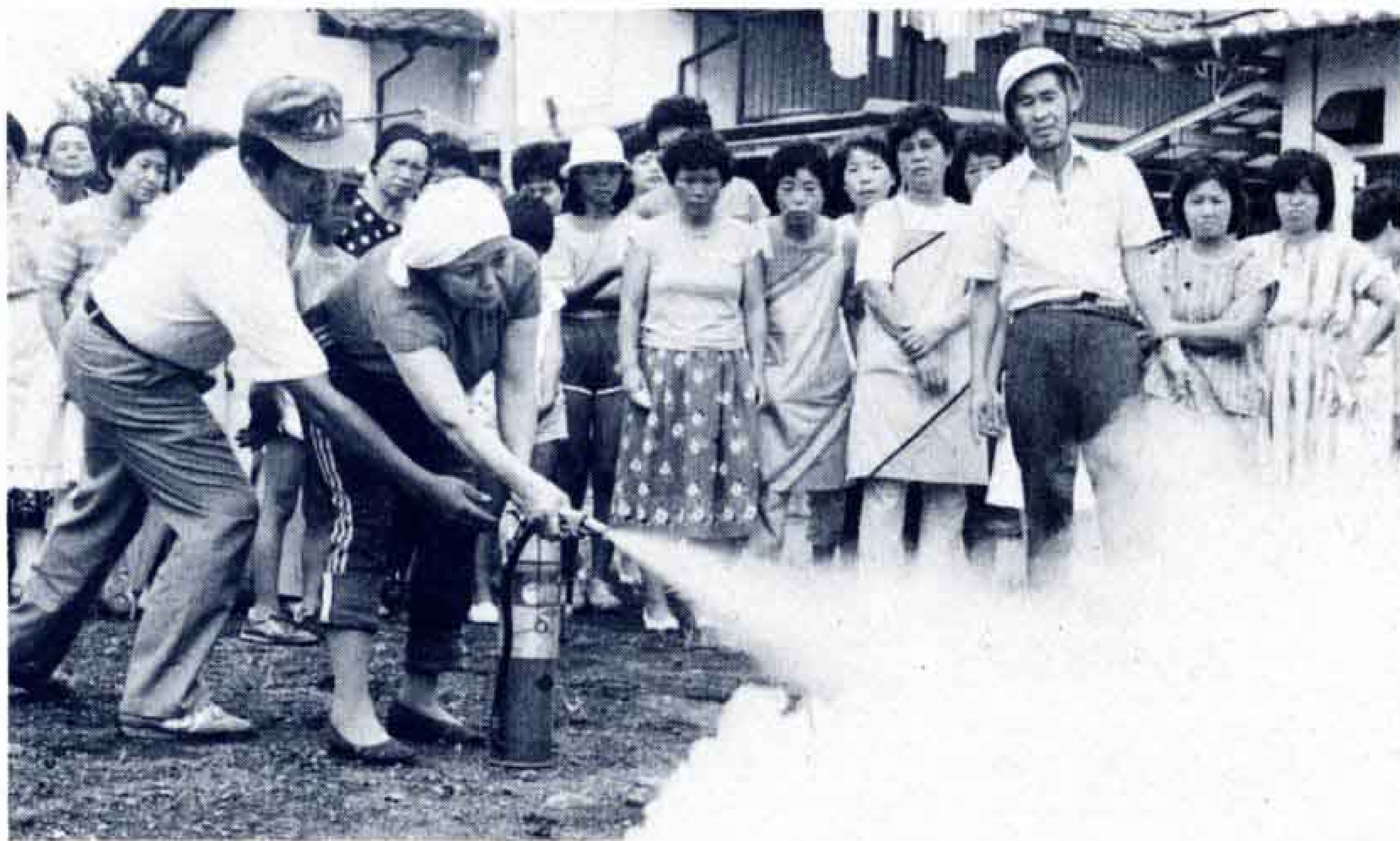
◁消火器はまず落ち着 (伝法地区)

当日は、一時大雨が降るなど、コンディションはまさに防災訓練向きでしたが、約8万2,000人の市民が参加しました。ことしは、日曜日と重なり、家族ぐるみで参加する自主防災組織の訓練などが重点となりました。