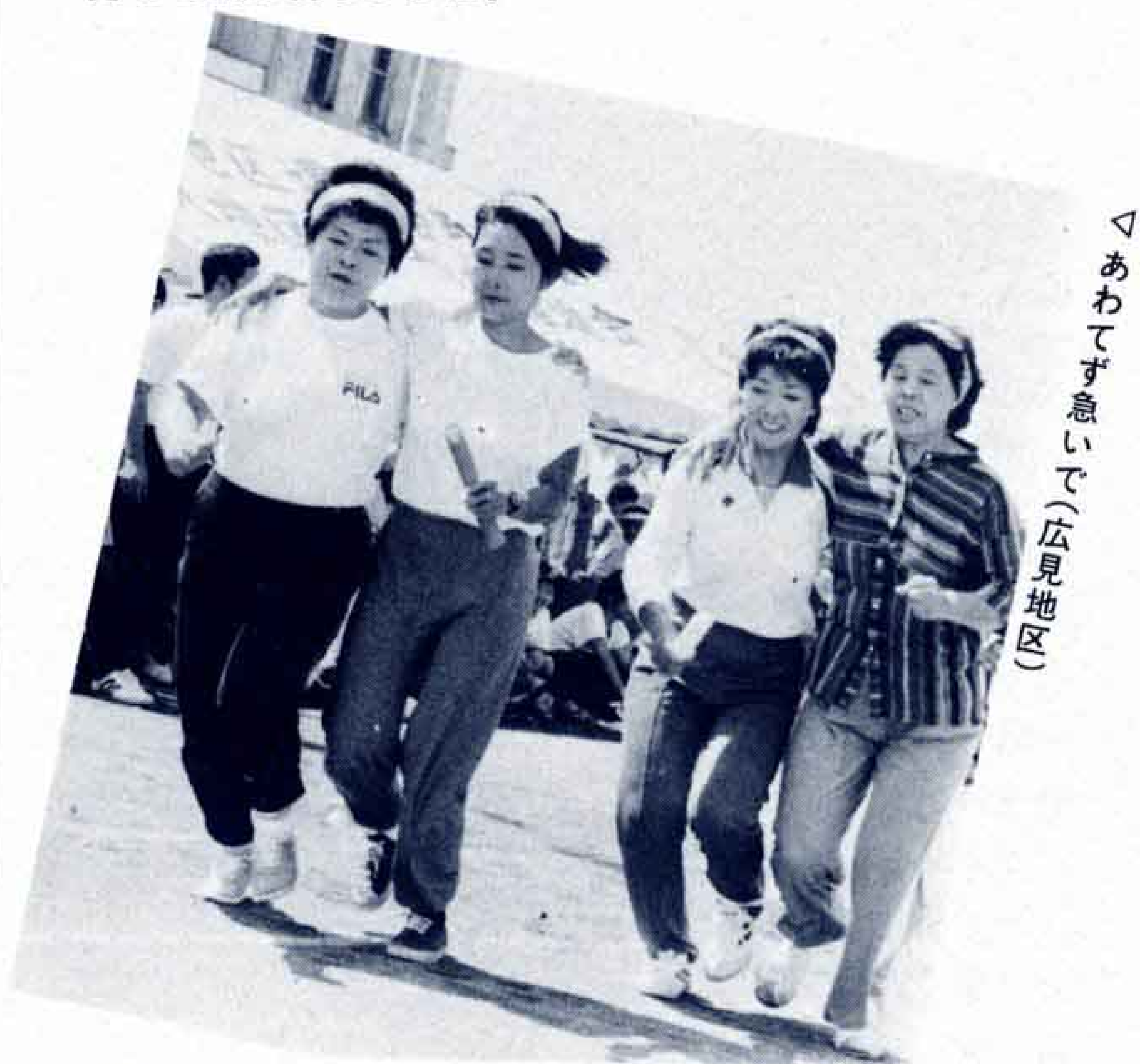
△あわてず競ごう(広見地区)

秋の訪れを感じさせる各地区の体育祭が、ことしも8月22日(日)から始まりました。秋とはいっても名ばかりで残暑厳しい時節柄、選手のみなさんは汗びっしょり。老いも若きも一緒になり、日ごろ運動不足ぎみの体にムチ打って張り切りました。