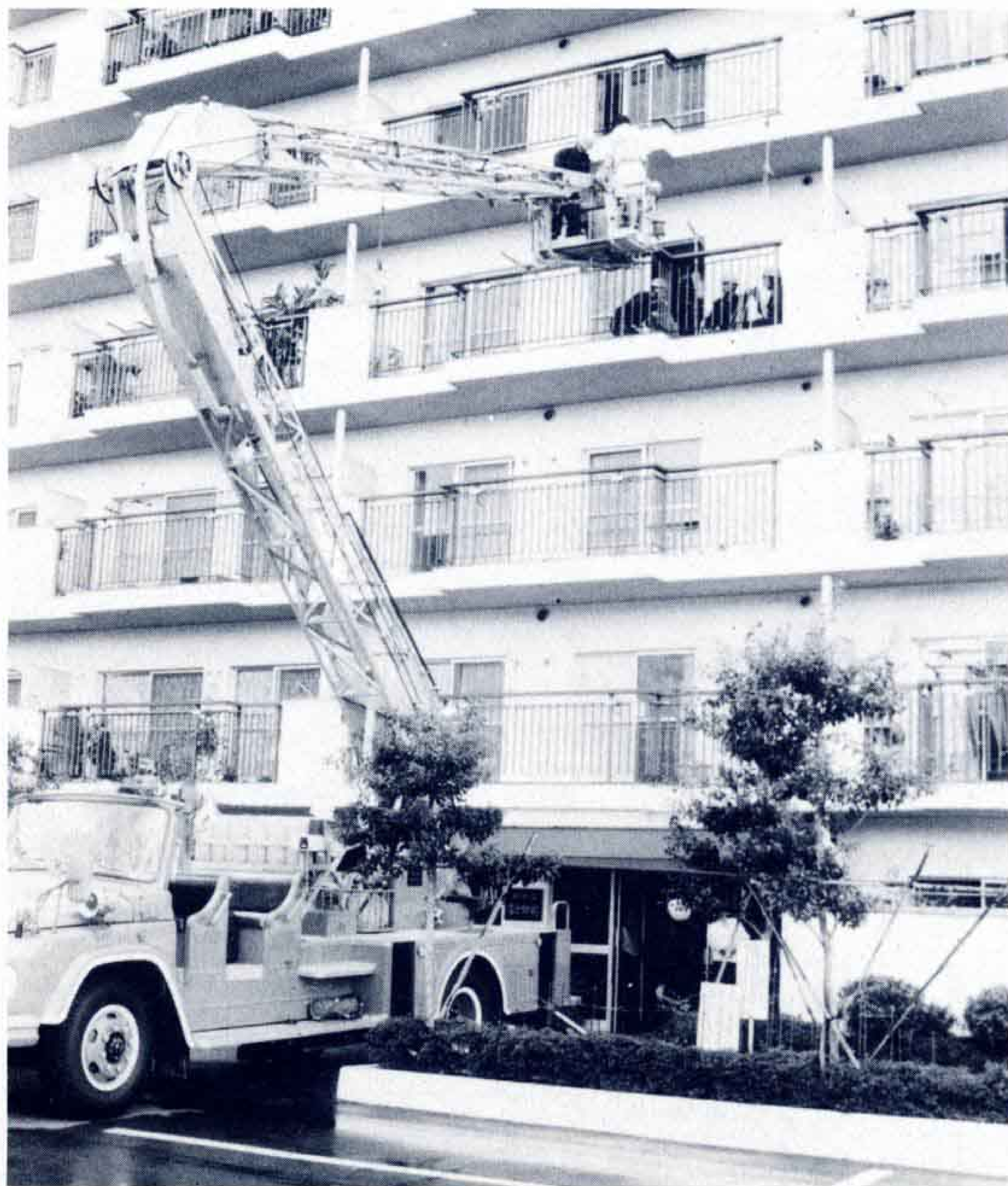
◁水戸島の「ハイライクマンション」では大がかりな救助訓練を実施