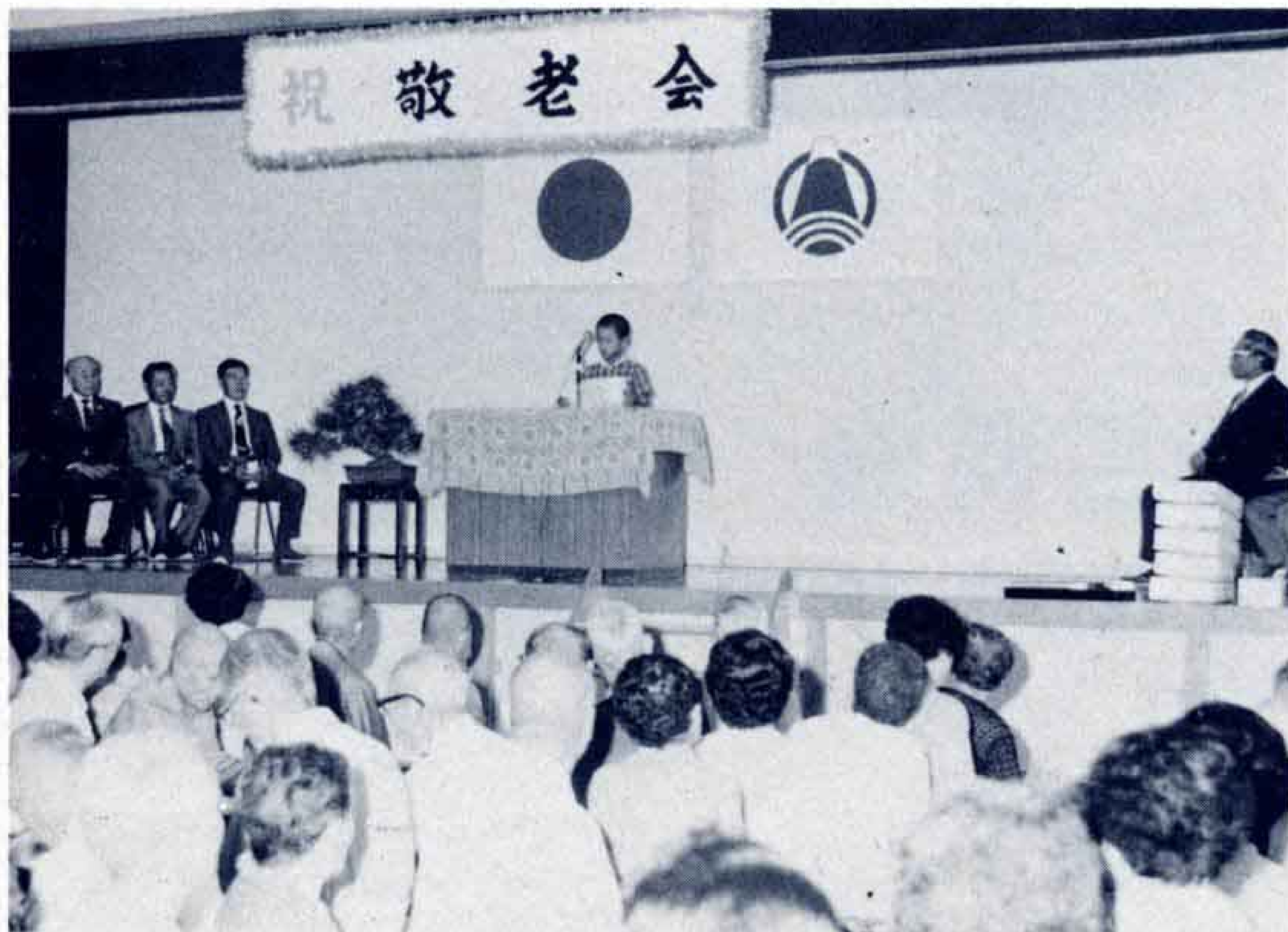
△小学生の作文に耳を傾けるお年寄り(神戸地区)