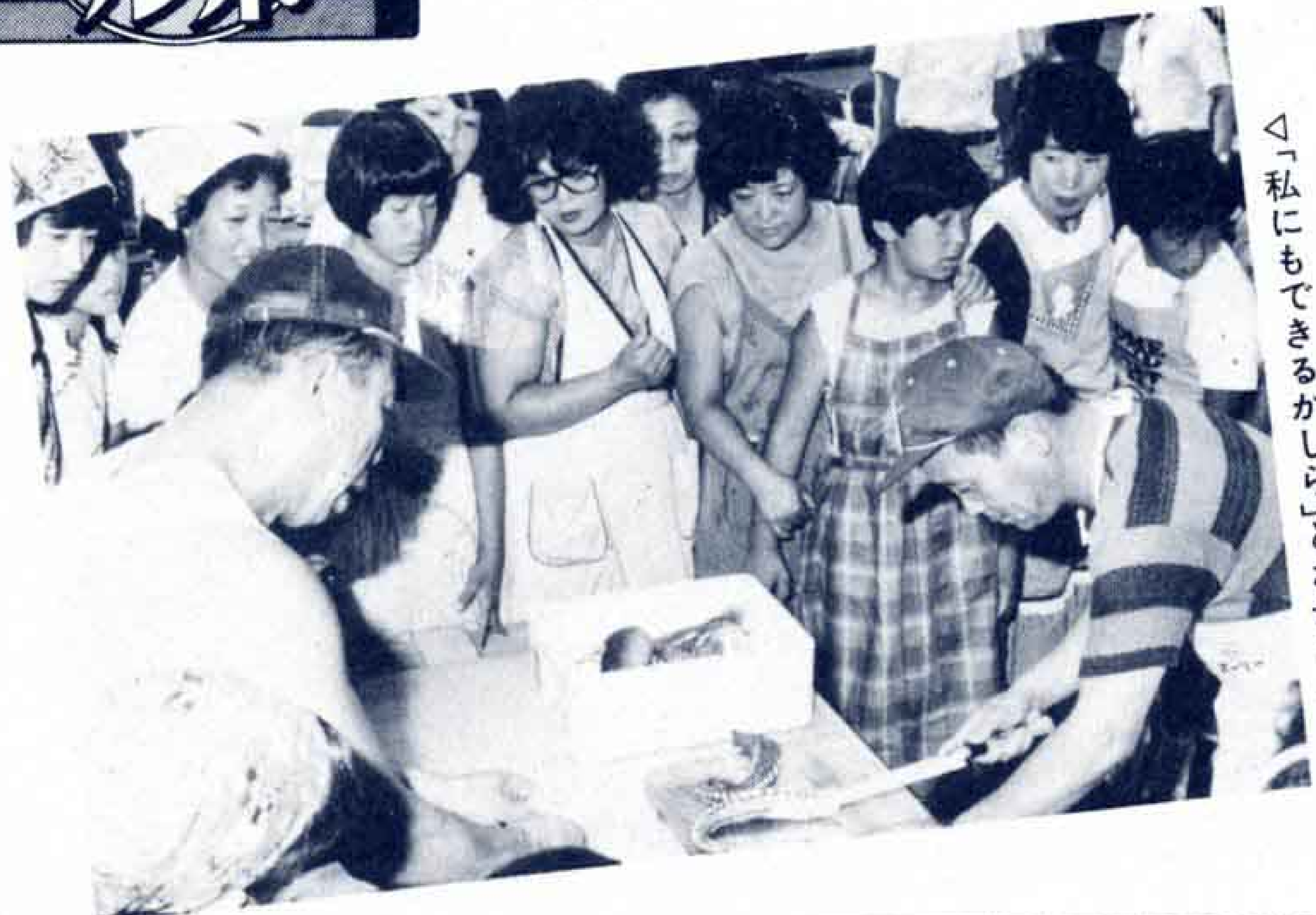
◁「私にもできるかしら」とお母さん

参加した小学校4・5年生とお母さんたちは、マグロ、イカ、タチなどのさばき方を習い、すしだねや刺し身づくりに挑戦しました。