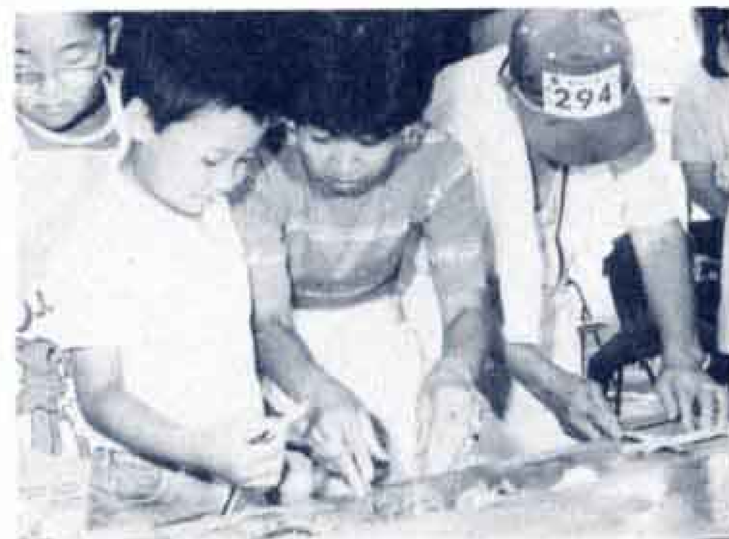
◁ぼくもイワシに挑戦