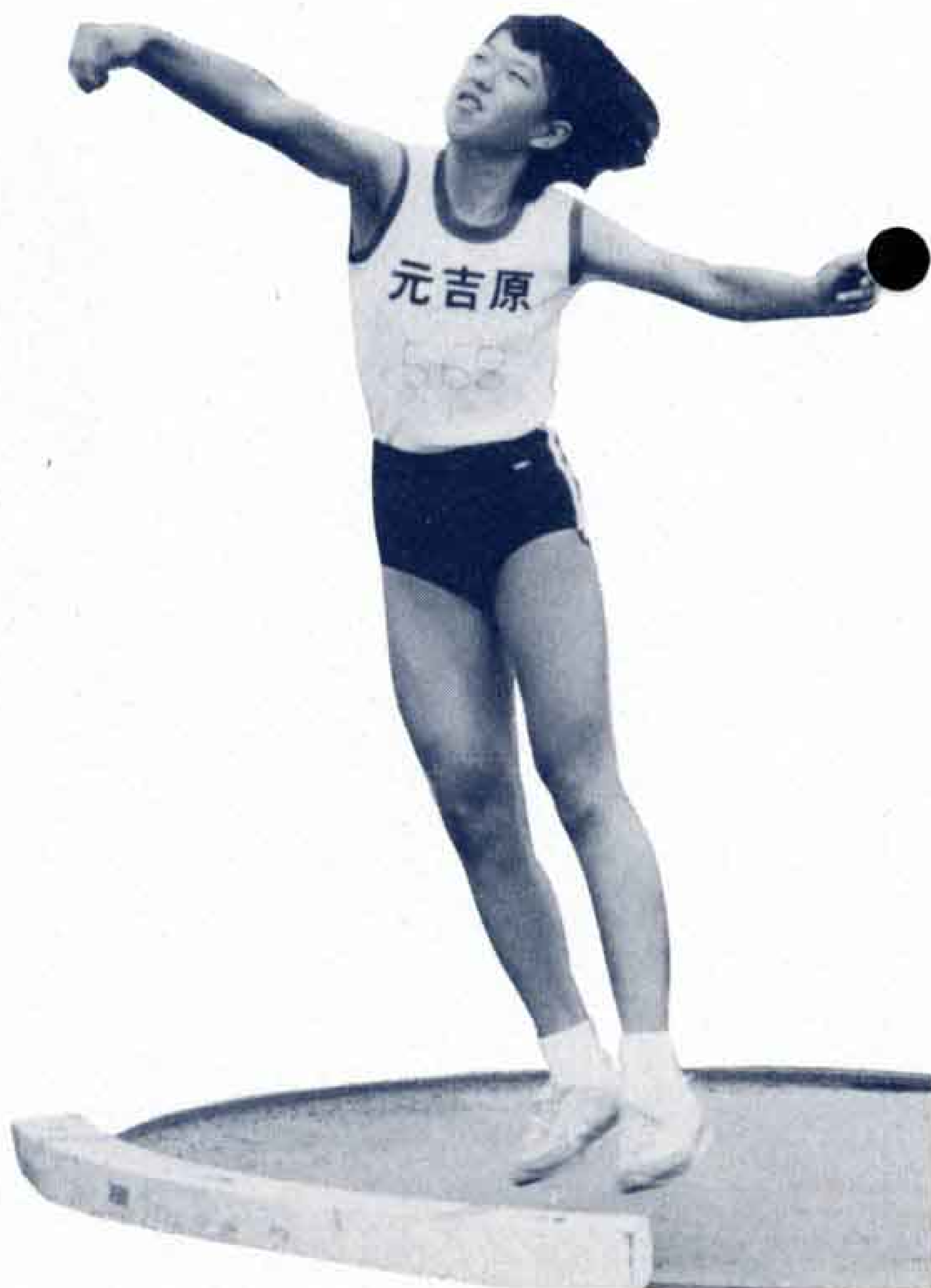
▶集中力が必要な砲丸投げ