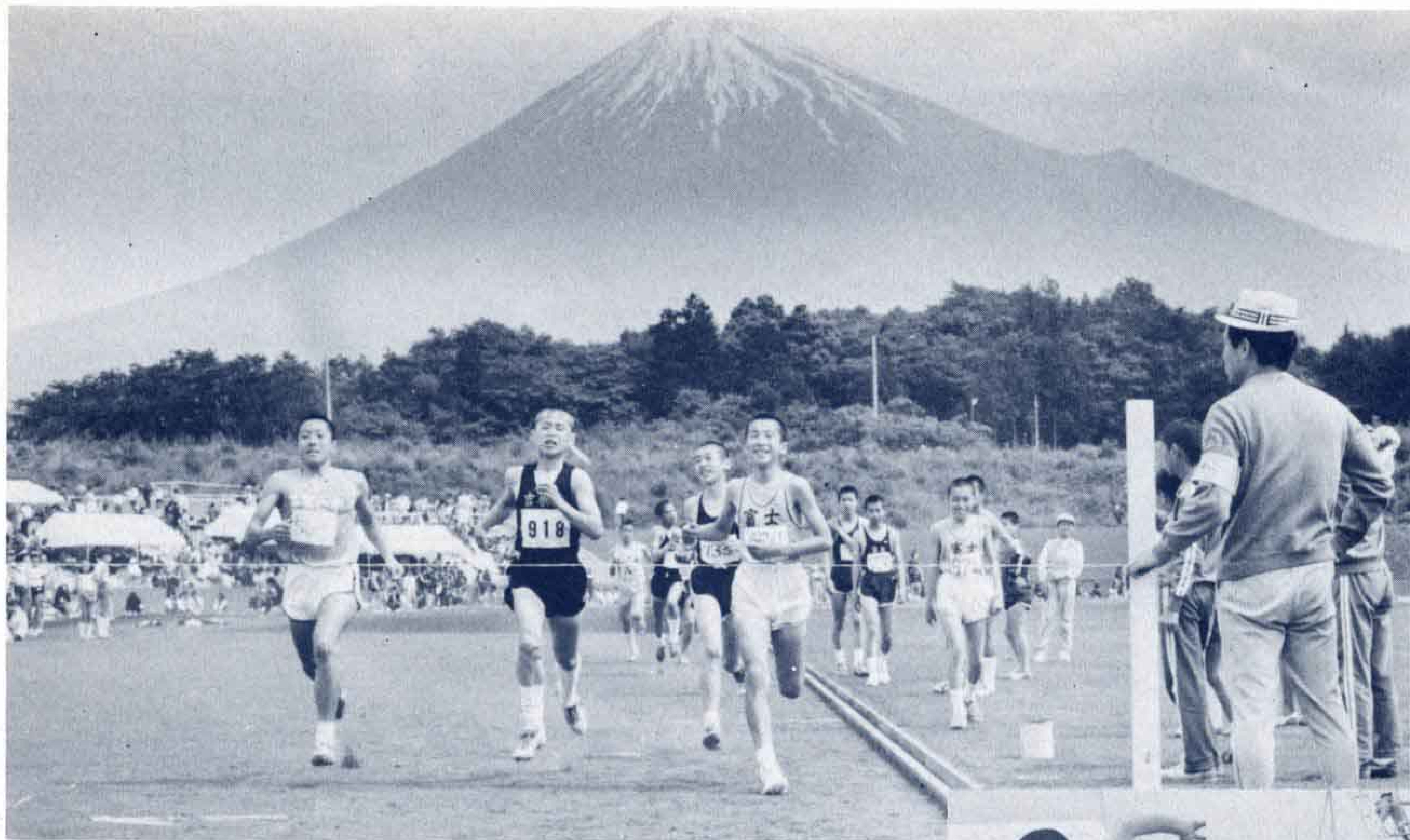
▲富士を背にゴール