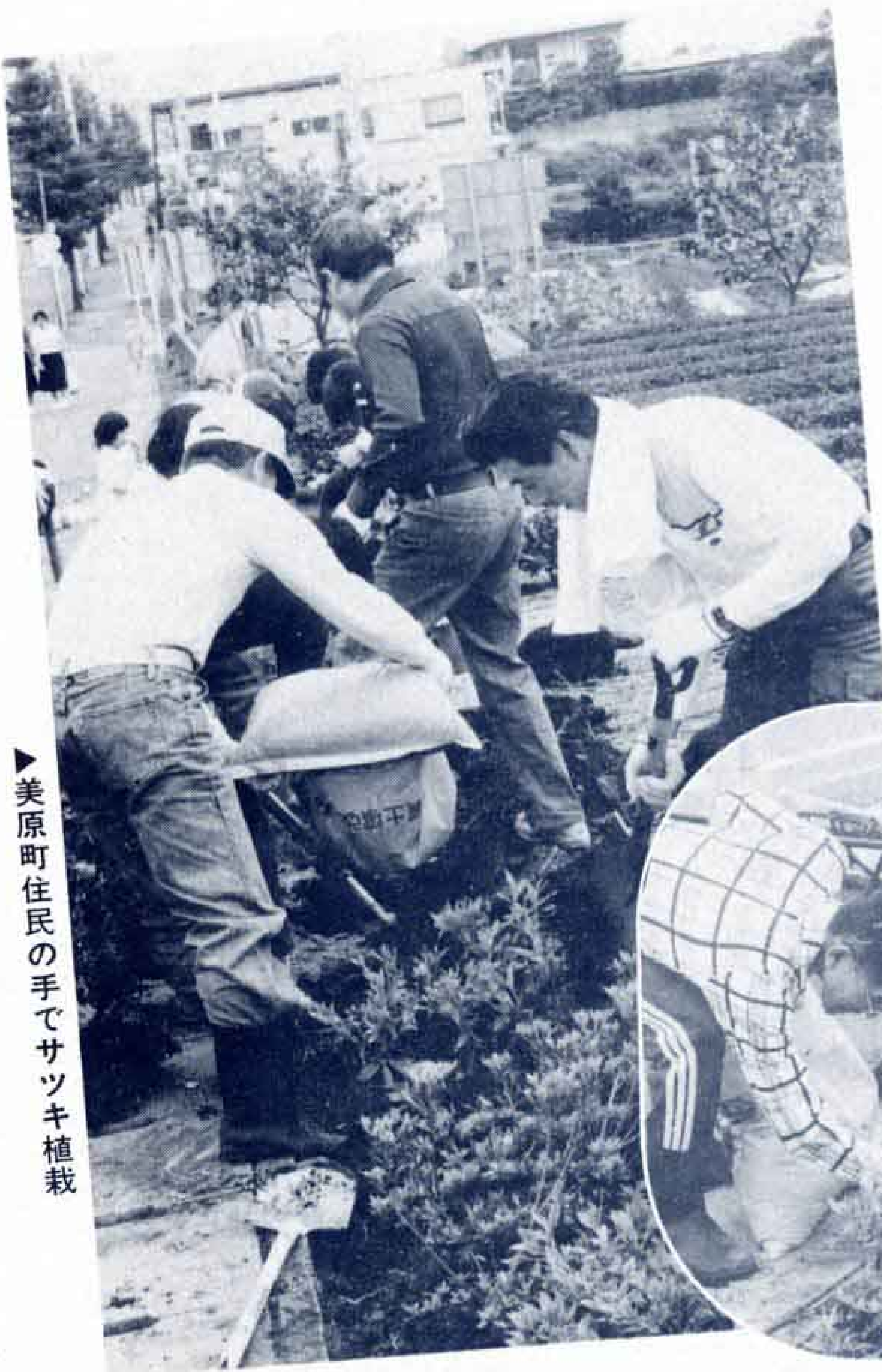
美原町住民の手でサツキ植栽