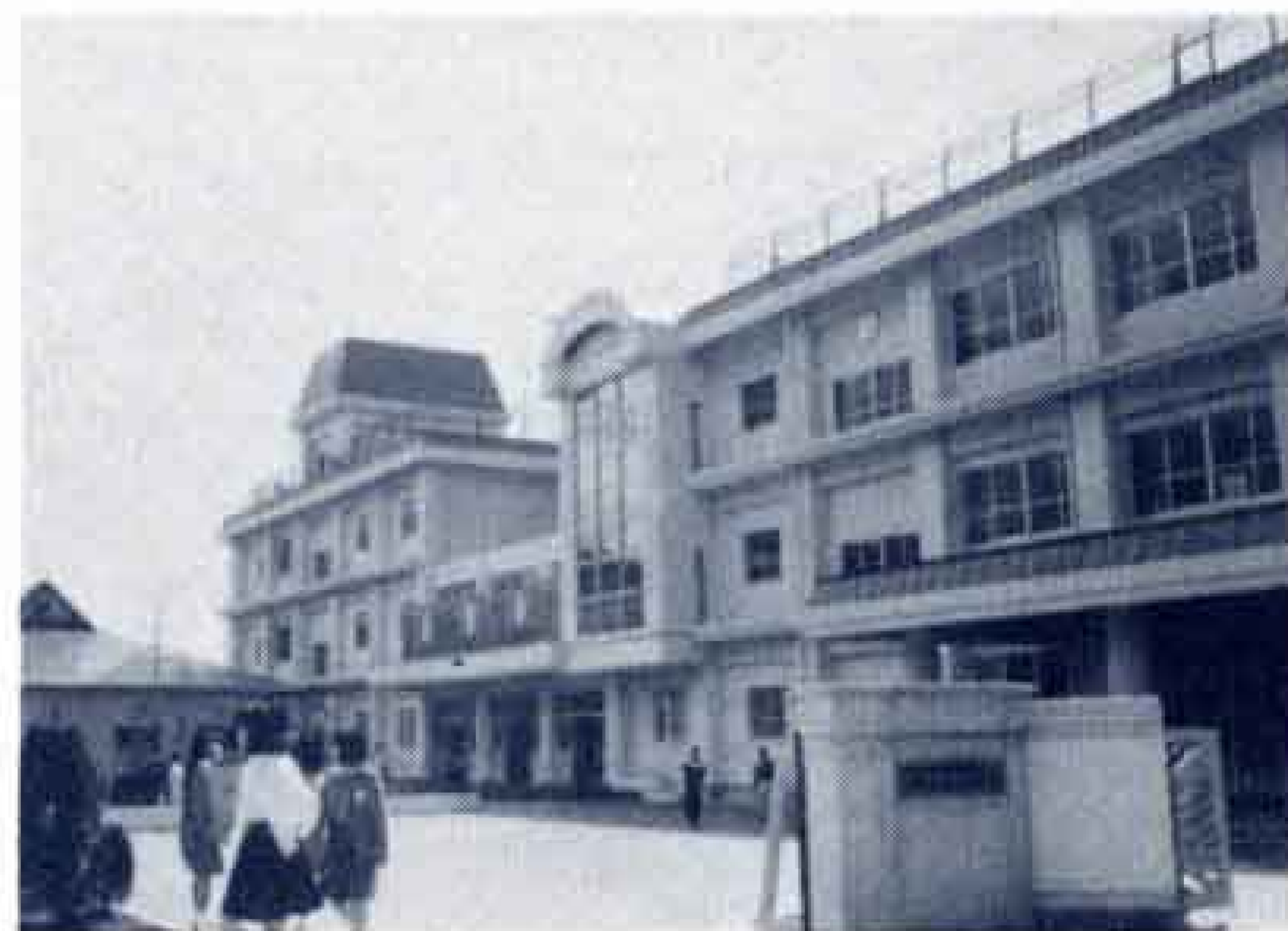
△富士市立神戸小学校

神戸小学校整備事業、岩松小学校、田子浦小学校、富士中学校校舎耐震補強事業及び鷹岡小学校、大淵中学