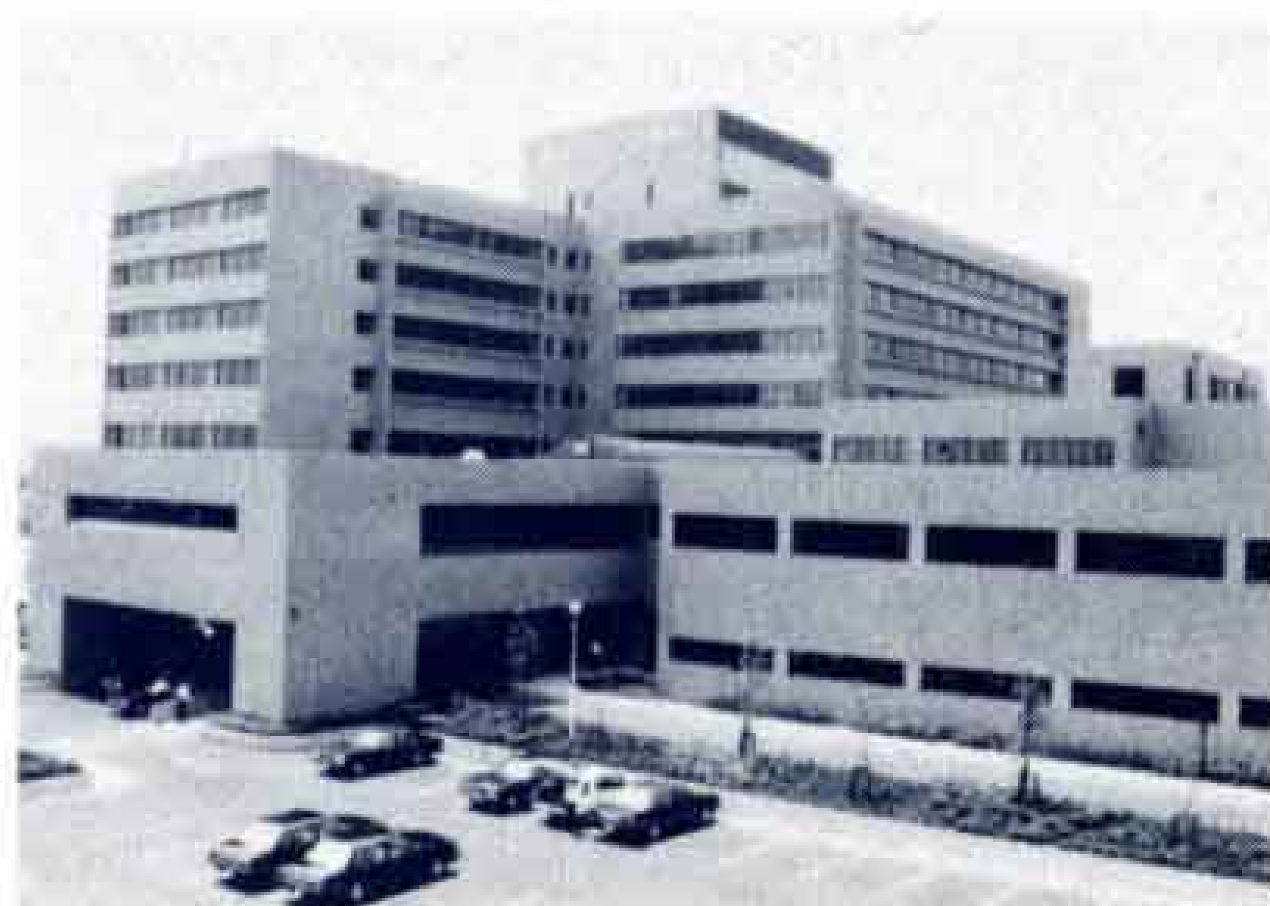
▽富士市立中央病院