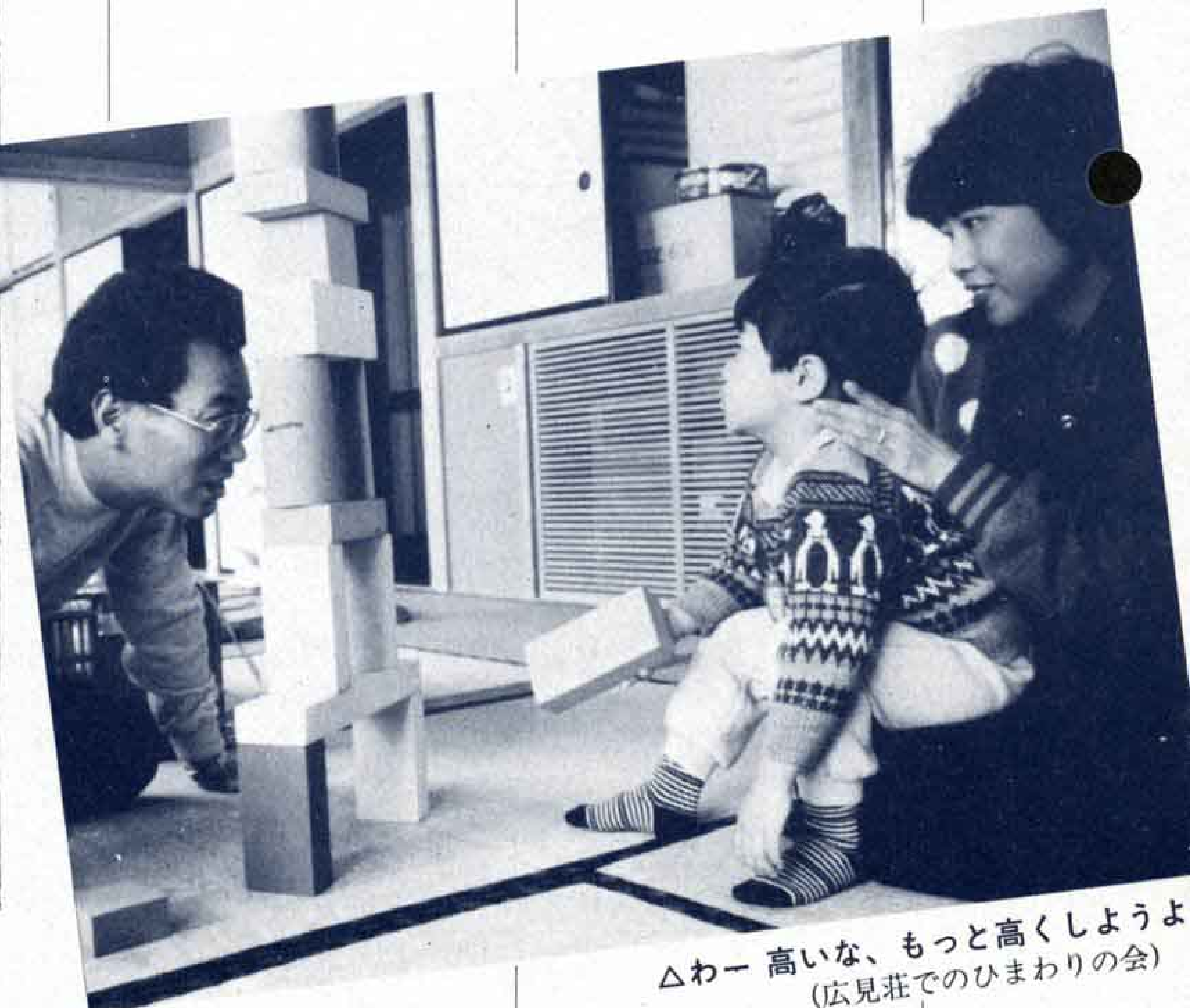
△わー 高いな、もっと高くしようよ (広見荘でのひまわりの会)