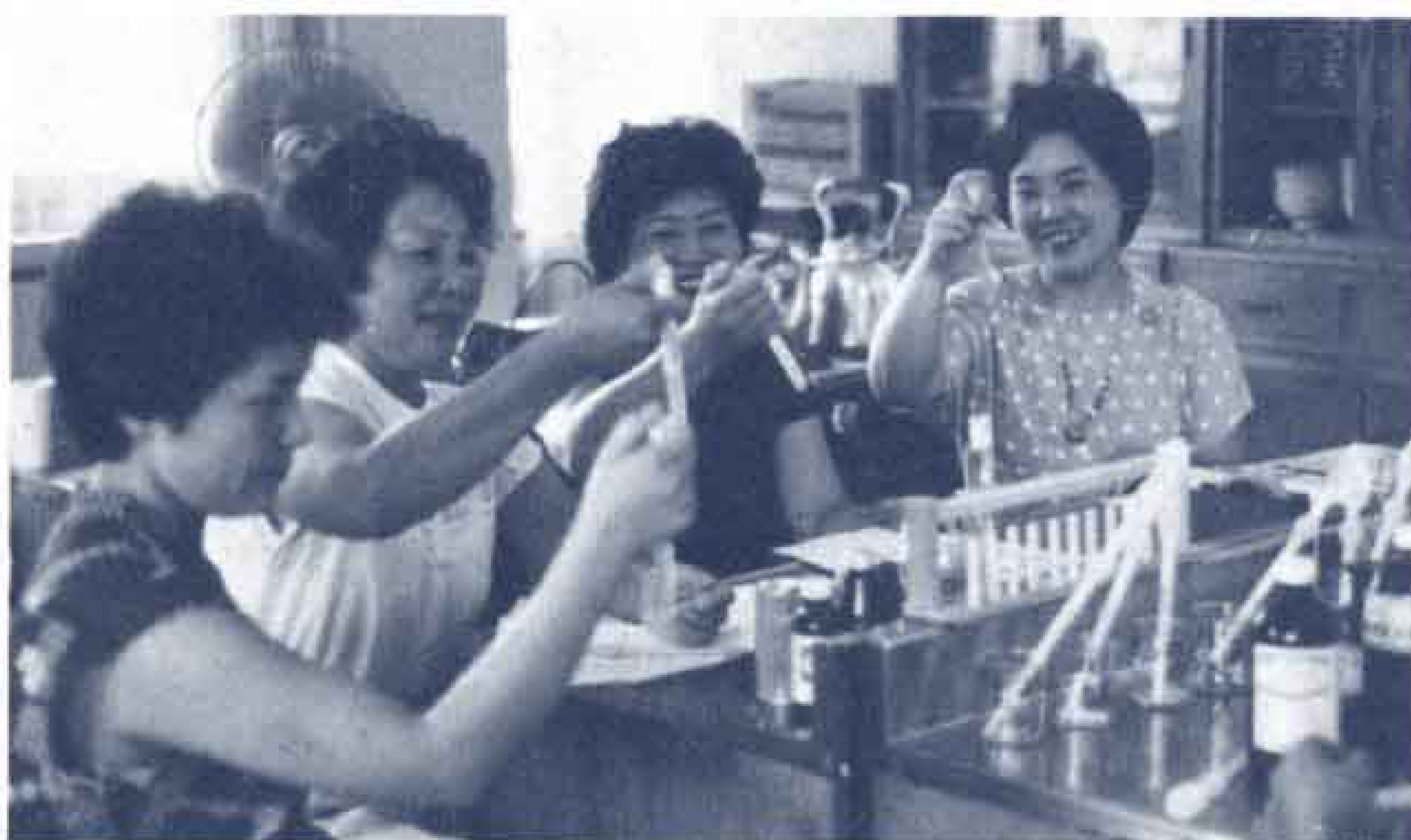
簡単な食品テストの学習会

市は、昭和60年度の消費生活モニターを募集します。日常生活の中で消費生活に深い関心を持ち、積極的に勉強してみたい人など、ふるってご応募ください。モニターには物価調査、試買調査のほか、消費生活の視野を広げるため、市内外の施設見学、消費生活講座、他市との交流などの学習会に参加していただきます。