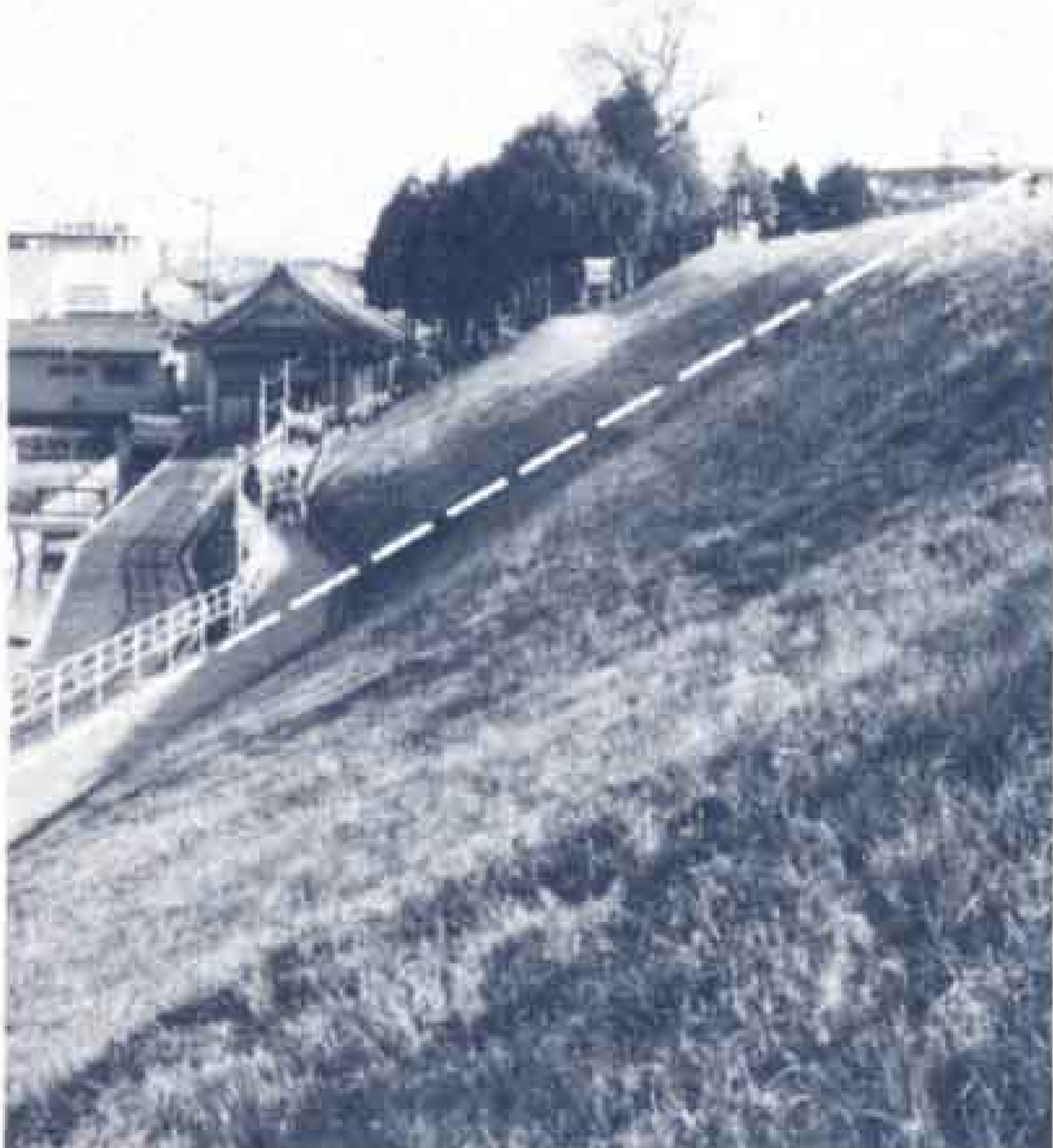
△雁堤の左ずれ 点線は富士川断層の位置