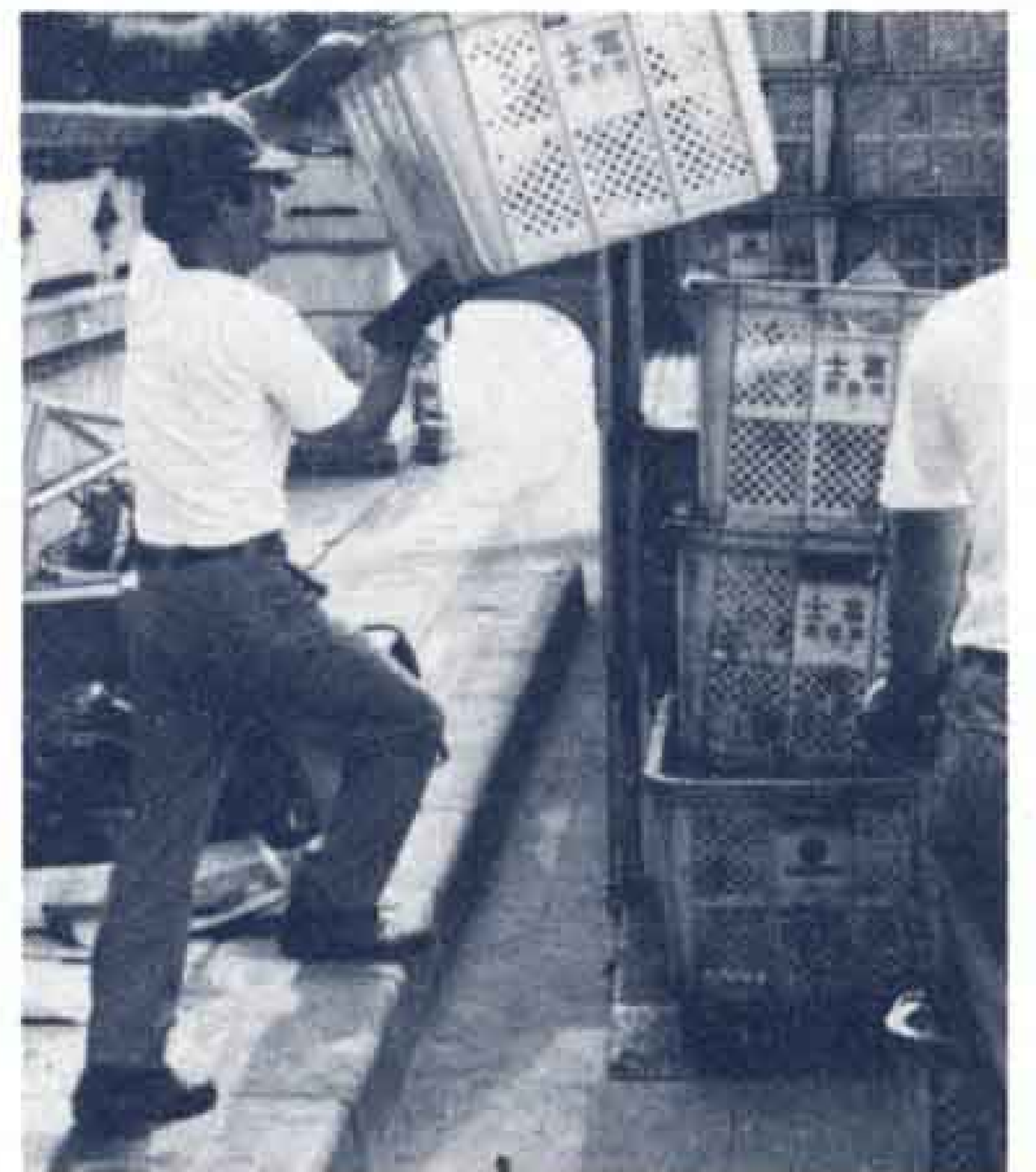
〔資源ごみの収集は月1回です〕

例年、年末には大掃除などのごみが多く出されますが、市で収集するびんやかんの資源ごみは月1回、埋立ごみは月2回の収集回数となっています。