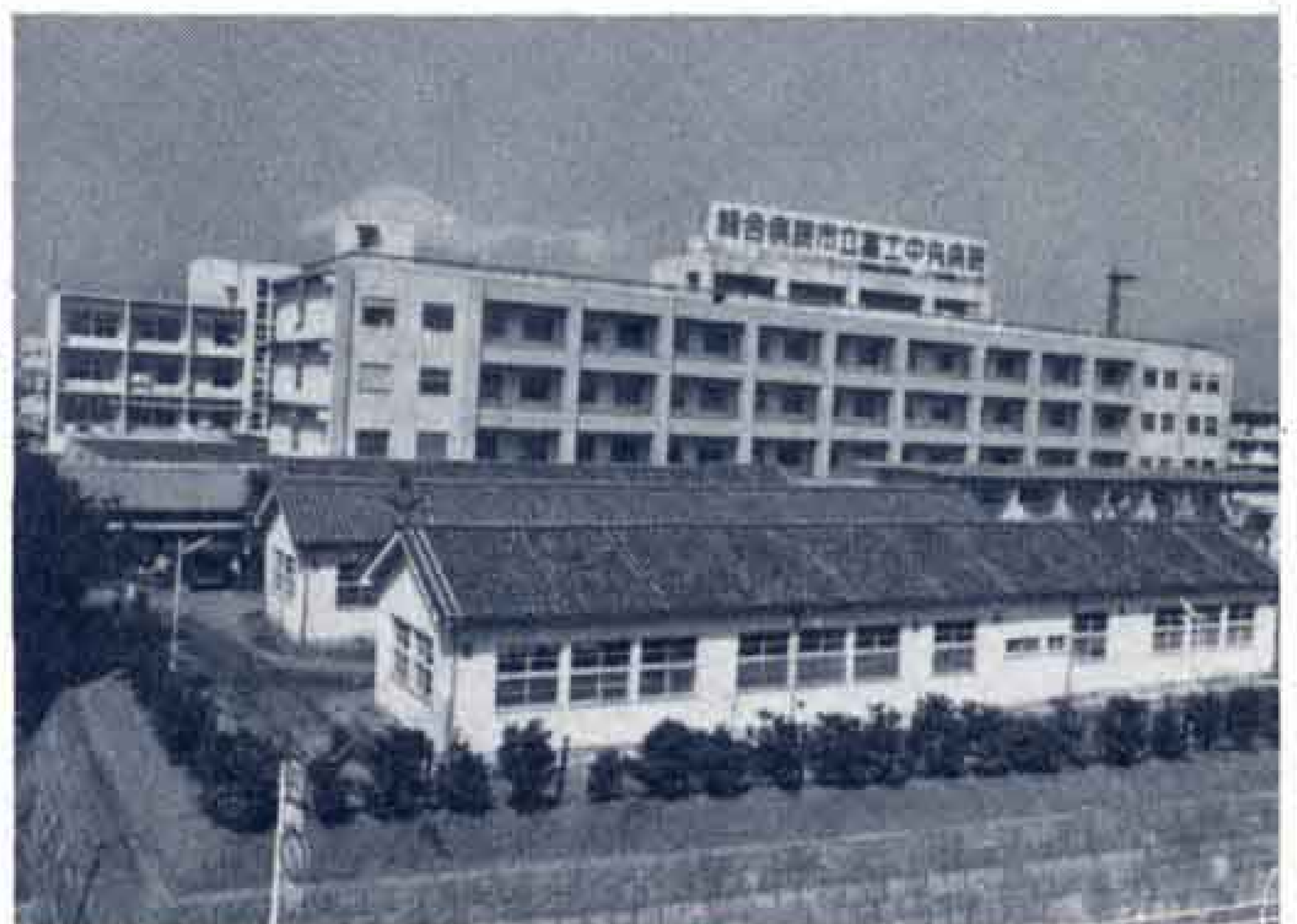
旧中央病院跡地は県の新総合庁舎が

県は、新総合庁舎の建設を昭和60年、61年に予定しています。なお、現在の総合庁舎跡地(4,928平方メートル)は市が買い取ることになりました。