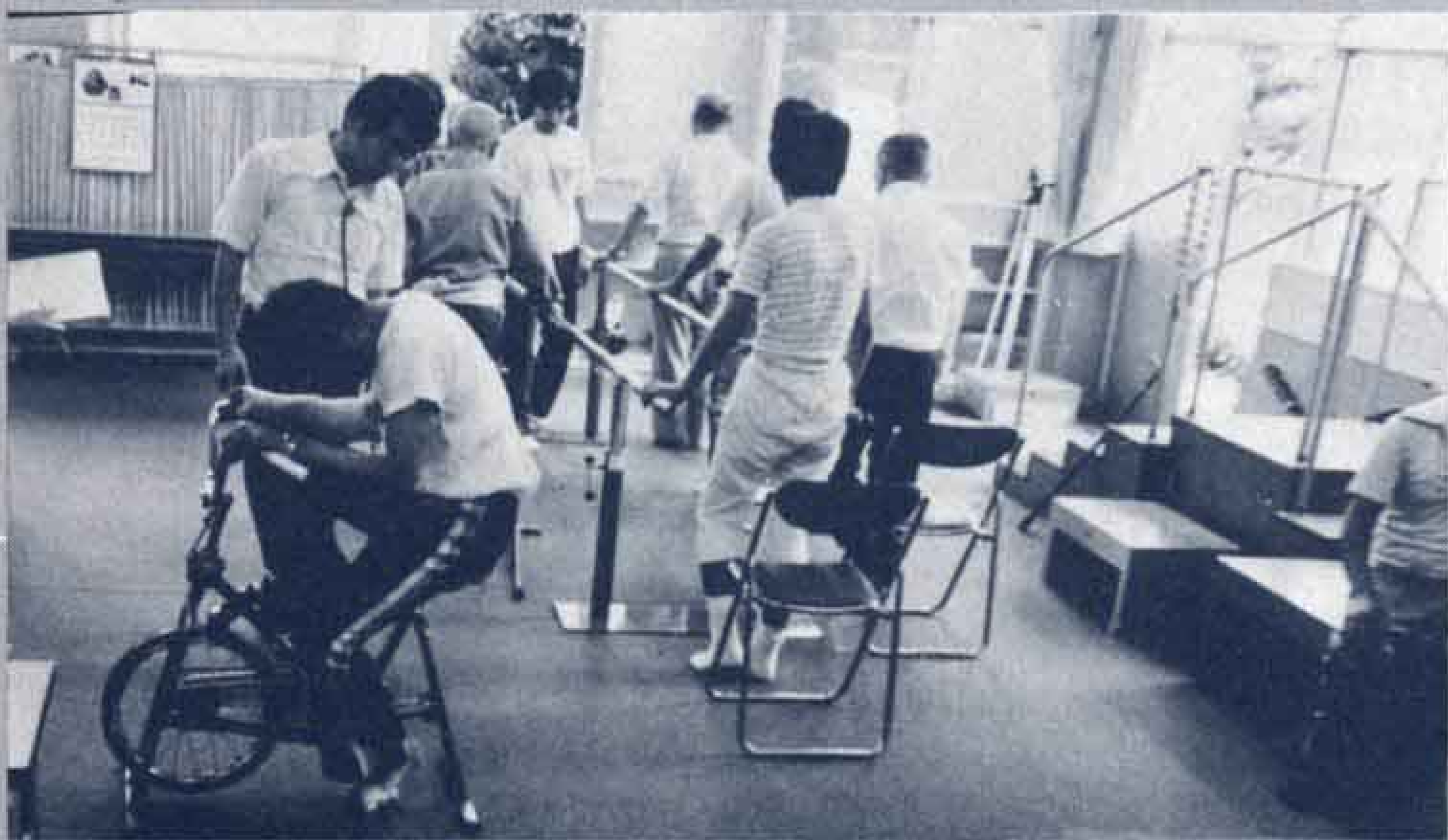
△訓練室には各種の器具を設置