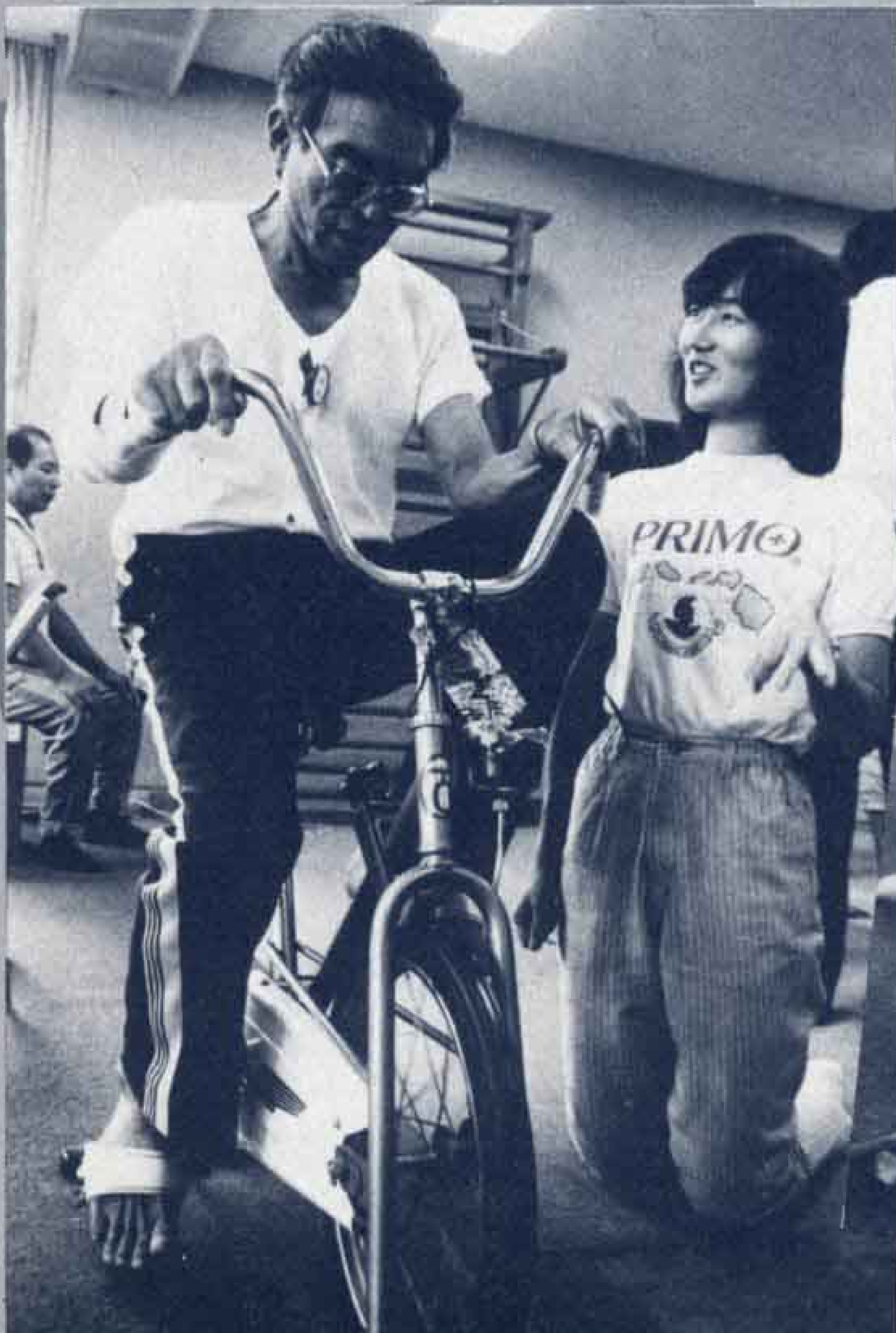
▷固定自転車で足の訓練