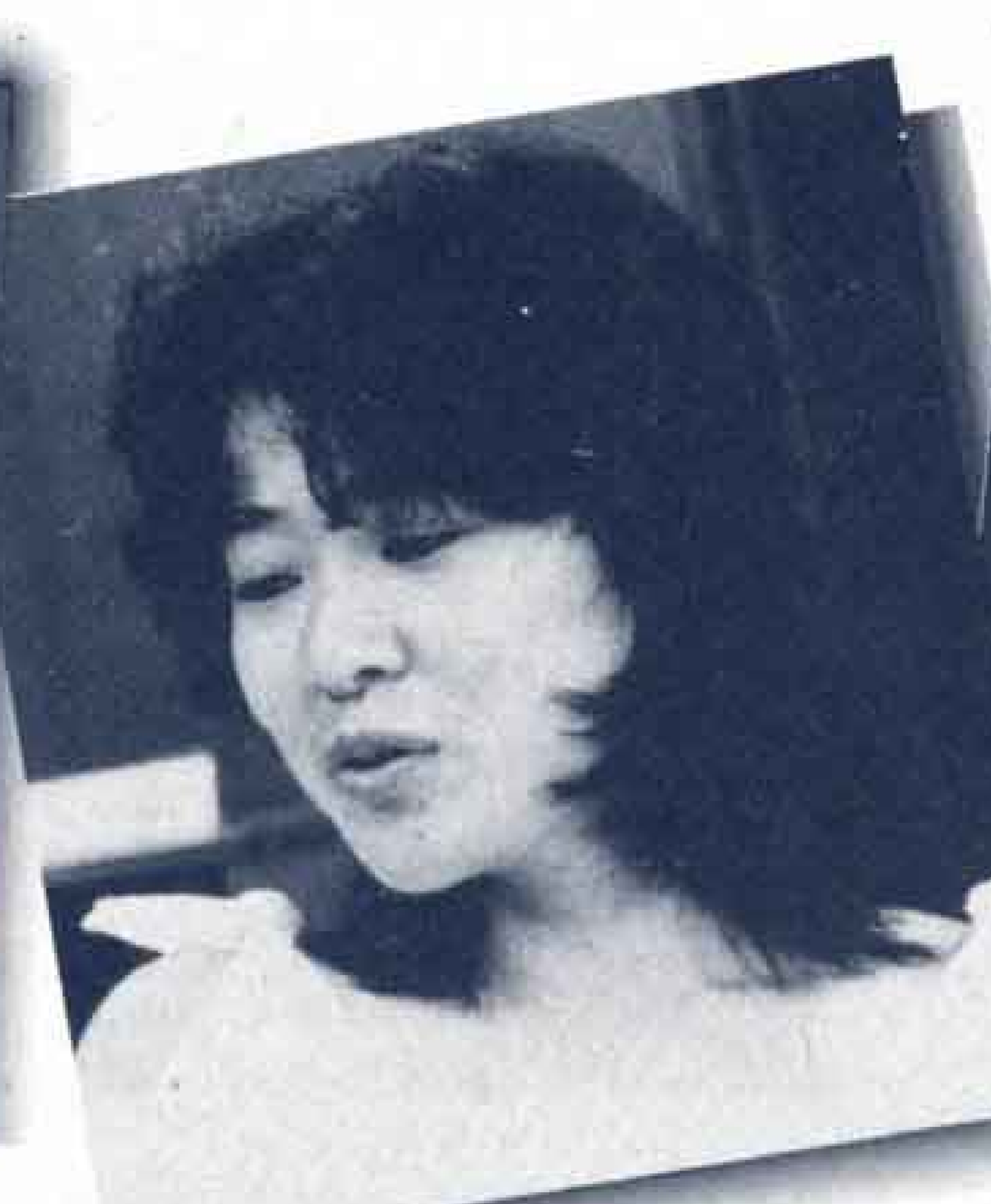
お姉さんの立場の明石さん