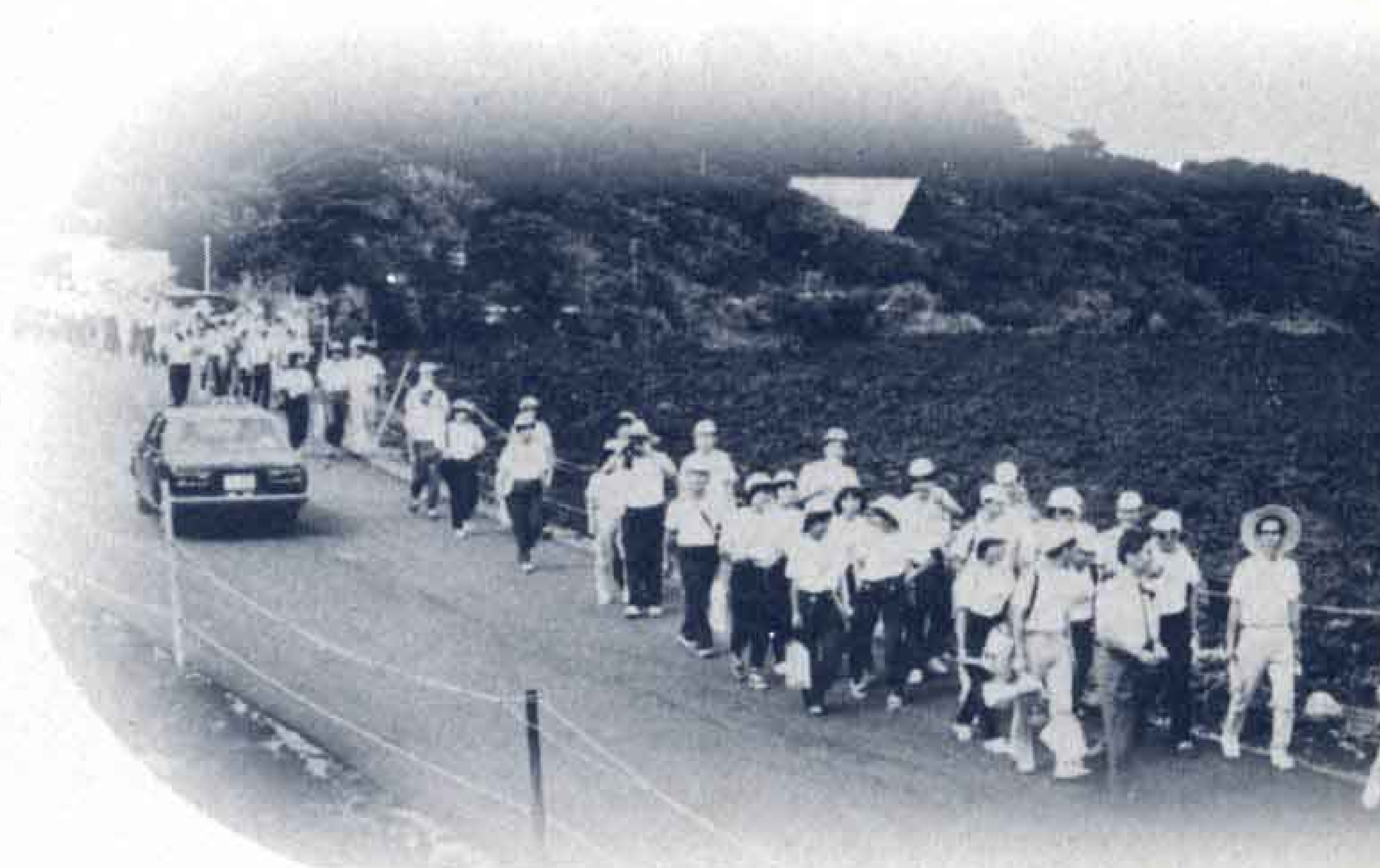
△今年の噴火でまちはこの溶岩の下に