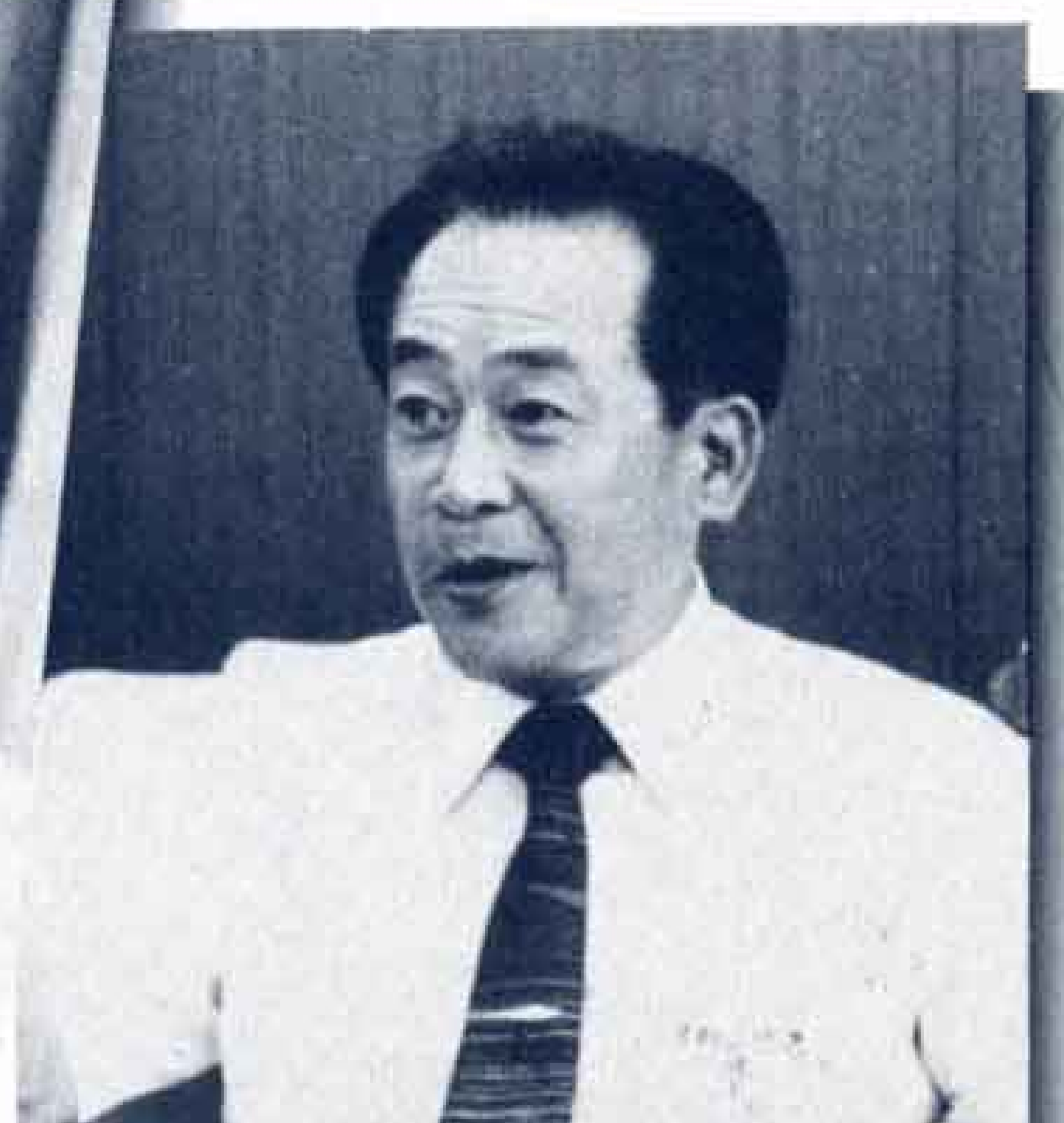
船上での生活は…と広報広聴課長