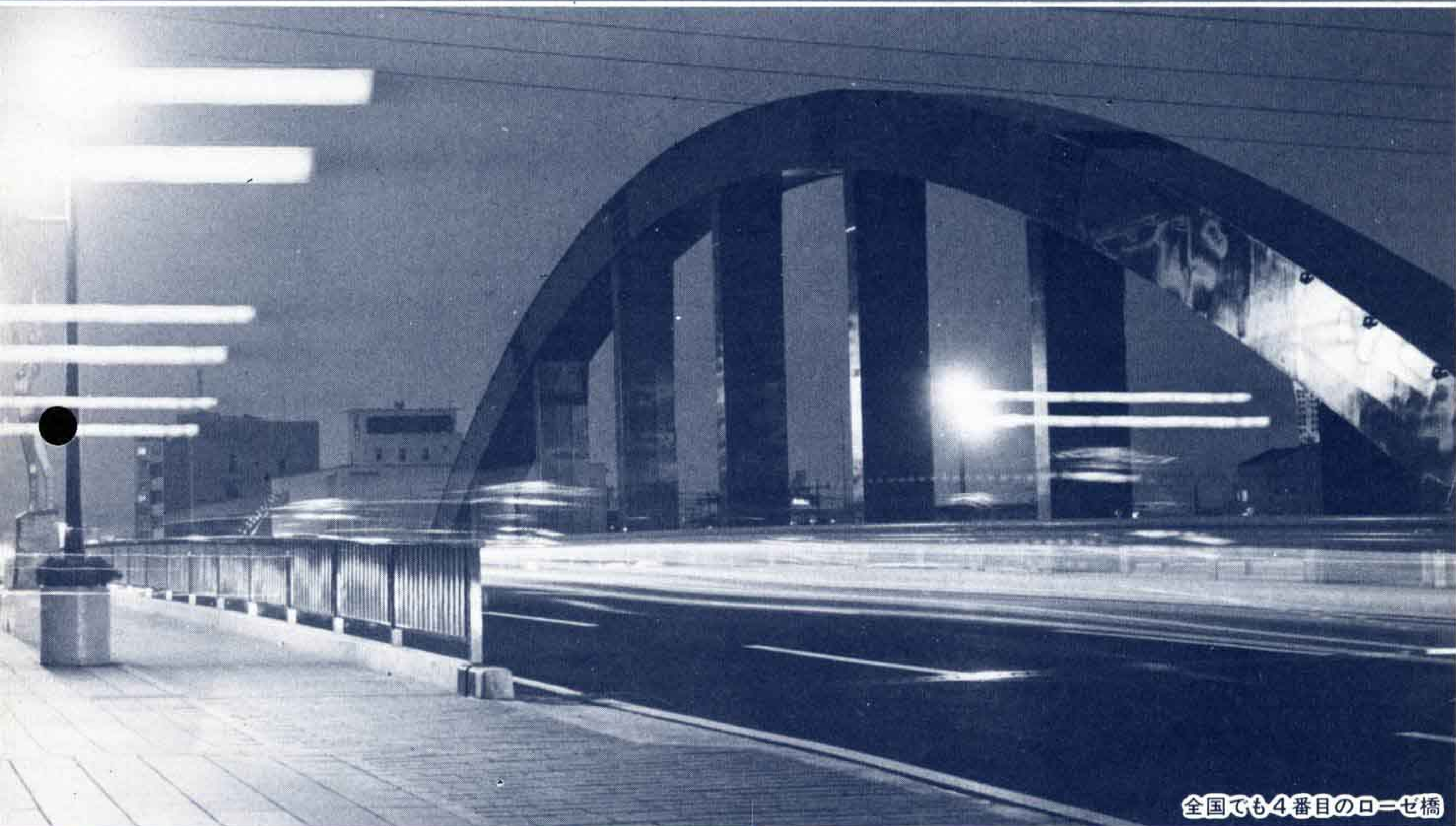
全国でも4番目のローゼ橋