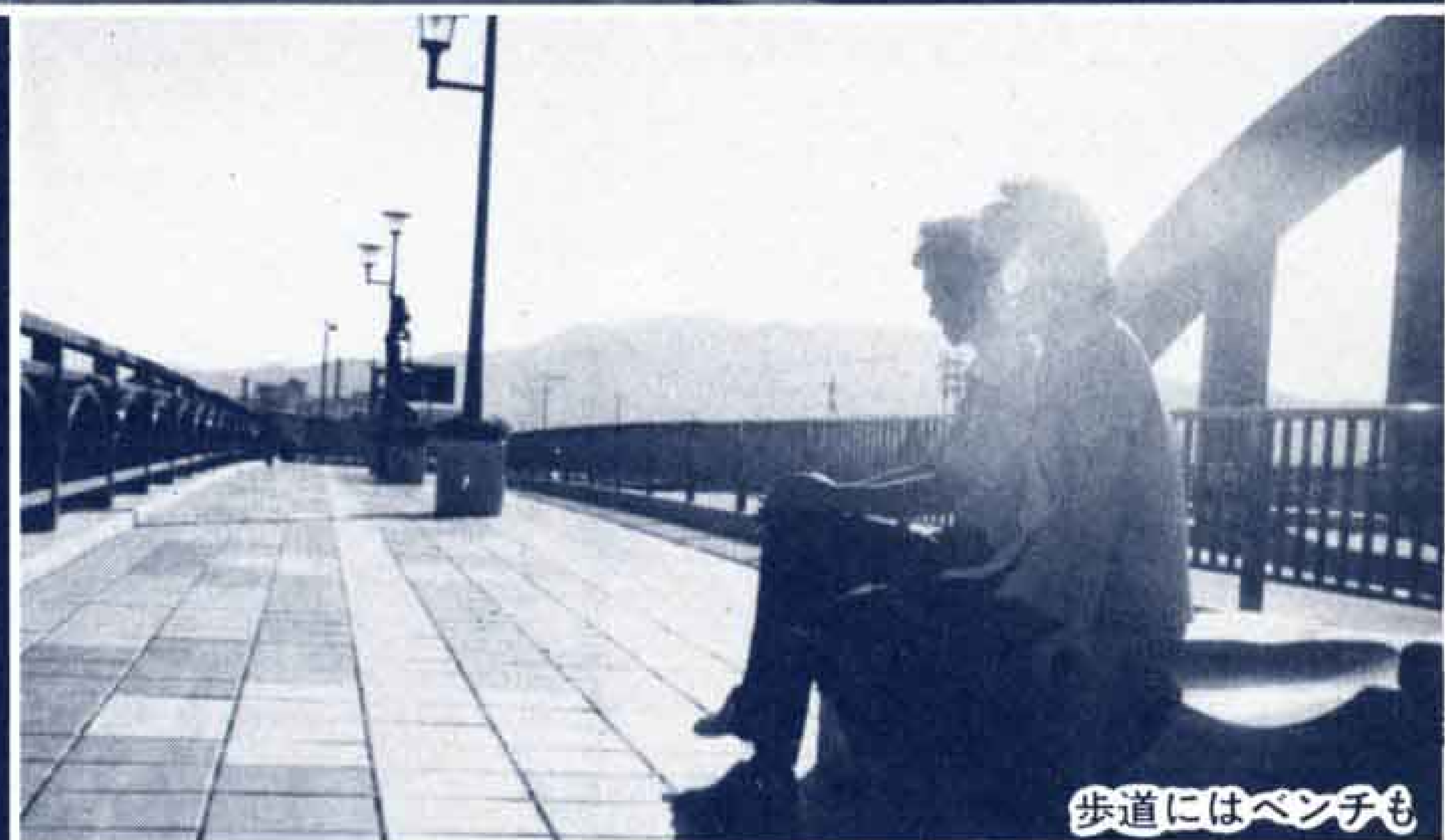
歩道にはベンチも