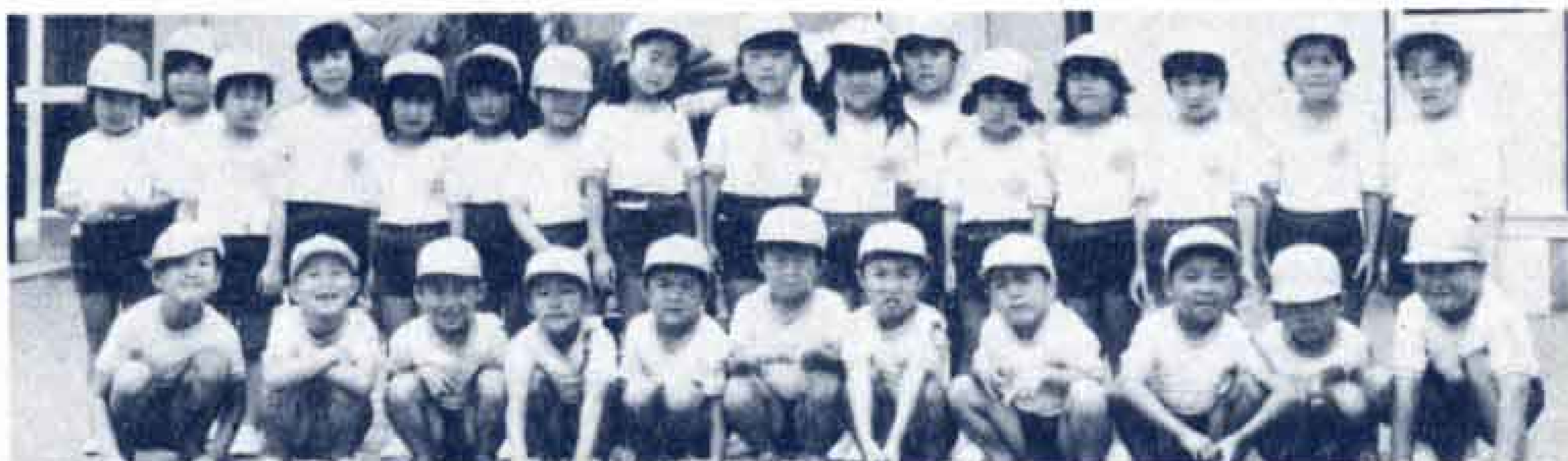
ゆきよし幼稚園のおともだち