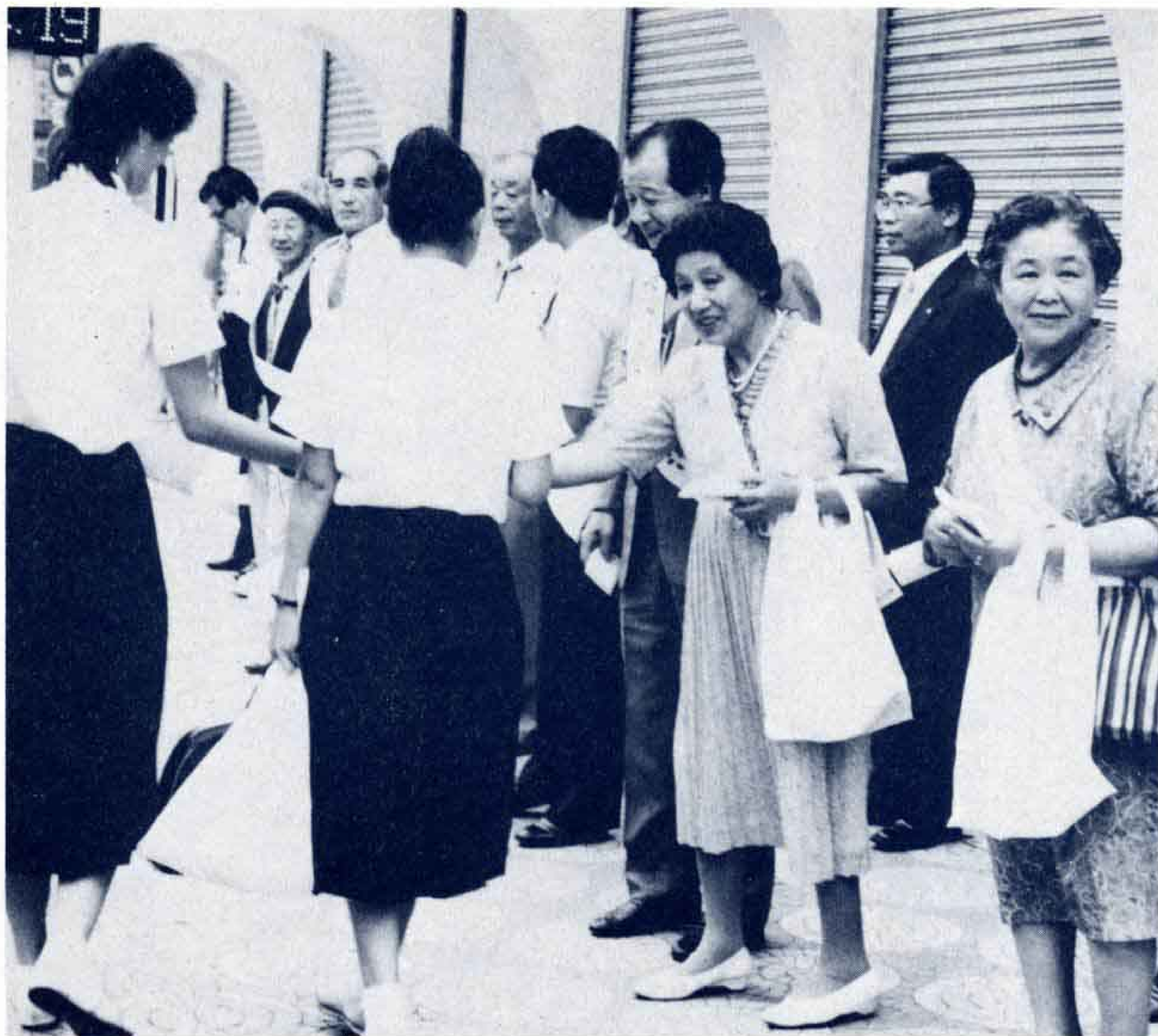
街頭での啓発運動(吉原中央駅付近で)

次代を担う青少年の健全育成をねらいとした「青少年を守り育てる運動」が、7月1日、全国一斉にスタートしました。今回は①青少年の健全意識の高揚 ②幼児・青少年相談所の開設 ③社会環境の浄化の3点に重点を置きます。中でも「幼児・青少年の相談」は、今回初の試みです。これは、従来の非行、登校拒否問題から、育児、家庭教育、しつけまで幅広く相談内容を広げたもので、7月31日までの期間中、市庁舎西側の青少年相談所で受け付けます。