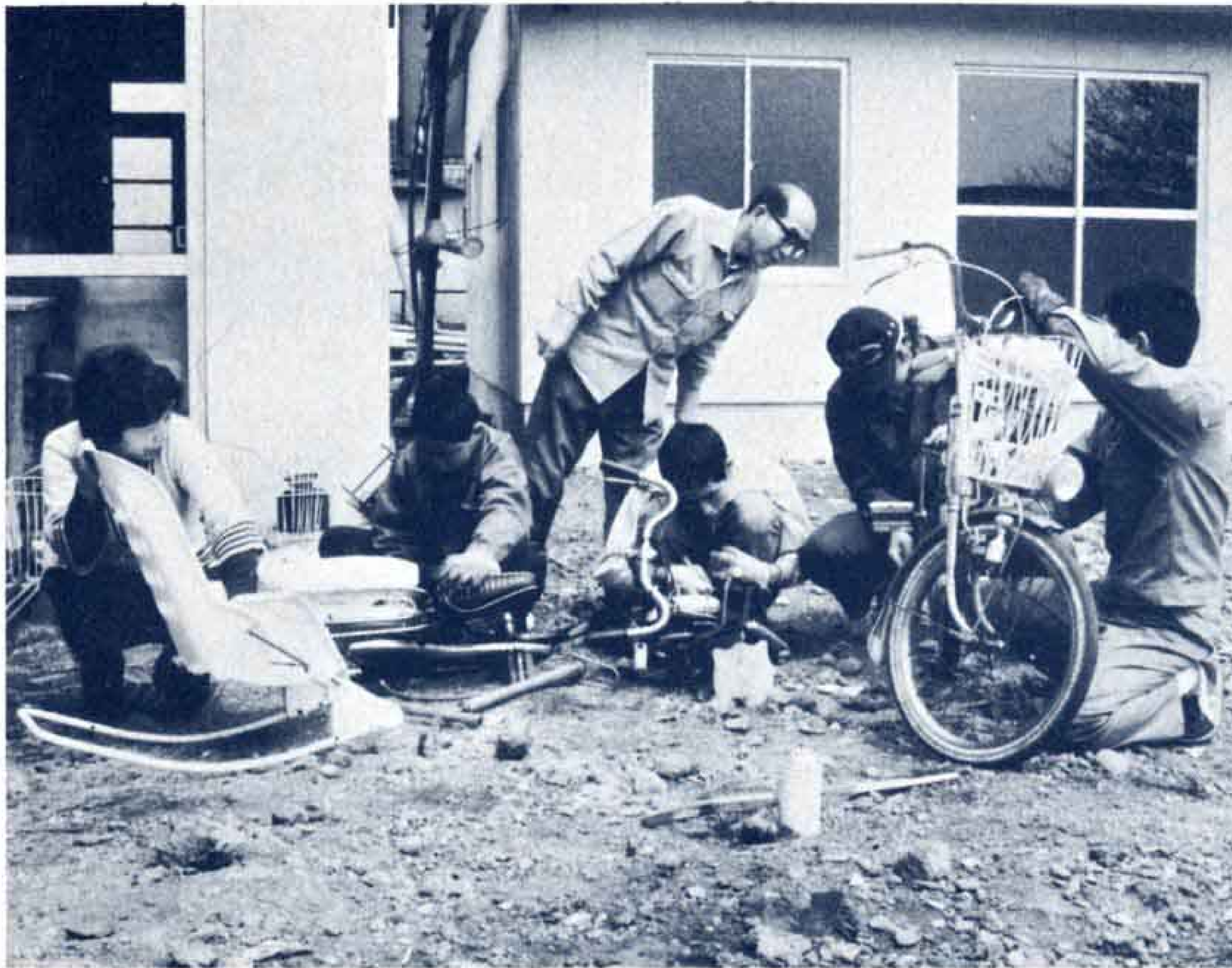
▲きょうは自転車をみがいて整備しています きれいになりますよ