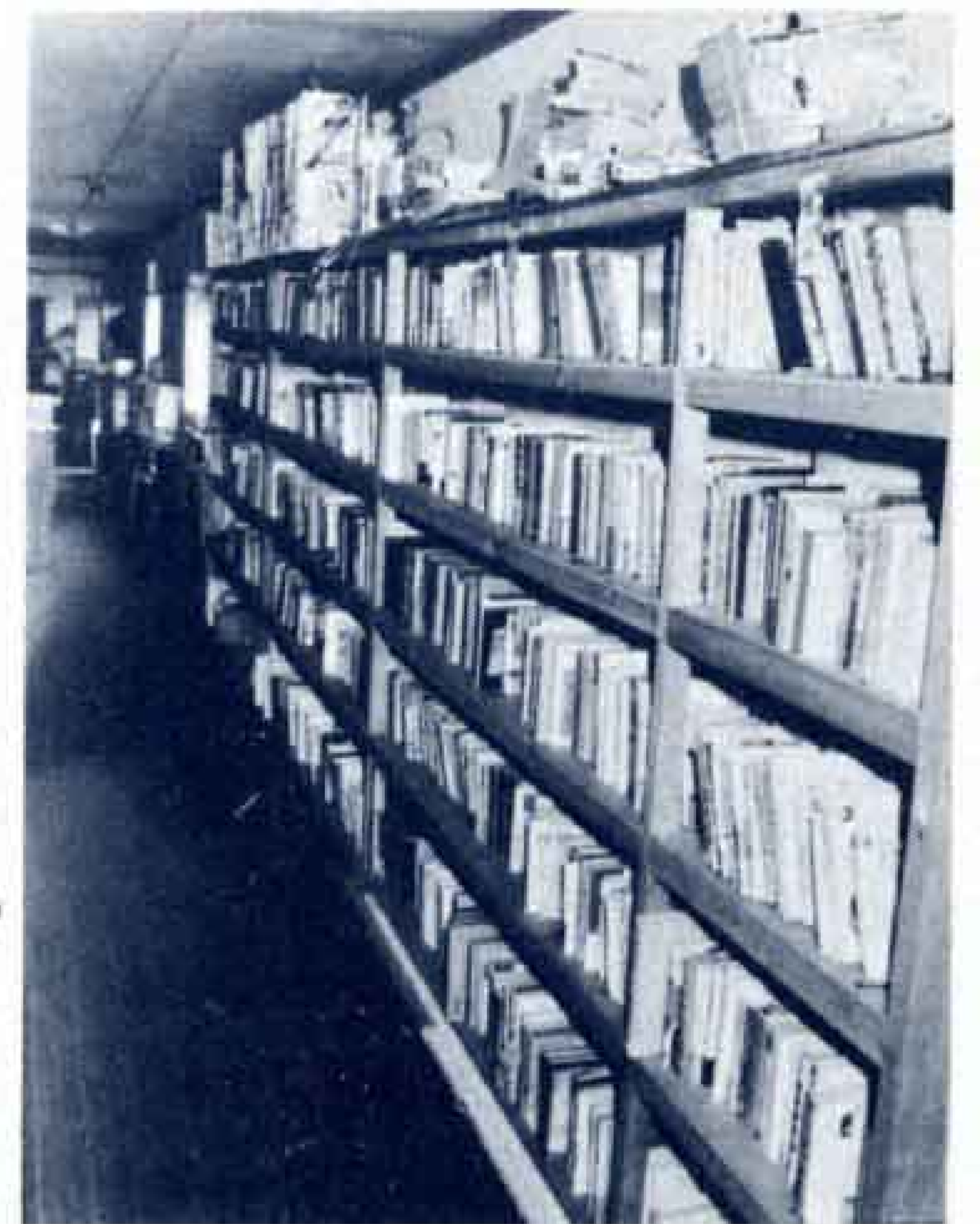
▲古本もいっぱいあります