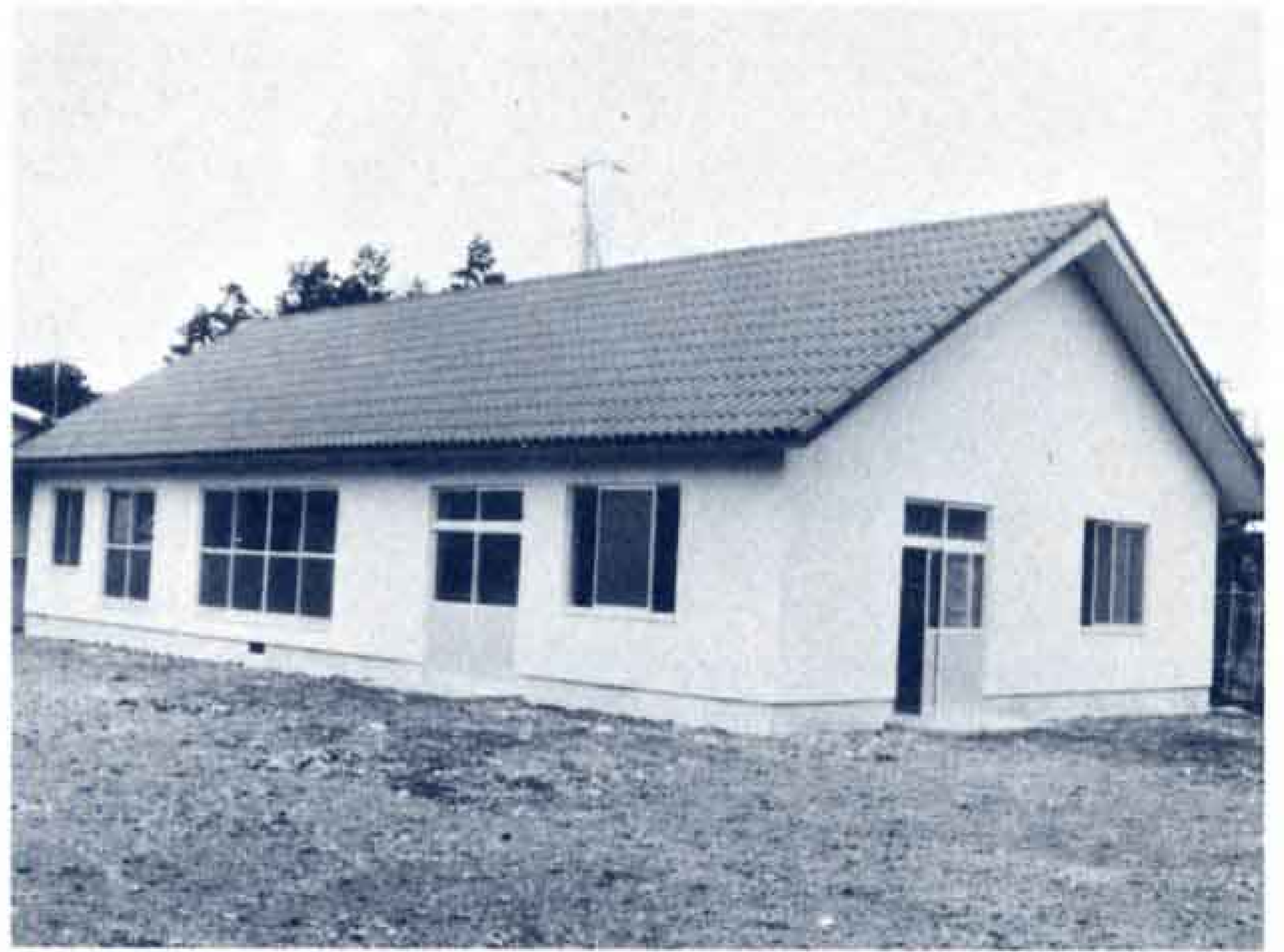
▲4月15日完成した新作業棟