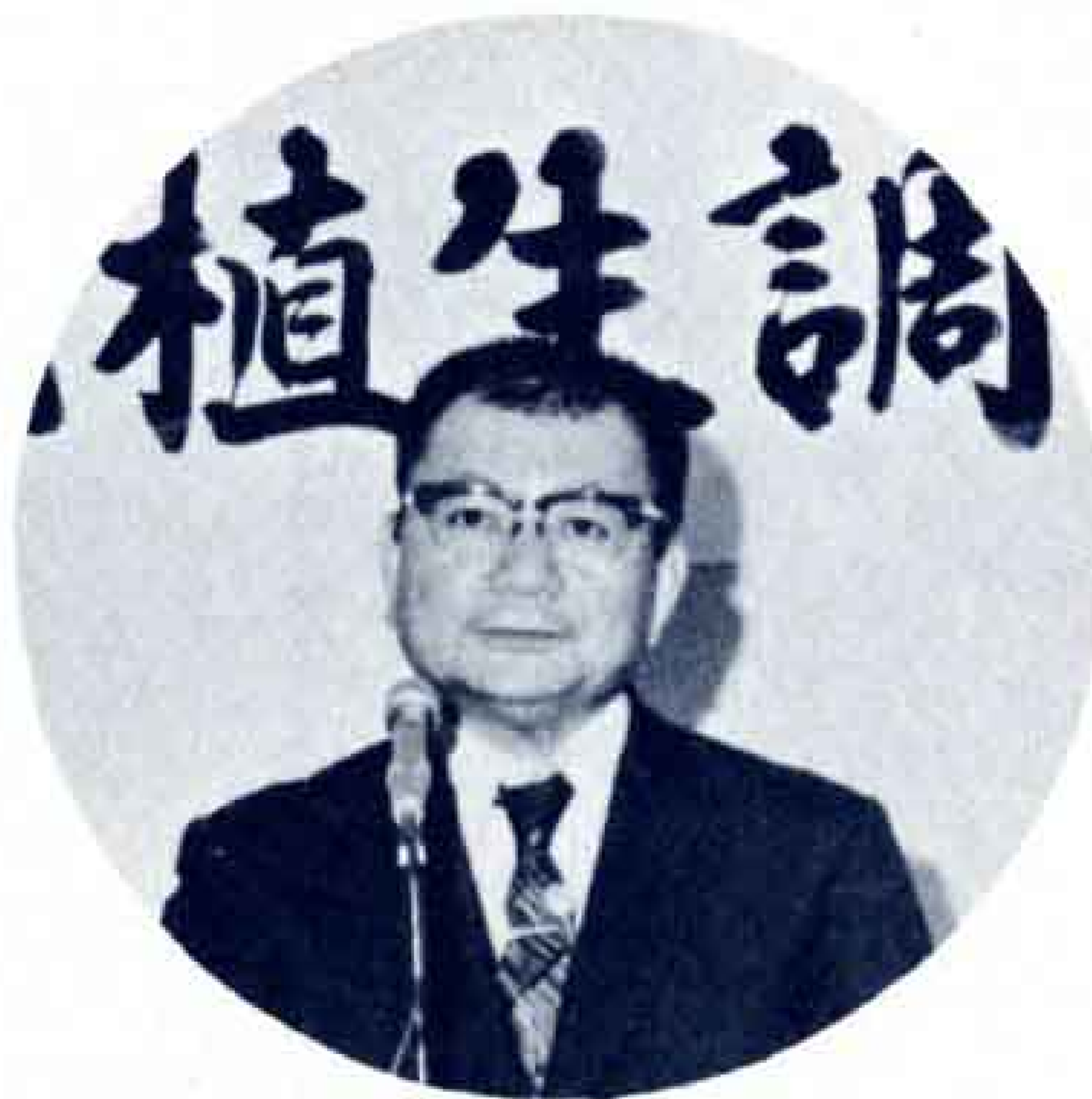
昨年の9月には宮脇先生 によって中間報告が――

そこで、市民のみなさんに富士市の自然や緑がどのような状況にあるか、又、これからの緑と私たち人間との関わりはどうあるべきかを考えていただくため、報告会を開催しますのでご参加ください。